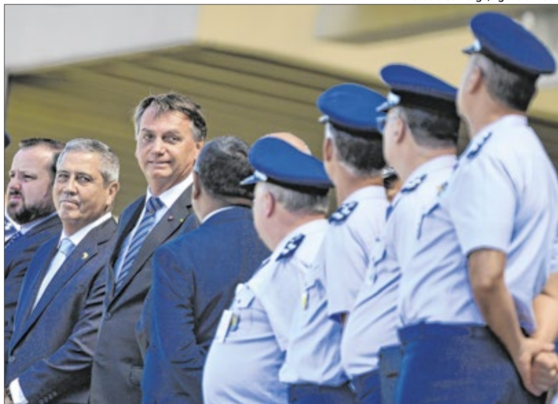
Bolsonaro e Braga Netto: o comando do golpe, segundo Gonet

O general é considerado como principal elo junto aos