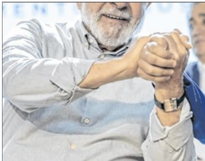
Lula com o relógio Cartier Santos que ganhou