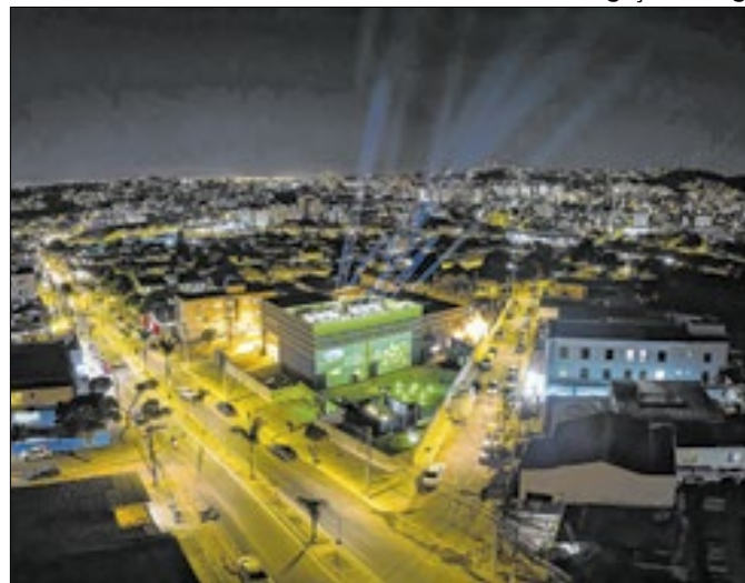
Cemig inaugurou 31 subestações e ampliou capacidade