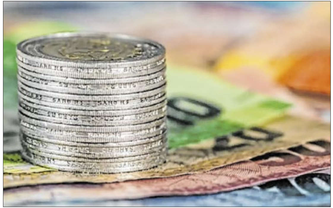
Sinais de desaceleração da economia se acentuam, desde o final do ano passado

Mais adiante, o documento da instituição financeira acentua: "Primeiro, a contribuição positiva das safras de grãos de verão deverá impulsionar a