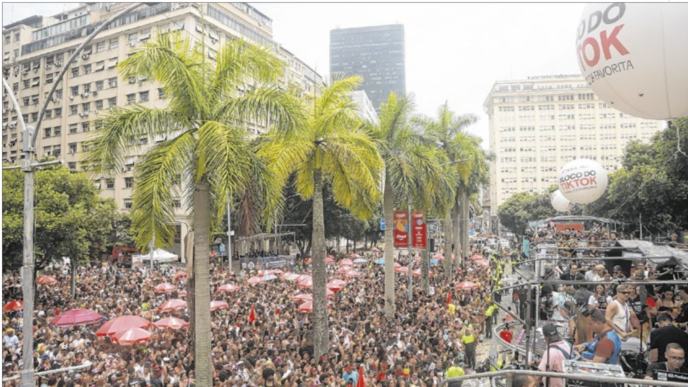
Bloco da Favorita, no Circuito Mega Bloco, deve arrastar multidão neste sábado de pré-carnaval, no Centro do Rio