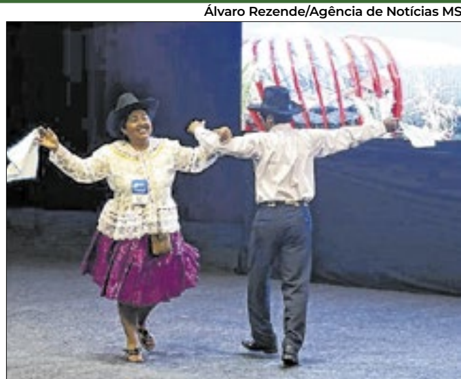
Governadores firmam acordo para integração regional

Ação do procurador trata de omissões na Segurança no 8/01