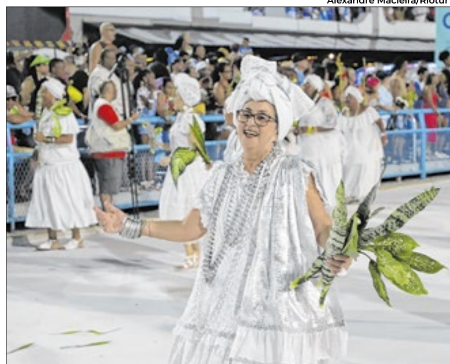
Tradicional Lavagem da Sapucaí acontece neste domingo

Tuiuti. No sábado (22), atravessam a Passarela do Samba a Beija Flor de Nilópolis; Mangueira; Vila Isabel; e Portela. Já no Domingo, após a lavagem, Salgueiro; Grande Rio; Imperatriz Leopoldinense; e Viradouro finalizam os ensaios técnicos deste ano.