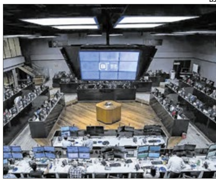
No período de um ano, o número de investidores cresceu 6%

Renda fixa e poupança Na renda fixa, o destaque