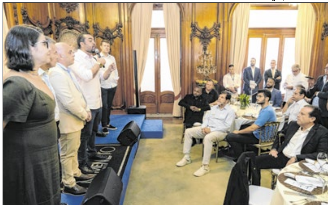
Verba destinada às escolas terá previsão no orçamento oficial do Estado

O governador Cláudio Castro anunciou, na quarta-feira (19) que, a partir de 2026, o financiamento do Carnaval será realizado diretamente pelo Estado, com previsão no orçamento oficial, e a verba destinada às escolas será paga em duas parcelas. A mudança visa garantir maior estabilidade e segurança financeira para o evento. Até então, os recursos eram disponibilizados por meio da Lei de Incentivo à Cultura.