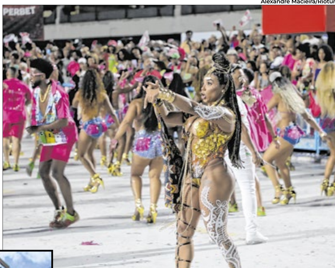
Último fim de semana de ensaios técnicos promete levantar a Sapucaí

Nesta sexta-feira (21), ensaiam a Unidos de Padre Miguel; Unidos da Tijuca; Mocidade Independente de Padre Miguel; e Paraíso do