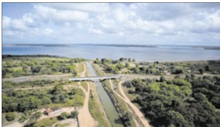
Os investimentos em 2024 somaram R$ 3,89 bilhões