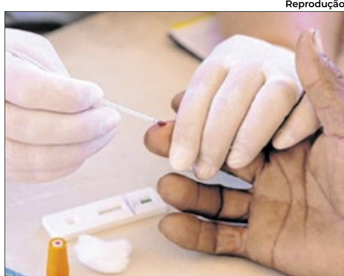
Testes rápidos são apresentados como solução