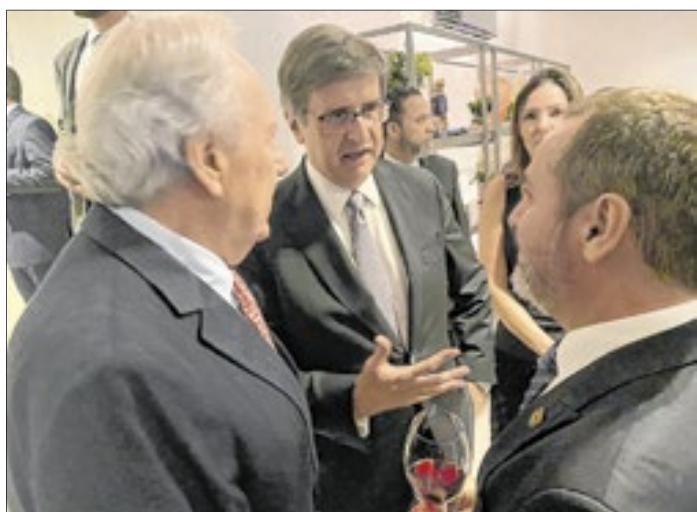
Encontro entre o ministro da Justiça, Ricardo Lewandowski (e); o procurador-geral da República, Paulo Gonet; e o diretor-geral da PF, Andrei Rodrigues (d)

Foi um sucesso o evento do grupo Esfera Brasil, inaugurando, na noite desta quarta-feira (19), em Brasília, o ParlaMento, um espaço de articulação política e institucional. O novo 'braço' do grupo promoverá encontros, em que serão debatidos temas relevantes para o país, com a presença de parlamentares, de membros das comissões, de organizações empresariais de todo o país. Além disso, a organização fará, anualmente, uma premiação, classificando deputados e senadores com maior destaque no respectivo ano legislativo, focando em critérios qualitativos. Os termos serão definidos por um conjunto multidisciplinar de especialistas, ladeados de experientes atores da política nacional.