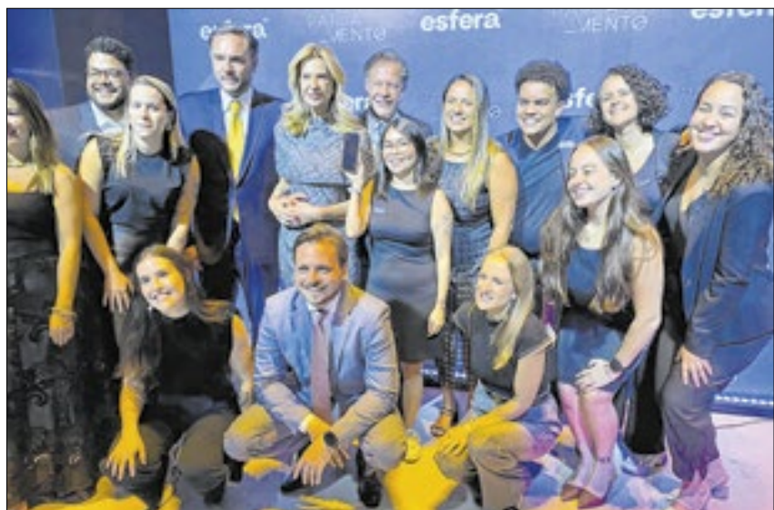
Equipe do Grupo Esfera - Casa ParlaMento, durante a solenidade realizada na noite de quarta-feira (19)