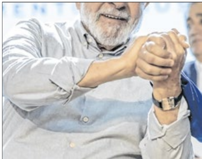
Lula com o relógio Cartier Santos que ganhou