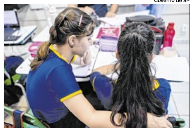
Projeto piloto será implementado em 75 escolas

Neste ano, a Secretaria de Educação também apresentou novas diretrizes para o atendimento educacional de es-