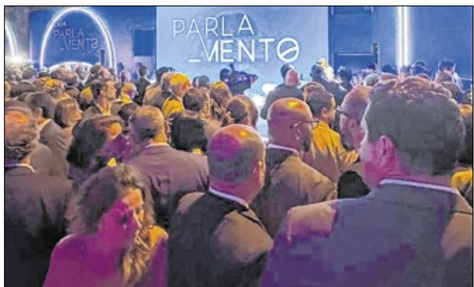
Evento de inauguração do Casa ParlaMento lotado, foi realizado no Lago Sul, em Brasília