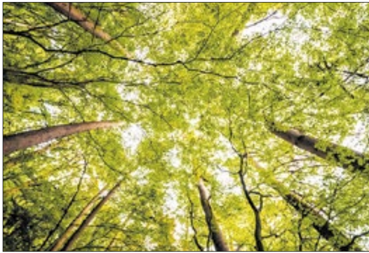
Texto foi publicado no Diário Oficial de quinta

A Comissão Nacional de Biodiversidade (Conabio) estabeleceu metas nacionais de biodiversidade para o período 2025 a 2030 e recomendou ao governo federal a adoção das medidas que deverão integrar a Estratégia e Plano de Ação Nacionais para a Biodiversidade.