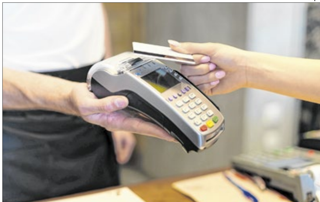
Muitos golpistas aproveitam a distração do folião para trocar o cartão

“Caso o cliente queira manter a função de pagamento por aproximação, recomendamos que o cadastramento dos cartões de crédito seja feito apenas no aplicativo wallet dos smartphones, utilizando o pagamen-