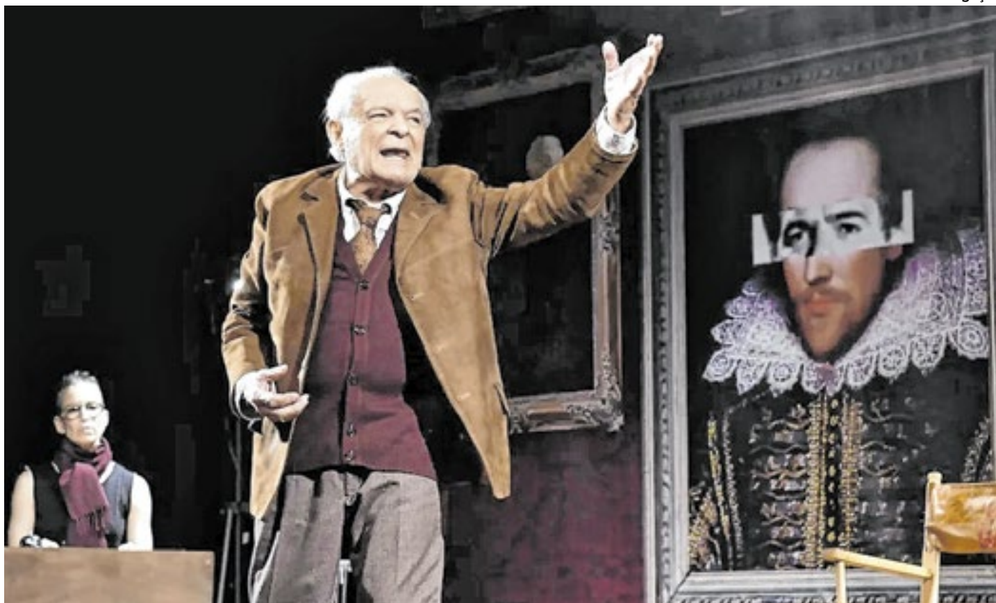
Não Me Entrego, Não!

*A história de Martinho da Vila em musical com texto de Helena Theodoro e direção de Miguel Falabella. Até 23/2, de qui a sáb (2h) e dom (19h). Teatro Riachuelo (Rua do Passeio, 38). Entre R$ 39 e R$ 200