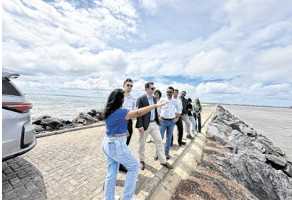
Ascom Porto Piauí

Durante 2024, a Diretoria de Desenvolvimento de Negócios da Porto Piauí trabalhou para transformar essa relação internacional em uma parceria sólida. “Foi uma semana muito rica, de troca de conhecimento com toda a equipe do Porto Piauí. Tivemos a oportunidade de apresentar nossos projetos. Os consultores belgas ficaram bem entusiasmados com as potencialidades do Piauí e com a pujante infraestrutura que já possuímos. Essa é uma importante validação de todo o trabalho que já foi feito. Agora, vamos estreitar cada vez mais