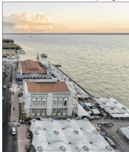
Vista do deck do Mercado do Ver-o-Peso