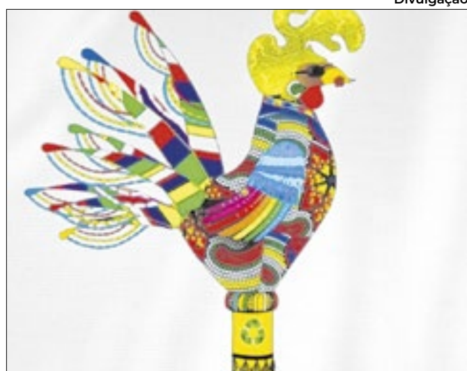
Imagem do Galo Gigante foi apresentada em coletiva