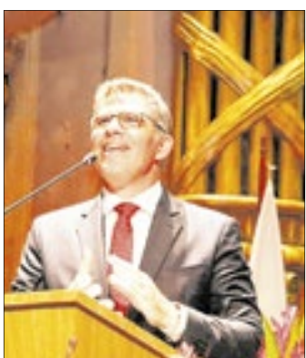
Luciano Bandeira, ex-presidente da OAB-RJ