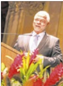
Alexandre Belmonte, ministro do Superior Tribunal do Trabalho