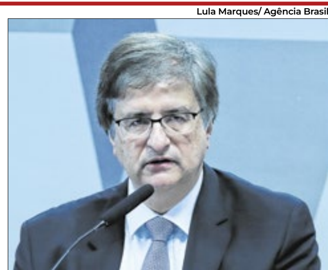
Paulo Gonet, autor da denúncia contra Bolsonaro