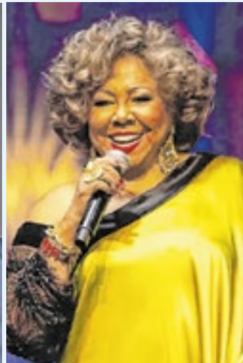
Leci Brandão, Chico Buarque e Alcione entre os artistas que se apresentarão