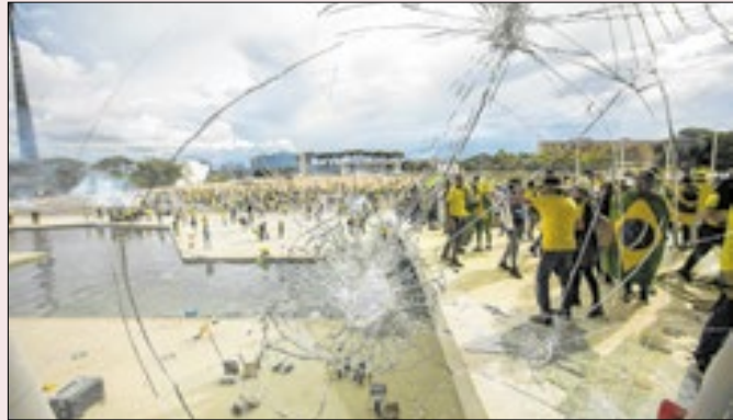
Violência visava ambiente para intervenção