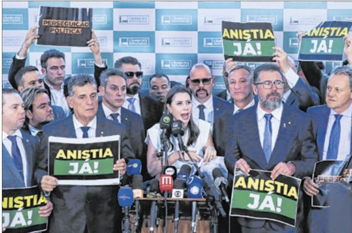
Oposição considerou denúncia frágil e sem provas

"[Mas] se na hora que o juiz for julgar, chegar à conclusão que eles são culpados, eles terão que pagar pelo erro que cometeram. Portanto, é apenas o indiciamento, o processo vai agora para a Suprema Corte e eles terão todo o direito de se defenderem. Não posso comentar mais nada do que isso", finalizou o presidente.