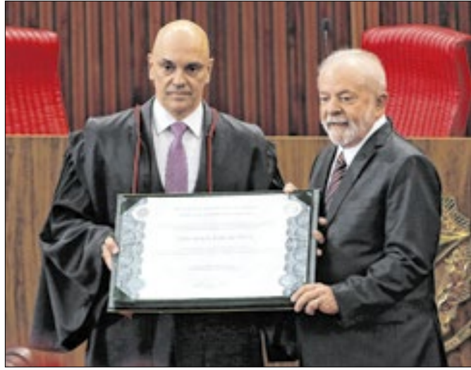
No dia da diplomação de Lula, primeiros atos violentos