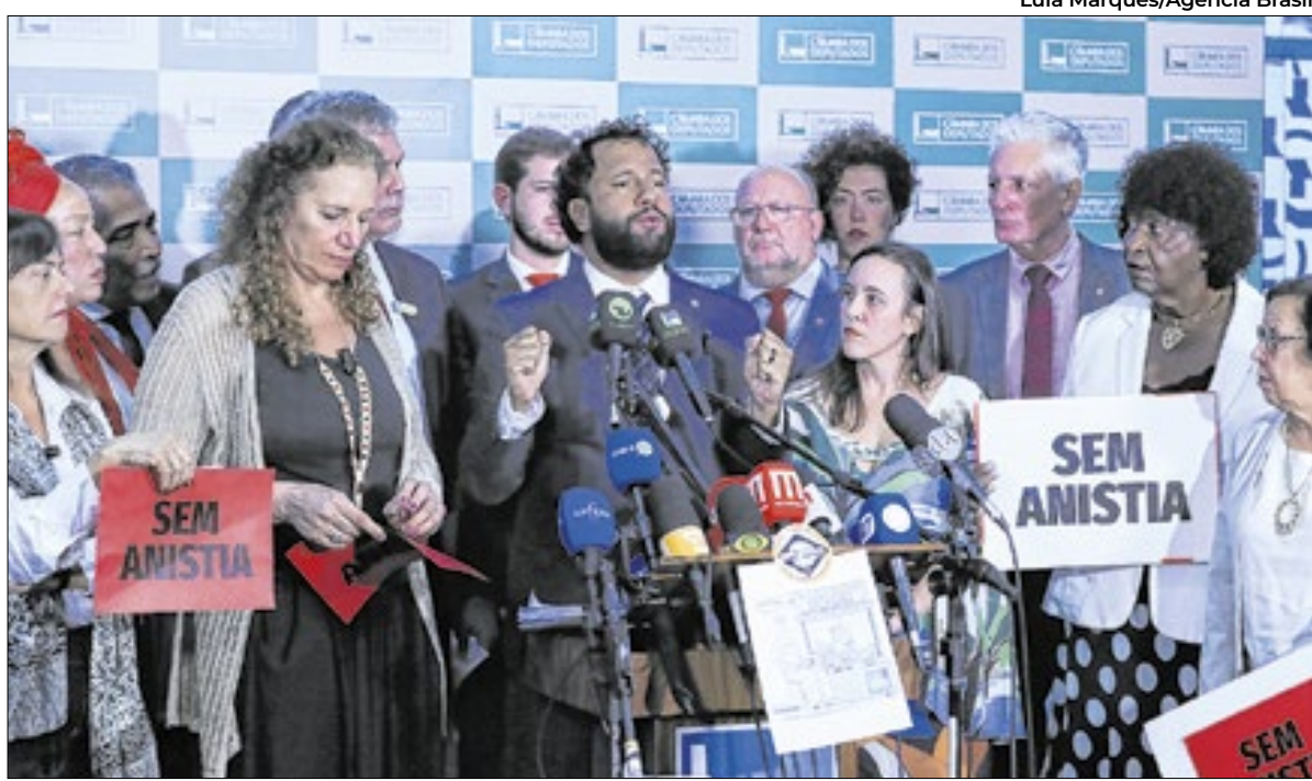
Para governo, enfraquecida a tese da anistia