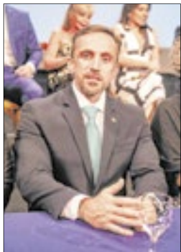
Paulo Vinícius Cozzolino Abrahão, defensor público-geral do RJ