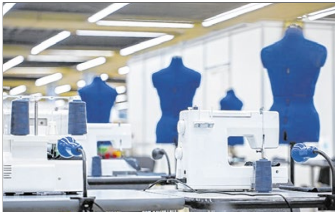
Qualificação técnica busca aperfeiçoar os processos produtivos

Autarquia e universidades investem em qualificação geral