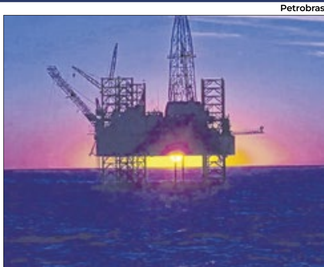
Arrecadação de 4 blocos deve atingir R$ 522 bilhões