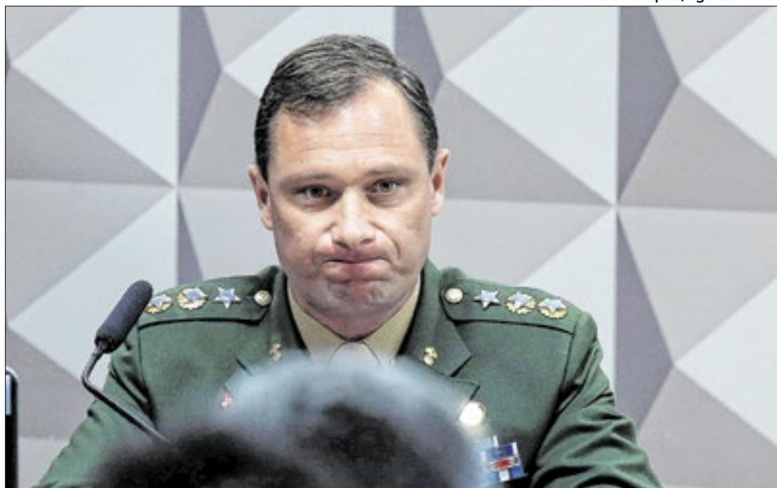
Documento da delação de Cid tem mais de 500 páginas

Na colaboração, Cid detalhou que, inicialmente, havia solicitado um cartão de vacinação falsificado para sua própria família. Contudo, ao tomar conhecimento do plano, o então presidente Jair Bolsonaro ordenou que cartões falsificados também fossem feitos para ele e para sua filha, Laura Bolsonaro. A inserção dos dados no sistema Conecte SUS, plataforma oficial do Ministério da Saúde, foi realizada com a ajuda de terceiros, como o capitão reforma-