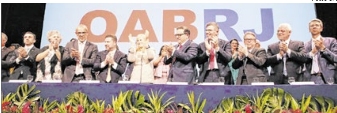
Nova diretoria da OAB-RJ tomou posse na última terça-feira, no Theatro Municipal