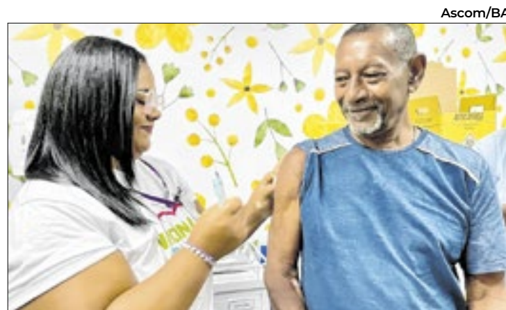
O número de óbitos também apresentou uma redução

a cadeia logística do etanol e otimizar a arrecadação de tri- butos como COFINS, PIS e ICMS. Com a regulamentação, produtores e importadores de etanol hidratado combustível estão autorizados a comercia- lizar diretamente com agentes distribuidores, revendedores varejistas de combustíveis, transportadores-revendedo- res-retalhistas e o mercado ex- terno. A modalidade de venda direta será opcional, sem sub- stituir o modelo atual, permiti- ndo maior flexibilidade para as unidades produtoras na co- mercialização do produto. A regulamentação atende a uma solicitação do Sindicato de Pro- dutores de Cana, Açúcar e Eta- nol de Cana e outras Biomassas do Maranhão e Pará (Sindica- nálcool Bioenergia). O pleito contou com o apoio das Secre- tarias de Estado da Agricultura e Pecuária (Sagrma), Indústria e Comércio (Seinc) e Fazenda (Sefaz), órgãos responsáveis pela viabilização da medida.