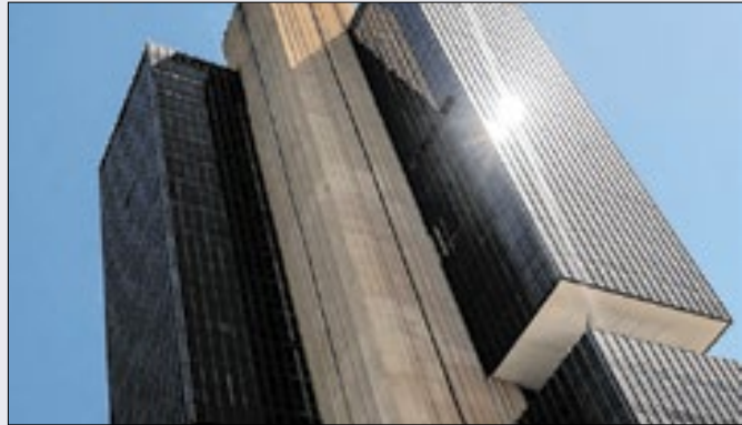
Comando do BC mudou, mas ideia de autonomia, não