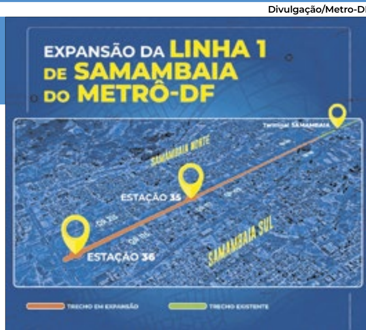
As duas novas estações do ramal Samambaia serão construídas nos próximos três anos

O consórcio CG – JFJ, formado pelas empresas CG Construções LTDA e JFJ Tecnologia em Instalações Elétricas, foi o vencedor da licitação para as obras de expansão da linha 1 no trecho Samambaia, que faz parte do projeto de expansão do