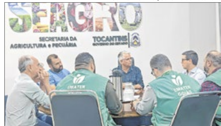
Feira agropecuária Agrotins serve de modelo para Goiás