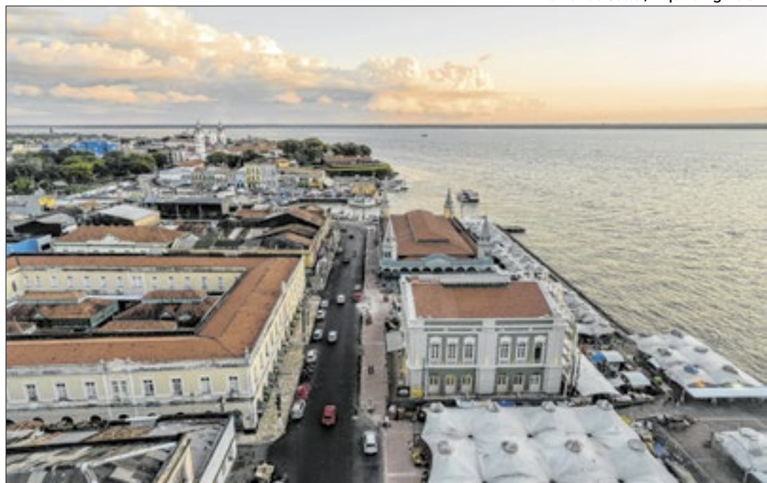
Vista do Mercado do Ver-o-Peso, uma imersão nos hábitos e tradições culinárias da região

ço é palco para apresentações musicais, incluindo samba e batucadas, enriquecendo a experiência cultural dos visitantes.