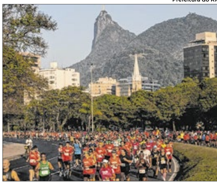
Prefeitura do Rio

Segundo projeção do Visit Rio, que busca fomentar o turismo na cidade, 117 eventos, ao todo, devem atrair cerca de