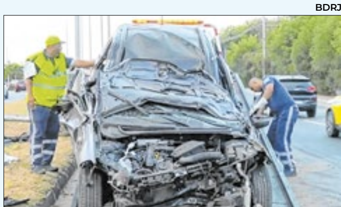
Veículo ficou totalmente destruído, ao bater em poste

A prisão foi possível, devido ao emprego de câmeras de segurança e monitoramento da equipe de inteligência da delegacia. Com o homem, foram encontradas ferramentas para violar os veículos e um módulo eletrônico para dar a partida.