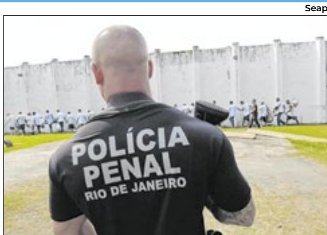
Ação da Seap resultou na apreensão de objetos ilícitos