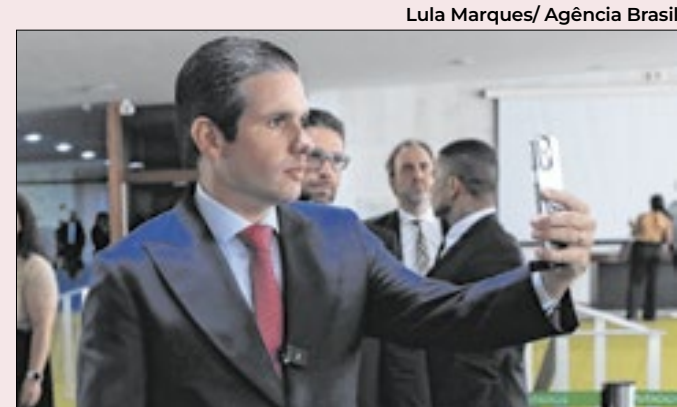
Espelho meu: Motta ajudará a definir presidências

Há também a certeza de que o Carnaval será palco de muitas manifestações contra Bolsonaro e de que a denúncia deverá ser aceita antes do dia 16. A conta é simples: a ação da PGR ataca os radicais, mas tende a afastar os moderados, que são decisivos numa eleição majoritária.