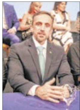
Paulo Vinícius Cozzolino Abrahão, defensor público-geral do RJ