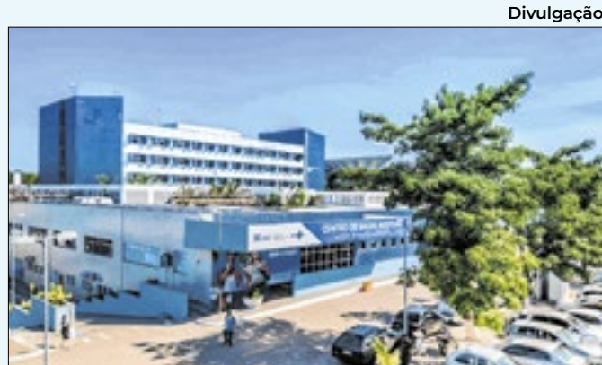
Hospital Municipal Dr. Moacyr Rodrigues do Carmo

As turmas da manhã terão aulas normais. Para garantir a merenda escolar dos alunos da tarde, as unidades seguirão abertas das 12h às 14h. A Secretaria de Educação já está organizando a reposição de aulas e não haverá prejuízo pedagógico aos alunos.