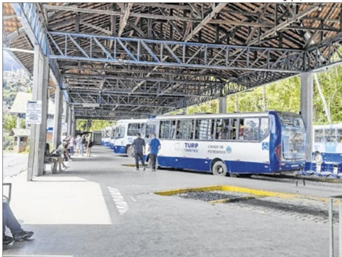
Do total de 197 quebras, 141 foram apenas da empresa Turp Transportes

Reclamações aumentaram após a saída da Petro Ita e Cascatinha