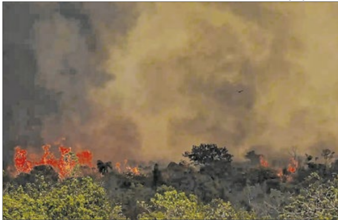
O MP também apura os planos de contingência para eventos extremos de incêndio

A 2ª Promotoria de Justiça de Tutela Coletiva do Núcleo Três Rios apura os planos de contingência dos municípios para eventos extremos de incêndio, o monitoramento tecnológico do risco de incêndios, entre outras medidas de proteção florestal. A Operação Fumaça Zero, do Inea, promove ações de conscientização e prevenção de queimadas irregulares nos municípios do Rio de Janeiro durante o período de