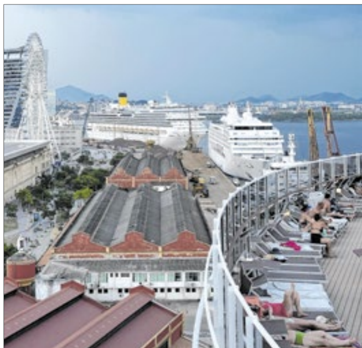
Pier Mauá, no Rio, receberá nove navios transatlânticos