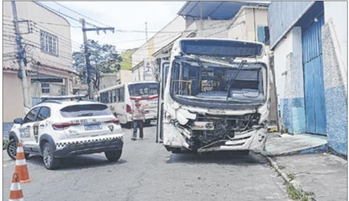
Ônibus foram apreendidos pela Secretaria Municipal de Ordem Pública de Barra Mansa

O transporte público da região passou por uma série de mudanças durante o mês de fevereiro, após meses de reclamações de passageiros e um acidente que foi causado pela falha mecânica de um ônibus em Barra Mansa e feriu levemente 40 pessoas no bairro Boa Vista II.