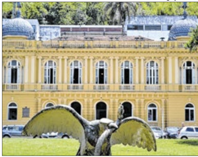
Audiência do último quadrimestre será dia 27 às 13h