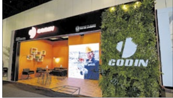
Estado está na principal feira do setor, em São Paulo