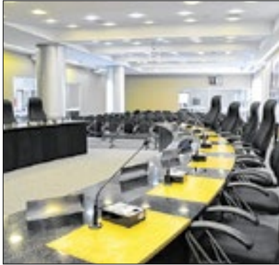
Plenária é aberta a todos

A Câmara Municipal de Nova Friburgo vai realizar uma rodada de audiências públicas para receber a Prefeitura para a Prestação de contas das suas ações da área da saúde e finanças dos meses de maio, junho, julho e agosto de 2024. A ideia é demonstrar e avaliar o cumprimento das metas de gestão estipuladas nas leis orçamentárias do quadrimestre para o Legislativo e para a população.