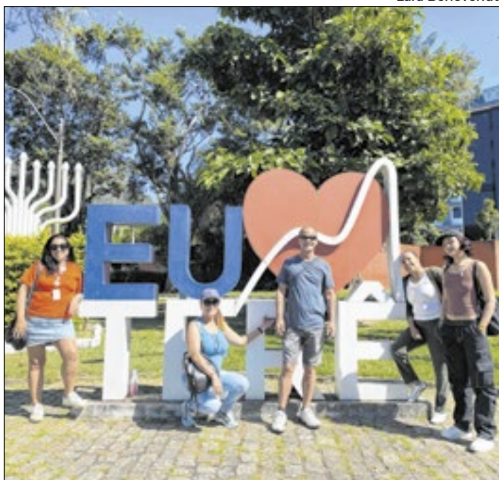
Atividade complementa o projeto de capacitação contínua em turismo receptivo e amplia conhecimento sobre o patrimônio da cidade