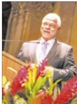
Alexandre Belmonte, ministro do Superior Tribunal do Trabalho