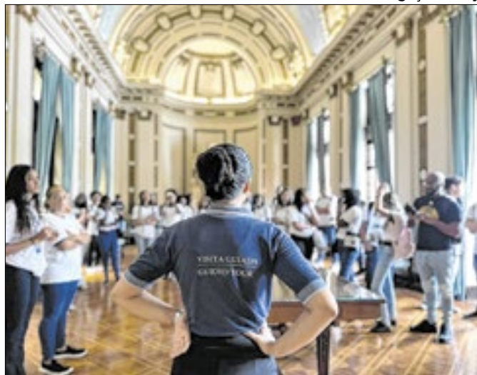
Maioria dos visitantes no mês foram estrangeiros