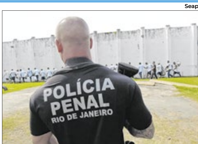
Ação da Seap resultou na apreensão de objetos ilícitos