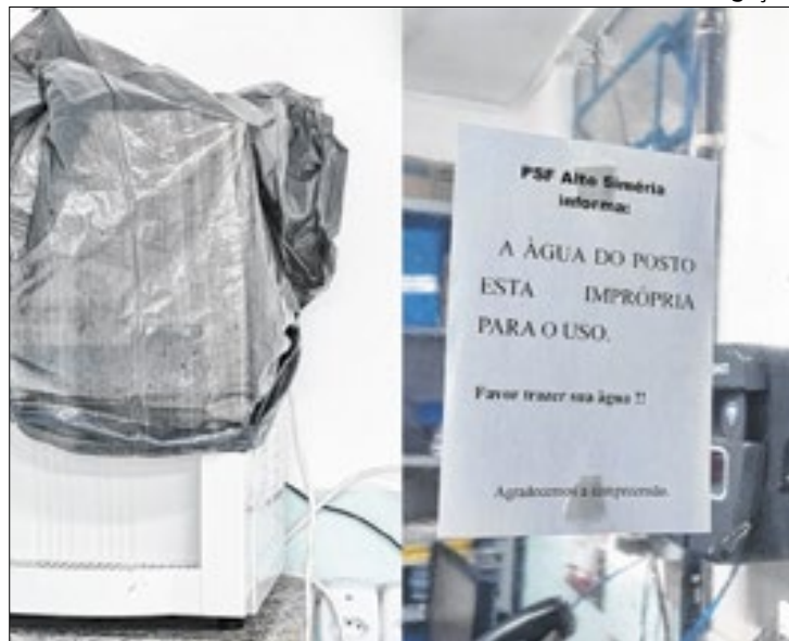
Unidade está com a água imprópria para uso

"As circunstâncias não são boas. Na unidade não tem ventilador, nem filtro de água, nesse calor está impossível! E para completar a caixa d'água é de amianto e está contaminada. Foi avisado para os pacientes não tomarem e se caso precisar, trazer uma garrafa de casa, assim como a equipe está fa-