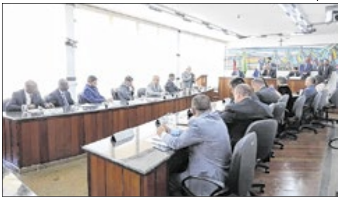
Sessão marcou a estreia do novo horário do Legislativo