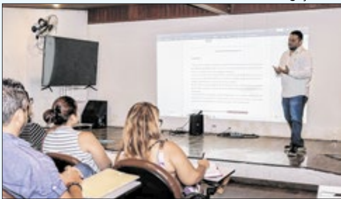
Treinamento teve a participação de servidor do TCE-RJ