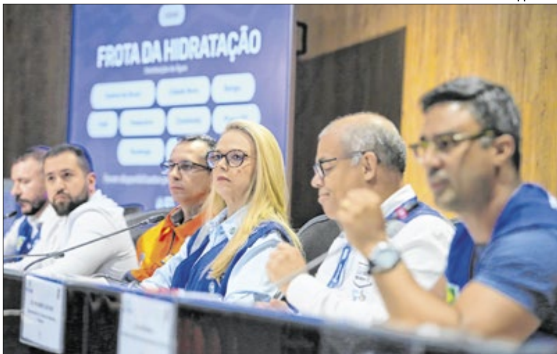
Ação é coordenada por vários órgãos e secretarias estaduais

emergenciais em casos de chuvas intensas. Além disso, a cidade lançou o aplicativo Alerta DCNIT, que fornece alertas sobre condições climáticas e permite que os cidadãos se conectem rapidamente com a Defesa Civil.