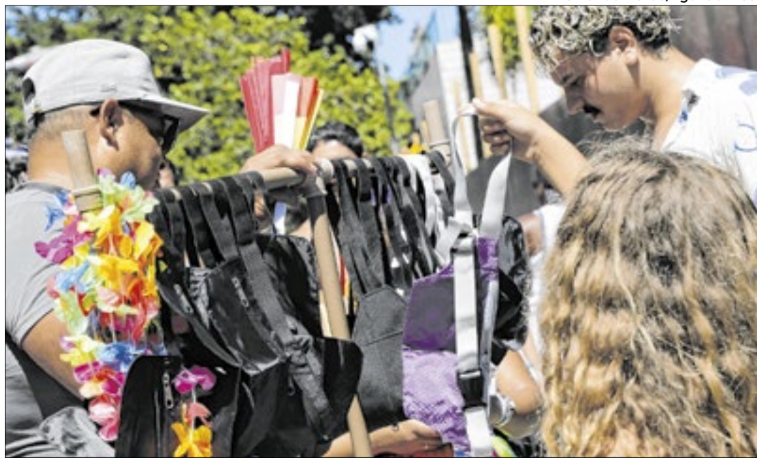
Vendedores ambulantes durante bloco na região central do Rio

O Ministério Público Federal (MPF) e a Defensoria Pública do Estado do Rio de Janeiro (DPE/RJ) emitiram, nesta quarta-feira (19), uma recomendação conjunta para garantir os direitos dos trabalhadores ambulantes durante o carnaval de 2025 no Rio de Janeiro.