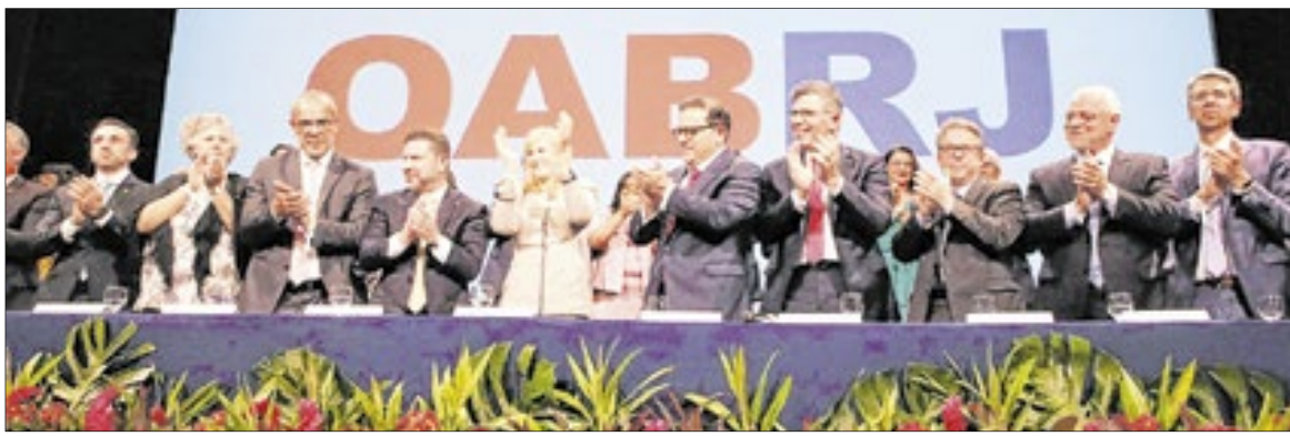
Nova diretoria da OAB-RJ tomou posse na última terça-feira, no Theatro Municipal