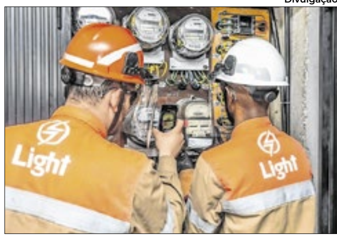
Light disse que 'gatos' sobrecarregam a rede elétrica