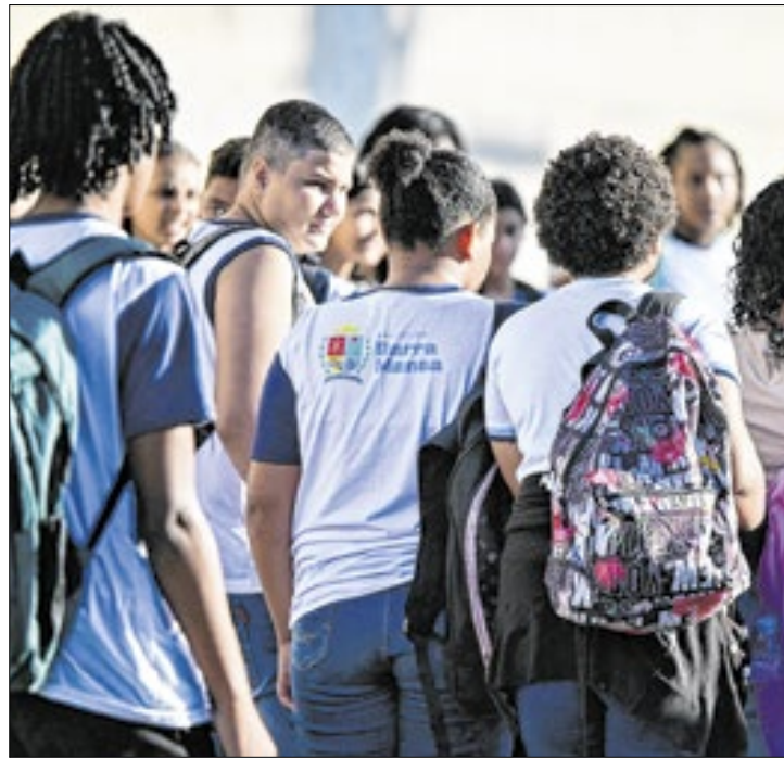
Alunos têm horário reduzido até a próxima sexta-feira

-Nós estamos acompanhando as previsões e o calor vai continuar intenso na quinta e na sexta. Por isso, decidi-