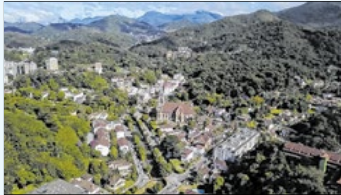
Pagamento também pode ser parcelado