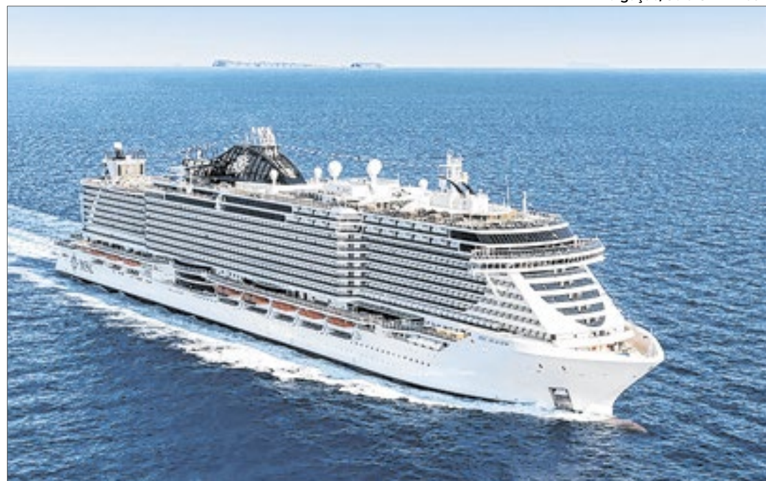
Serão 14 navios fazendo embarques e escalas em diferentes destinos brasileiros

do período da viagem: segundo a CLIA Global, 60% dos cruzeiristas retornam posteriormente aos destinos que conheceram a bordo para estadias mais longas, ampliando ainda mais os benefícios para as cidades visitadas.