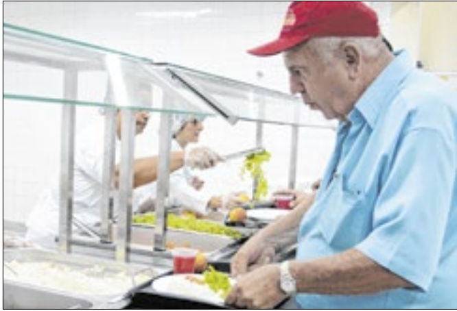
O Restaurante do Povo irá concluir a programação