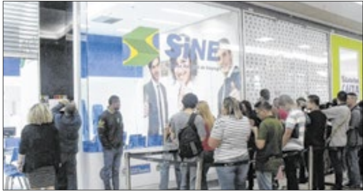
Interessados podem se inscrever nas unidades do Sine