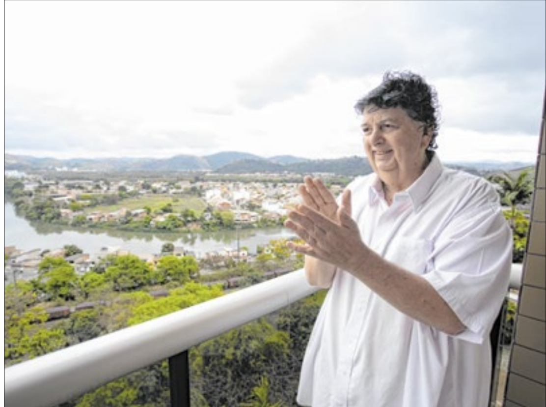
Neto diz que reajuste está acima da inflação entre fevereiro de 2024 e janeiro de 2025

O reajuste de 5% será aplicado aos salários dos servidores e diretores da administração direta, autarquias, fundações e empresas públicas, entre outras do município, assim como os inativos, pensionistas, funções de confiança, cargos de comissão e secretários. O único subsídio a não receber aumento será o do prefeito.