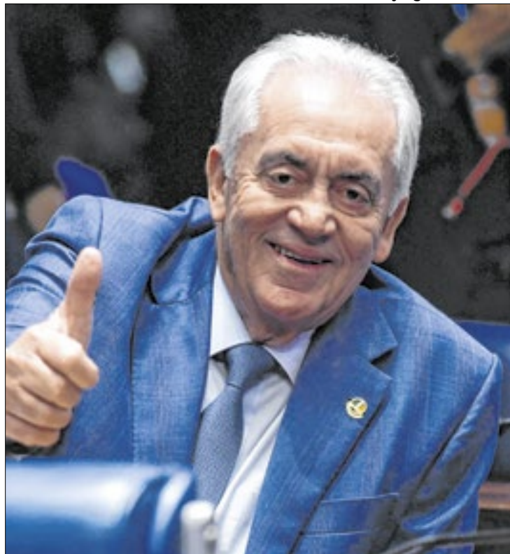
Otto Alencar é o novo presidente da CCJ

Já a Comissão de Assuntos Econômicos (CAE) ficará sob o comando do senador Renan