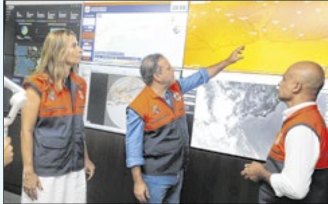
Neves destaca mobilização aos desafios climáticos