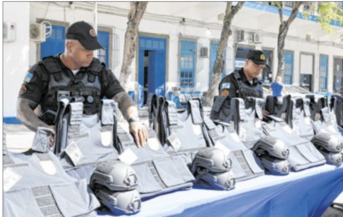
São 1.704 capacetes e 2.374 coletes balísticos para os agentes, em especial para os do Bope

O governador do estado do Rio de Janeiro, Cláudio Castro, junto com o coronel Marcelo Menezes, entregou à tropa da Polícia Militar, 1.704 capacetes e 2.374 coletes balísticos, de um total de nove mil adquiridos neste ano. A cerimônia, realizada nesta terça-feira (18), no Quartel General da Polícia Militar, na região central da capital fluminense, faz parte do compromisso do governo