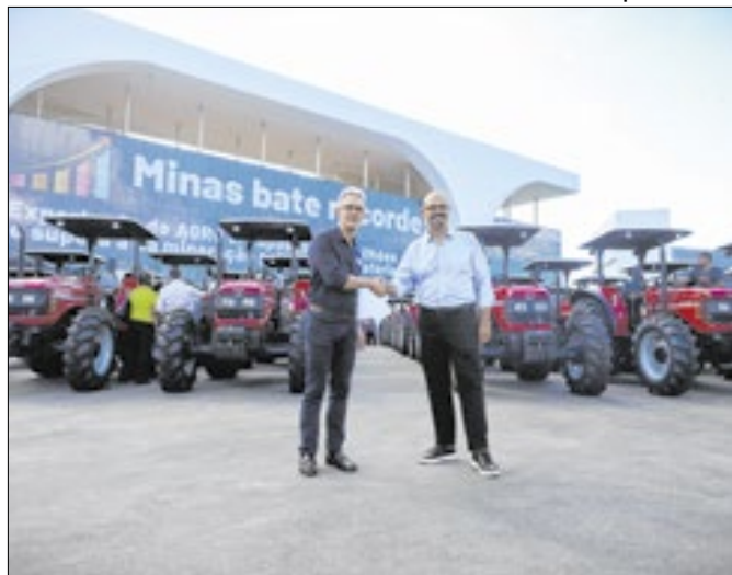
Governador Romeu Zema e o vice Professor Mateus