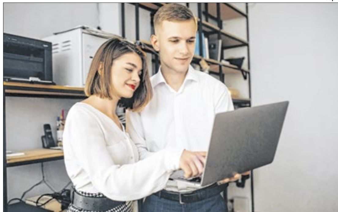
Revisão de Políticas Públicas para Equidade de Gênero e Direitos das Mulheres

A secretária de Controle Externo de Desenvolvimento