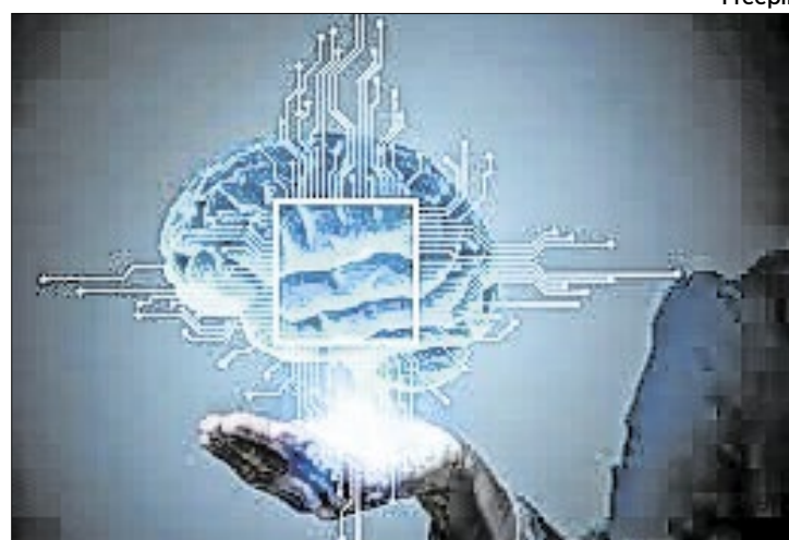
Educação Tecnológica é vital para seguir o ritmo

dantes têm acesso a uma ampla variedade de recursos educacionais de forma rápida e prática. Plataformas digitais e a internet permitem explorar conteúdos que complementam o aprendizado escolar, expandindo o conhecimento além dos livros didáticos.