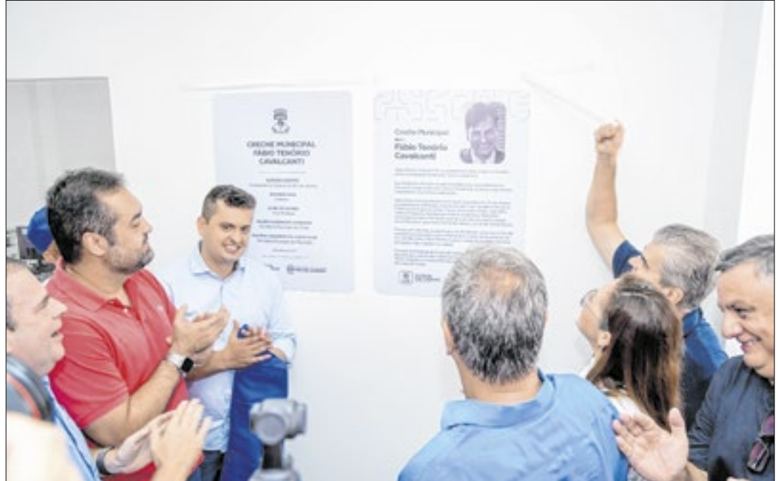
Cerimônia de inauguração contou com a presença do Governador Cláudio Castro

Durante a cerimônia de inauguração, o prefeito Netinho Reis destacou o compromisso da gestão municipal com a transformação da educação e anunciou a entrega