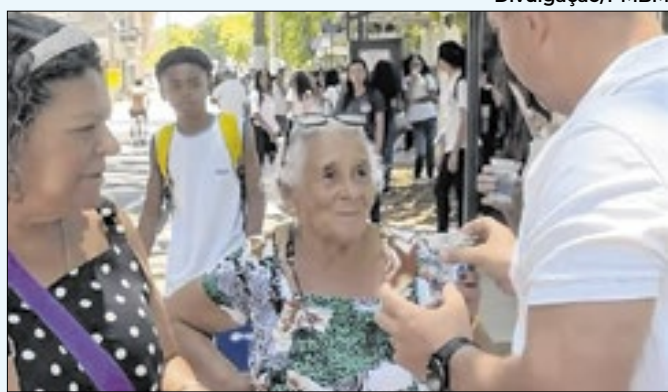
Furlani ajuda na entrega de água para moradores

ções de confiança, cargos de comissão e secretários. O único subsídio a não receber aumento será o do prefeito. O menor vencimento pago pelo governo municipal será de quase R$ 2,1 mil.