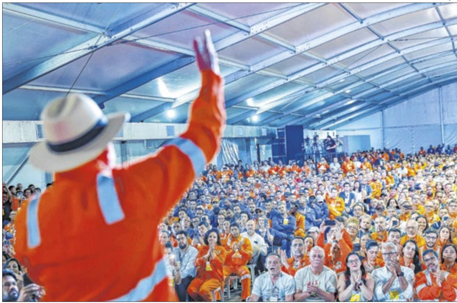
Lula no Tebig, em Angra dos Reis-RJ, diz que Petrobras não tem culpa do aumento do combustível

De acordo com o governo, a ampliação da frota de gaseiros, de seis para 14 navios, leva em conta o aumento de produção de gás natural no país e pretende atender a demanda