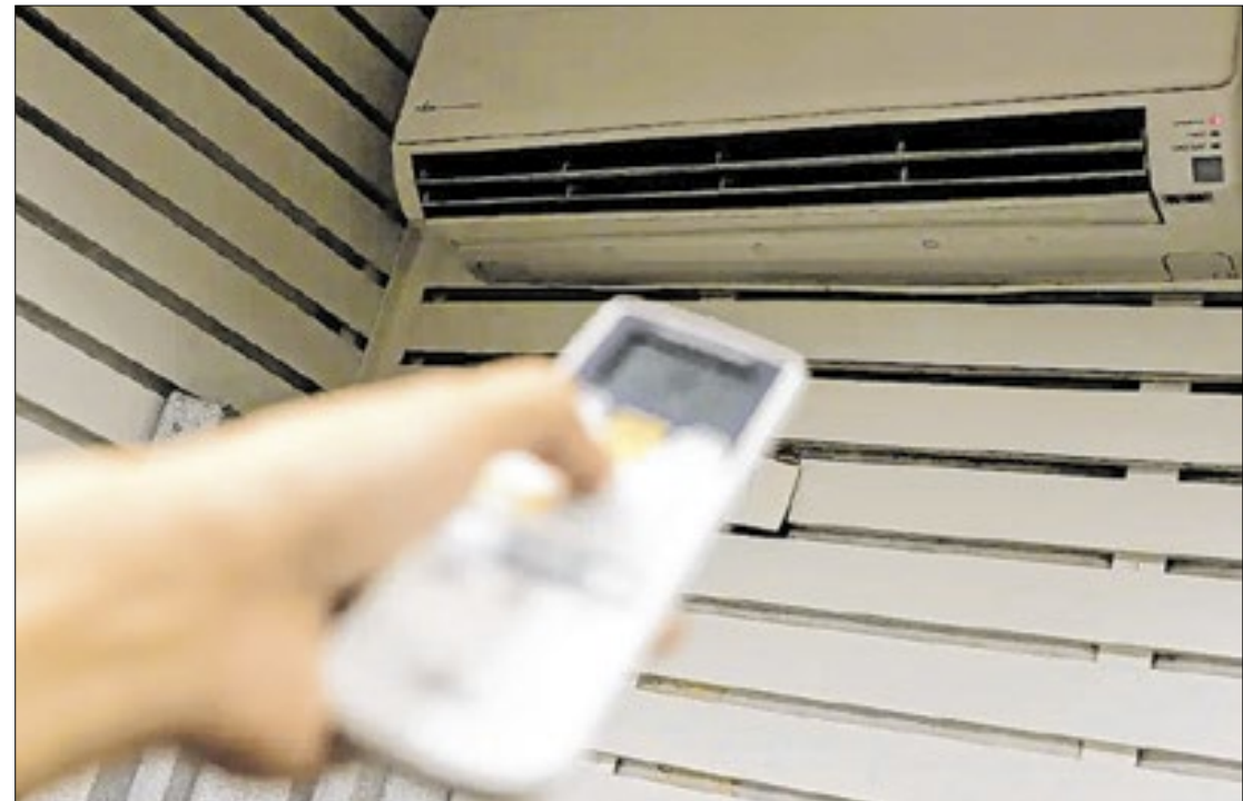
Calor extremo se tornou ponto de discussão em várias cidades da região

e os eventos extremos de calor são cada vez mais frequentes e intensos. Estudos indicam que as cidades devem adotar estratégias de adaptação para minimizar estes impactos, sendo a climatização das escolas essencial para garantir o ambiente seguro. Algumas cidades vizinhas já estão adotando essas medidas, que precisam ser pensadas com urgência - disse o vereador.