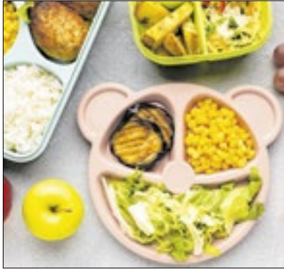
Para profissionais de Apoio

Foi publicada no Diário Oficial do Município de Nova Friburgo, edição 2262, a Lei Complementar nº 173, que institui o Plano de Cargos, Carreiras e Salários dos Profissionais de Apoio à Educação do município, conforme as Constituições Federal e Estadual, a Lei Orgânica Municipal, a Diretrizes e Bases da Educação Nacional, a do Fundo Nacional de Desenvolvimento da Educação Básica e o Estatuto.