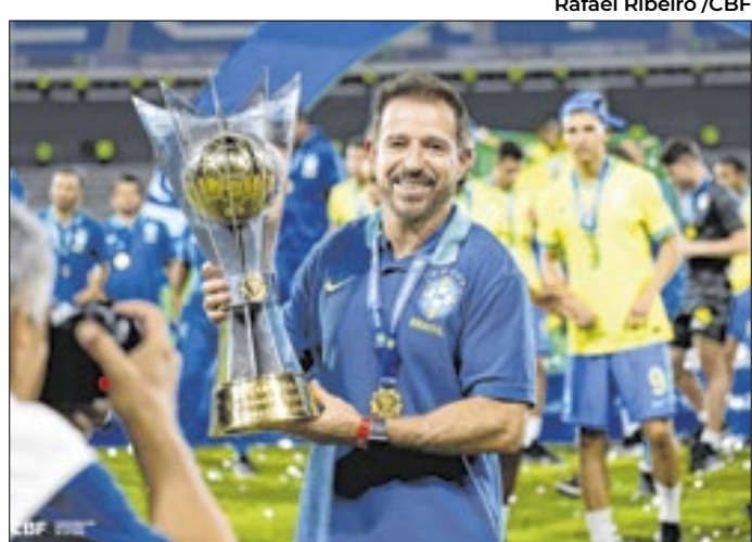
A trajetória de Ramon de Menezes é 'curiosa' na CBF

Contestado, Ramon de Menezes viu seu trabalho com a Seleção Brasileira começar da pior forma possível no Sul-Americano Sub-20, com uma derrota por 6 a 0 para a Argentina. Porém, a Seleção deu a volta por cima e conquistou o título, tendo como vice justamente a seleção da Argentina.