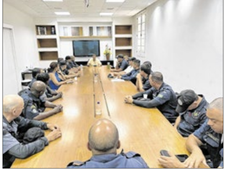
Agentes farão apenas advertências aos motoristas

De acordo com o secretário, a primeira etapa da iniciativa foi ouvir os agentes que atuam diretamente na fiscalização e ordenamento do trânsito. "Buscamos entender as dificuldades enfrentadas no dia a dia e identificar pontos específicos que