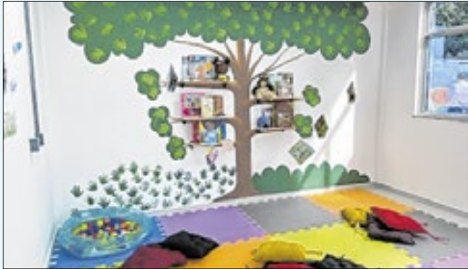
Creche no Parque Beira Mar terá estrutura moderna