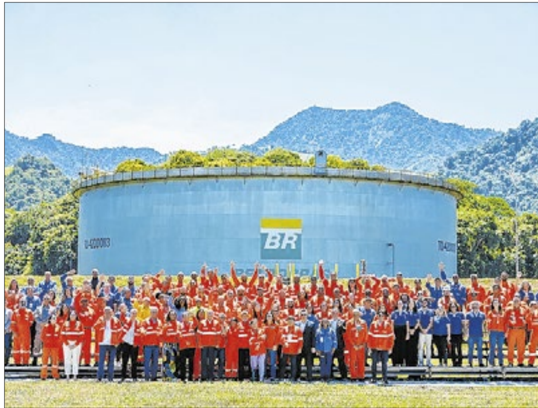
Funcionários celebram retomada da Indústria Naval e Offshore brasileira

Durante o evento, Lula defendeu a venda direta de combustíveis para baratear o custo desses produtos aos consumi-