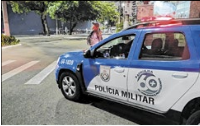
Viaturas permanecem 24 horas nos locais