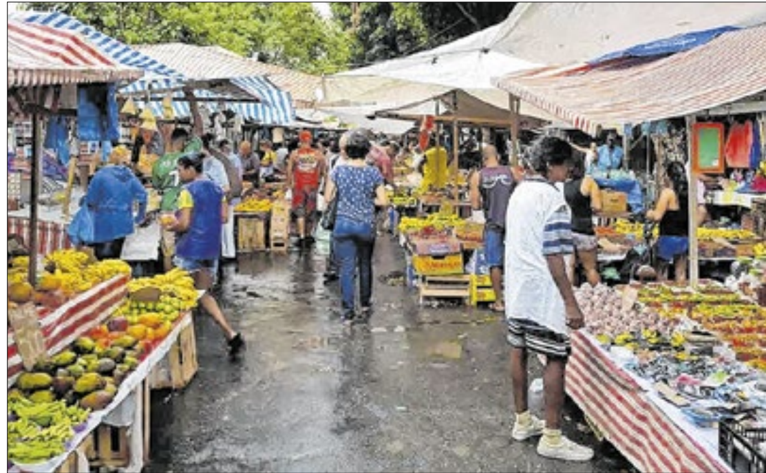
Aumento linear das projeções de inflação liga alerta para a condução da economia

No polo oposto, a estimativa para o PIB (Produto Interno Bruto) 'encolheu' de 2,03% para 2,01% para este ano, mas