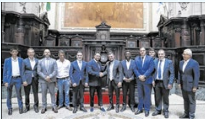
Campeonato vai fomentar o turismo na capital