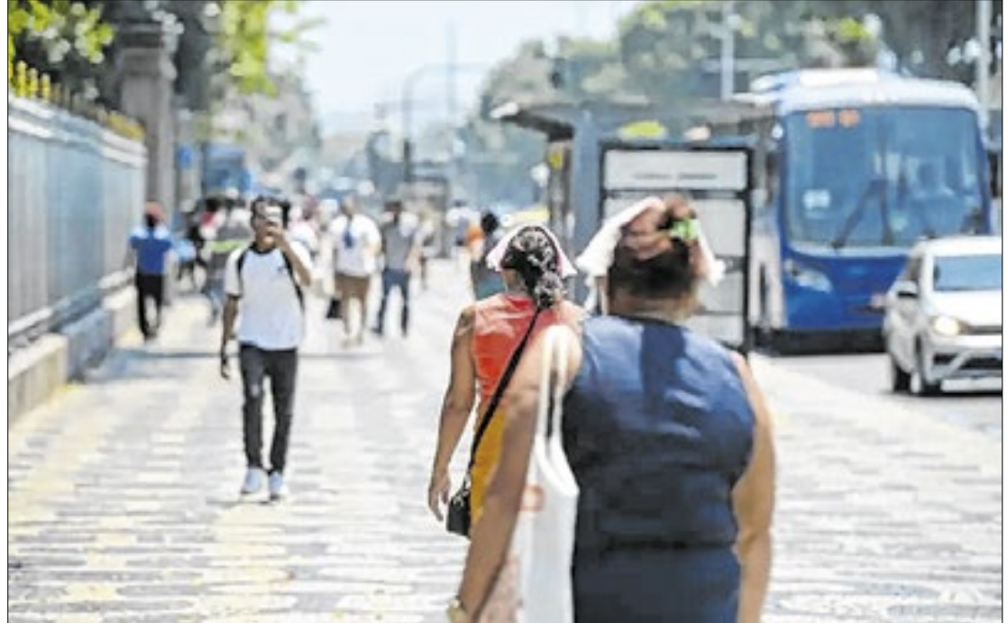
Conforme os dados do INMET nos próximos dias, até a sexta-feira (21) contará com muito calor

No último domingo (16), algumas cidades do Estado do Rio de Janeiro registraram altas temperaturas por conta da nova onda de calor, segundo o Instituto Nacional de Meteorologia (INMET), o Brasil enfrenta a terceira onda de 2025, esse fator pode superar em mais de 5°C a média climatológica. A previsão é que o evento climático siga até a sexta-feira (21). Com isso, os efeitos desse fenômeno atingem também o Estado do Rio de Janeiro, refletindo nas cidades da região. Nesse sentido, dois municípios da Região Centro-Sul Fluminense, Três Rios e Paraíba do Sul, se destacam pelas altas temperaturas, alcançando nesta terça-feira (18), uma média de 40°C. As cidades da Região Serrana também seguem a tendência, Petrópolis também registra 40°C, já Nova Friburgo e Teresópolis marcam temperaturas acima de 30°C.