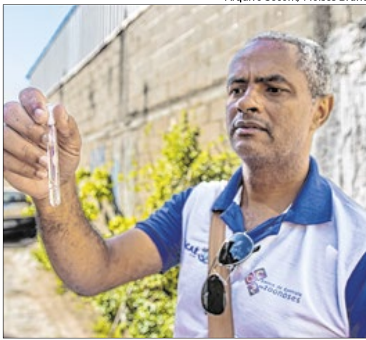
Serão realizadas ações na área urbana e Região Serrana