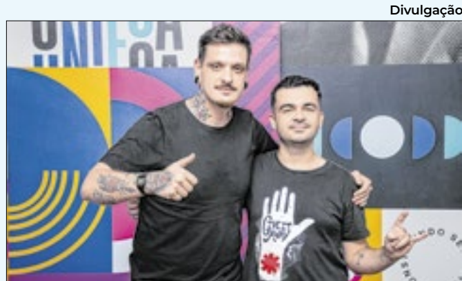
A ideia surgiu da insatisfação com o sistema anterior

horários de: 5h; 7h; 9h15; 11h30; 14h; 16h10; 18h20; e 20h30. Por sua vez, os horários de saída de Cacara ocorrerão às: 6h; 8h10; 10h25; 12h40; 15h05; 17h20; 19h30; e 21h30.