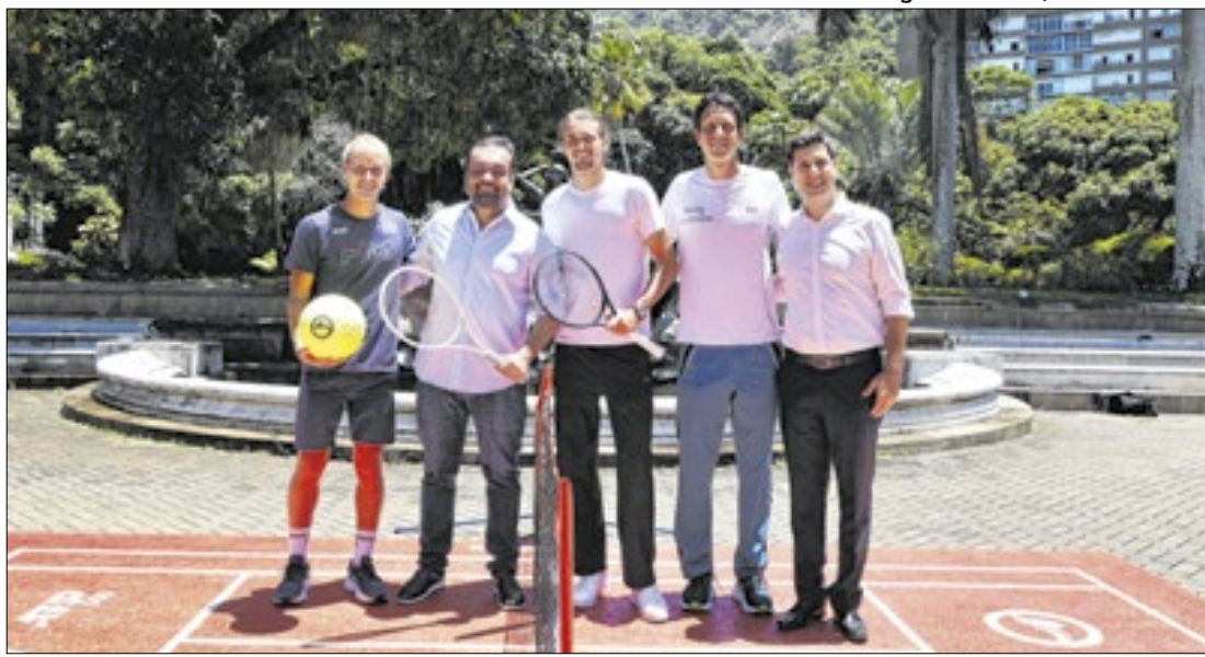
Evento tem apoio da Lei Estadual de Incentivo ao Esporte, com aporte de R$ 17,6 milhões

dois tempos de 25 minutos e as seleções já estão sendo escaladas com craques como Seedorf, Kaká e David Beckham, além de Zico como técnico do Brasil. O evento ainda será transmitido pela Amazon Prime e também por uma TV Aberta, que ainda será definida.