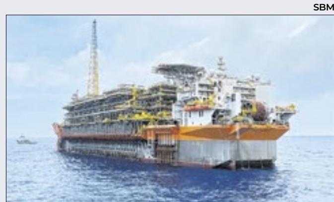
Navio-plataforma dará liderança ao Campo de Búzios

Os seis aviões financiados pelo BNDES serão entregues entre este ano e o próximo. Pelo modelo Exim Pós Embarque, a Horizon assumirá pagamentos em dólares ao BNDES. Outros R$ 2,1 bi financiarão a venda de 16 aviões E-175 à também ianque Republic Airways.