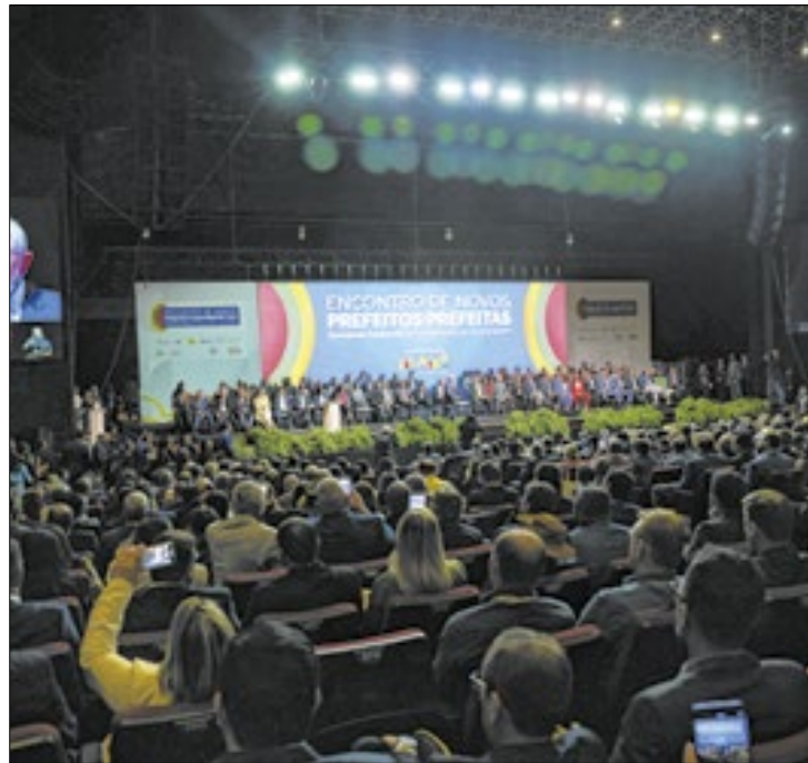
Evento facilitou acesso a recursos para a gestão pública