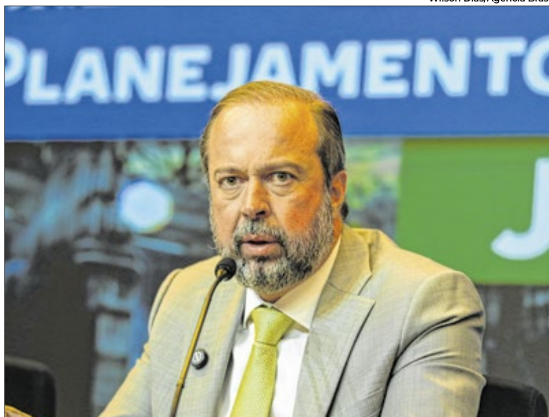
Ministro das Minas e Energia, Alexandre Silveira, fala sobre polêmica com Ibama

No evento, a presidente da Petrobras, Magda Chambriard, defendeu a capacidade da Petrobras para perfurar poços na