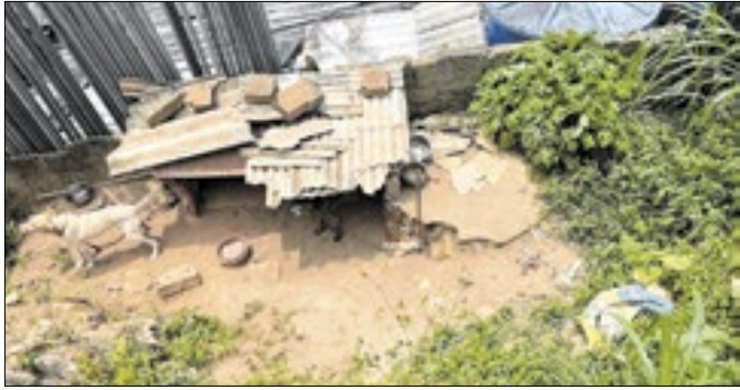
Ação aconteceu em parceria com a 110ª DP