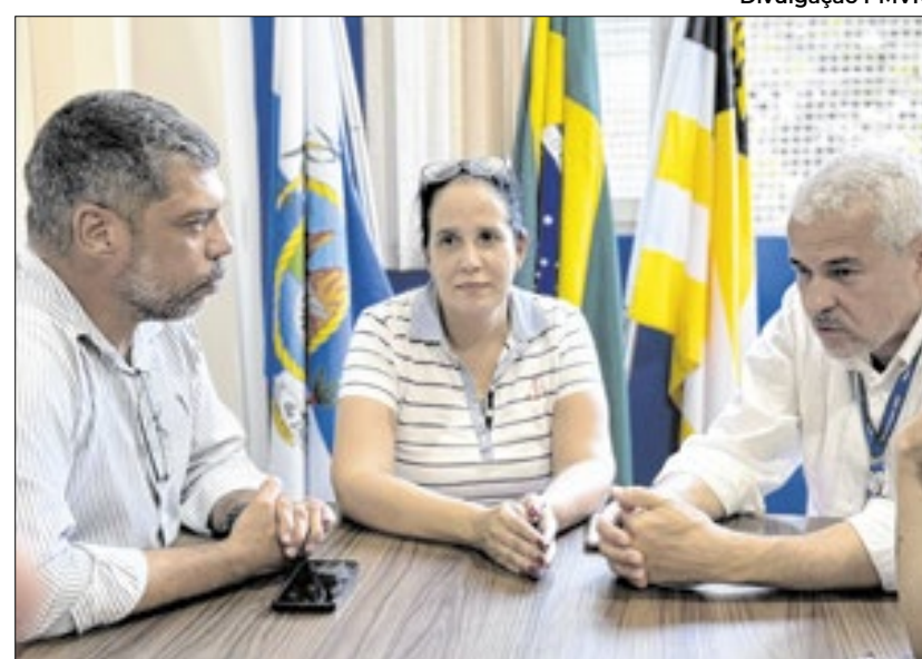
Parlamentar destacou a urgência da medida em reunião