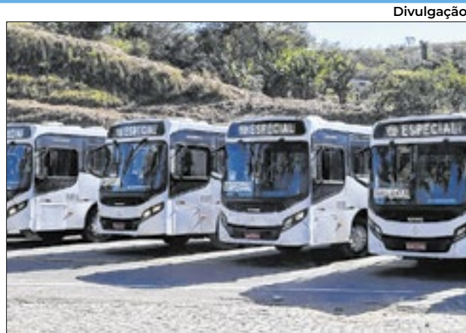
Trajeto pra Seropédica estava paralisado há cinco anos