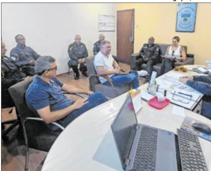
Forças de segurança discutem medidas para assegurar que foliões tenham proteção nas ruas