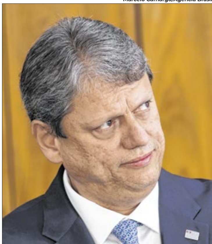
Tarcísio afirma que disputará a reeleição em São Paulo

“Nossa responsabilidade é trabalhar para que em 2026 a prosperidade e a esperança retornem. E a nossa esperança é a maior liderança da direita, que hoje está no PL e que vai voltar a ser o nosso presidente da República, que é Jair Messias Bol-