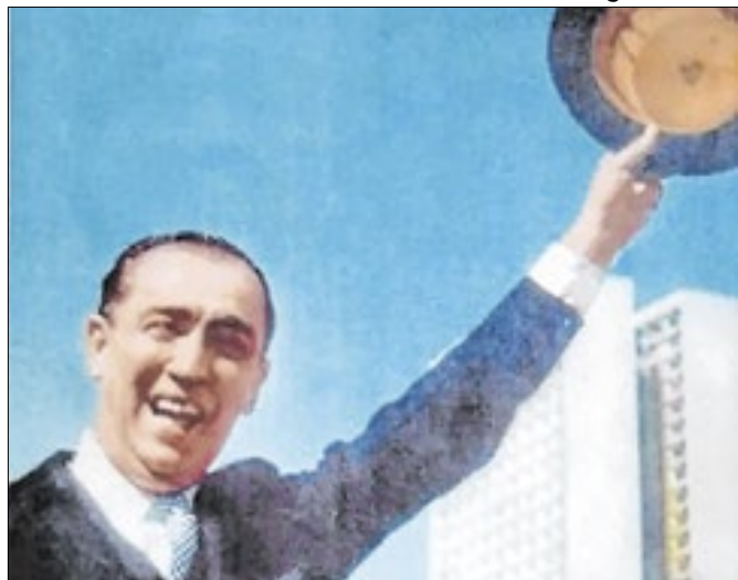
Morte de JK foi mesmo um acidente?