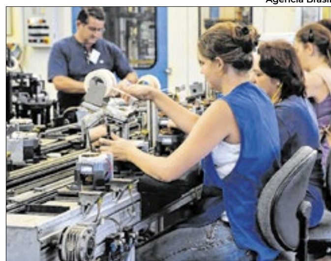
Indicador da FGV exibiu recuo de 0,7% no final de 2024