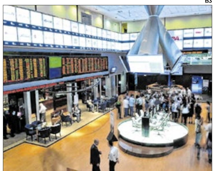
Bolsa brasileira perde força, mas garante 129 mil pontos

O ânimo maior vem desde a tarde da última sexta-feira, quando pesquisa Datafolha trouxe popularidade do presidente Lula no menor nível de seus três mandatos, reforçando a percepção de que 2026, embora ainda muito à distância, possa trazer alternativa de po-