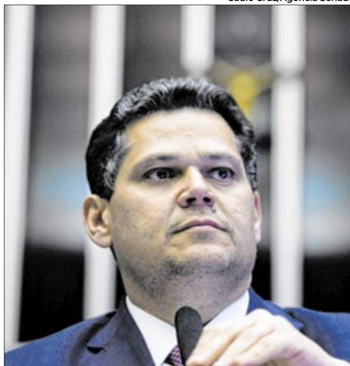
Alcolumbre irá se reunir com os líderes nesta terça-feira

Eleito presidente da CCJ, o senador declarou anteriormente que dará prioridade às pro-