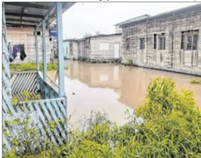
Defesa Civil e assistência social atuam nos bairros