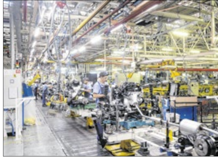
Iniciativa visa produção de carros com baixas emissões

Por meio desta cooperação, as duas fábricas do Renault Group no Complexo Ayrton Senna devem ser disponibilizadas para a produção destes novos veículos, tanto para a Geely