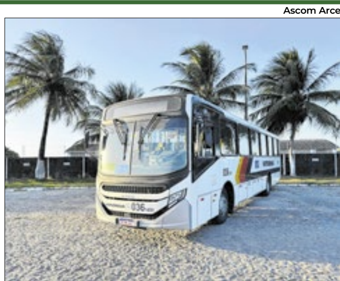
O serviço de pagamento é pioneiro no Nordeste