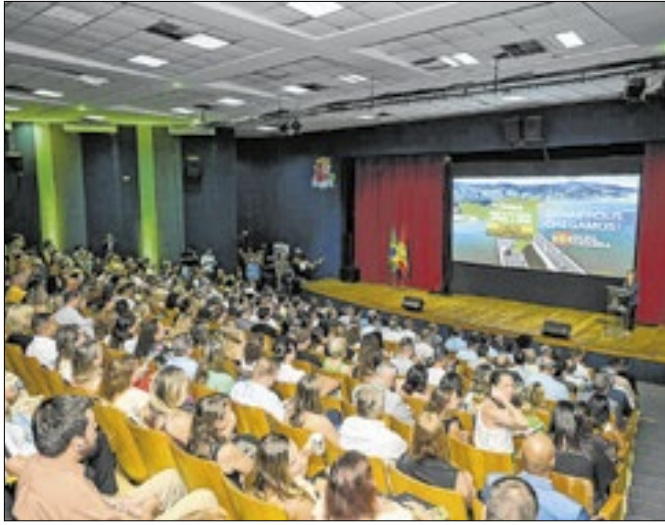
A primeira agenda ocorreu na Grande Florianópolis