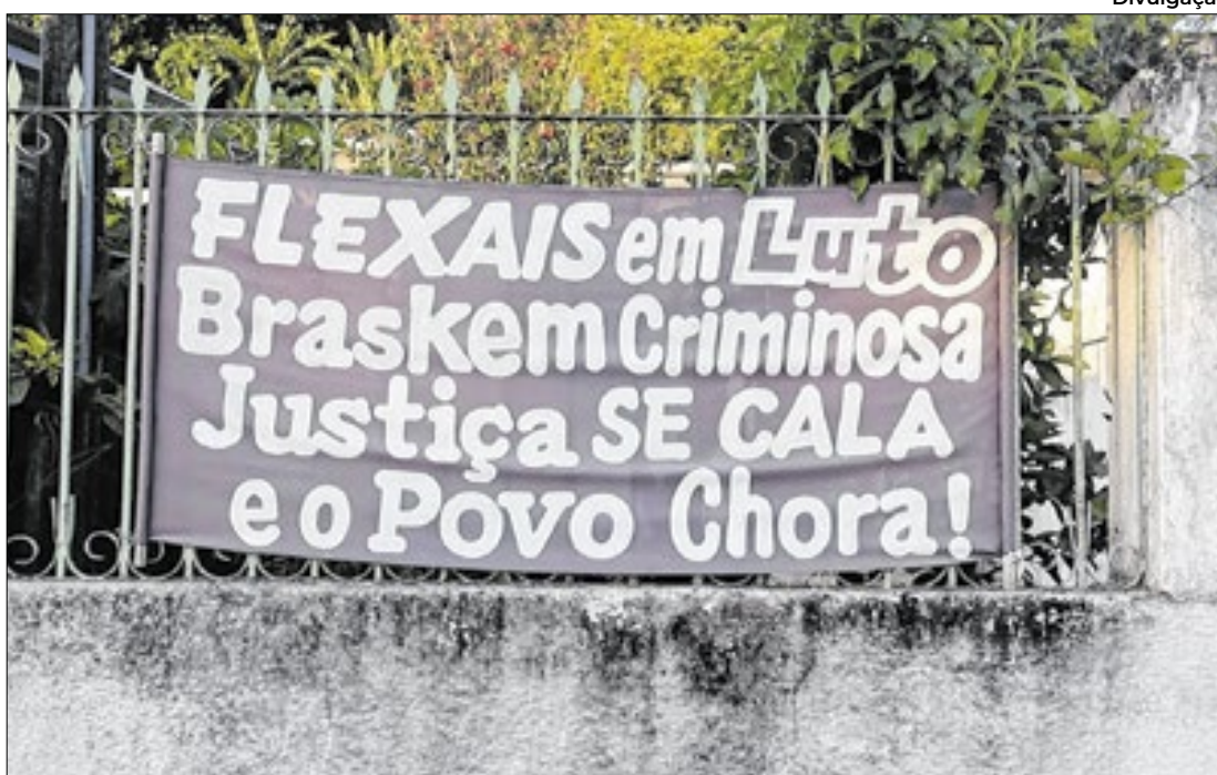
Após a exibição do filme, haverá um debate com a participação de moradores

Filme sobre maior crime socioambiental será exibido no dia 25