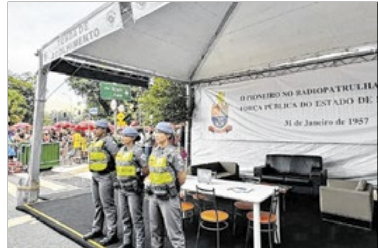
Objetivo é ter um ambiente acolhedor para denúncias

megablocos, que têm previsão de atrair cerca de 500 mil pessoas por dia.