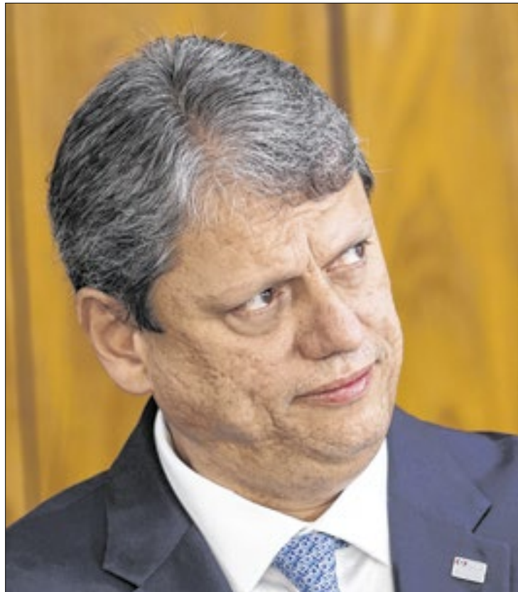
Tarcísio afirma que disputará a reeleição em São Paulo

“Nossa responsabilidade é trabalhar para que em 2026 a prosperidade e a esperança retornem. E a nossa esperança é a maior liderança da direita, que hoje está no PL e que vai voltar a ser o nosso presidente da República, que é Jair Messias Bol-