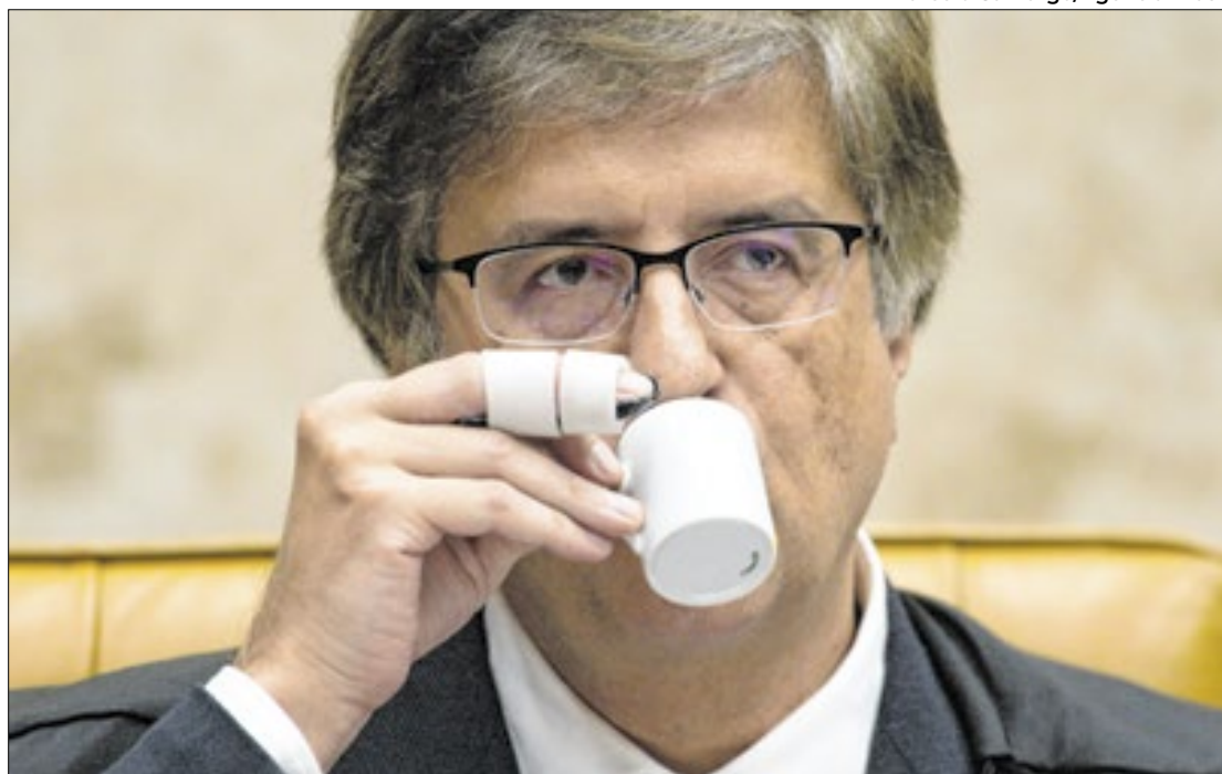
Expectativa de que Gonet apresente denúncia até quarta-feira

A oposição já se prepara para a manifestação do procurador-geral da República, Paulo Gonet. Segundo interlocutores do ex-presidente, a direita precisa aguardar o parecer para entender seu conteúdo e, a partir disso, posicionar-se. No entanto, eles já estão “prontos para rebater as acusações”. Nos bastidores, a expectativa é de que a denúncia seja formalizada até o fim de fevereiro, antes do carnaval. De acordo com informações do Metrôpoles, a previsão é que isso ocorra até quarta-feira (19), quando Lula participará de um jantar com os ministros do Supremo Tribunal Federal (STF), na casa do presidente da Corte, Luís Roberto Barroso. Gonet também foi