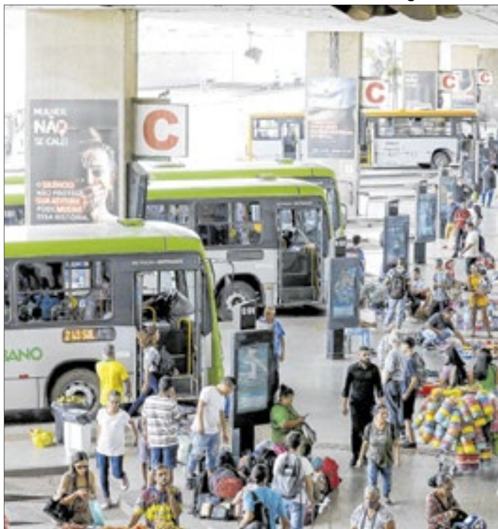
A maior renda média registrada foi em 2015, de R$ 5.590

A pesquisa mostrou que, apesar do bom desempenho do Distrito Federal, o valor re-