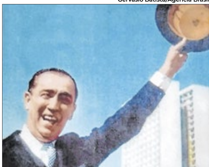
Morte de JK foi mesmo um acidente?