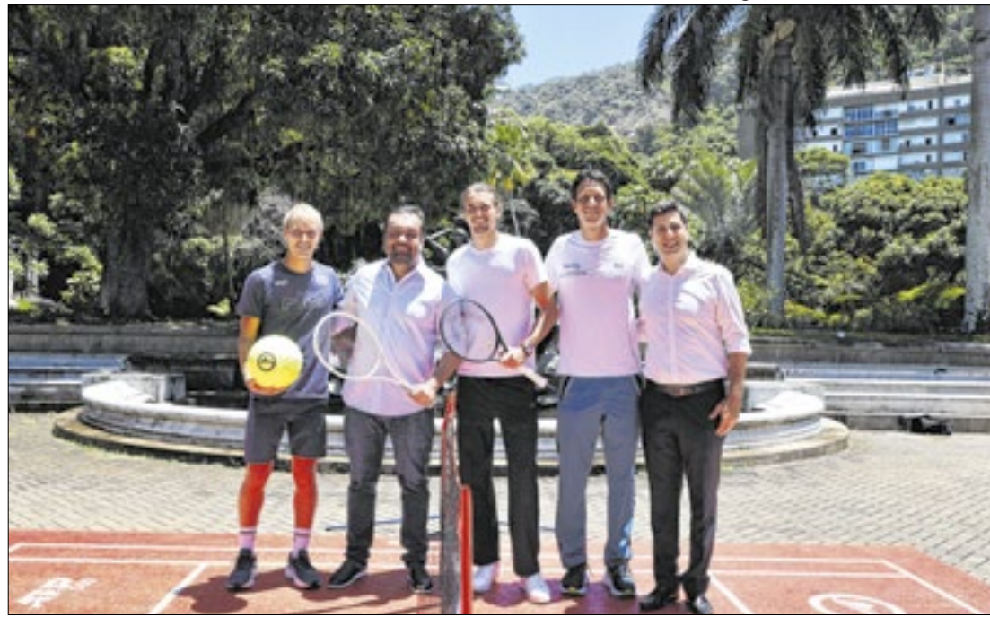
Evento tem apoio da Lei Estadual de Incentivo ao Esporte, com aporte de R$ 17,6 milhões

Foi dada a largada para a chave principal do Rio Open, o principal torneio de tênis da América do Sul, por ser ATP 500. A cerimônia de abertura do evento aconteceu nesta segunda-feira (17), no Palácio Guanabara, e contou com a participação do governador Cláudio Castro, acompanhado do secretário de Esporte e Lazer, Rafael Picciani, e da comitiva do Rio Open. A cerimônia também contou com a presença