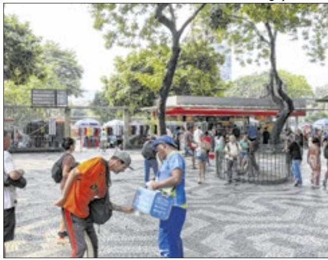
Cedae leva "Frota da Hidratação" a pontos da cidade