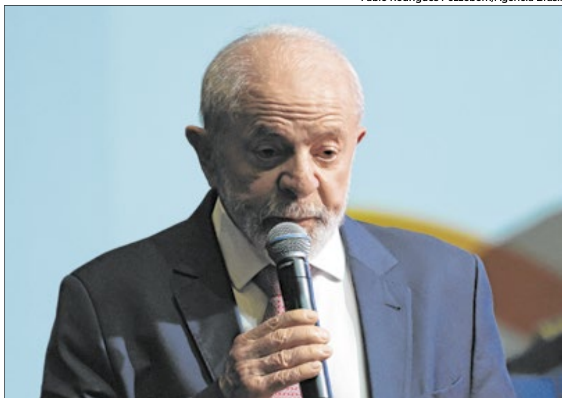
Para Kakay, Lula está “encastelado” em seu terceiro mandato

A carta foi publicada dois dias após a Pesquisa Datafolha apontar que 41% da população reprovam o governo Lula, enquanto 24% aprovam. É o