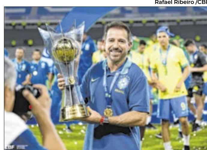
A trajetória de Ramon de Menezes é 'curiosa' na CBF

Contestado, Ramon de Menezes viu seu trabalho com a Seleção Brasileira começar da pior forma possível no Sul-Americano Sub-20, com uma derrota por 6 a 0 para a Argentina. Porém, a Seleção deu a volta por cima e conquistou o título, tendo como vice justamente a seleção da Argentina.