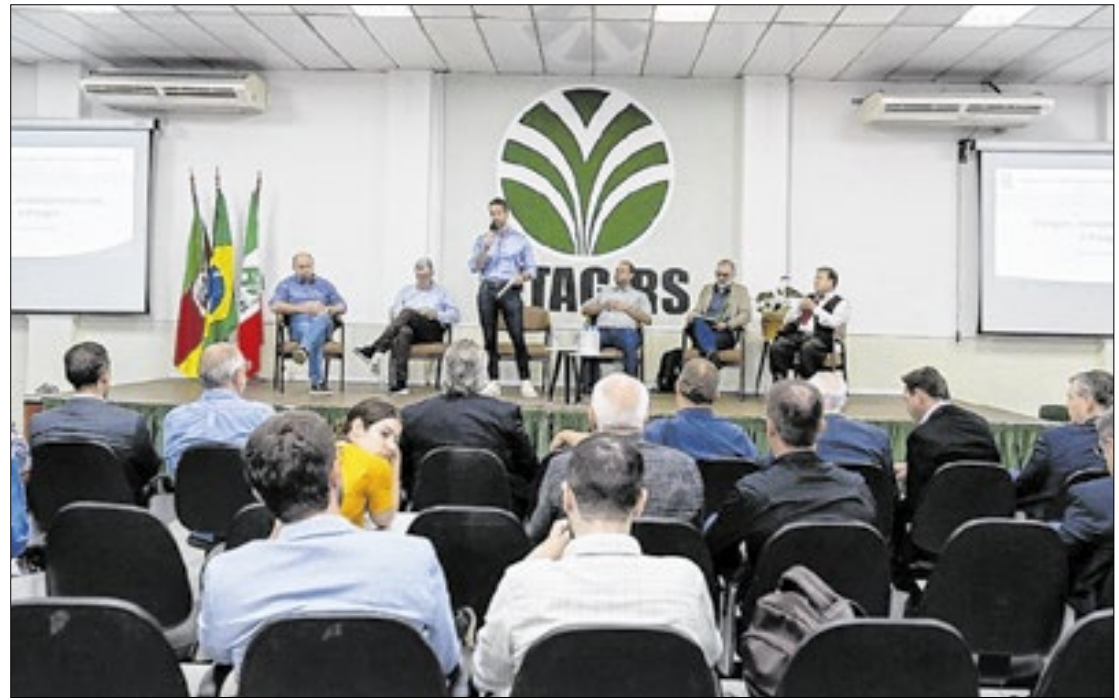
Foram discutidas soluções para agricultura familiar e o agravamento do endividamento.

Leite reafirmou que o Rio Grande do Sul é um dos Esta-