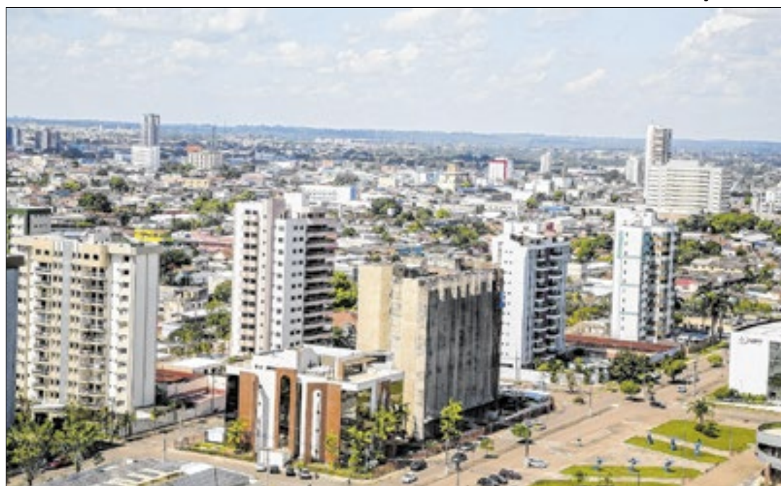
A PNAD apontou que a taxa média de desemprego no Brasil em 2024 foi o menor na história

O desempenho de Rondônia no combate ao desemprego se destaca desde 2022, quando passou a figurar entre os três estados com as menores taxas de desocupados.