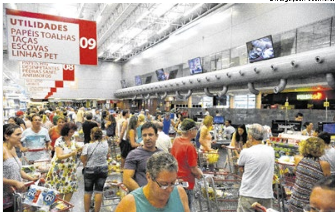
Das oito atividades econômicas pesquisadas, seis apresentaram crescimento em 2024

Em relação a novembro, 20 unidades da federação tiveram queda nas vendas. Na passagem de novembro para dezembro, as vendas do comércio varejista mostraram recuo em 20 das 27 unidades da federação, com destaque