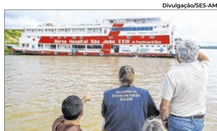
Evento reúne gestores para alinhar políticas e fortalecer SUS

O boletim também apontou que o coronavírus foi o vírus mais identificado nas amostras laboratoriais, com 71,9%. A FVS-RCP orienta medidas de prevenção.