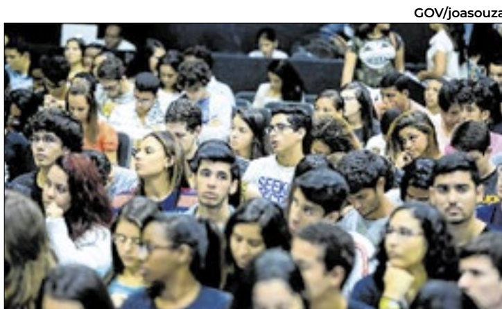
Região tem 13,5 milhões de jovens, de acordo com boletim

Para acompanhar a trajetória do filme, acesse o Instagram: @aindahamoredoresaquí.