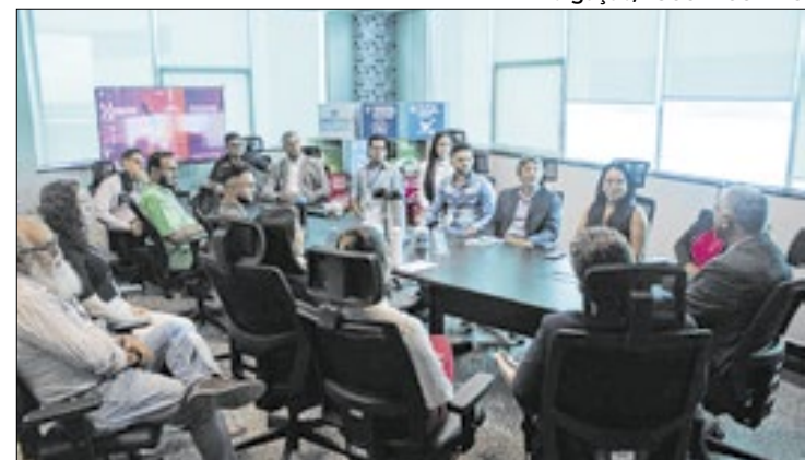
Acre e Rondônia trocam conhecimentos em auditorias