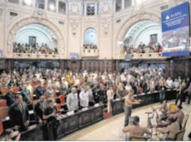
Plenário do Palácio Tiradentes com superlotação para a entrega da medalha aos homenageados