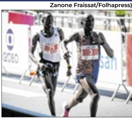
Jacob Kiplimo bateu recorde mundial

O ugandês Jacob Kiplimo fez história neste domingo (16), na meia-maratona de Barcelona. O corredor, de 24 anos, terminou a prova em 56min40s, um novo recorde mundial para a distância de 21km. A marca do atleta de Uganda supera em 50s o recorde anterior, de 57min30s, estabelecido pelo etíope Yomif Kejelcha, na meia-maratona de Valencia, em 2024. É a segunda vez que Kiplimo crava um recorde mundial da distância. Em 2021, ele havia estabelecido a marca de 57min31s em Lisboa; acabou superado por Kejelcha em 1s, quase três anos depois.