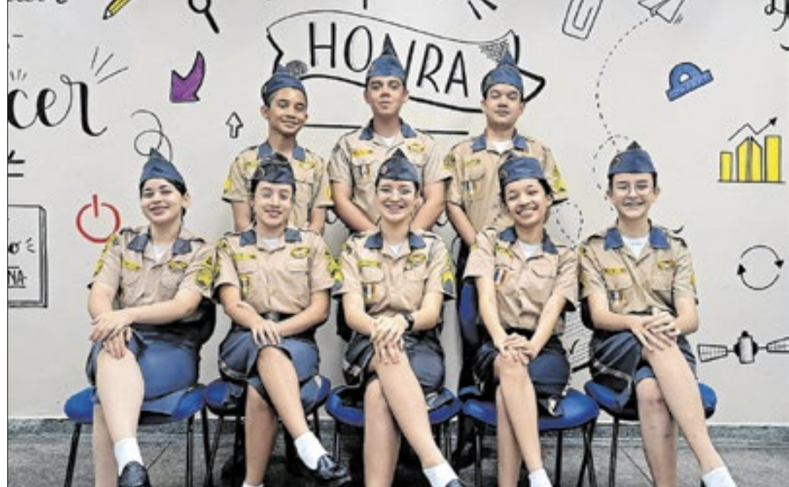
Além dos jovens do Amazonas, a delegação brasileira também é composta por mineiros

cialmente nas escolas e também em formato virtual.