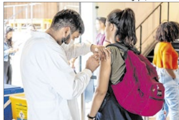
Casos confirmados levam governo a ampliar campanha