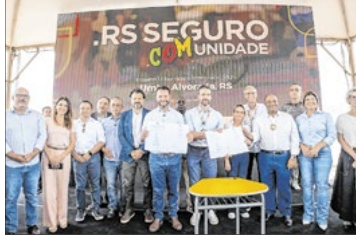
Leite assina execução de Projeto Urbanístico Integrado

O RS Seguro COMunidade é coordenado pelo RS Seguro e pela Secretaria de Desenvolvimento Urbano e Metropolitano (Sedur), com assessoramento e consultoria