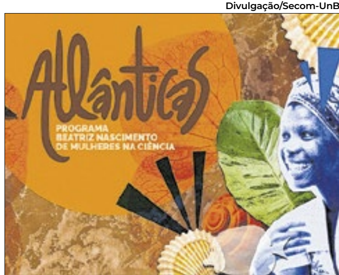
Ação apoia negras, quilombolas, indígenas e ciganas