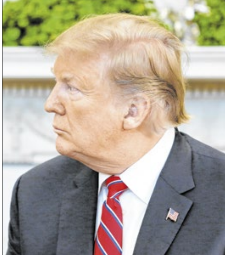
Trump torna incerto cenário com sua guerra comercial

Embora o comunicado não tenha mencionado diretamente o líder norte-americano, o grupo enfatizou que o Brasil enfrentará importantes responsabilidades sob a liderança do Brics e da COP 30 (Conferência das Nações Unidas sobre as Mudanças Climáticas), em um cenário de tensões geopolíticas que ameaçam a frágil ordem multilateral internacional. O texto alertou para os riscos do “unilateralismo insensato” e a ascensão do extremismo, que comprometem a estabilidade global e ampliam as desigualdades que afetam as populações mais vulneráveis ao redor do mundo.