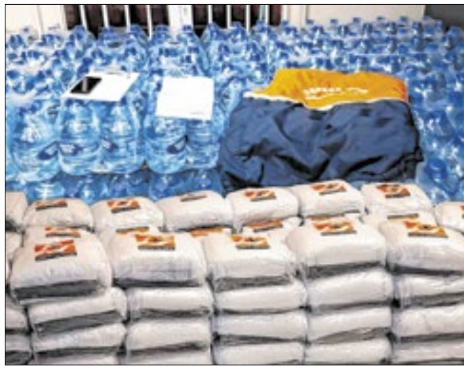
Araquari e Guaramirim passam por emergência