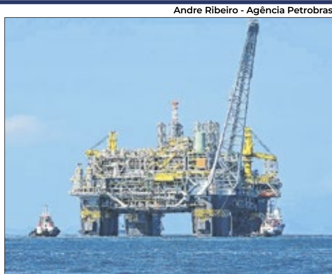
Andre Ribeiro - Agência Petrobras

Descoberta reforça meta de autossuficiência do setor