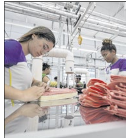
A performance segue sendo a menor