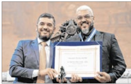
Cantor Belo recebeu a maior honraria do Estado do Rio pelos serviços prestados à música e à cultura no estado