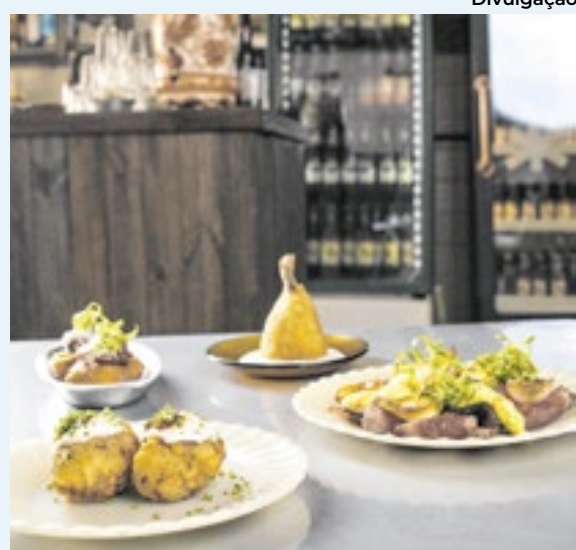
O Jurema Bar também se destaca por sua decoração que remete ao passado da região