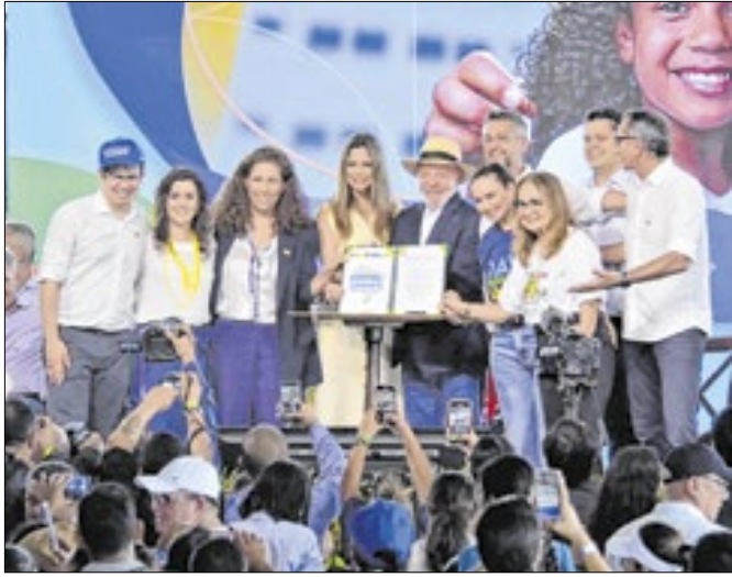
O repasse de terras totaliza mais de 600 mil hectares