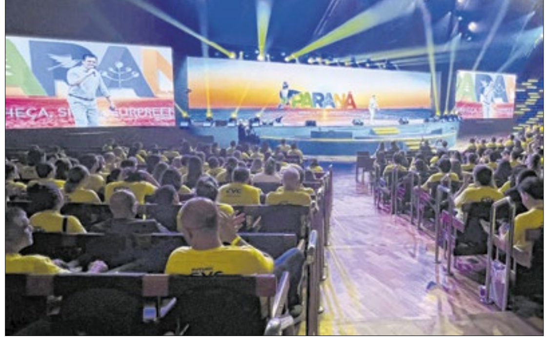
venda de pacotes para destinos paranaenses pela CVC aumentaram em 39%

No evento, representantes do Viaje Paraná puderam