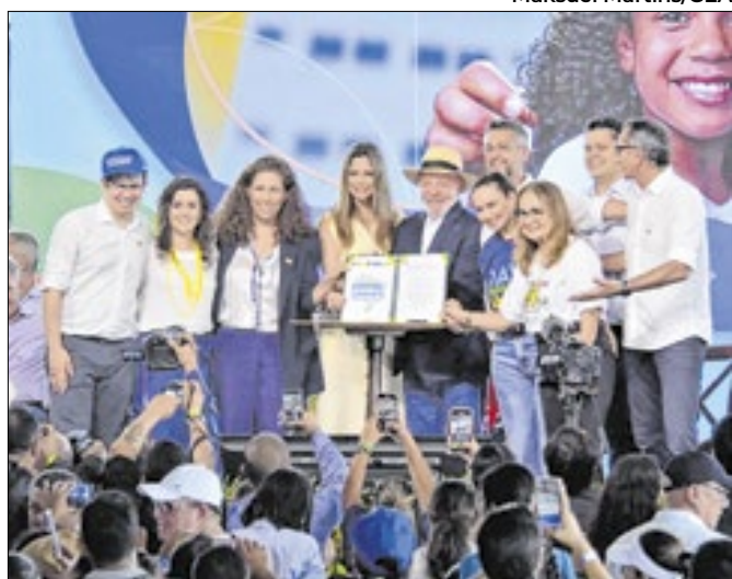
O repasse de terras totaliza mais de 600 mil hectares