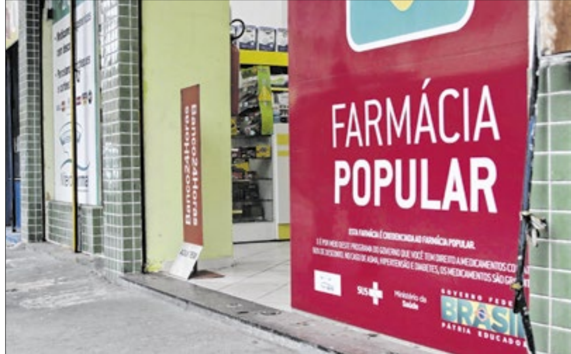
A estimativa é que a medida beneficie mais de 1 milhão de pessoas todos os anos

Em julho de 2024, o ministério já havia anunciado uma ampliação para 95% do total de itens oferecidos pelo Farmácia Popular com distribuição gratuita em unidades credenciadas. À época, medicamentos para tratar colesterol alto, doença de Parkinson, glaucoma