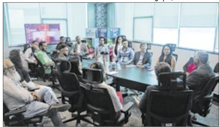
Acre e Rondônia trocam conhecimentos em auditorias