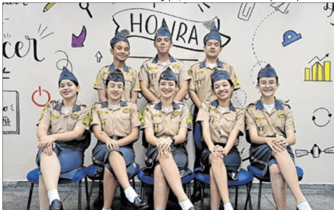
Além dos jovens do Amazonas, a delegação brasileira também é composta por mineiros

cialmente nas escolas e também em formato virtual.