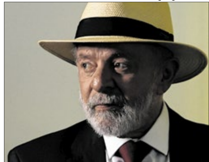
Mudanças no sistema foram mal recebidas