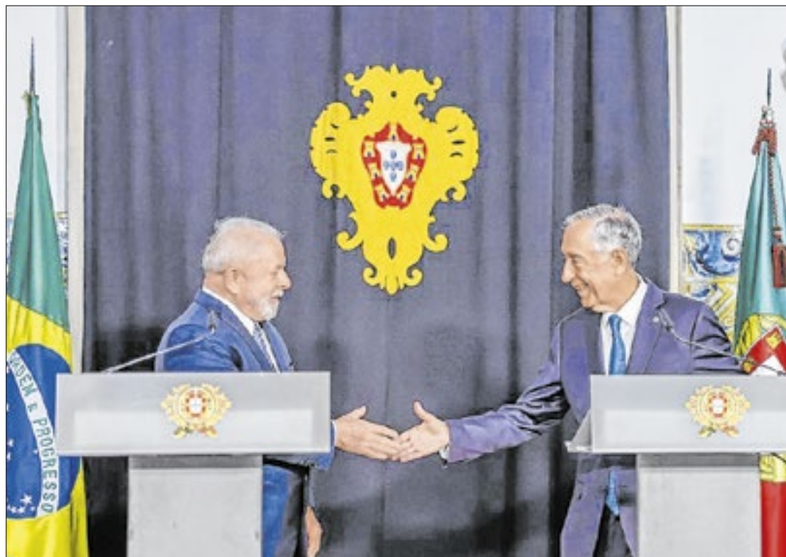
Lula recebe presidente de Portugal esta semana

Nesta segunda-feira (17), o presidente Luiz Inácio Lula da Silva (PT) receberá o presidente de Portugal, Marcelo Rebelo de Sousa, e na terça-feira (18), o primeiro-ministro