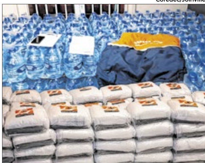
Araquari e Guaramirim passam por emergência