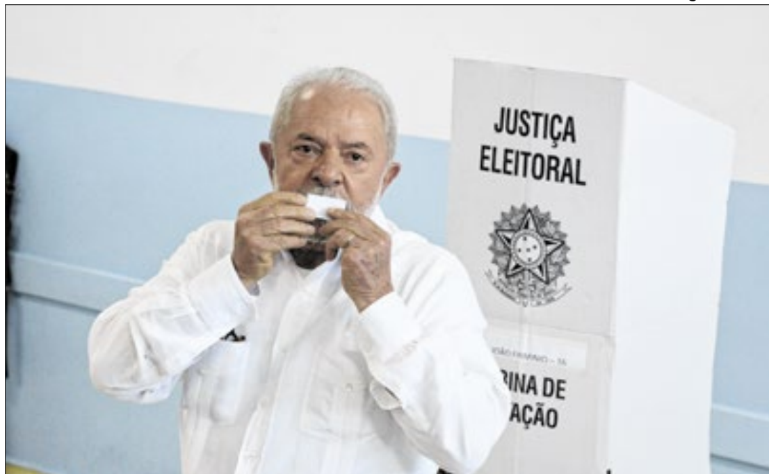
Lula poderá ficar fora do páreo eleitoral de 2026?

Ele também mencionou sua recuperação após o acidente doméstico ocorrido em outubro de 2024, quando sofreu um tombo que resultou em uma hemorragia intracraniana, necessitando de cirurgia de emergência. “Se eu estiver com 100% de saúde, se eu estiver com a energia que eu tenho hoje, inclusive de cabeça limpa. Sabe por quê? Eu caí um tombo em outubro de 2024, machuquei a cabeça, e eu fiz um tratamento, limpei a cabeça. Tirei tudo o que era bobagem que tinha na cabeça,