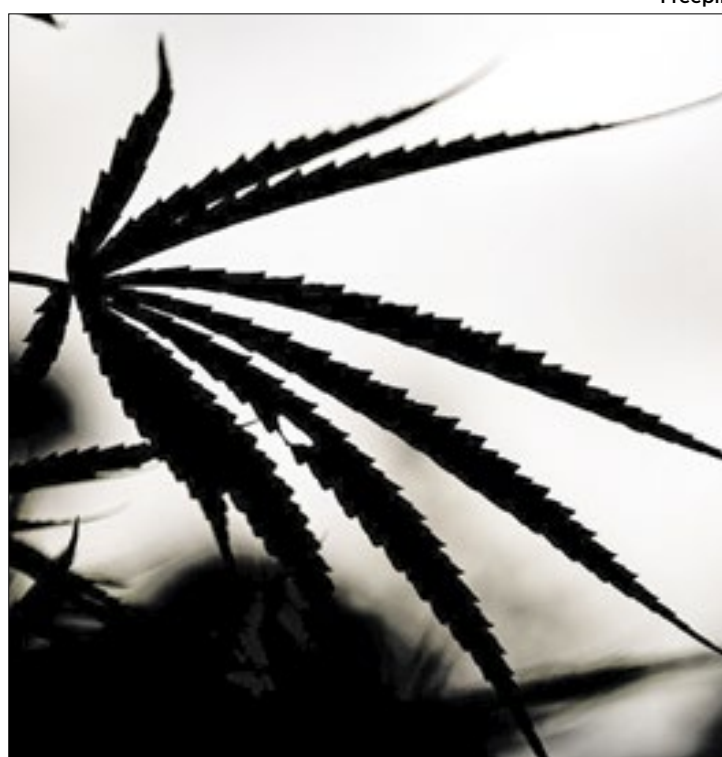
STF difere usuário e traficante de maconha

Vale destacar que a decisão do Supremo não legaliza o porte e a posse de cannabis