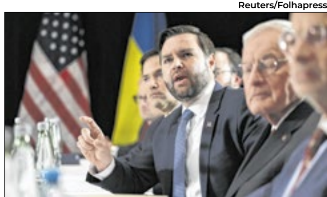
Discurso de JD Vance ligou alerta