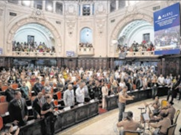
Plenário do Palácio Tiradentes com superlotação para a entrega da medalha aos homenageados