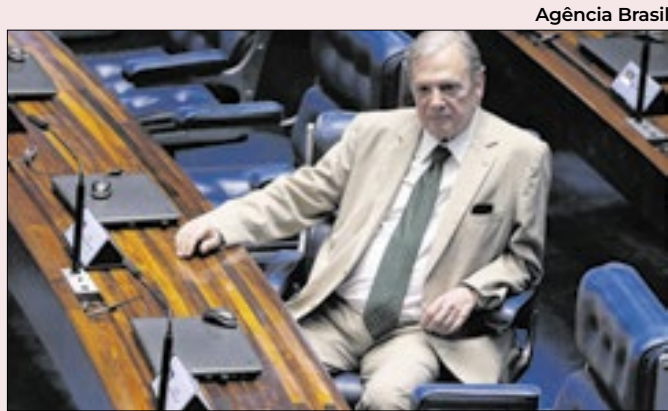
Proposta de Jereissati está parada na Câmara

O que essa lei deveria propor? Exatamente critérios mais claros, transparentes e rastreáveis, de elaboração das leis orçamentárias. Uma minuta de projeto nesse sentido dorme em alguma gaveta da Esplanada dos Ministérios esperando chegar à mesa do presidente.