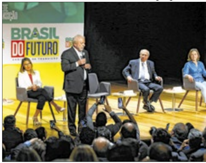
Projeto sobre orçamento foi proposto na transição