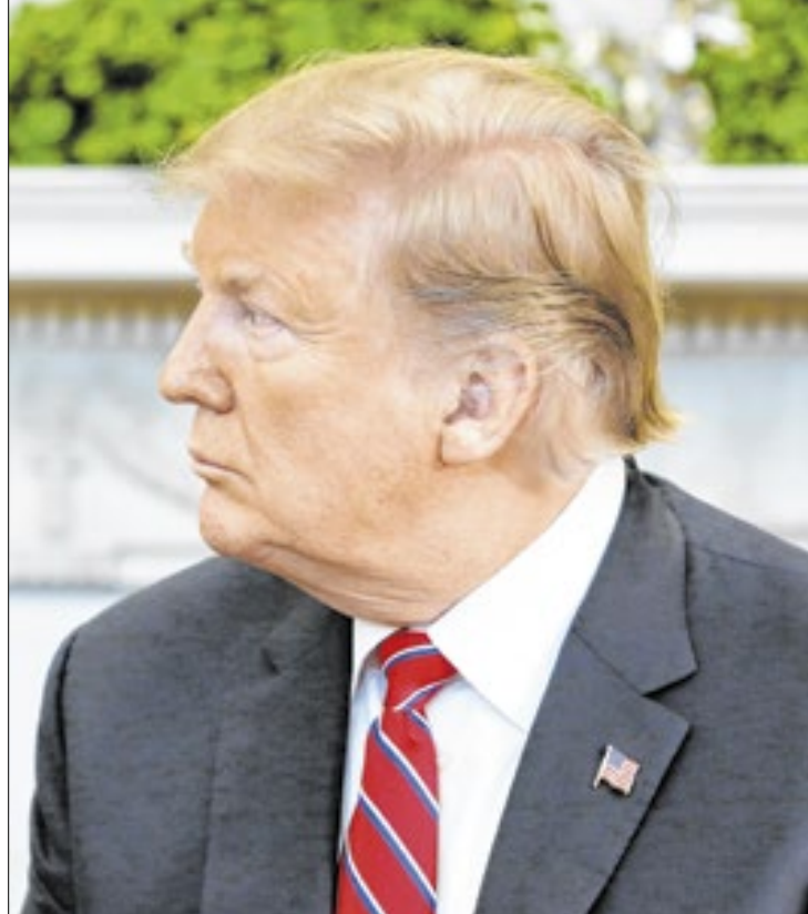
Trump torna incerto cenário com sua guerra comercial

Embora o comunicado não tenha mencionado diretamente o líder norte-americano, o grupo enfatizou que o Brasil enfrentará importantes responsabilidades sob a liderança do Brics e da COP 30 (Conferência das Nações Unidas sobre as Mudanças Climáticas), em um cenário de tensões geopolíticas que ameaçam a frágil ordem multilateral internacional. O texto alertou para os riscos do “unilateralismo insensato” e a ascensão do extremismo, que comprometem a estabilidade global e ampliam as desigualdades que afetam as populações mais vulneráveis ao redor do mundo.