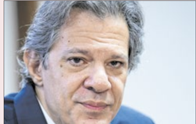
Crise complicou eventual candidatura do ministro