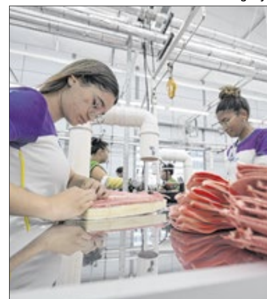
A performance segue sendo a menor