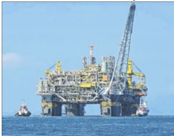
Descoberta reforça meta de autossuficiência do setor