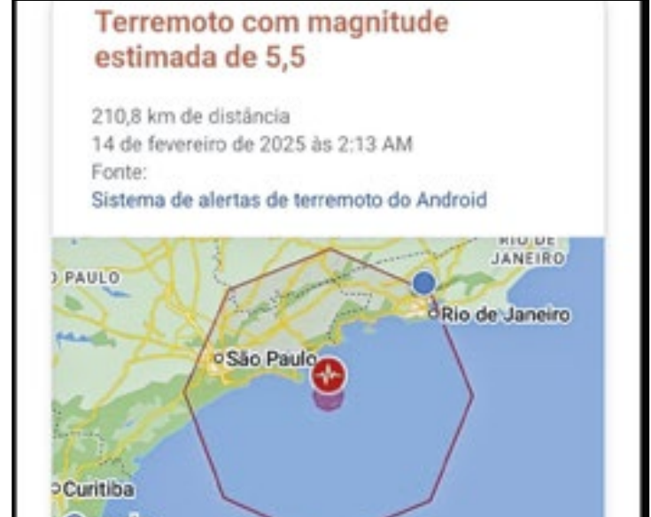
Companhia investiga a falha e pede desculpas

Embora a Defesa Civil do estado de São Paulo, o Centro de Sismologia da Universidade de São Paulo (USP) e a Rede Sismográfica Brasileira