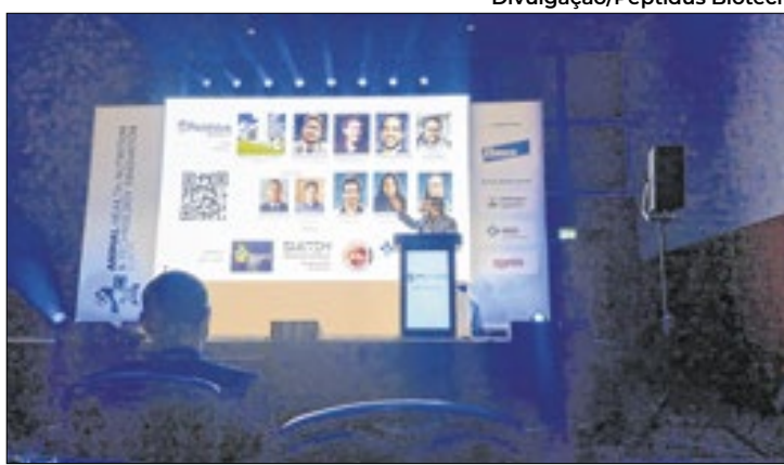
Peptidus Biotech representou o Brasil em mundial