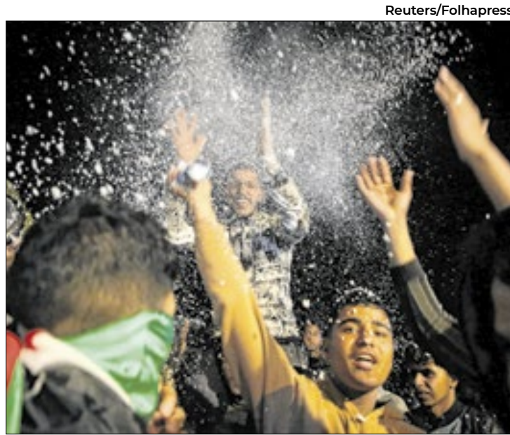
Após cessar-fogo quase 'melar', Israel e Hamas trocam reféns

ônibus com palestinos libertados partiu da prisão de Ofer, em Israel, para Ramallah, capital da Cisjordânia ocupada. O veículo chegou ao seu destino sob aplausos da multidão, que hasteava bandeiras palestinas.