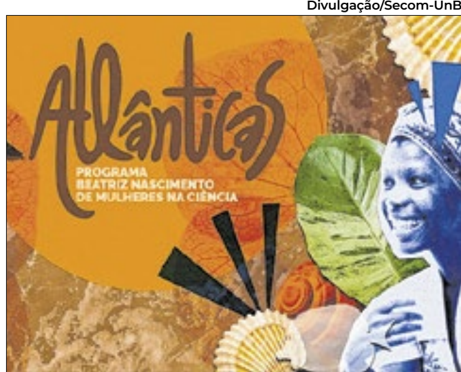
Ação apoia negras, quilombolas, indígenas e ciganas