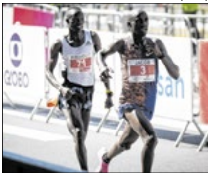
Jacob Kiplimo bateu recorde mundial

O ugandês Jacob Kiplimo fez história neste domingo (16), na meia-maratona de Barcelona. O corredor, de 24 anos, terminou a prova em 56min40s, um novo recorde mundial para a distância de 21km. A marca do atleta de Uganda supera em 50s o recorde anterior, de 57min30s, estabelecido pelo etíope Yomif Kejelcha, na meia-maratona de Valencia, em 2024. É a segunda vez que Kiplimo crava um recorde mundial da distância. Em 2021, ele havia estabelecido a marca de 57min31s em Lisboa; acabou superado por Kejelcha em 1s, quase três anos depois.