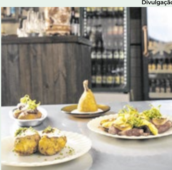
O Jurema Bar também se destaca por sua decoração que remete ao passado da região