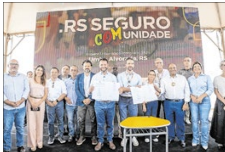
Leite assina execução de Projeto Urbanístico Integrado

O RS Seguro COMunidade é coordenado pelo RS Seguro e pela Secretaria de Desenvolvimento Urbano e Metropolitano (Sedur), com assessoramento e consultoria