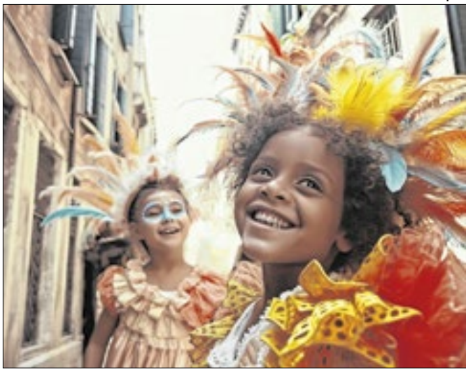
Orientação é acionar Disque 100 em caso de violações