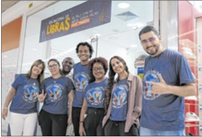
É necessário nível superior e proficiência em Libras