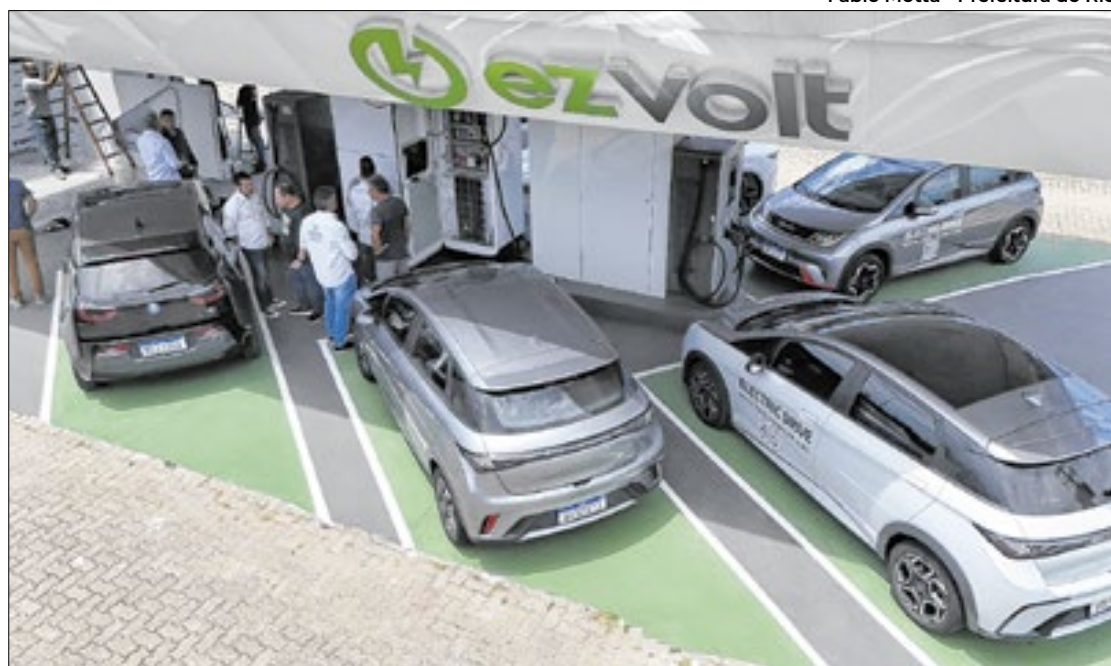
Primeiro eletroposto do país, na Barra da Tijuca (Zona Sul), reafirma pioneirismo do Rio

– O que a prefeitura faz é chamar os inovadores: venham cá que a gente quer fazer junto com vocês. A cidade vai apoiar, a cidade quer ser laboratório