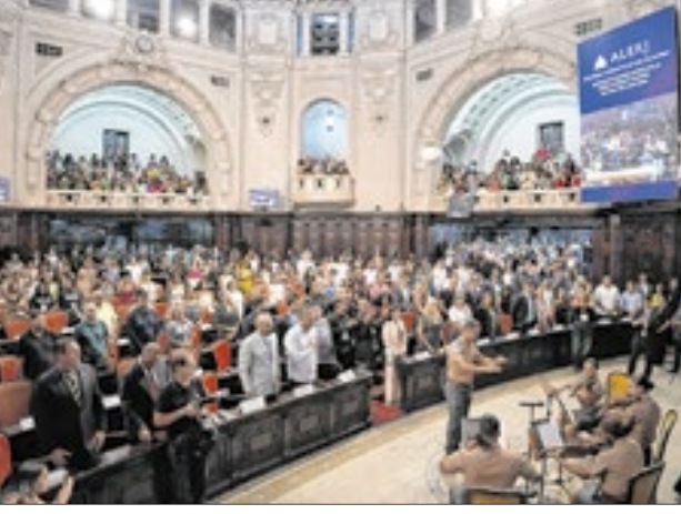
Plenário do Palácio Tiradentes com superlotação para a entrega da medalha aos homenageados