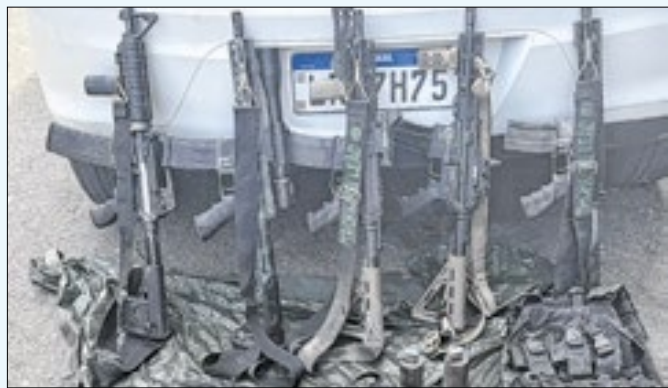
Armamento apreendido denuncia poder de fogo do tráfico