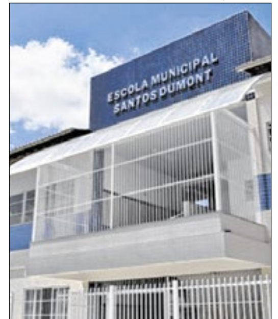
Mudança em escolas vale por uma semana