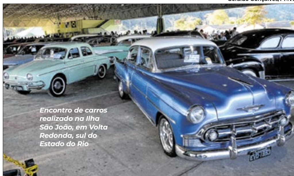
Encontro de carros realizado na Ilha São João, em Volta Redonda, sul do Estado do Rio

Os encontros surtiram efeitos e os sonhos saíram do papel: a entidade foi formalizada como uma instituição sem fins lucrativos e legalizada. E