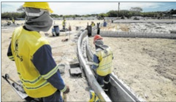
A maior área de lazer da região Leste Fluminense