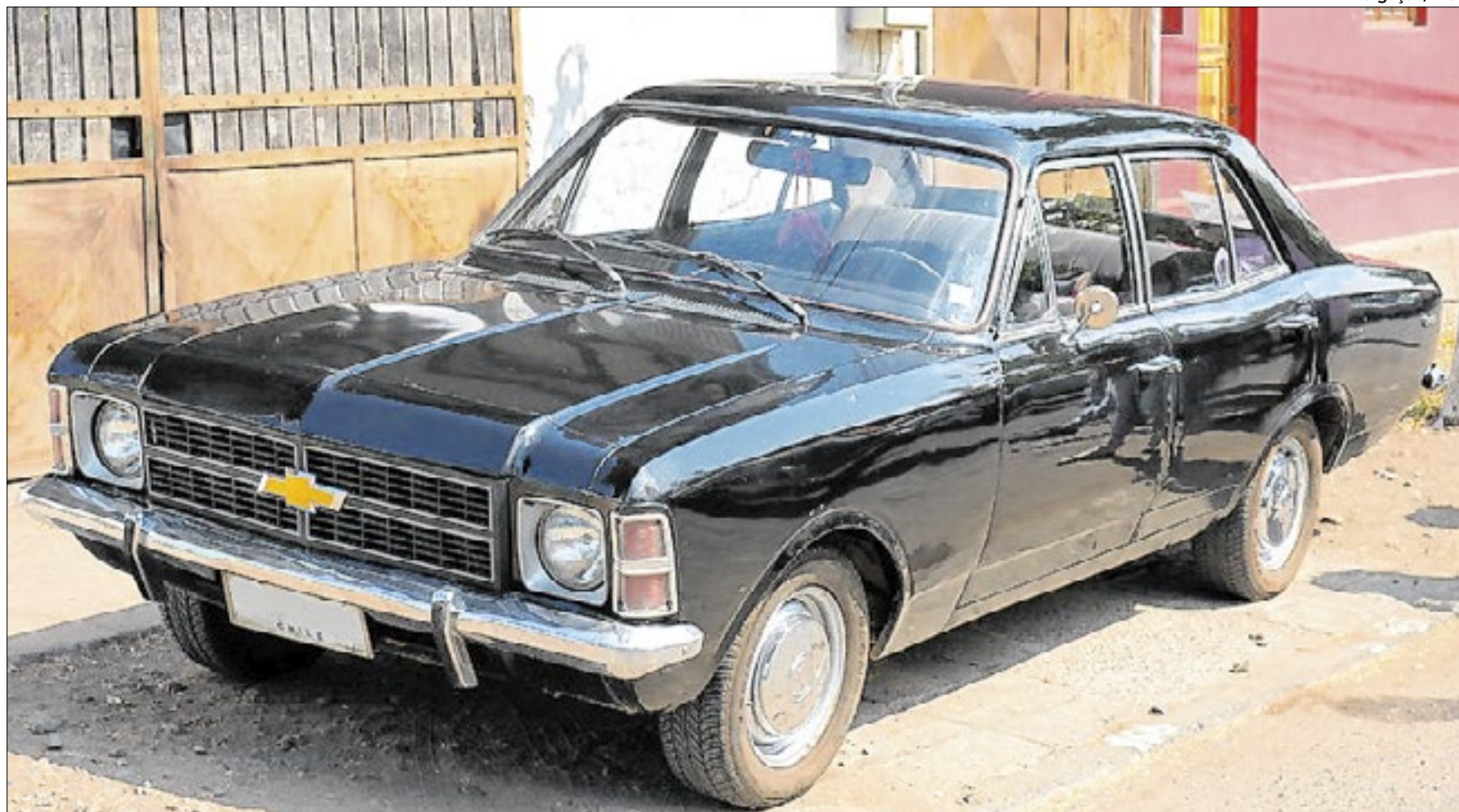
Chevrolet Opala é um dos clássicos dos anos 90 cobiçado por várias gerações

Suspensa desde 1976, a entrada de carros estrangeiros foi reaberta em