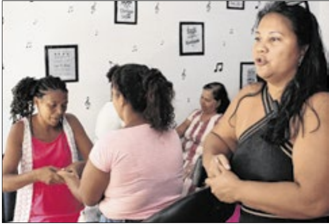
Nova Iguaçu oferece oficina de massagem gratuita