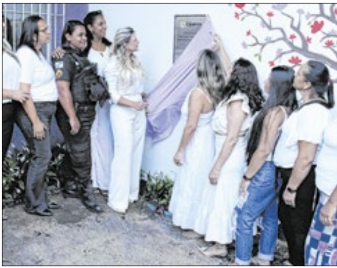
Memorial presta homenagem às vítimas de violência