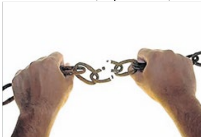
Mulher ficou em regime de cárcere privado por 72 anos