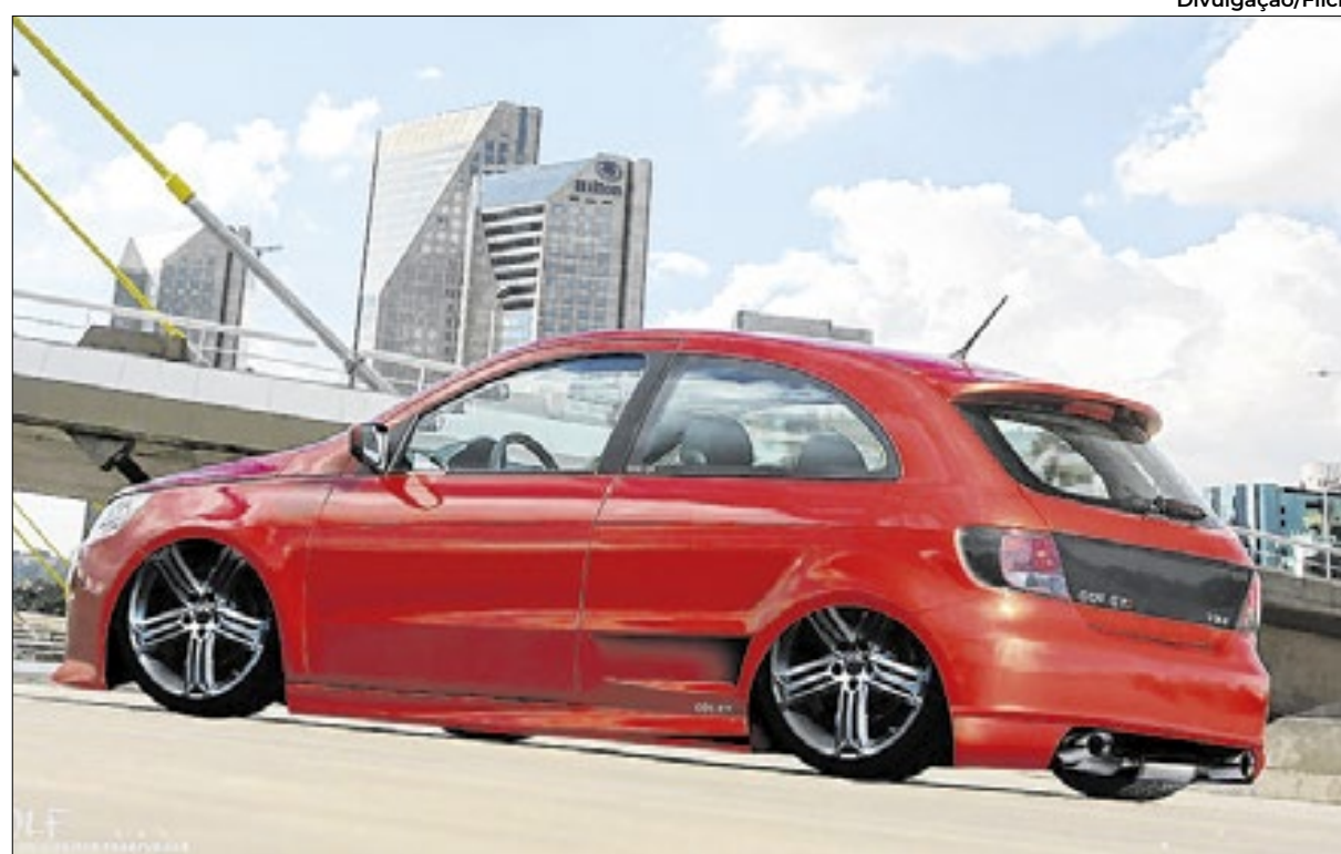
Gol GTI é um dos preferidos dos apreciadores de carros que gostam de personalizá-los

Custo de manutenção precisa entrar na conta na hora de colecionadores adquirirem veículos