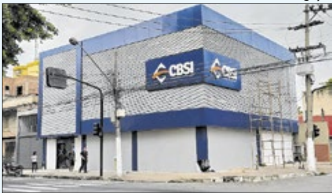
Sede da CBSI, em Volta Redonda