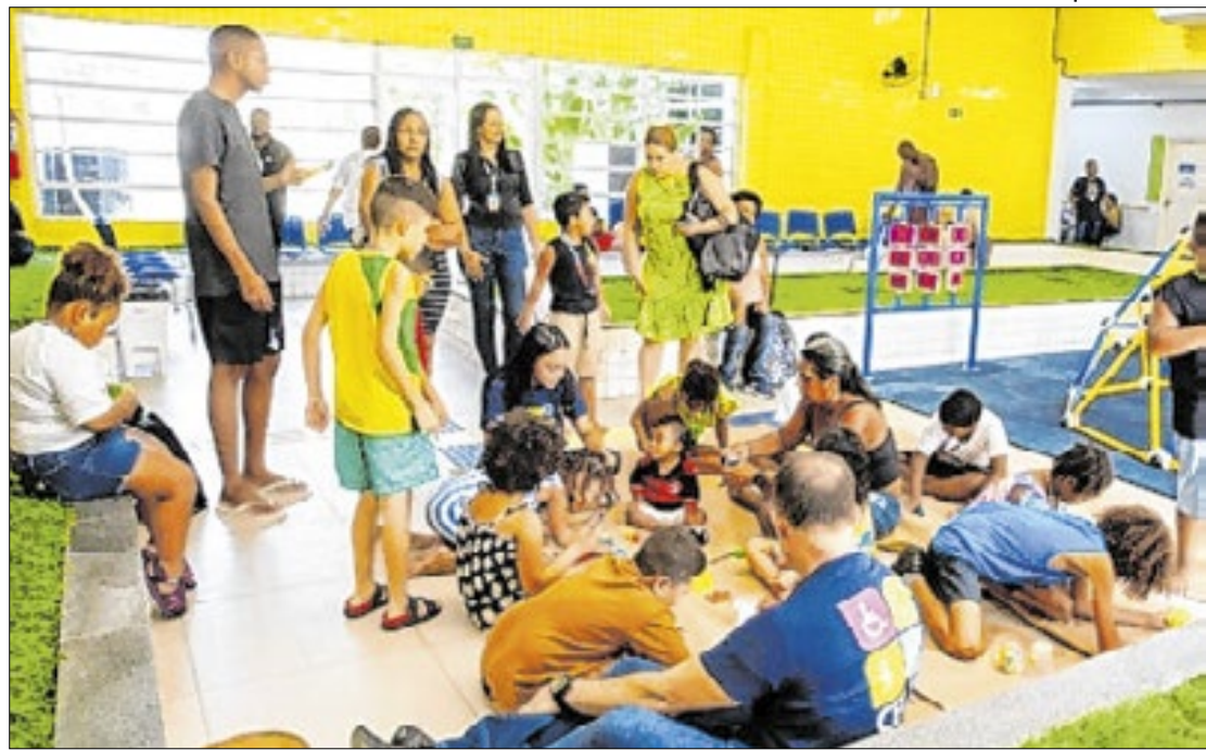
Centro Especializado em Reabilitação IV será reformado para melhorar o atendimento

"Vamos aprimorar a estrutura das salas, tornando-as mais acolhedoras e humanizadas. Além disso, temos uma gestão dedicada a garantir que todos os pacientes sejam bem atendidos e recebam o cuidado que merecem. Destaco ainda a equipe de médicos especializados, inclu-