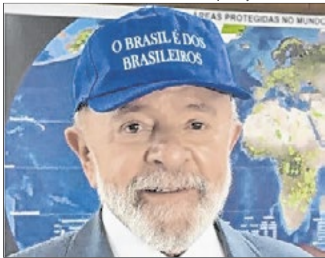
Lula aterrissa em Angra dos Reis nesta segunda-feira