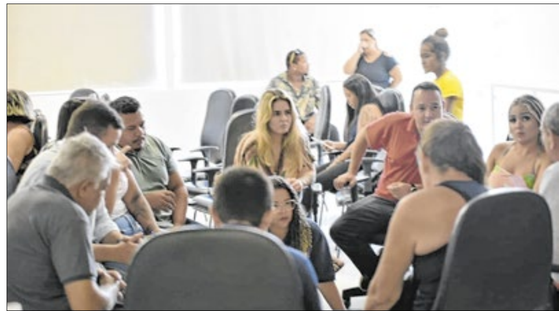
Capacitações foram apresentadas aos representantes de comunidades pesqueiras