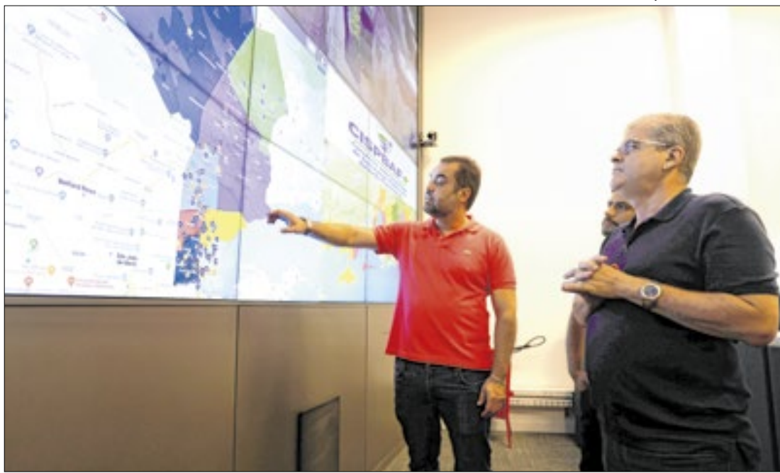
Cláudio Castro, em visita ao centro de controle em Duque de Caxias, reforça que a integração representa mais proteção à população fluminense

totalizando quase 800 mil metros cúbicos. A utilização será principalmente para limpeza e manutenção do espaço. "Estamos empenhados no avanço desse projeto, que é de suma importância para o bem-estar da população", disse o secretário Douglas Ruas.