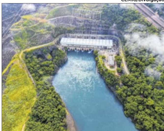
Companhia é reconhecida por ações sustentáveis