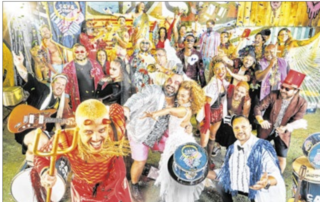
Para esta edição de 2025, o "Casa Comigo" terá como tema Carnaval 90

No dia 22 de fevereiro de 2025, sábado de pré-carnaval, o Bloco Casa Comigo desfila pelas ruas de São Paulo celebrando com a energia e malícia dos anos 90. O tema do ano, Carnaval 90, inspirado pela década que misturou sons e estilos de forma única, trará um desfile repleto de nostalgia em um dos maiores blocos da cidade. As atrações confirmadas são o grupo Tchakabum, misto de pagode e axé, o cantor Salgadinho,