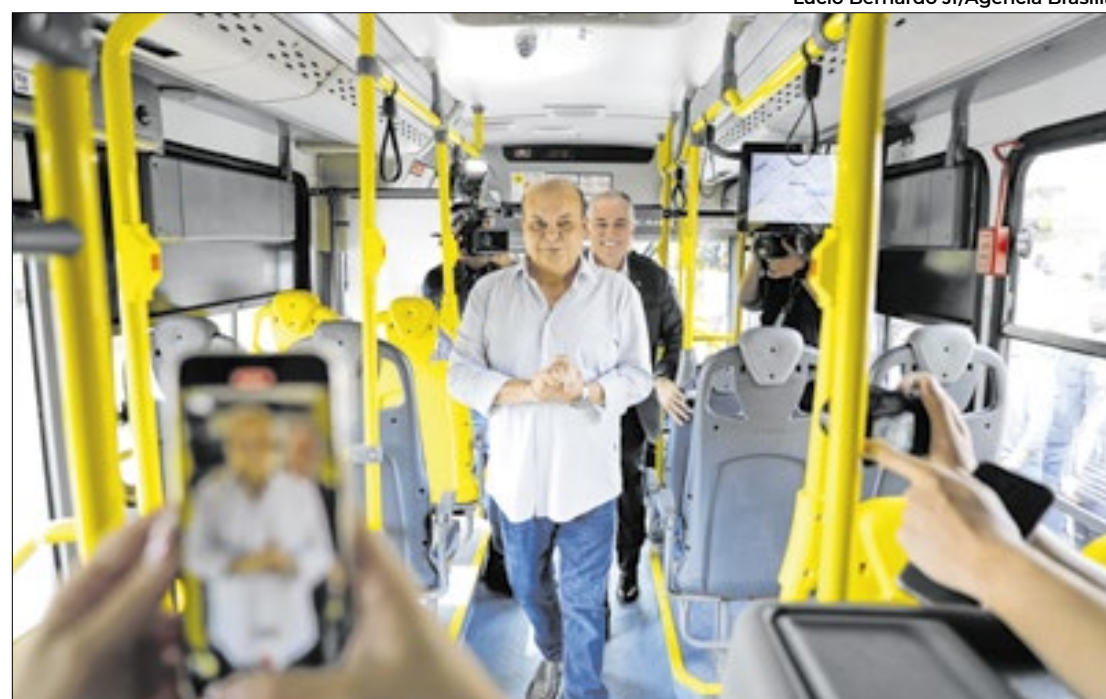
Lúcio Bernardo Jr/Agência Brasília

Medida começa em 1º de março e beneficia metrô e ônibus