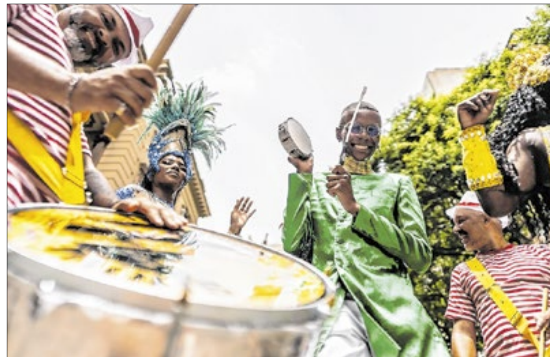
Folhões em número recorde são atraídos especialmente pelos blocos de rua

Movimentação financeira deve girar em torno R$ 6,4 bilhões