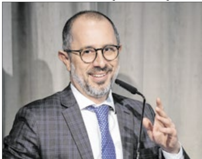
Vinicius: relatório é “conversa de boteco”