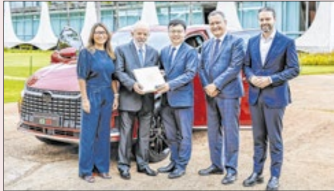
Governo usa de graça carro que isentou de imposto