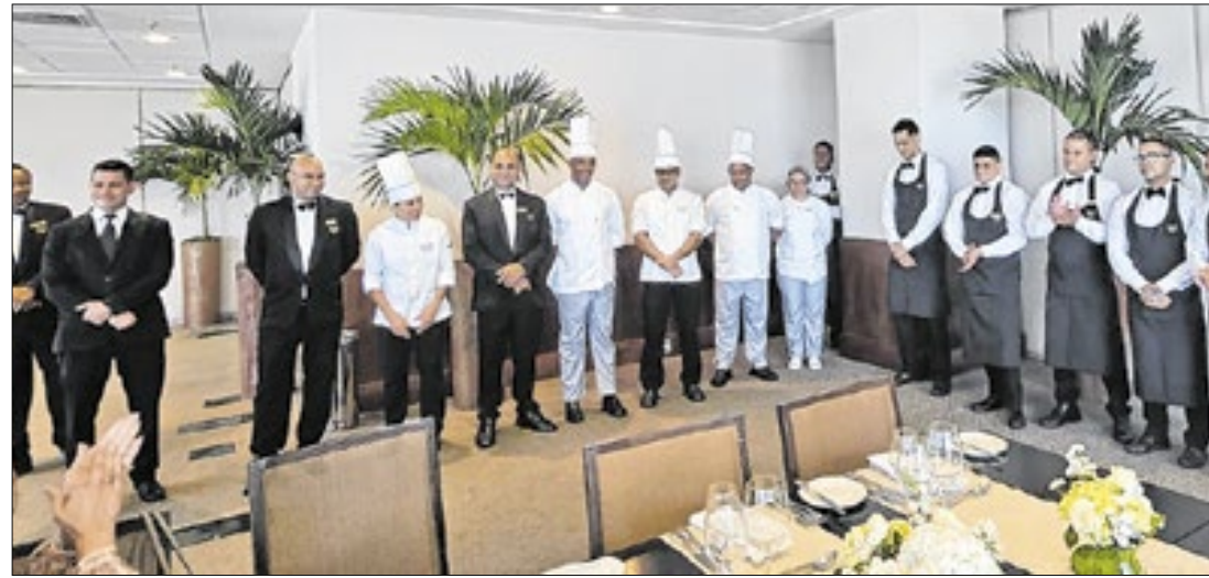
A equipe do Windsor Marapendi responsável pelo almoço aos diretores e gerentes gerais dos 5 estrelas do Rio