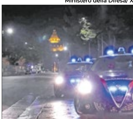
Foram presos 147 membros da máfia

A polícia da Itália prendeu 147 membros da Cosa Nostra nesta terça-feira (11), numa tentativa de dismantelar os clãs que ainda dominam Palermo, capital da Sicília. A máfia