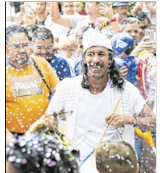
A receita turística no estado deve saltar