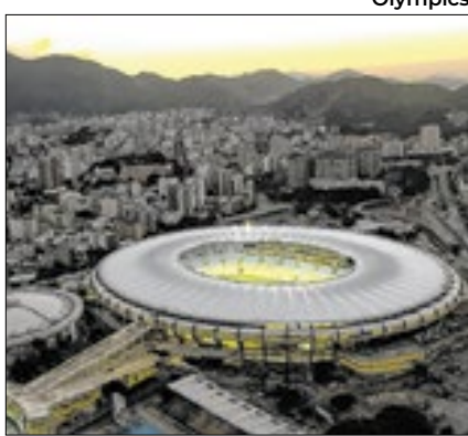
Ferj fará reunião por melhorias

A Ferj marcou uma reunião com os clubes para tratar sobre a bola e os gramados do Carioca 2025. A entidade vai juntar todos os envolvidos nesta quinta (13). E isso abrange a Penalty, fornecedora da bola, e também as empresas como a Greenleaf, responsável pelo gramado do Maracanã. Bola e gramado foram alvos de reclamações recentes. Jogadores de Flamengo e Fluminense criticaram os dois itens; e olha que a dupla gere o estádio. O Botafogo fez uma reclamação mais contundente ao estado do campo de Moça Bonita, em Bangu, após o duelo