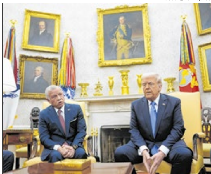
Donald Trump ameaçou pôr fim ao cessar-fogo com Hamas

O premiê de Israel, Binyamin Netanyahu, endossou a fala, dizendo na terça (11) que irá romper o cessar-fogo se o