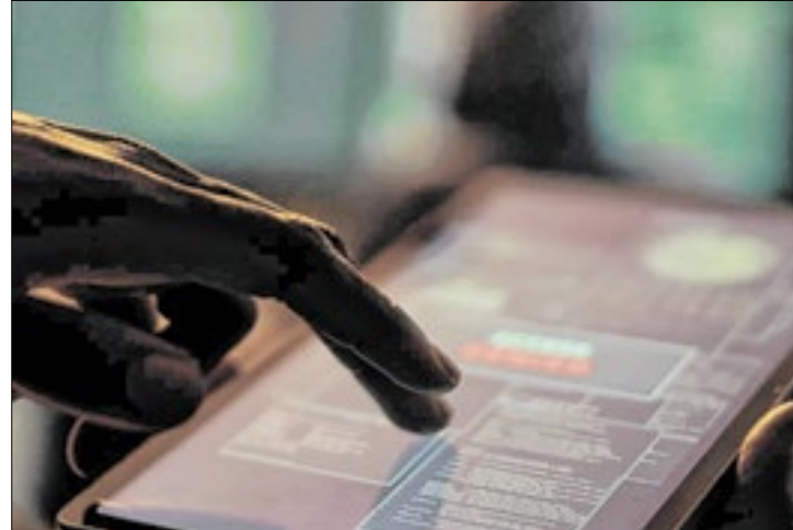
Redes sociais são usadas como iscas para conteúdo ilegal

"A série caiu em relação ao ano passado, que foi o pico da série histórica. Esse dado [de 2024] é o quarto maior da série, ou seja, o quarto maior em 19 anos. Então, o número diminuiu em relação ao ano passado, mas se você comparar com