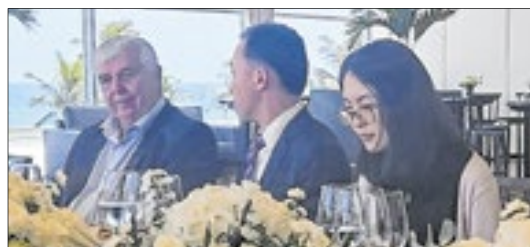
Reunião recebeu os representantes do Consulado-Geral da República Popular da China no Rio