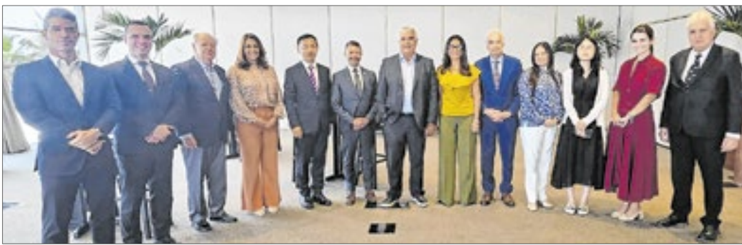
Reunião foi realizada no Windsor Marapendi Hotel, na Barra da Tijuca