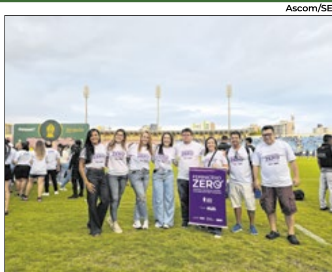
A campanha foi a base para conscientizar a sociedade