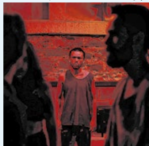
A Cia Churros de Polvo estreia, na Casa de Cultura Laura Alvim, o espetáculo 'Xadrez III' que reúne, numa só dramaturgia, textos de Plínio Marcos, a voz dos marginalizados