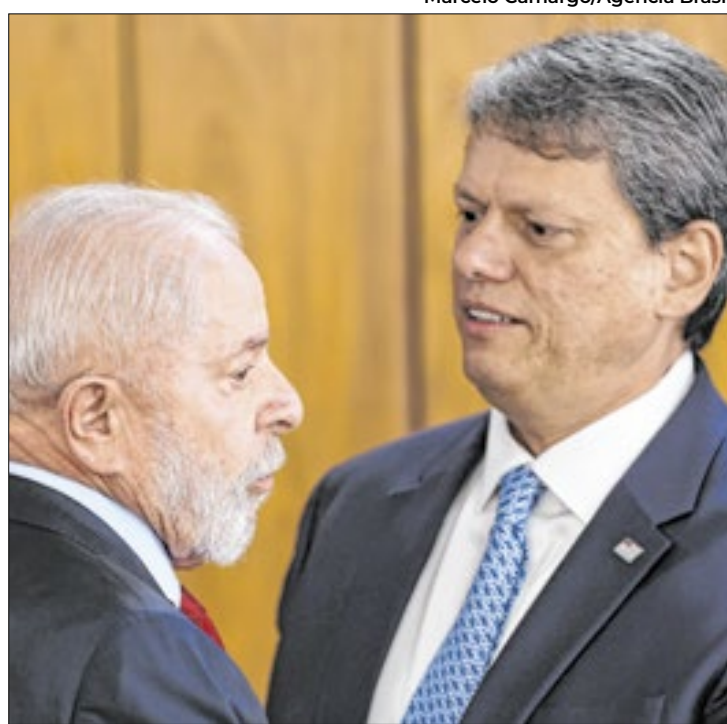
Tarcísio aparece tecnicamente empatado com Lula

A pesquisa também revelou que a avaliação geral do governo Lula atingiu o maior patamar de percepções negativas desde o início de seu mandato, com 46,5% dos entrevistados classificando sua gestão como ruim ou péssima. As perspectivas positivas caíram 3 pontos percentuais entre dezembro de