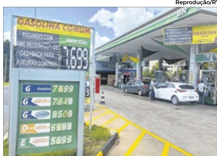
No DF, o reajuste da gasolina contribuiu para o aumento dos preços em janeiro