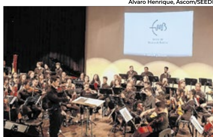
A programação de concertos e de óperas na Escola de Música de Brasília promete ser intensa em 2025

"Mais do que musicar o texto da Missa dos Mortos, Verdi consegue pôr em música os sentimentos mais ínti-