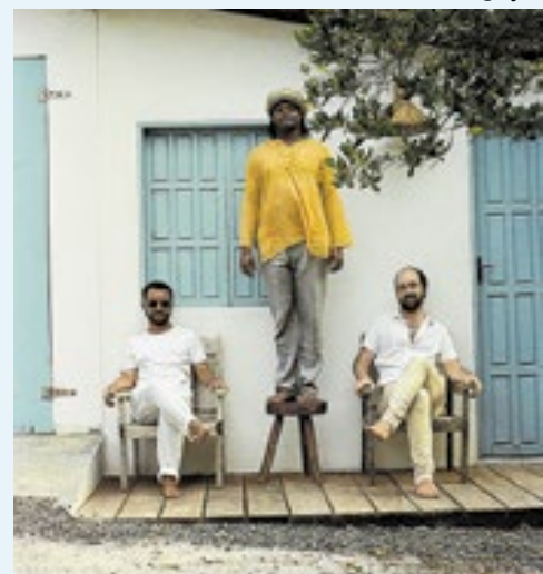
Os músicos do Mocofaia conectam a tradição rítmica e espiritual da nação Jêje com grooves eletrônicos