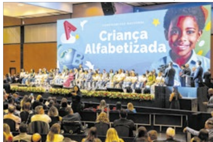
O DF tem o segundo maior índice de alfabetização do país

Criado pelo Decreto nº 45.495, de 2024, o programa oferece material pedagógico, suporte, acompanhamento e formação para professores da rede pública. O objetivo é garantir que todas as crianças estejam alfabetizadas até o fim do 2º ano do ensino fundamen-