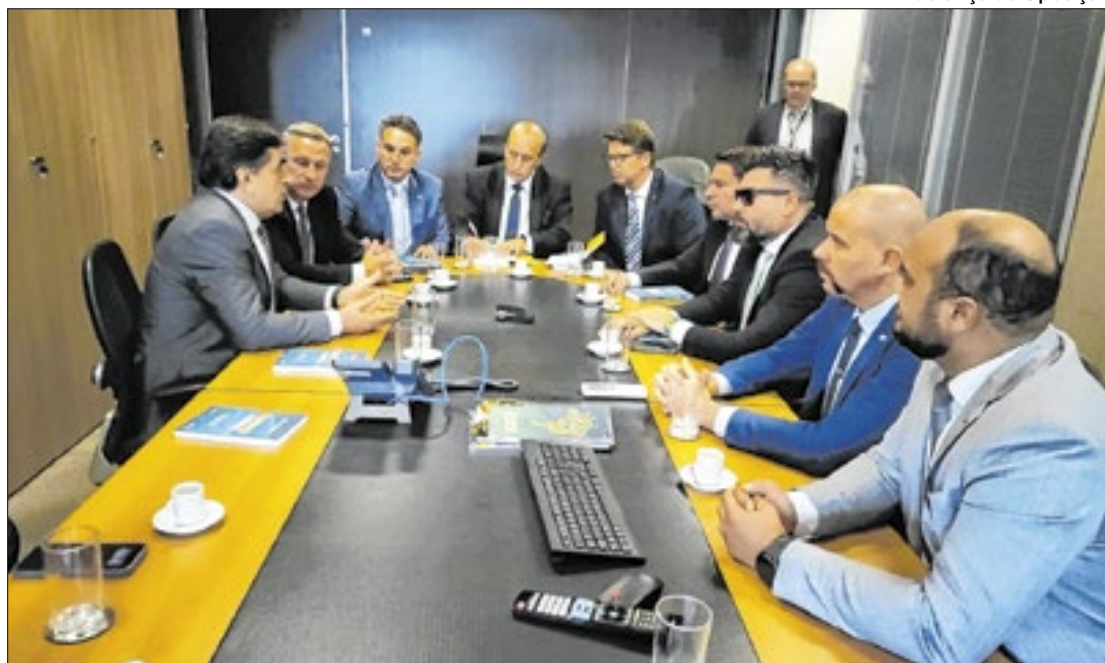
Liderança da Oposição

O governo tem pressa para a liberação dos recursos bloqueados, visto que, na próxima semana, o Executivo precisa pagar a outra parcela aos estudantes. No recurso apresentado pela AGU, a advocacia destacou que, considerando as informações prestadas