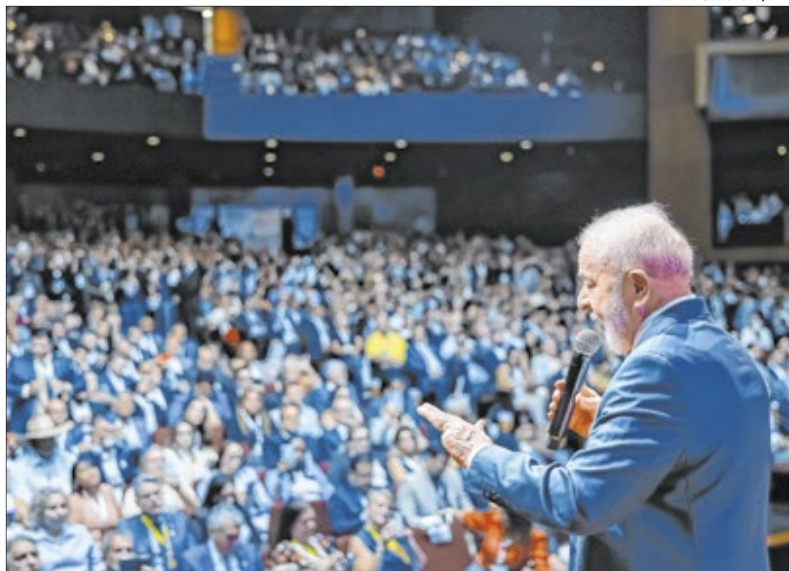
Lula: tentativa de aproximação após mau resultado eleitoral

Com o tema “A cidade que queremos está em nossas mãos”, o encontro é organizado pela Secretaria de Relações Institu-