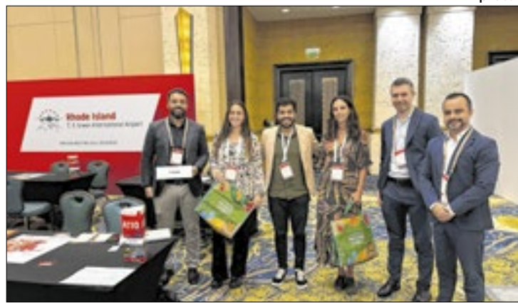
Encontro amplia conectividade aérea e fortalece turismo