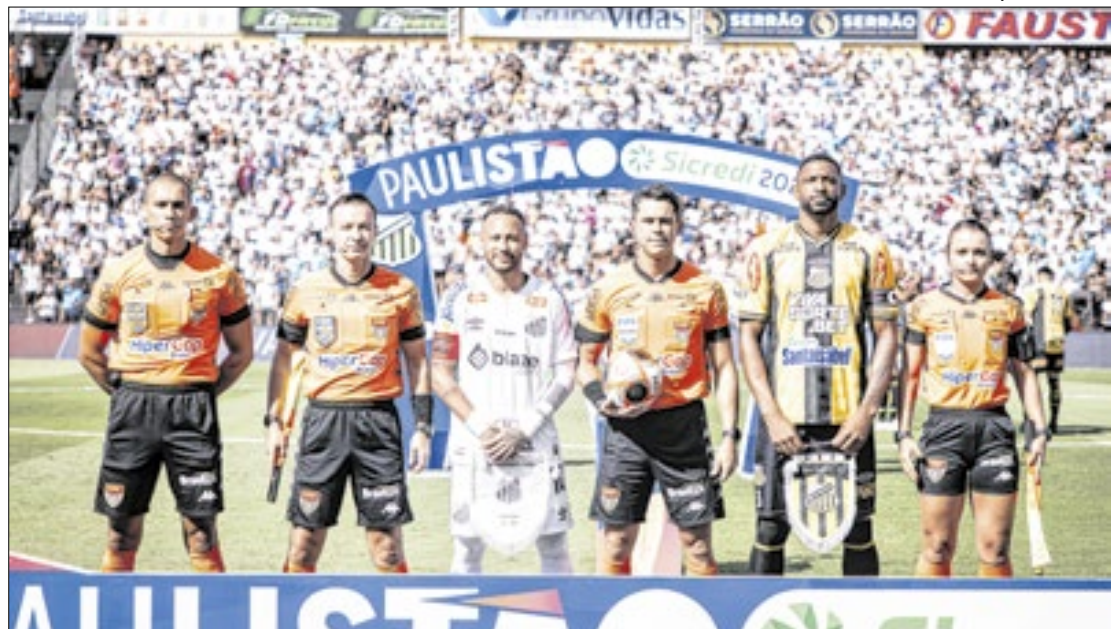
Santos vem tomando algumas precauções para evitar novas lesões em seu camisa 10

"A grama do Allianz, assim como outras, é de boa utilização. Mas, quando já tínhamos organizado junto ao Palmeiras