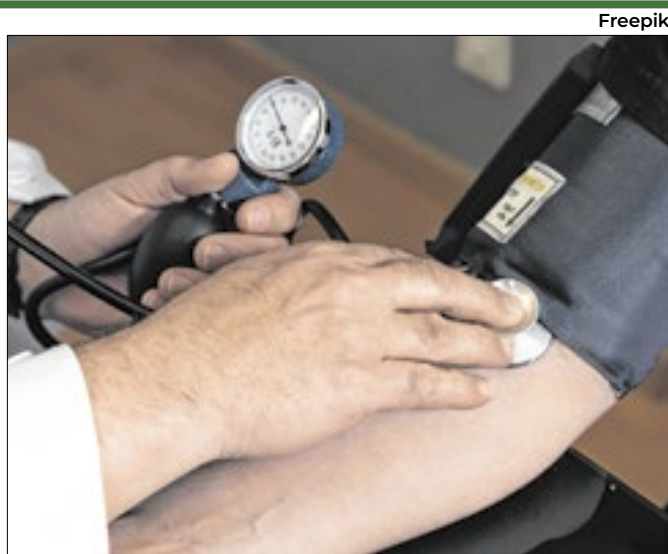
Consulta pública receberá sugestões até 4 de abril