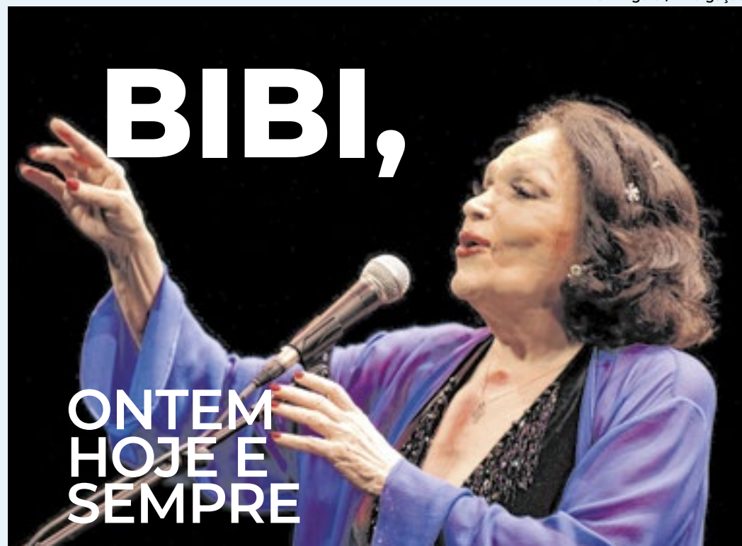
Atriz e cantora, Bibi Ferreira recebe justas homenagens

Valioso acervo de espetáculos encenados por Bibi Ferreira, um das artistas mais completas do Brasil, será exibido este mês no YouTube no projeto Celebrando Bibi