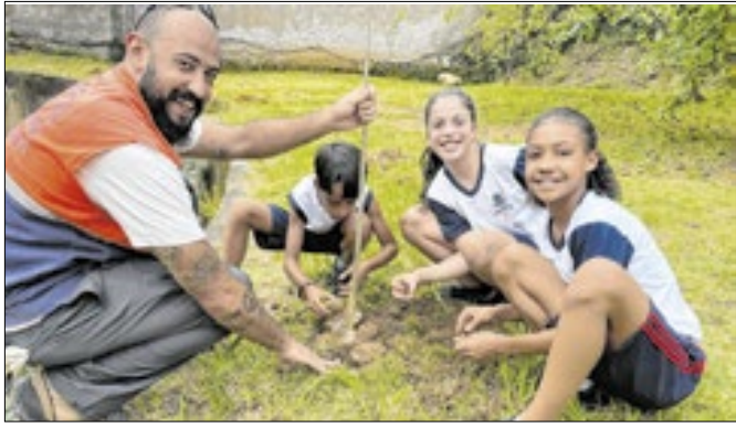
Foram plantadas 86 mudas de diferentes espécies