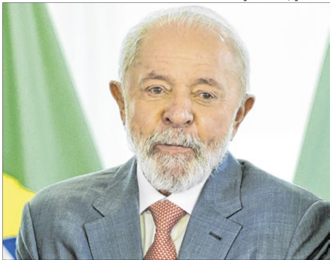
Lula participará da abertura do encontro, nesta terça

O problema é saber se "abraçar" Lula é também a vontade dos prefeitos. Espera-se que haja muitas cobranças. A capacidade de investimentos do governo ficou limitada pelos cortes necessários para manter as metas fiscais. Boa parte do que