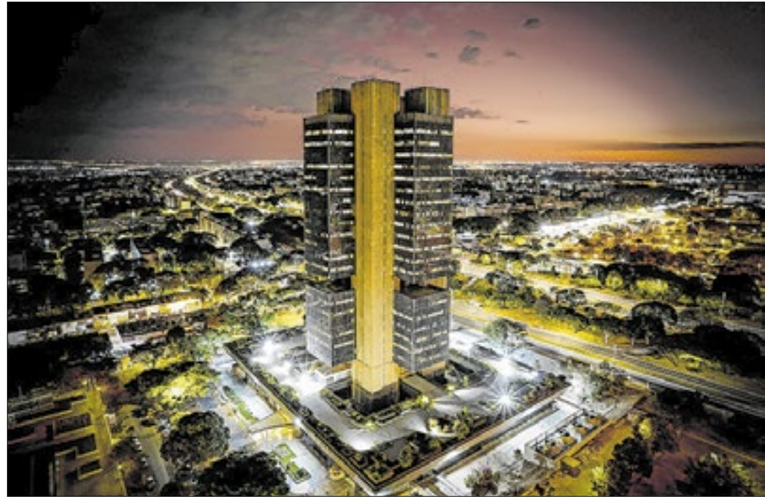
Escalada inflacionária já contamina (e compromete) avanço da economia em 2026

Na missiva, o comandante da autoridade monetária atribuiu essa prospecção a fatores, como a forte atividade econô-