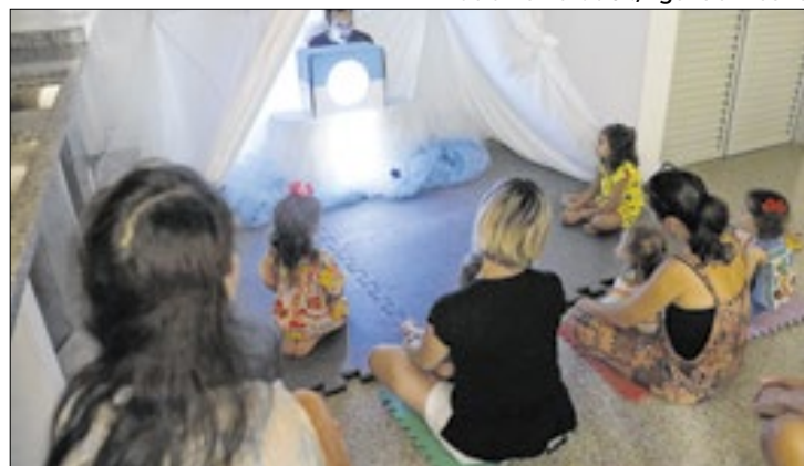
Atividades gratuitas incluem oficinas e baile de carnaval