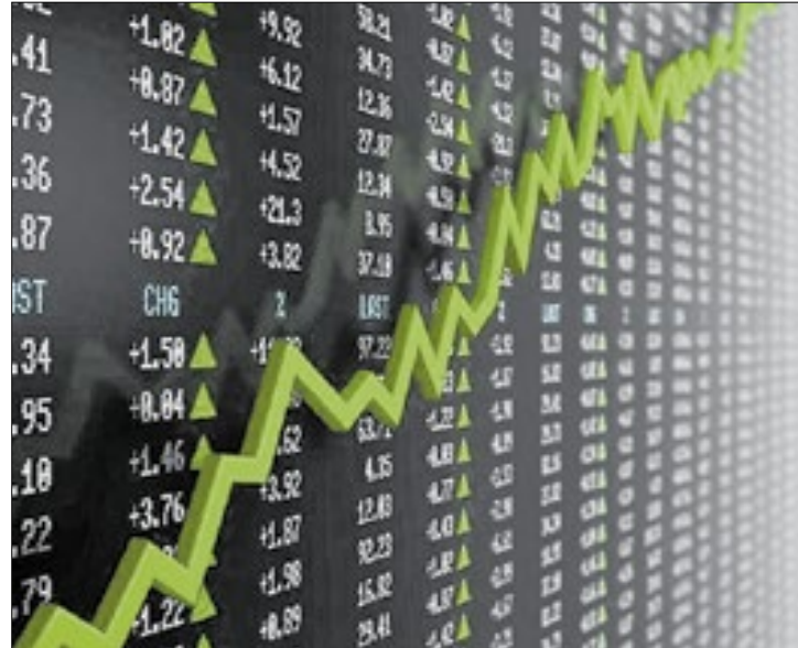
Salto de ações da Gerdau impulsionou a bolsa brasileira

As ações da Gerdau (PN +5,21%) foram destaque de alta nesta segunda-feira, com o mercado precificando benefícios para a empresa em um cenário de guerra comercial no setor de aço e alumínio, devido à companhia ter operações nos Estados Unidos. Entre os bancos, BTG (-1,77%), que divulgou números do quarto trimestre, também tinha desempenho positivo mais cedo, assim como