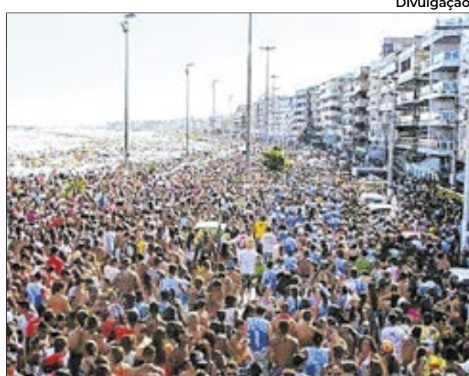
Desvalorização cambial atraiu turista estrangeiro