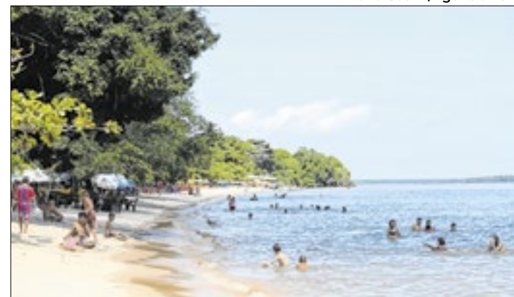
Projetos levam urbanização e abastecimento de água