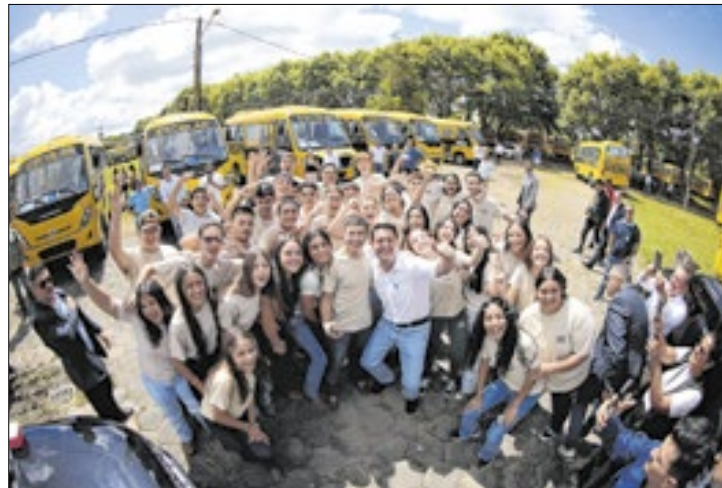
Foram entregues na segunda os 113 primeiros veículos

O governador Calos Massa Ratinho Junior iniciou nesta segunda-feira (10) a entrega dos 209 novos ônibus escolares adquiridos para uso no programa Caminho da Escola. Em evento no Parque da Ciência Newton Freire Maia, em Pinhais, na Região Metropolitana de Curitiba, foi entregue o primeiro lote de 113 veículos para atender 97 cidades.