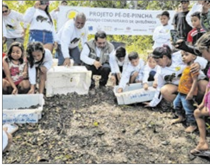
Filhotes devolvidos à natureza em duas comunidades