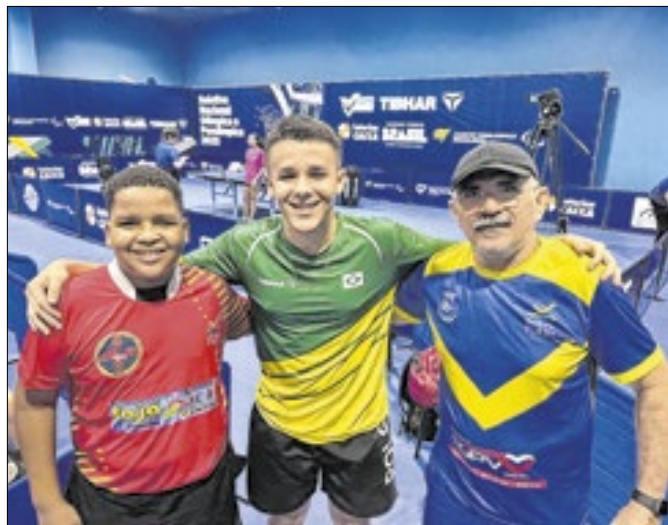
Jovem de Oeiras garante lugar no Sul-Americano