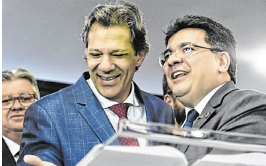
Haddad e Fonteles, governador do Piauí, durante cerimônia de posse

“Temos projetos com hidrogênio verde, data centers e eólica offshore; áreas em que o Nordeste tem vantagem competitiva clara”, explicou o ministro.