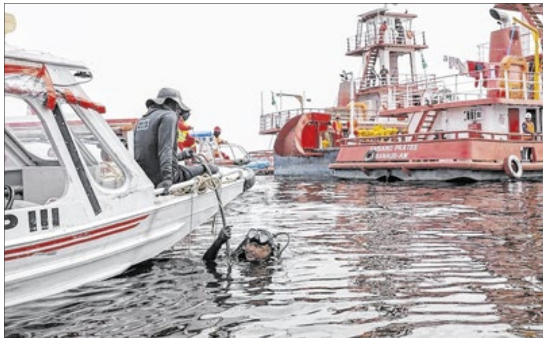
A previsão é de que os cabos tenham vida útil de pelo menos 25 anos submersos nos rios

A Universidade do Estado do Amazonas (UEA) participa da implementação de cabos de fibra ótica para levar internet a 12 municípios do estado.