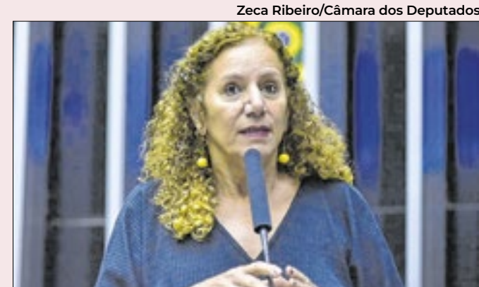
Zeca Ribeiro/Câmara dos Deputados

Bolsonaristas lembram que atitudes de Trump têm o risco de jogar no colo da esquerda a pauta nacionalista hoje mais identificada com a direita. Lembram a repercussão positiva do boné, usado por petistas, com frase sobre o Brasil pertencer a brasileiros.