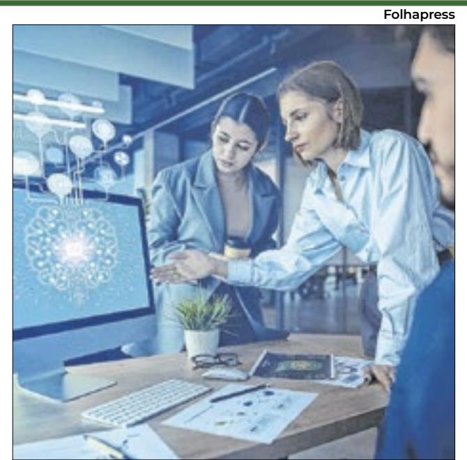
Inteligência artificial precisa ser bem utilizada