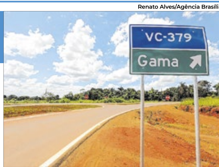
O anúncio da recriação da Secretaria do Entorno aconteceu quando da inauguração de obras

"Nós temos recebido uma demanda muito grande, principalmente dos prefeitos e de al-