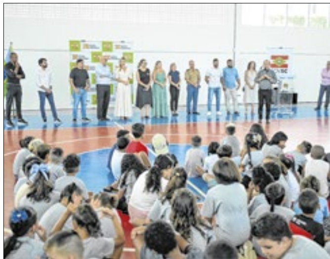
Quadra fica na EEB Laércio Caldeira de Andrada