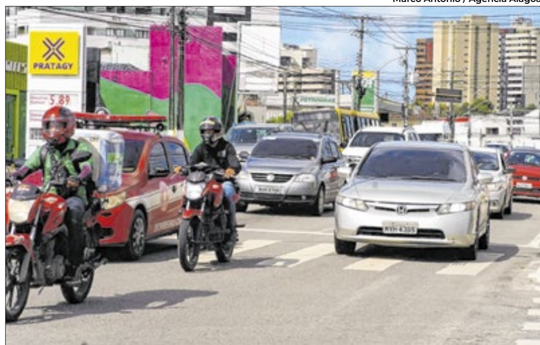
No primeiro mês de 2024, o volume de motocicletas vendidas corresponde a 64,1%

Em 2024, foram vendidas 44.510 unidades, 63,6% do total