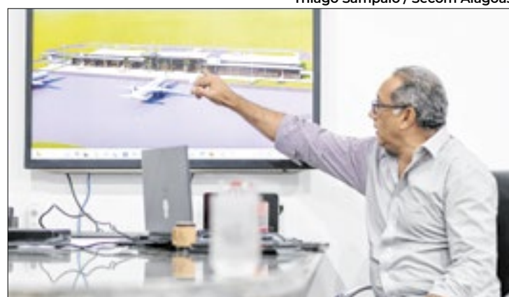
DEA, DER e Setrand alinham projetos para aeroportos