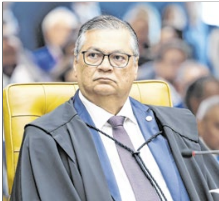
Dino reage aos penduricalhos do Judiciário

Em sua justificativa para derrubar o repasse dos valores, o ministro do Supremo alegou que o recurso apresentado contraria a Súmula Vinculante 37 do STF, que determina que não cabe ao Poder Judi-