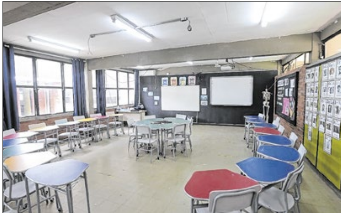
Iniciativa acelera a execução de reparos e a compra de equipamentos

Lançado em outubro de 2021 pelo governo do Estado, o programa Agiliza Educação já destinou, desde sua implementação, R$ 503,2 milhões às escolas estaduais. Apenas na preparação para o início do ano letivo de 2025, o Executivo estadual liberou R$ 180 milhões, viabilizando reparos e melhorias que qualificam o ambiente escolar e proporcionam mais segurança e conforto – inclusive térmico – para alunos, professores e funcionários.