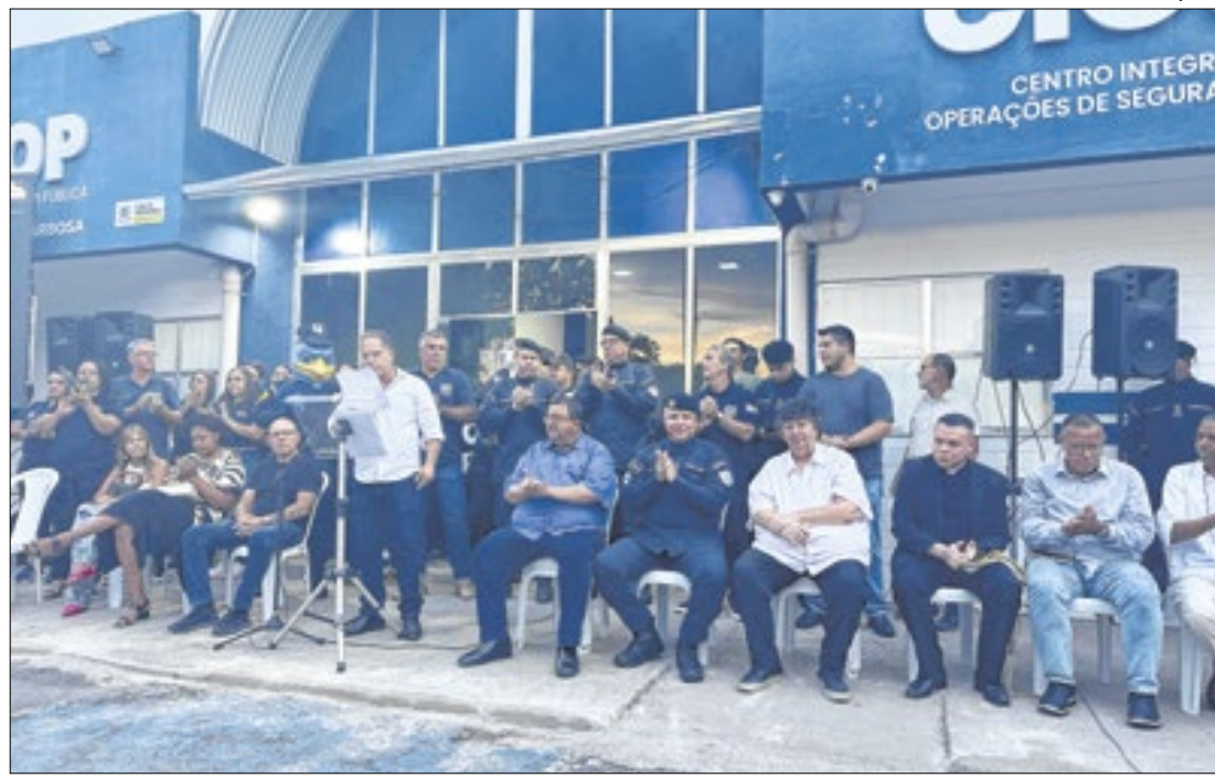
Autoridades na solenidade realizada em Volta Redonda

aprendiz. Outras informações podem ser obtidas no site da empresa. A Fundação Mudes oferece 748 vagas de estágio nos níveis Superior, Médio e Técnico, com bolsa auxílio que pode chegar a R$ 2.000. Para se candidatar, basta acessar o site da fundação.