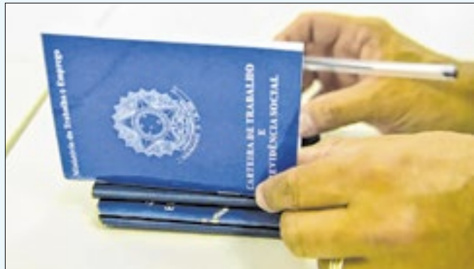
Diversas empresas divulgam oportunidades de trabalho