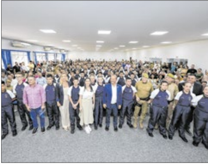
Governo do Estado expande a instituição