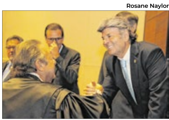
O desembargador Luiz Zveiter com o ministro Luiz Fux