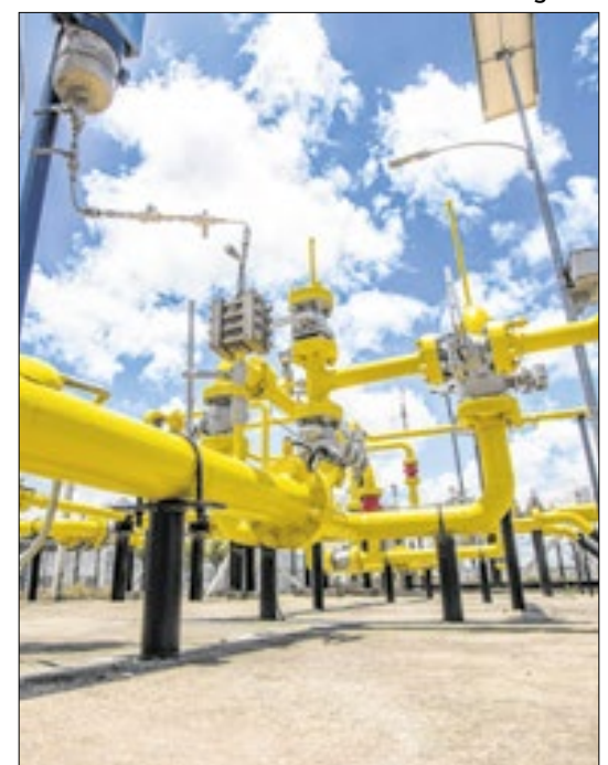
A classificação é apoiada por outras 12 entidades