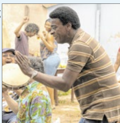
A Melhor Mãe do Mundo

E o cinema brasileiro faz a festa no Festival de Berlim