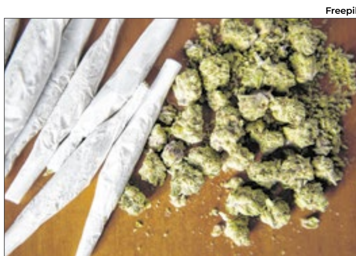
MP de SP e Defensoria do estado questionam regras

O ministro rejeitou ponto a ponto o que seriam obscuridades e omissões apontadas pelos órgãos paulistas na decisão. Nos recursos, do tipo embargos de declaração, foram feitos cinco questionamentos principais pelo Ministério Público e dois pela Defensoria Pública.