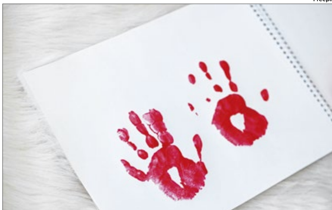
O número representa uma média de 106 mortes por dia no país

Em números absolutos, os estados onde mais foram registrados assassinatos em 2024 são Bahia (4.480); Rio de Janeiro (3.504); Pernambuco (3.381); Ceará (3.272); Minas Gerais (3.042); São Paulo (2.937), Pará (2.570) e Mara-