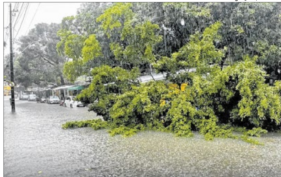
Pernambuco registrou mortes e desalojados devido as fortes chuvas

O governador da Bahia, Jerônimo Rodrigues anunciou a abertura de uma seleção para contratação de 3.778 profissionais da saúde, em Regime Especial de Direito Administrativo (Reda). O edital, foi publicado no Diário Oficial do Estado da última quarta-feira (5).