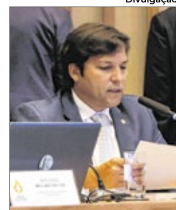
Autor do projeto, deputado Robério Negreiros

mentar, a proposta visa contribuir para a inclusão digital, uma vez que irá reduzir a desigualdade de acesso às tecnologias e preparar os alunos para os desafios do século XXI. “Além de modernizar o currículo escolar do DF, também irá formar cidadãos mais preparados para o futuro, capazes de se adaptar e contribuir para um mundo em constante evolução tecnológica”, justifica Negreiros.