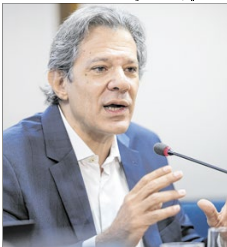
Haddad crê que preços dos alimentos logo cairão

O ministro explicou que a valorização do dólar no cenário mundial foi impulsionada pela eleição do presidente dos Estados Unidos da América (EUA), Donald Trump (Republicano) em novembro de 2024. “Agora,