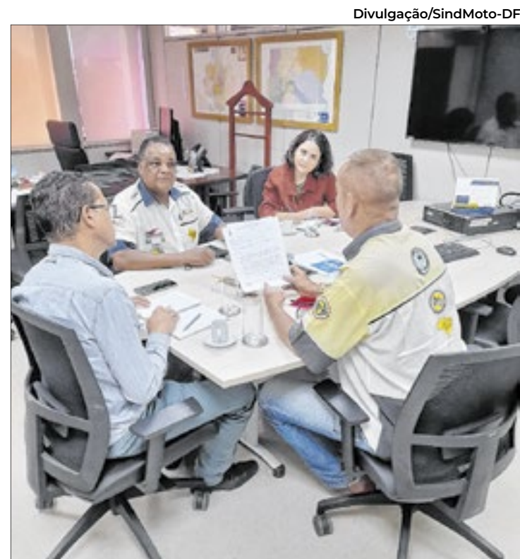
Membros do SindMoto-DF vêem com bons olhos o projeto

A proposta segue para análise das demais comissões da Câmara Legislativa antes de ser encaminhada para votação.