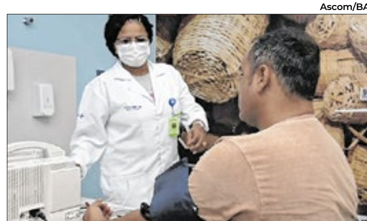
A medida foi oficializada por meio da Portaria nº 6.594

Municípios que tiverem reconhecimento federal de situação de emergência ou calamidade pública podem solicitar recursos ao MIDR para ações de defesa civil. As solicitações devem ser feitas por meio do Sistema Integrado de Informações sobre Desastres.