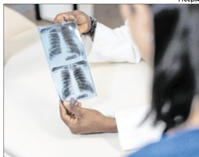
Estudo mostra que tendência o aumento de casos