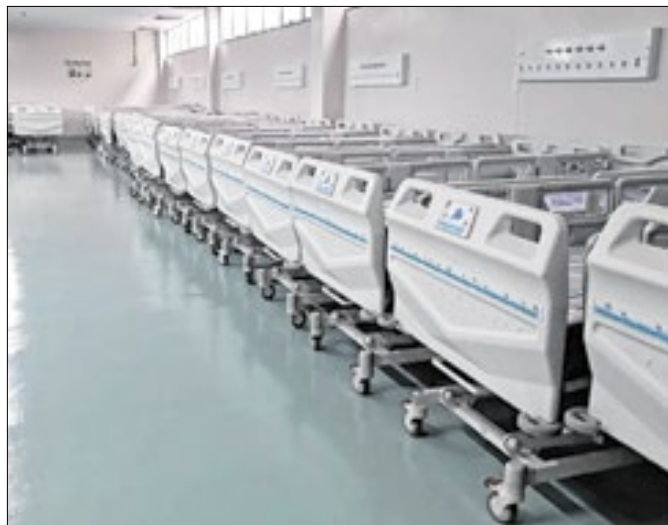
Novos leitos eletrônicos e monitores para a UTI pediátrica