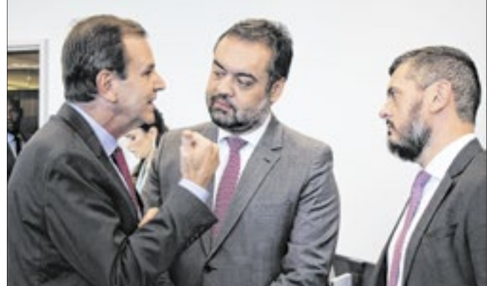
O prefeito Eduardo Paes com o governador do Rio, Claudio Castro; e o presidente da Alerj, Rodrigo Bacellar