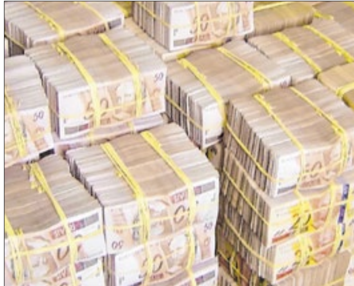
Só os três maiores bancos lucraram R$ 78 bi em 2024

Os três maiores bancos privados do país encerraram 2024 com lucro líquido de R$ 74,8 bilhões, um crescimento de 22,1% em relação a 2023, de acordo com dados compilados pelo Estadão/Broadcast. Os resultados foram alavancados pelo crescimento do crédito, um cenário que deve mudar em 2025. Com a previsão de juros em alta e economia em desaceleração, os bancos esperam colocar o pé no freio.