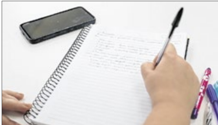
Educação do DF orienta instituições públicas sobre regras