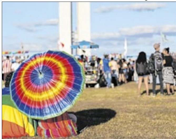
Material apresenta serviços leis voltadas à comunidade