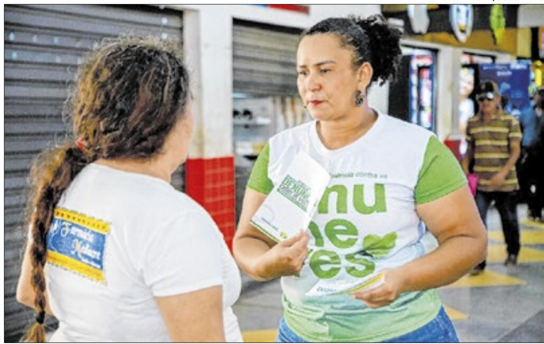
A gestão estadual reforça que a redução dos índices de feminicídio é uma das prioridades

moveu abordagens públicas para sensibilizar a população sobre os direitos das mulheres e a importância das denúncias.