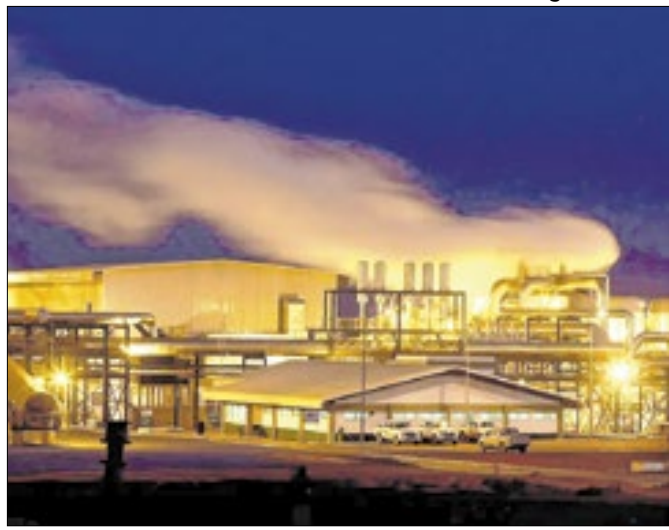
Compromisso com acordo climático deixa a desejar