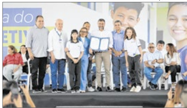
Iniciativa capacita alunos para o mercado de trabalho