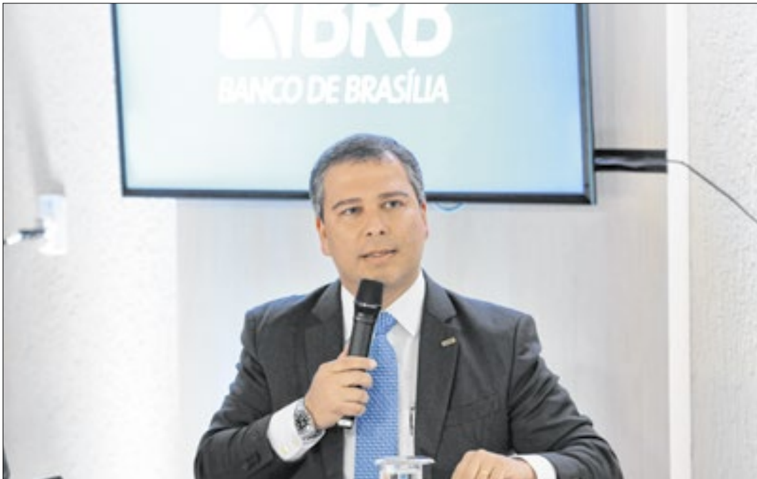
O Banco de Brasília admitiu o equívoco no processo de recondução de Costa