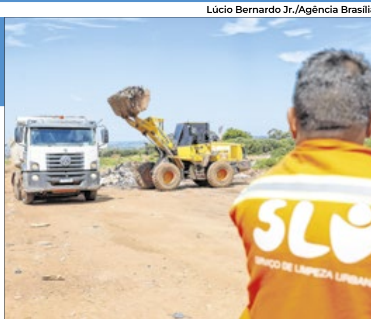
O GDF empenha R$ 4 milhões exclusivamente para fazer a remoção de lixos e dejetos descartados pela população

no Distrito Federal é considerado crime ambiental, conforme previsto na Lei de Crimes Ambientais (lei federal nº 9.605/1998) e em normativas locais. Quem for flagrado jogando resíduos em áreas proibidas pode ser enquadrado no artigo 54 da lei, que trata da poluição que cause danos à saúde humana ou ao meio ambiente. As penalidades incluem multa e detenção de um a quatro anos, podendo ser agravadas caso o material descartado ofereça riscos mais graves, como resíduos tóxicos ou perigosos.