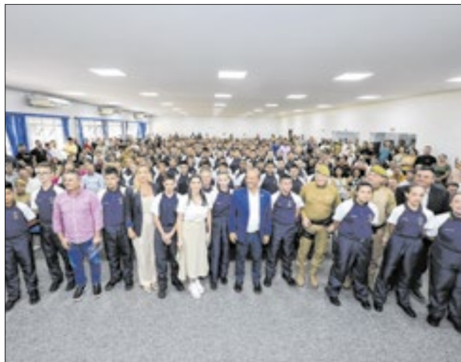
Governo do Estado expande a instituição