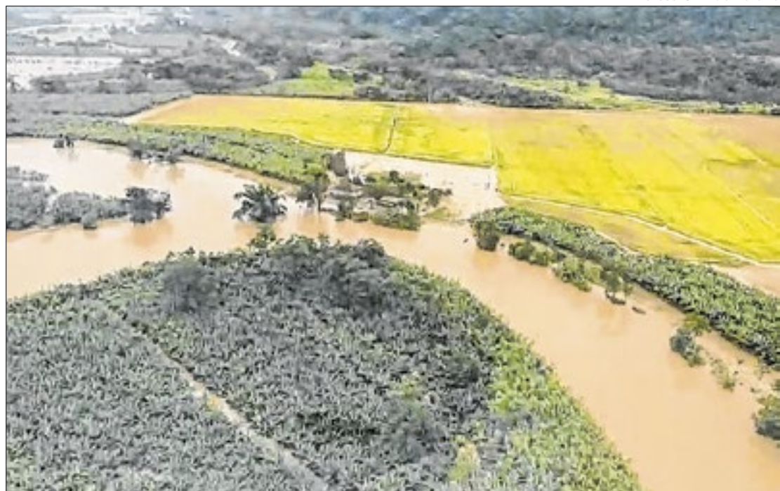
Defesa Civil do Paraná

“Eu falei com os prefeitos da região e estou acompanhando a varredura feita pelas equipes e o secretário da Segurança Pública, que está lá a meu pedido. Para intensificar os tra-