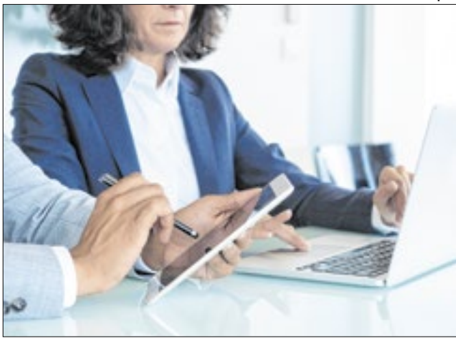
Inflação alta, juros elevados e perspectivas negativas