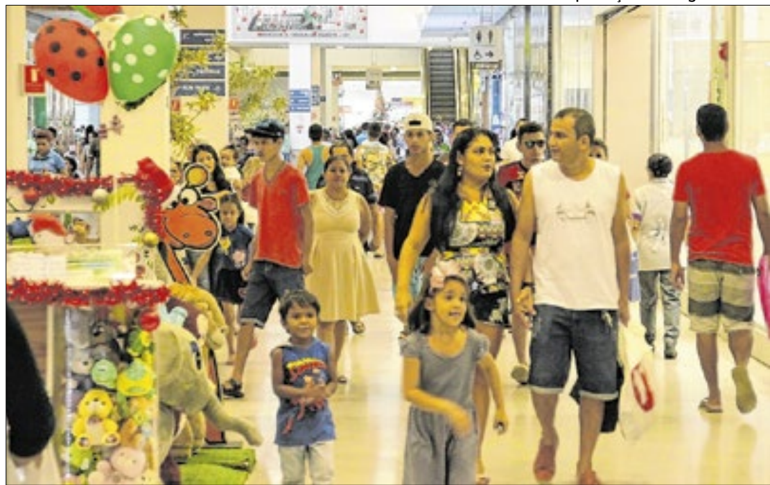
Juros elevados e seletividade de crédito estariam contendo 'ímpeto' de consumo familiar

Com base nesse recuo, medido pela Pesquisa de Endividamento e Inadimplência do Consumidor (Peic), a Confederação Nacional do Comércio