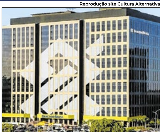
BB assina termo para devolução por cobranças indevidas

Segundo CNC, o consumidor está mais cauteloso, face aos juros altos