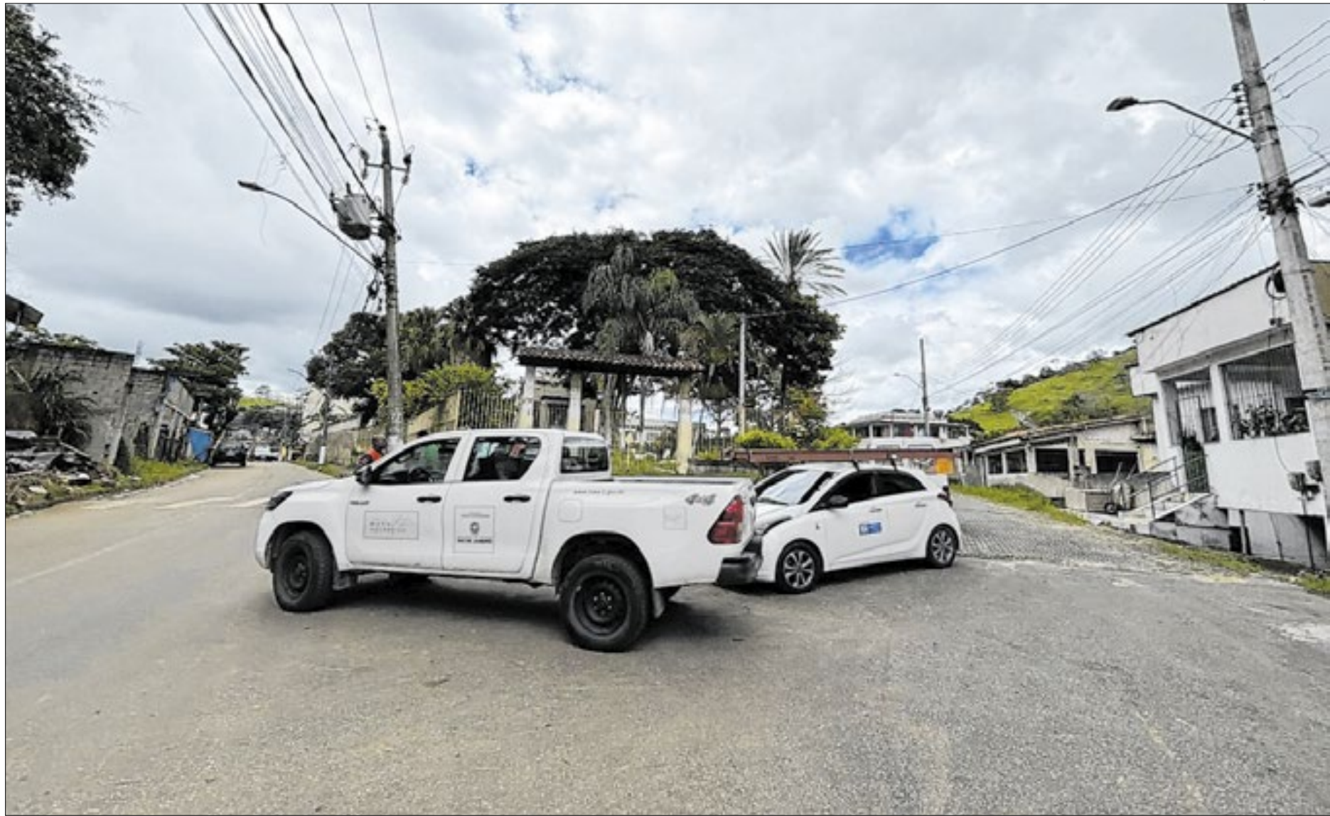
Aparelhos de som que emitem alerta em Barra do Piraí estão serão testados em diferentes locais

Em janeiro deste ano, uma audiência de conciliação com o atual governo foi marcada, mas, não foram divulgadas outras informações se de fato a decisão tenha sido revertida.