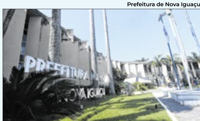
Prefeitura de Nova Iguaçu

Caso o equipamento seja aprovado, o uso será ampliado e uma série de torres será instalada nas ruas e bairros de Duque de Caxias.