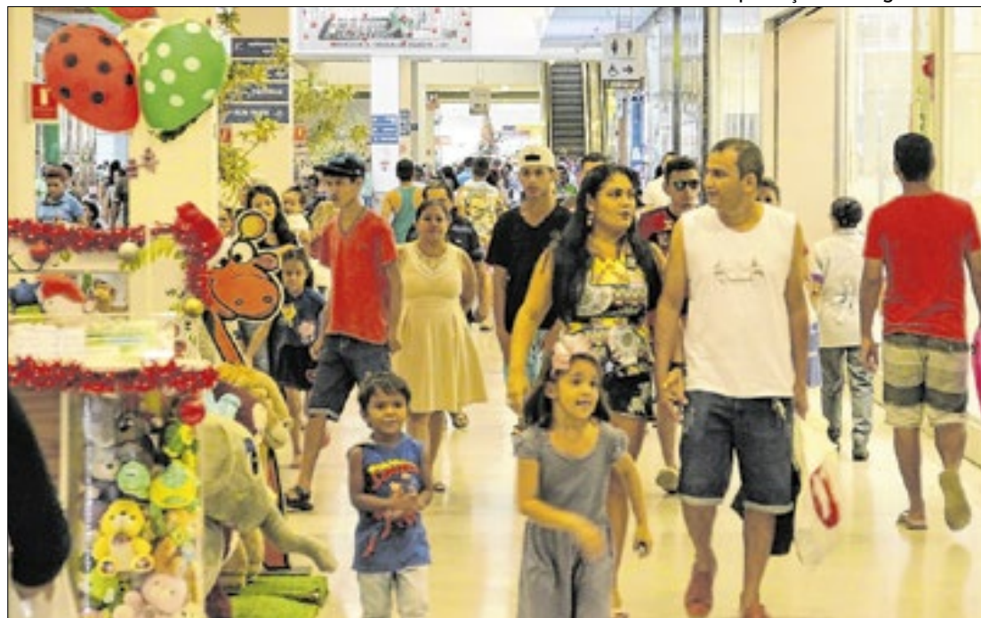
Juros elevados e seletividade de crédito estariam contendo 'ímpeto' de consumo familiar

Com base nesse recuo, medido pela Pesquisa de Endividamento e Inadimplência do Consumidor (Peic), a Confederação Nacional do Comércio