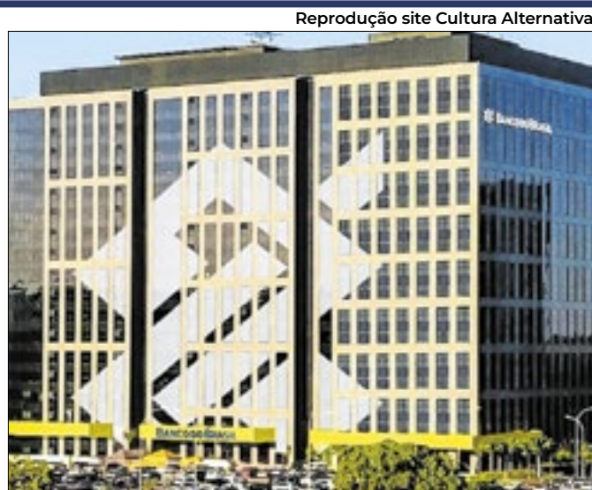
BB assina termo para devolução por cobranças indevidas