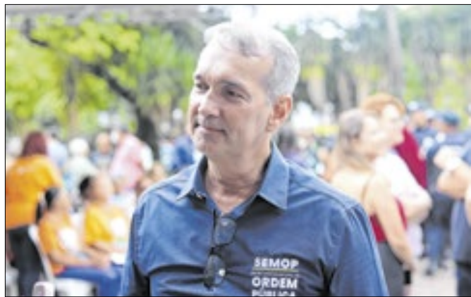
Coronel atualmente está na Secretaria de Ordem Pública