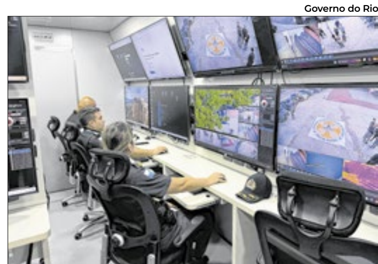
Operações acontecem na região metropolitana do Rio

Com o intuito de promover a inclusão, o CERPI conta com um exemplar do Estatuto do Idoso em braille, fazendo com que todos os idosos saibam seus direitos.