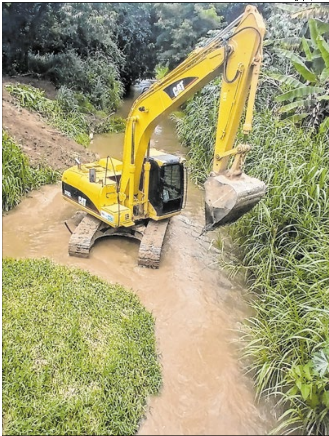
O Rio Bocaina, em Barra Mansa, recebeu serviços do Programa Limpa Rio