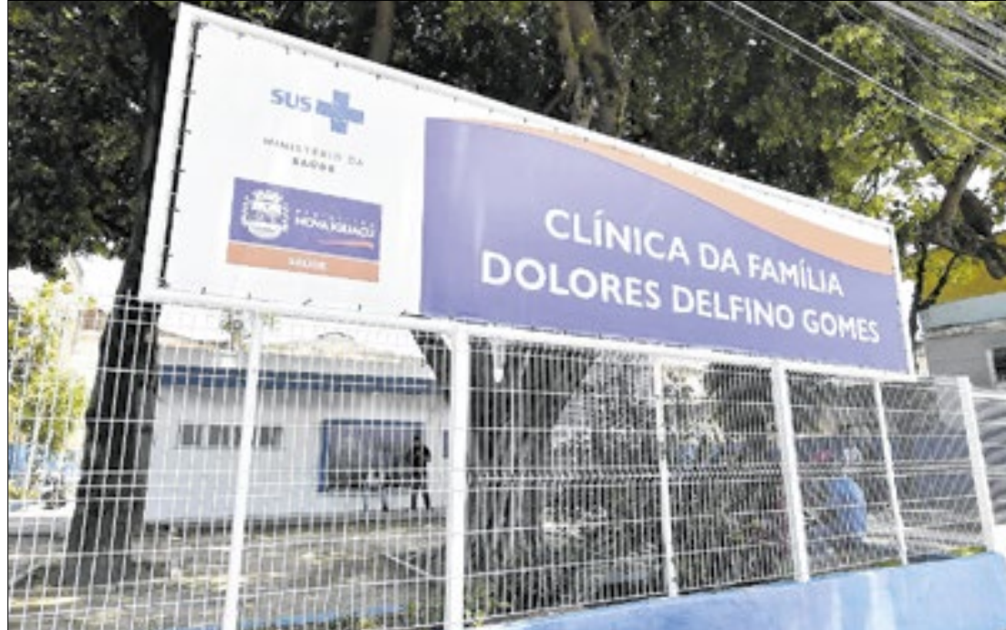
Prefeitura de Nova Iguaçu

“Revitalizar as Clínicas da Família é uma de nossas metas, pois sabemos que essas unidades são essenciais para garantir o acesso à saúde de qualidade para a população. Com as melhorias, vamos oferecer um atendimento de maior qualidade, fortalecendo a atenção básica e cuidando de cada cidadão de Nova