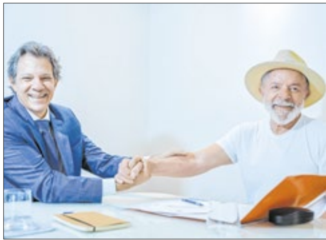
Fogo amigo contra Haddad foi contido