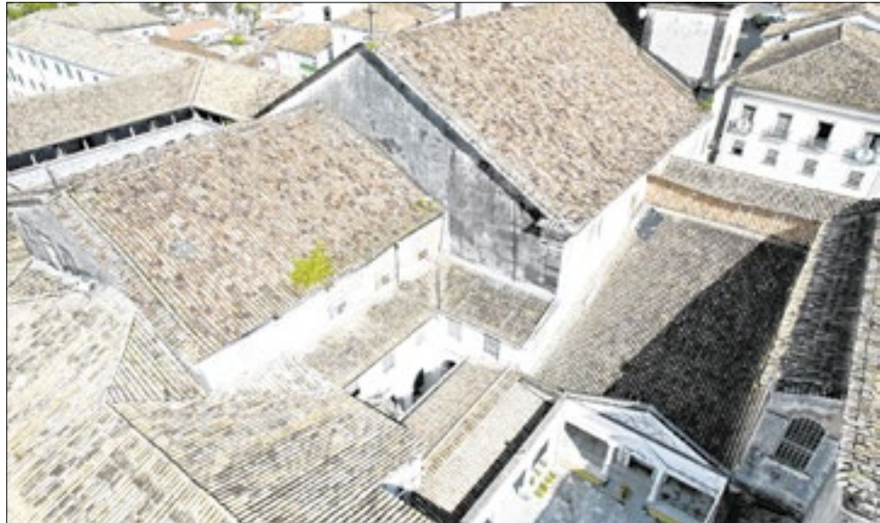
Imagens feitas por empresa mostram degradação em áreas externas da igreja e do convento de São Francisco

tos com presença de cupins dentro da igreja (em altares, imagens e forro do teto). Uma análise das instalações elétricas detectou problemas graves na fiação e falta de para-raios — um total de 48 situações classificadas como de “risco crítico”, quando há ameaça à saúde, vida, meio ambiente ou patrimônio.