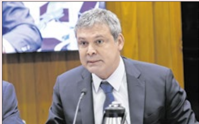
Até Lindbergh agora elogia feitos de Haddad