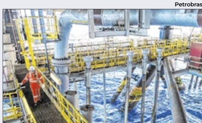
Aspiração pelo clube do petróleo atropela sustentabilidade

Já o segundo tema tratado entre o BB junto ao Banco Central (BC) diz respeito à devolução de R$ 14,1 milhões em razão de cobrança, em desacordo com a regulamentação, de tarifa de fornecimento de segunda via de cartão com função débito e/ou crédito em três casos.