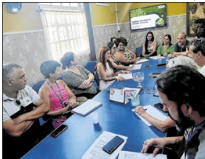
Proposta visa tornar a cidade mais consciente e sustentável

Durante a reunião, foram discutidas as contribuições das secretarias de Meio Ambiente, Educação, Saúde e Proteção e Defesa Civil, além do Comdema, que conta com uma Câmara Técnica de Educação Ambiental. "Precisamos unir e reunir esforços para saber para qual público queremos falar e de que forma podemos atingir cada um. O importante é que, juntos, poderemos realizar ações significativas de educação ambiental na cidade", disse o vice-prefeito e