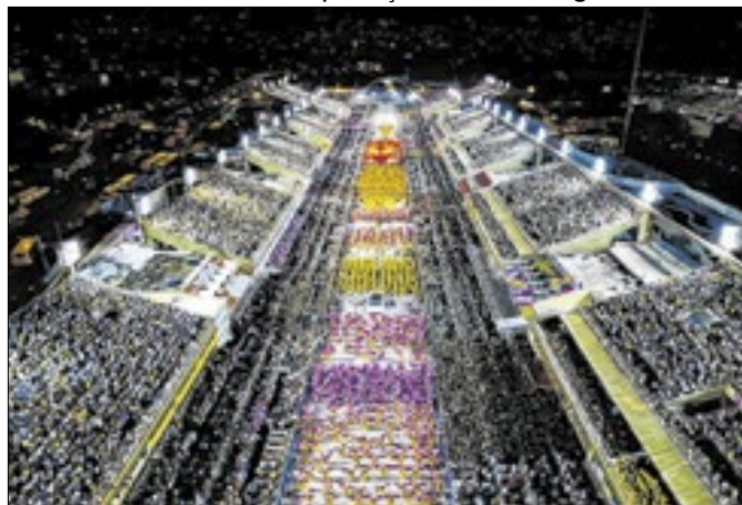
Vendedores e ambulantes terão pontos fixos na Sapucaí