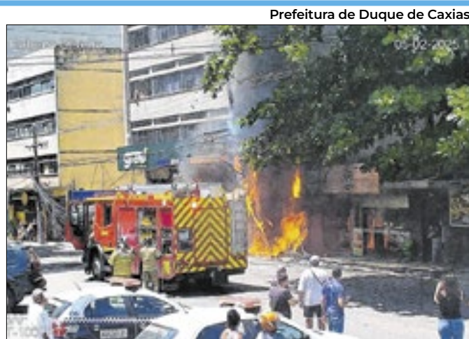
Projeto visa aumentar segurança em Duque de Caxias

Unidade de saúde foi entregue à população na terça-feira (4)