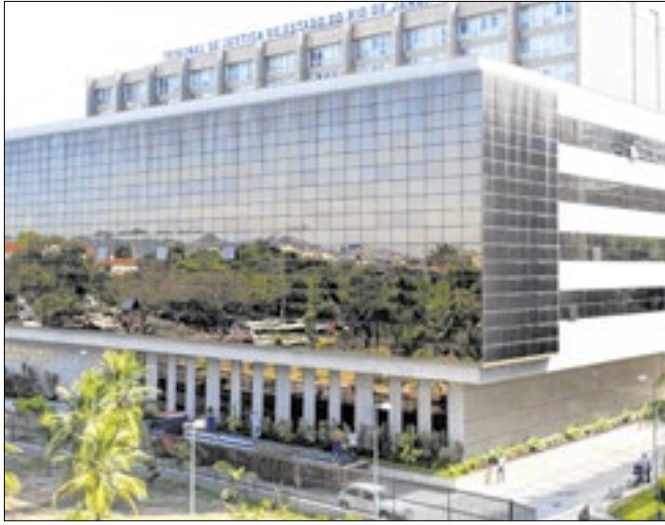
Sessão Solene para a posse acontece nesta sexta-feira