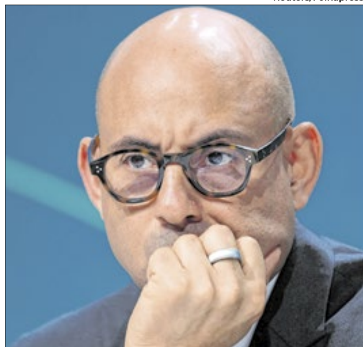
Secretário deu recado a Trump sobre transição energética

Mas ressaltou que os incêndios que assolaram Los Angeles, nos EUA, por exemplo, são um alerta de que mesmo as maiores potências do mundo vão sofrer as consequências do