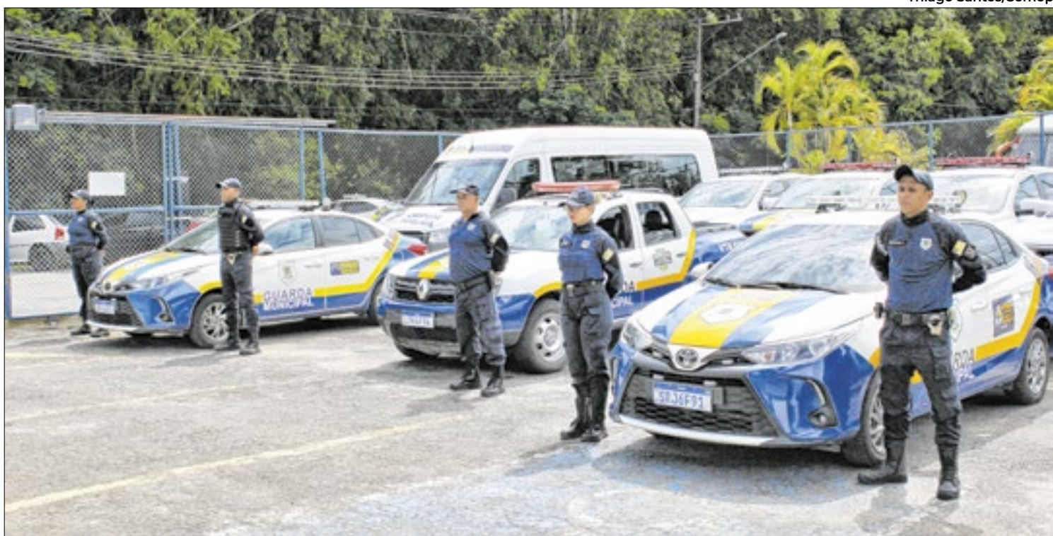
Município irá receber ainda novos carros na próxima semana para ampliar serviço de segurança em áreas sociais

anexar os documentos de identidade com foto e o comprovante de residência de Volta Redonda. Após concluir o cadastro, o Sindpass (Sindicato das Empresas de Transporte de Passageiros) enviará as orientações da retirada do cartão no e-mail cadastrado.