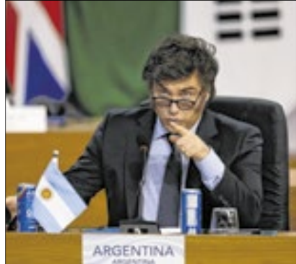
Milei tirou a Argentina da OMS

A decisão do governo Javier Milei de retirar a Argentina da OMS (Organização Mundial da Saúde) reacendeu o debate sobre soberania e cooperação internacional. A Argentina anunciou sua saída