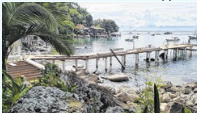
Projeto na Ilha Grande inclui até iluminação em LED