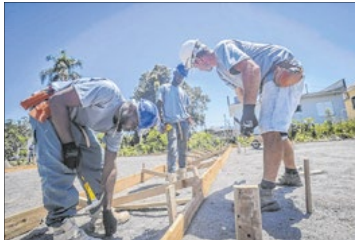
As 50 casas foram doadas pelo movimento União BR

O governador Eduardo Leite, acompanhado por secretários de Estado e prefeitos, visitou nesta quarta-feira (5/2) as obras das casas definitivas para as famílias atingidas pela enchente de maio de 2024. A comitiva esteve em seis dos 11 municípios que receberão as moradias do primeiro lote, com investimento total de R$ 58,7 milhões. Na mesma tarde, em Estrela, o governador também assinou termos de cooperação do programa Desassorear RS com 26 municípios da região.