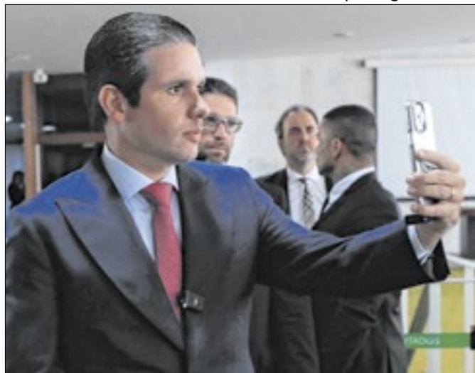
Hugo Motta sinaliza apoio ao semipresidencialismo