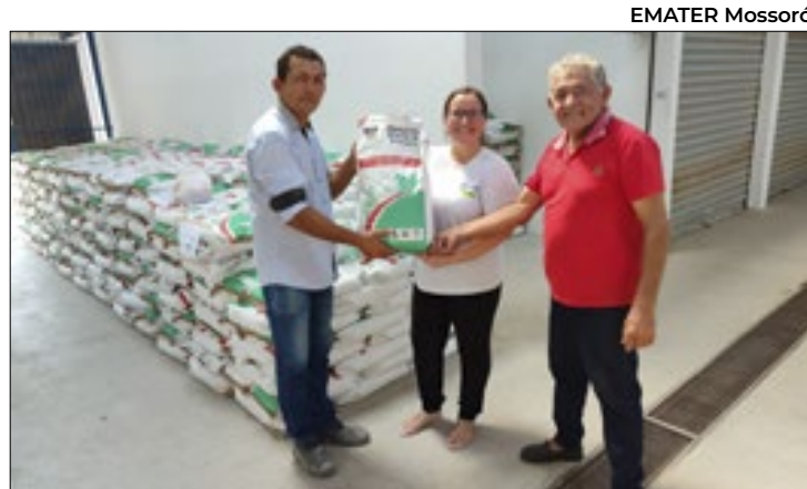
O Programa é coordenado pela Secretaria de Estado

O desabamento levanta questionamentos sobre a conservação de patrimônios históricos e a necessidade de ações urgentes para preservar espaços culturais de grande relevância. A igreja, que atrai turistas de todo o mundo, é um símbolo da riqueza arquitetônica e religiosa do período colonial brasileiro. O incidente reforça a importância de investimentos em manutenção e restauração para garantir a segurança de visitantes e a preservação da história.