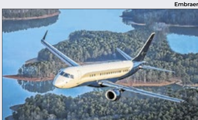
Encomenda ianque reforça presença externa da Embraer