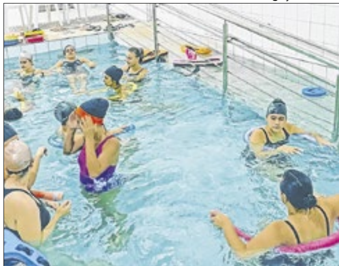
Udesc Cefid convida pessoas da Grande Florianópolis