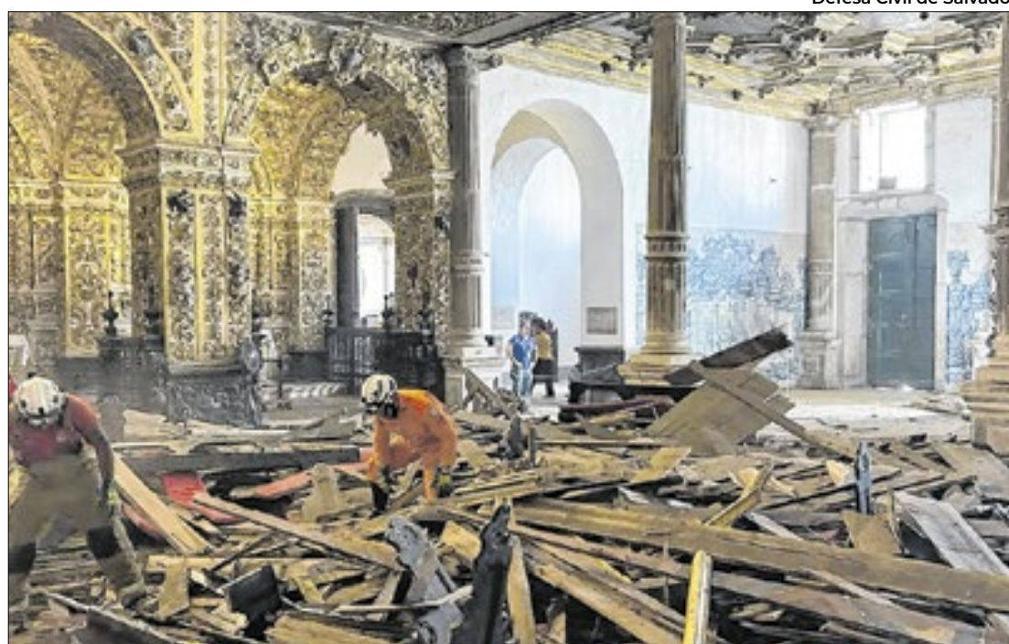
Teto da Igreja de São Francisco desaba em Salvador

Igreja, maravilha portuguesa, tinha problemas estruturais