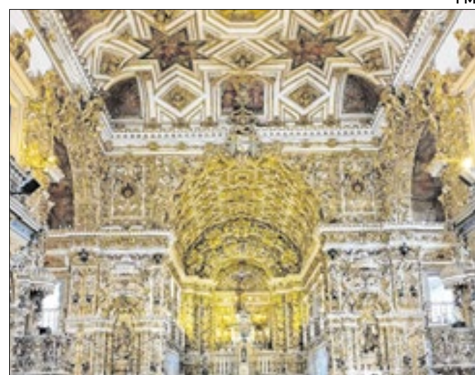
Interior da Igreja de São Francisco, em Salvador.