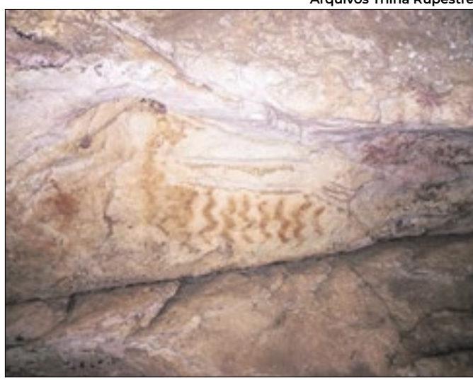
Fortalecimento de cultura e economia por meio de sítios