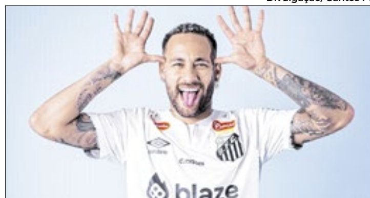
Com volta de Neymar, Santos desenvolve setor anti-pirataria

O setor ajudará no combate à pirataria. Entre outras atividades, o departamento "fomenta