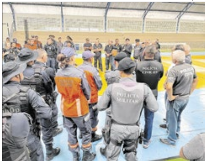
Queda de 6,5% nas mortes em relação a janeiro de 2024