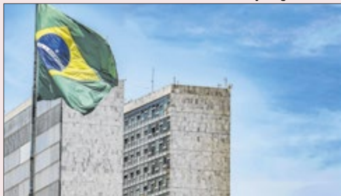
Reflexo de Congresso forte e governo fraco