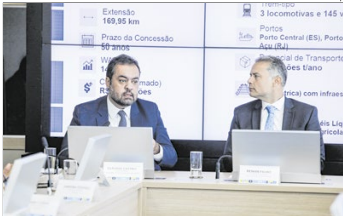
Governador do Rio, Cláudio Castro, com o ministro dos Transportes, Renan Filho

Em reunião realizada, nesta quarta-feira (5) no Ministério dos Transportes, o governador Cláudio Castro e deputados da bancada federal do RJ defenderam junto ao ministro Renan Filho que o projeto de implantação da EF-118, a ferrovia Vitória-Rio - que formará o Anel Ferroviário do Sudeste - seja realizado integralmente, incluindo o trecho Sul, que ligará o Porto do Açu, no norte do Estado, ao município de