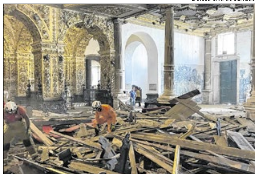
Teto da Igreja de São Francisco desaba em Salvador

Uma turista de 23 anos morreu e outras seis ficaram feridas depois que parte do teto da Igreja de São Francisco de Assis, conhecida como "igreja de ouro", desabou na tarde da última quarta-feira (5), no Centro Histórico de Salvador. A informação foi confirmada pelo Corpo de Bombeiros Militar da Bahia (CBM-BA). O acidente ocorreu por volta das 14h30, no templo da Ordem Primeira de São Francisco. Imagens feitas por testemunhas mostram os estragos pouco depois do desabamento.