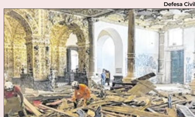
Restos do teto da igreja ficaram acumulados no chão

A Solé — ACunha Sole-Engenharia, que fica em Porto Alegre (RS) — venceu a licitação aberta em outubro de 2023 pela Superintendência do Instituto Patrimônio Histórico e Artístico Nacional da Bahia. Foi a única das quatro empresas classificadas a apresentar proposta.