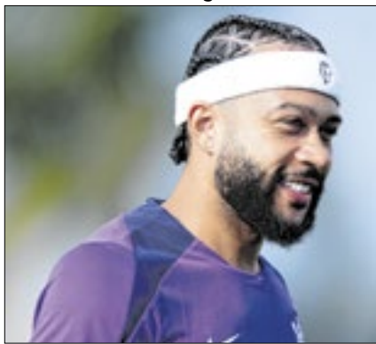
Holandês foi condenado a prisão

Memphis Depay se manifestou nas redes sociais após ser condenado a prisão suspensa por dirigir embriagado em Mônaco. O atacante do Corinthians se desculpou pelo episódio e admitiu ter conduzido seu carro após "tomar algumas bebidas". "2024 foi um ano de lições e eu com certeza aprenderei com essa. 2025 nós faremos melhor", disse o holandês Memphis Depay, em seu perfil no Instagram.