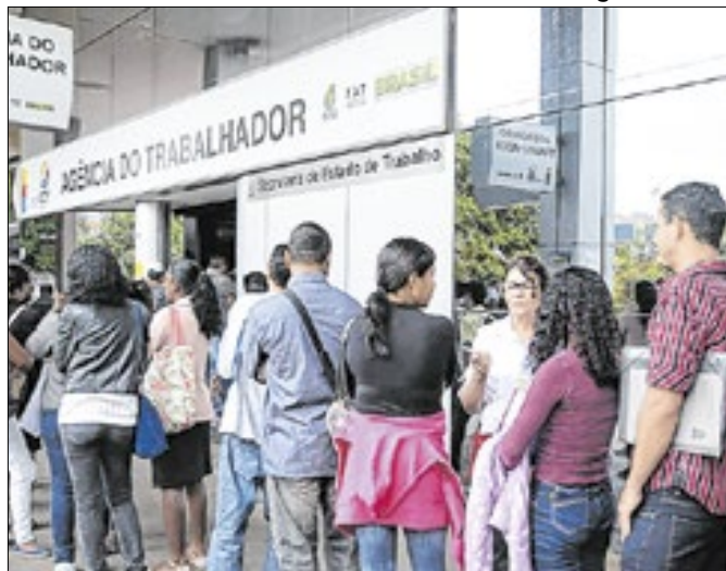
Mercado de trabalho parece ter perdido 'tração'