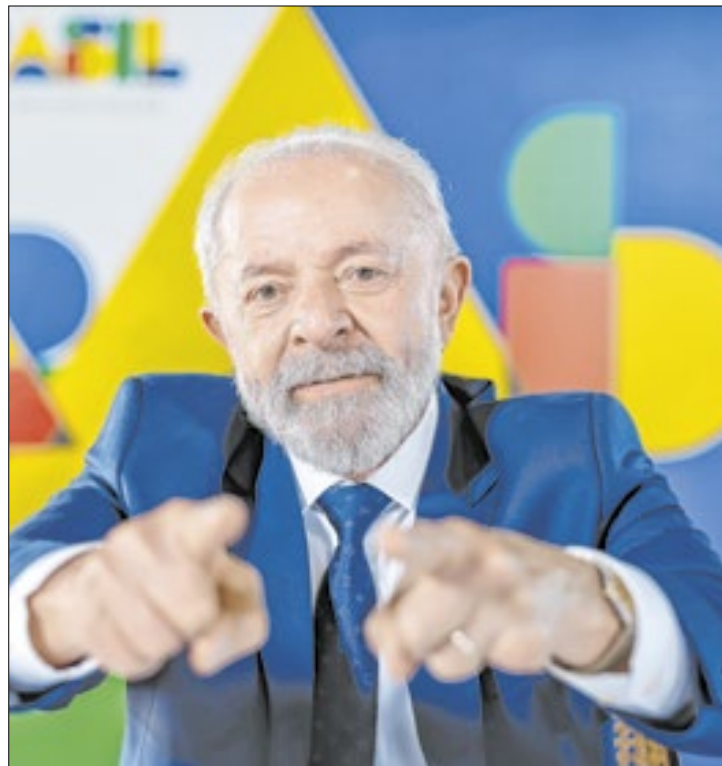
Lula defendeu reciprocidade na relação com os EUA

Na última sexta-feira (31), Trump anunciou a taxa