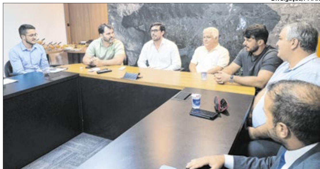
Projeto integrará cidades e transformará a Costa Verde em um destino único para turistas

- Vamos fortalecer o turismo nacionalmente, mas também posicionar a região no mercado