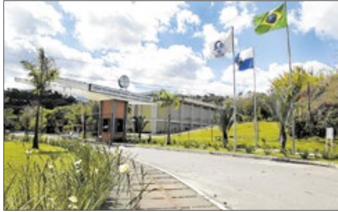
Curso será lecionado na Universidade Geraldo Di Biase