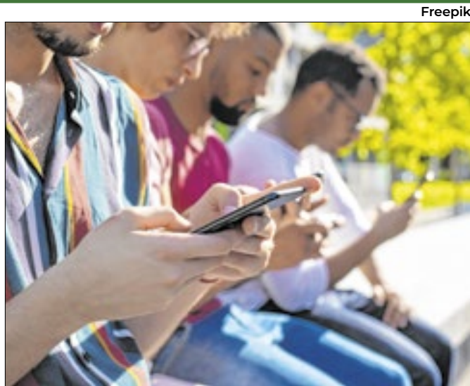
Levantamento foi feito pela Nexus Pesquisa