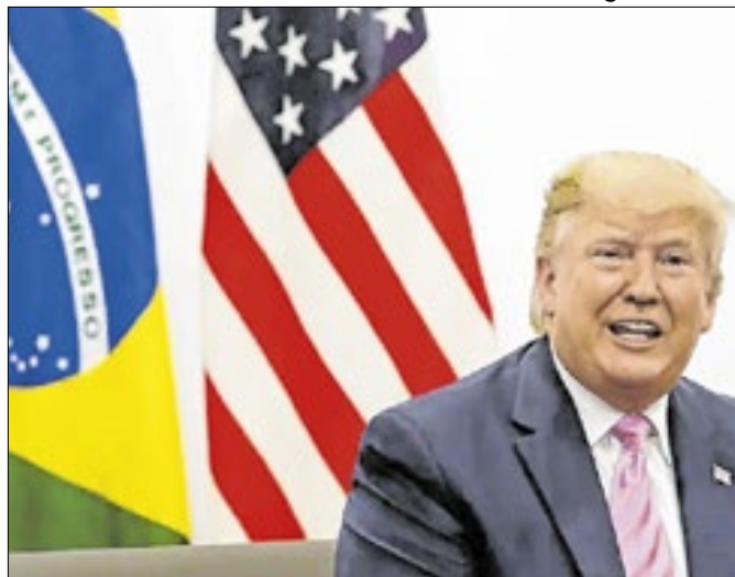
Itaú: EUA são superavitários em relação ao Brasil