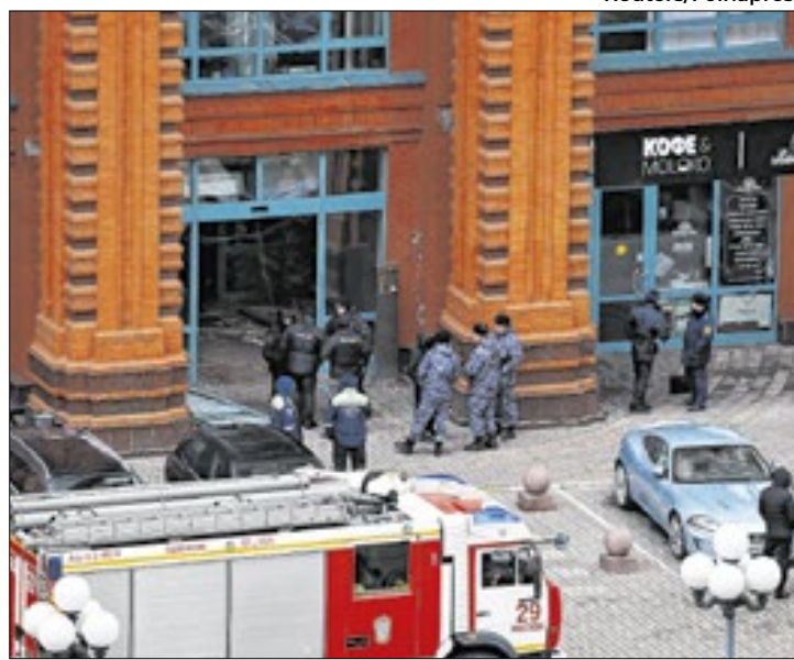
Atentado a prédio terminou com morte de Armen Sarkisian

A bomba que o matou foi plantada na entrada do condomínio de luxo onde morava, o Velas Escarlates, a 12 km do Kremlin. No ataque, um guarda-costas do paramilitar morreu e outros dois ficaram feridos. A cautela em apontar o dedo contra Kiev desta vez decorre das múltiplas e obscuras associações de Sarkisian. Armênio de nascimento, ele