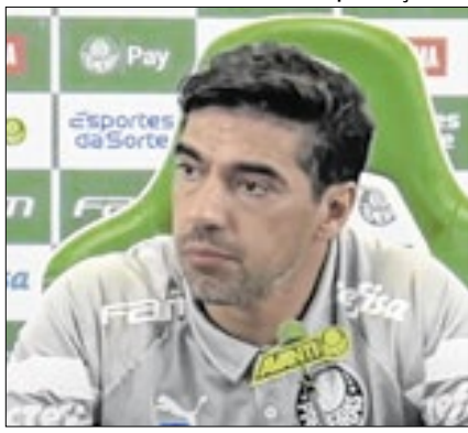
Abel Ferreira criticou o calendário

O técnico Abel Ferreira sinalizou que deve continuar com o rodízio entre titulares e reservas no Palmeiras durante o Campeonato Paulista. O português ainda vê o elenco abaixo