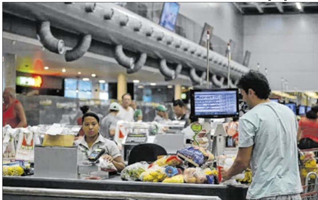
Enquanto o indicador inflacionário mantém subida, o PIB empaca pela segunda vez

O maior contraste, porém, é a 'paralisação' do PIB (Produto Interno Bruto), que 'estacionou' nos mesmos 2,06% de uma semana antes, o mesmo valendo