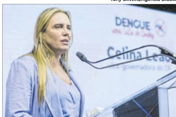
Celina Leão: “Trabalhamos muito ano passado, desde a contratação de mão de obra, investimento em tecnologia, continuamos no programa do dia D, combatendo o descarte irregular de lixo”

Para 2025, a vice-governadora salientou a continuidade do trabalho, tendo a prevenção como foco principal do governo. “Apesar da queda, nós ainda temos a circulação de outras tipologias, de outros tipos de dengue no Brasil, en-