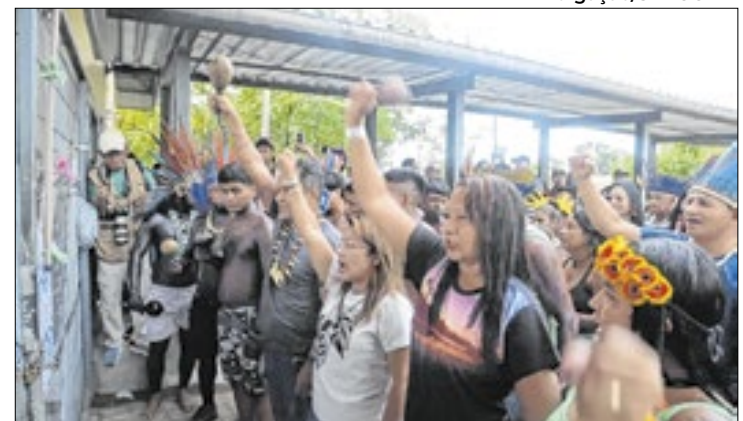
Movimentos contestam mudanças e pedem diálogo