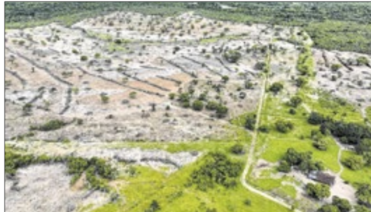
Fiscalização autua e embarga área irregular no estado