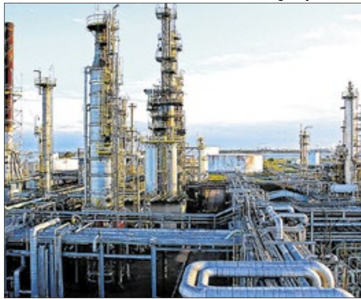
S&amp;P Global: preços industriais subirão moderadamente

"Os dados de janeiro apontaram um cenário um tanto