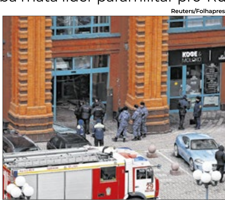
Atentado a prédio terminou com morte de Armen Sarkisian

A bomba que o matou foi plantada na entrada do condomínio de luxo onde morava, o Velas Escarlates, a 12 km do Kremlin. No ataque, um guarda-costas do paramilitar morreu e outros dois ficaram feridos. A cautela em apontar o dedo contra Kiev desta vez decorre das múltiplas e obscuras associações de Sarkisian. Armênio de nascimento, ele