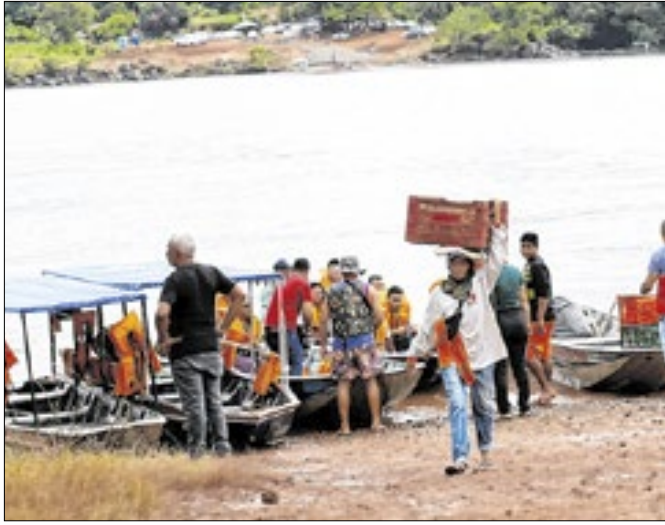
Ações garantem serviços essenciais à população afetada