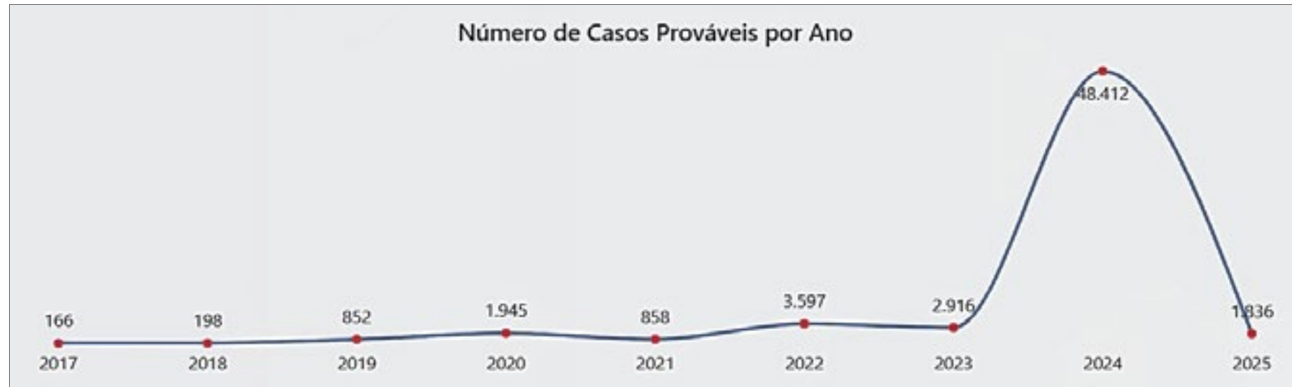
Dados relativo ao mês de janeiro no Painel da Dengue

“Com todo um esforço coletivo, nós conseguimos reduzir em 95% os casos de dengue na capital”, afirmou a vice-governadora Celina Leão (PP). Ela apontou medidas adotadas pelo Governo do Distrito Federal que permitiram bons resultados contra a doença na capital federal.