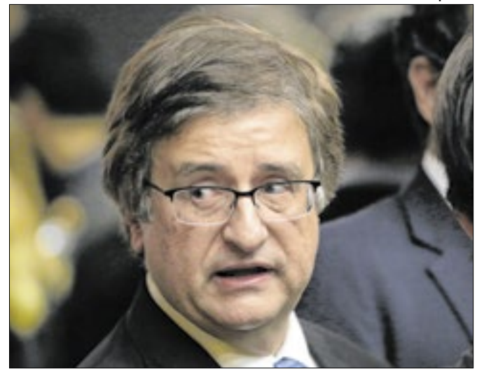
Paulo Gonet deverá entregar denúncia este mês