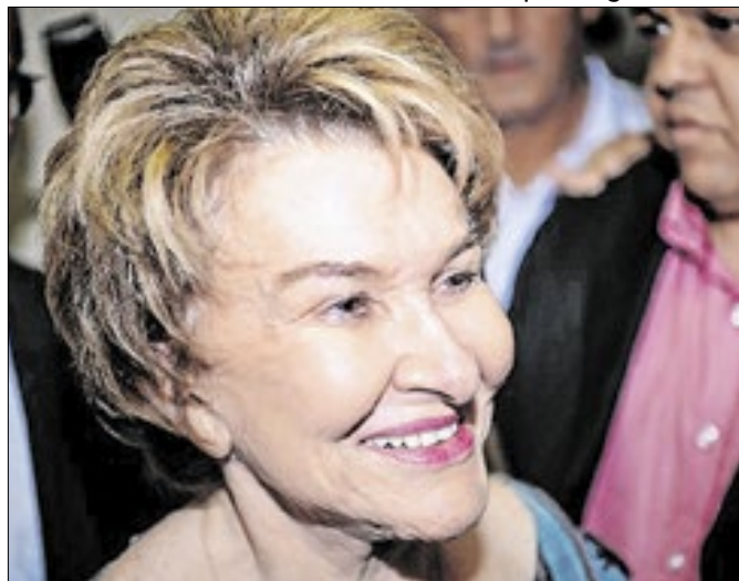
Ela foi distrital, federal e secretária de educação no DF