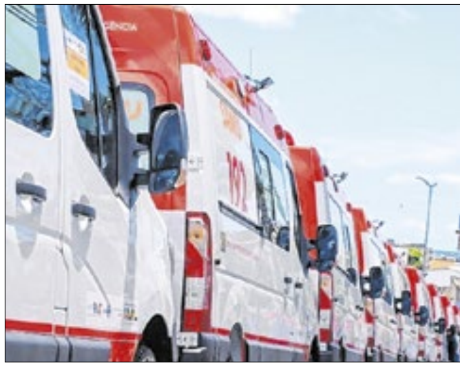
Curimatá e Bertolínia foram contemplados com ação