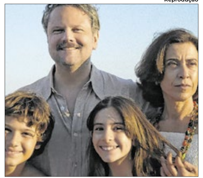
‘Ainda estou aqui’ será uma das atrações em cartaz