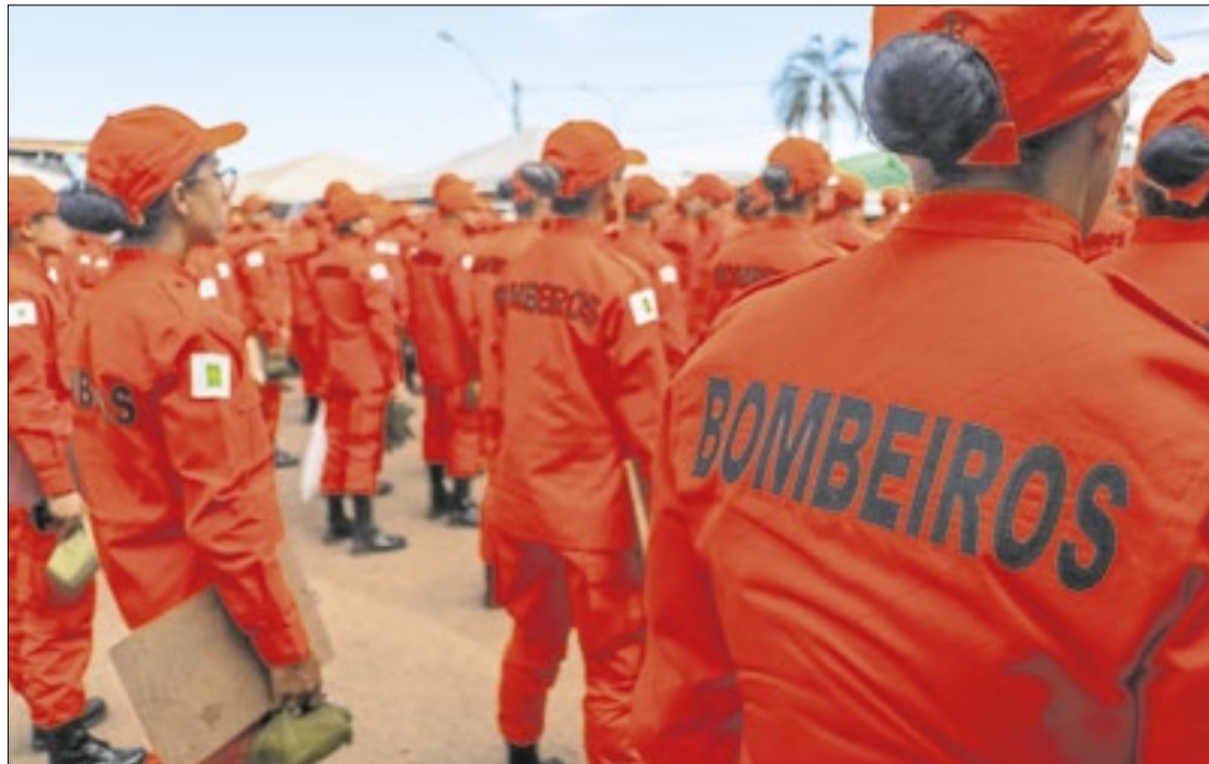
Os atendimentos psicológicos tiveram crescimento em 2024, totalizando 6.364 atendimentos