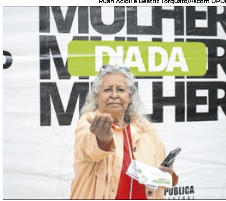
Ação contabiliza 31 mil atendimentos desde o lançamento

mes de mamografia para mulheres entre 50 e 69 anos, exames preventivos para mulheres de 25 a 64 anos, consultas de enfermagem e inserção de dispositivo intrauterino.