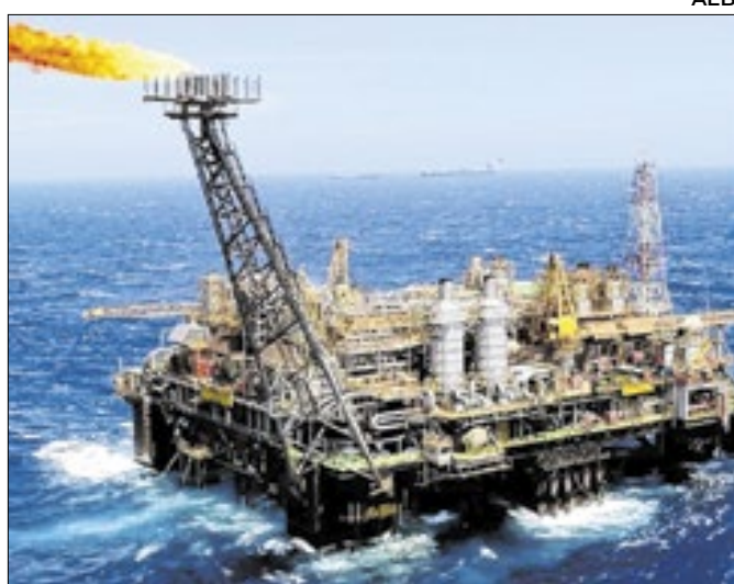
Produção de petróleo e gás do país teve ligeira queda