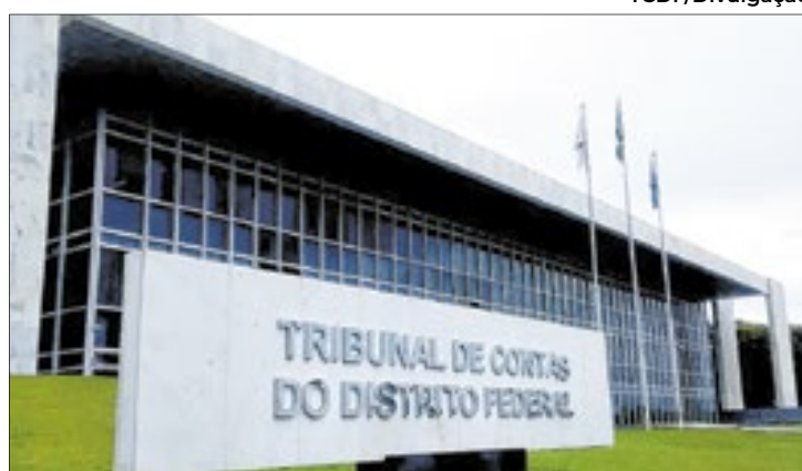
Tribunal de Contas determinou maior rigor por parte do GDF

A auditoria ainda revelou que o número de Agentes de