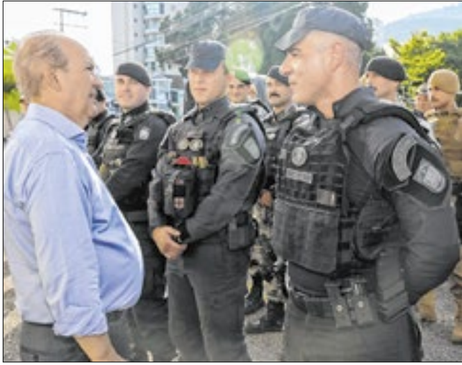
Será o maior aumento real para as categorias