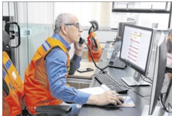
No dia 13 a Defesa Civil vai promover um workshop

A prevenção e o gerenciamento de desastres fará parte da programação do Paraná Mais Cidades, evento que vai ocorrer entre os dias 12 e 14 de fevereiro em Foz do Iguaçu, no Oeste. No dia 13 a Defesa Civil Estadual vai promover um workshop voltado aos coordenadores municipais das prefeituras, em especial para os municípios com novos prefeitos.