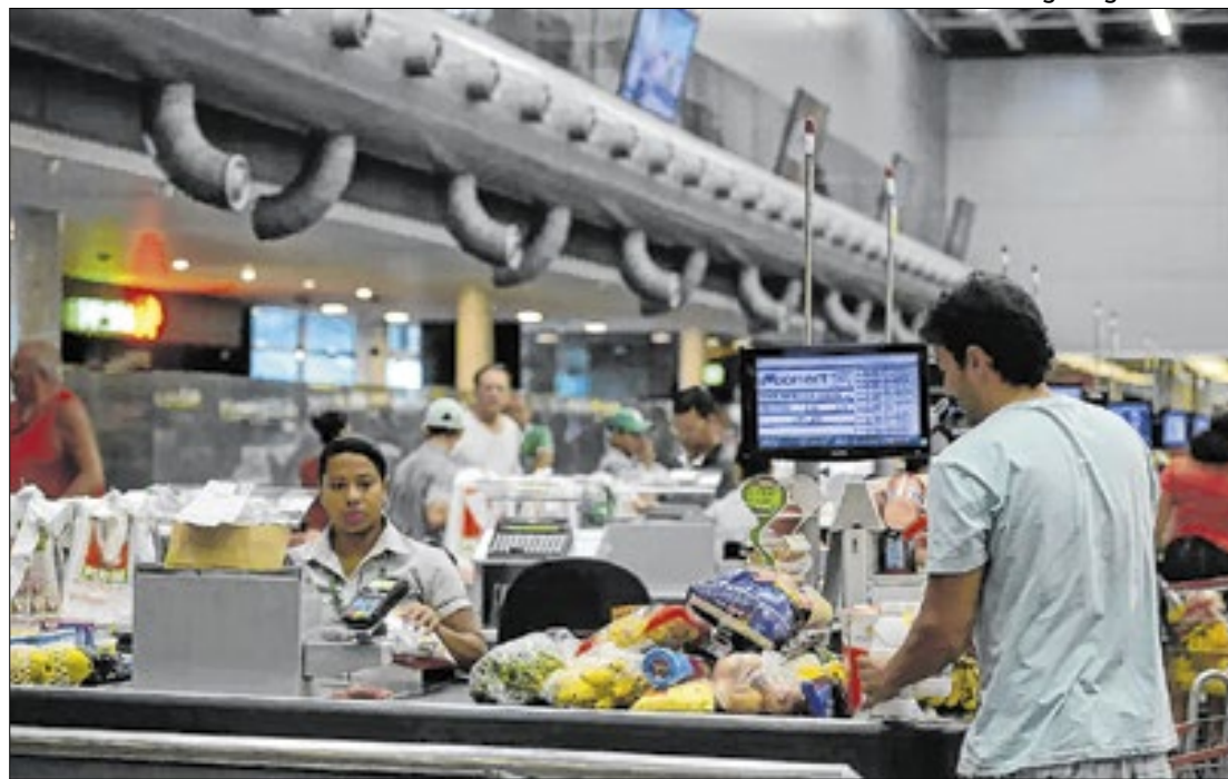
Enquanto o indicador inflacionário mantém subida, o PIB empaca pela segunda vez

O maior contraste, porém, é a 'paralisação' do PIB (Produto Interno Bruto), que 'estacionou' nos mesmos 2,06% de uma semana antes, o mesmo valendo