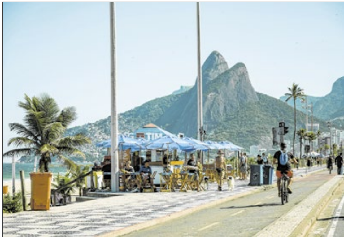
Praia de Ipanema é uma das belezas da cidade, reconhecida internacionalmente

sor se rende: "Com suas praias deslumbrantes e montanhas dramáticas, com samba e bossa nova como trilha sonora, é fácil se apaixonar pelo Rio de Janeiro", acrescentando, entre os atrativos locais, a vibração 'contagante' da música carioca e a beleza icônica da Praia de Ipanema que, no ano passado, figurou na 17ª posição entre as melhores praias do mundo, segundo o mesmo ranking.