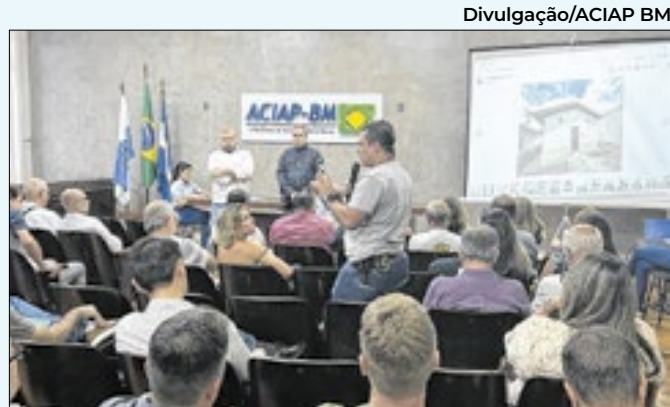
Entidades representativas do município na Aciap

Assunção e São Carlos, depois Cotiara, Morro do Macuco, São Judas e Boa Vista I e II. Equipes que coletam materiais que acumulam água e estão abandonados percorrerão estes locais.