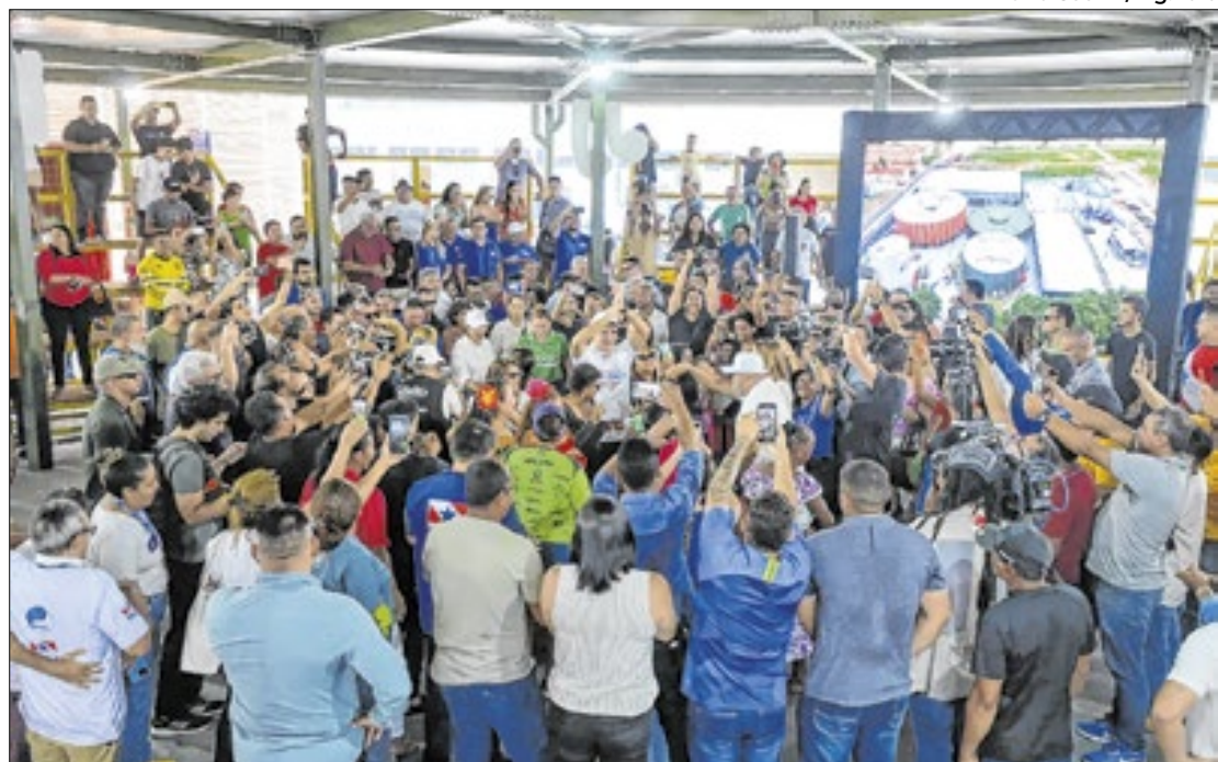
Centro de cidadania oferece serviços gratuitos e é o décimo do tipo inaugurado no Pará

Entre as instalações do complexo, há bibliotecas, teatro,