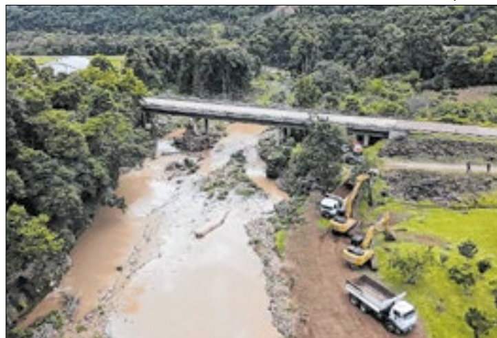
Programa tem investimento de mais de R$ 300 milhões