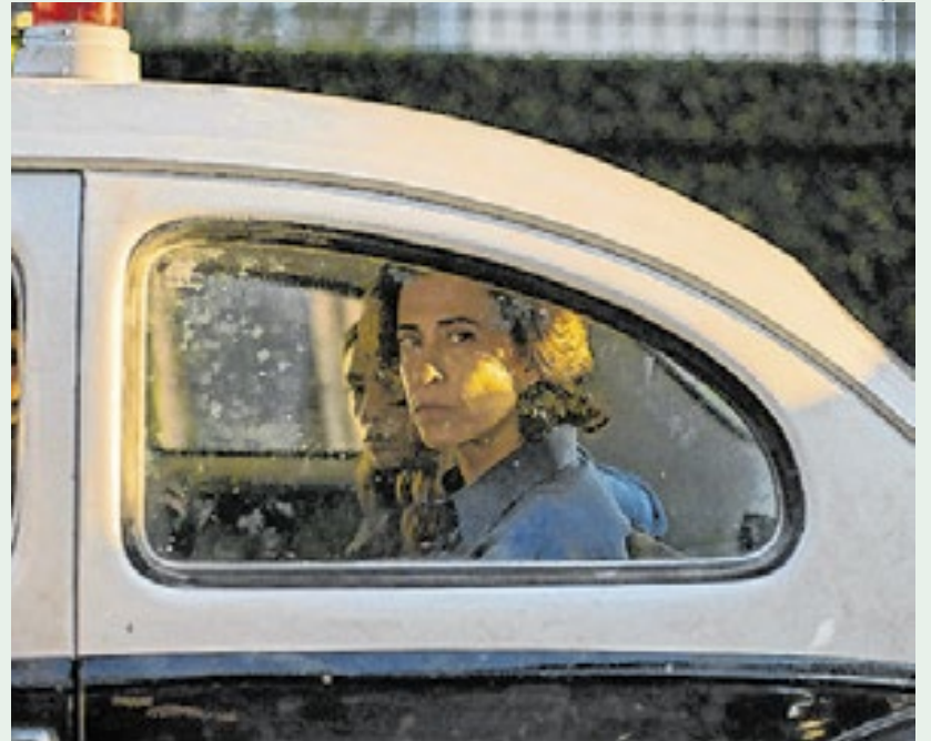
Fernanda Torres tem atuação impecável no longa

Cada vez mais prestigiada no universo cinematográfico,