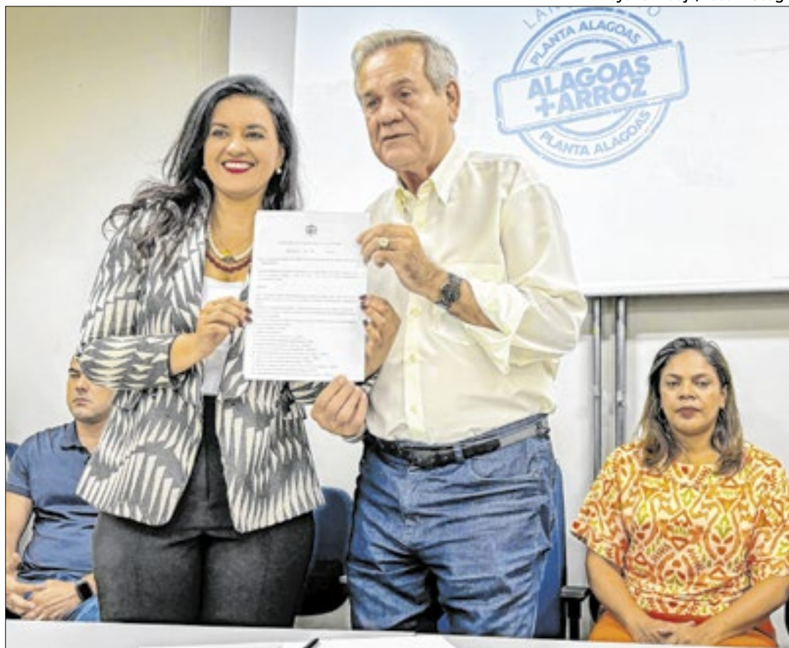
Líderes assinaram criação da Câmara Setorial da Rizicultura

O setor da rizicultura está ganhando um impulso e isso beneficia os produtores rurais. E a criação da Câmara Temática vai ajudar também a promover estudos na área e corrigir distorções, ouvindo todos que estão inseridos na cadeia produtiva do arroz", afirmou Lessa.