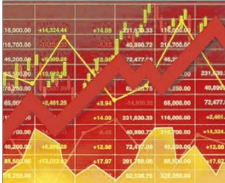
Juros ianques estáveis afetaram a recuperação da bolsa

outro de forma expressiva, até a decisão do Fed, da qual se esperava mesmo manutenção dos juros americanos – e com expectativas um pouco mais acomodadas, daqui para a frente, com relação à taxa de juros dos Estados Unidos. Não se esperava que a reunião de hoje