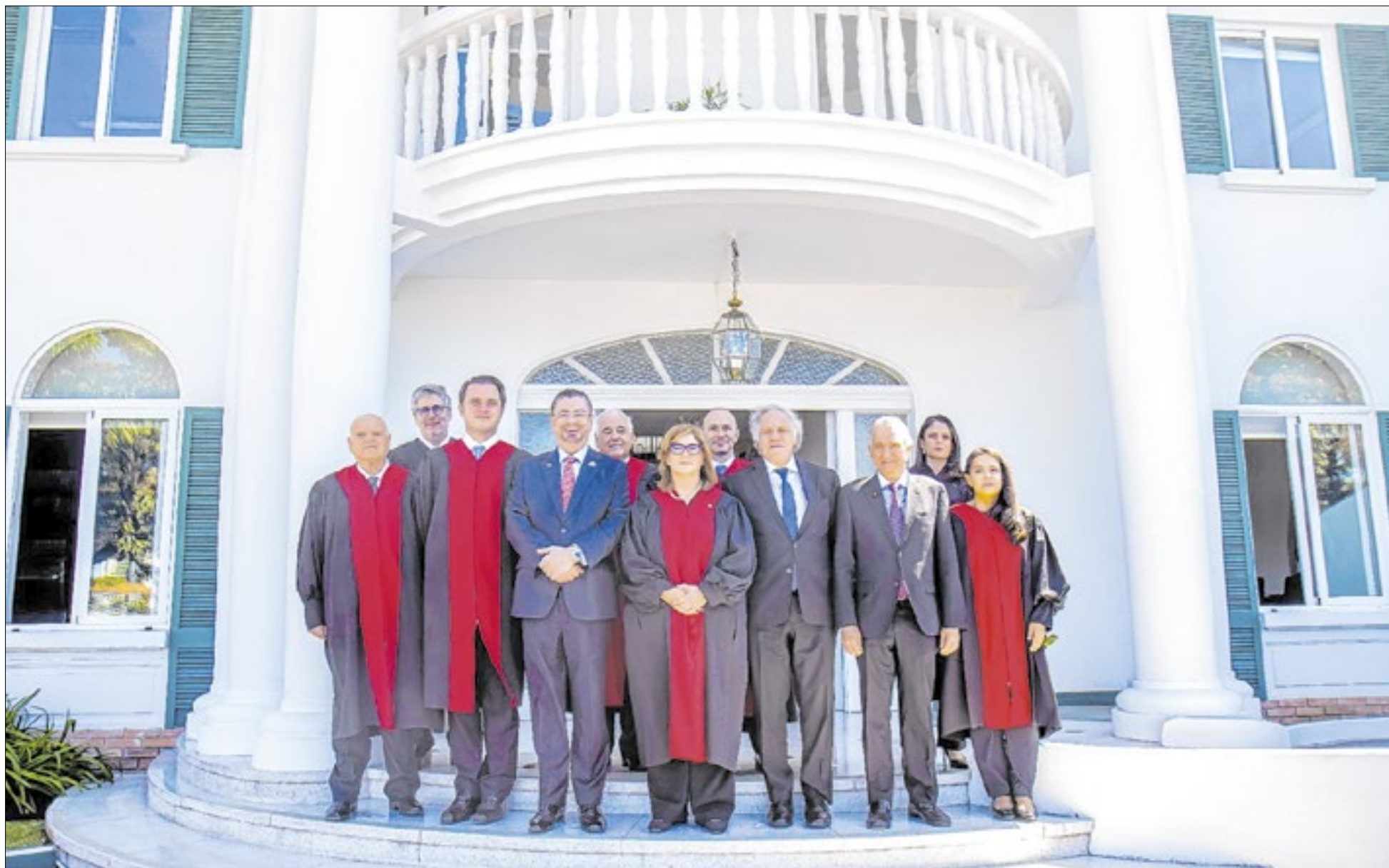
Ministro Edson Fachin representou o STF na abertura do Ano Judiciário da Corte IDH, que tem sede no país da América Central

Solenidade teve presença do presidente da Costa Rica, Rodrigo Chaves Robles