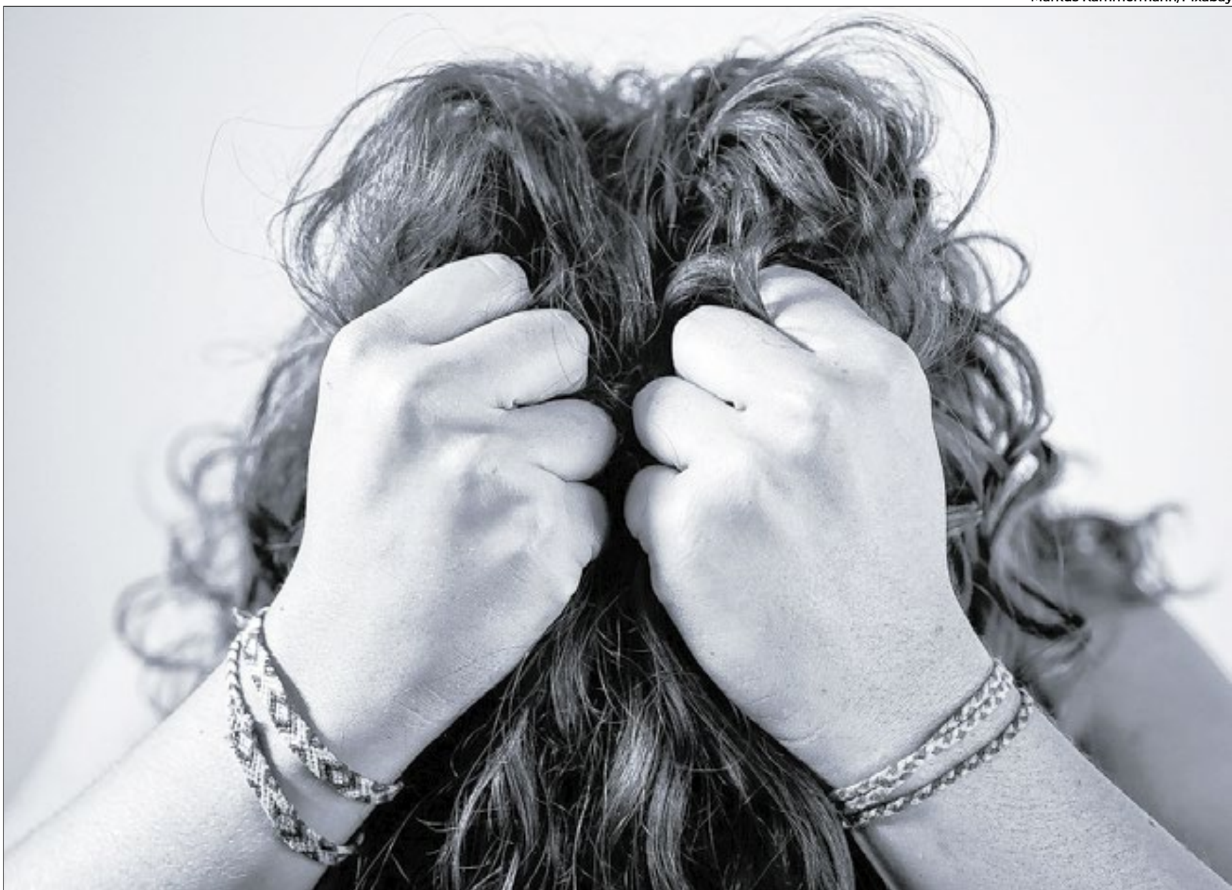
Síndrome de esgotamento emocional é reconhecida na Classificação Internacional de Doença da Organização Mundial da Saúde