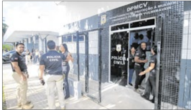
O Batalhão é responsável pelas fiscalizações na Bahia