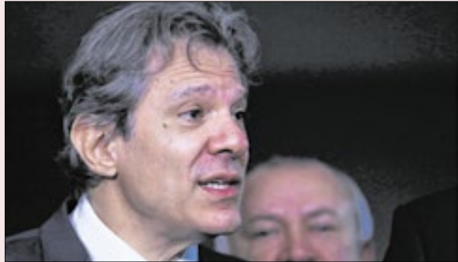
Crise do Pix enfraqueceu Haddad