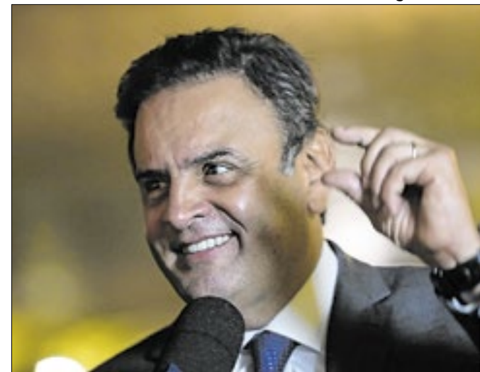
Aécio Neves é o principal articulador da proposta