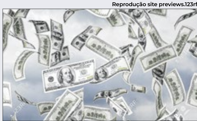
Fluxo cambial negativo reflete 'debandada' do dólar

Por instituições, a Caixa Econômica Federal segue líder, com R$ 79,6 bilhões ou 42,6% do volume total de financiamentos SBPE (Sistema Brasileiro de Poupança e Empréstimo) em 2024, seguido do Itaú com R$ 42,5 bilhões (22,9%) e Bradesco, com R$ 38,1 bilhões (20,4%).