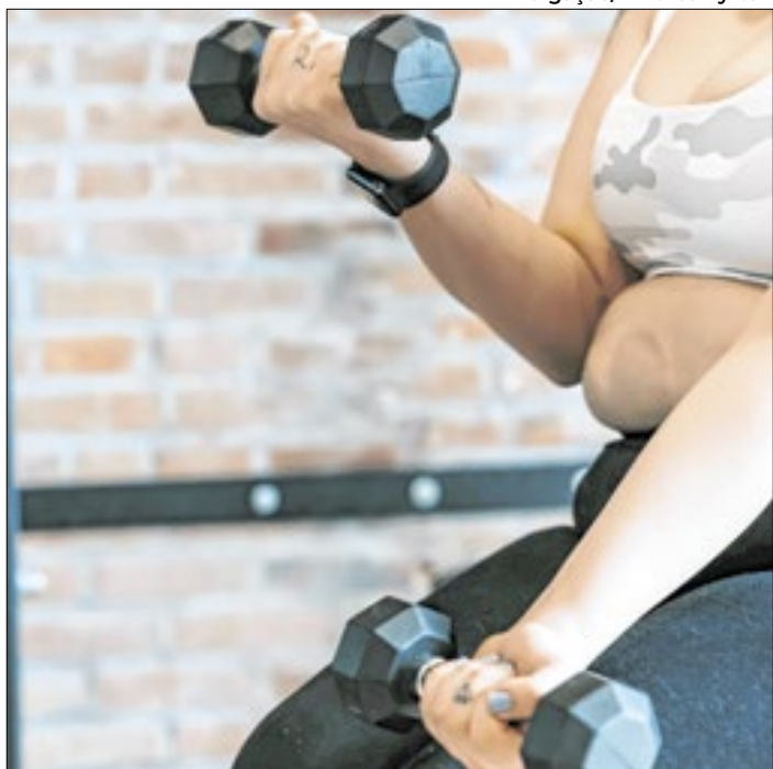
Atividade física é recomendada para minimizar impactos do problema

sos de Burnout são registrados no Brasil desde 1970, mas os diagnósticos cresceram consideravelmente a partir de 1990. “Atualmente as formas de trabalho e as ferramentas tecnológicas possibilitam que o colaborador trabalhe por mais tempo e até aos fins de semana. O uso do home office, por exemplo, amplia essa carga horária. Ademais, há hoje um estudo mais aprofundado sobre a síndrome do burnout. Um deles, por exemplo, o burnout materno, ou seja, da mulher que é trabalhadora e mãe e que também tem as tarefas a serem realizadas em casa”, comenta. Entre as profissões com maior registro de colaboradores diagnosticados com a síndrome estão: médicos, enfermeiros, professores, policiais, jornalistas, dentre outros.