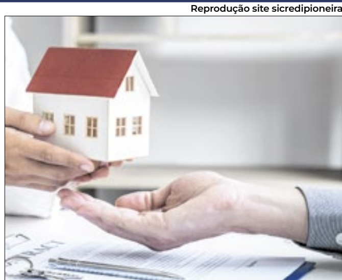
Demanda por financiamento da casa própria motivou alta