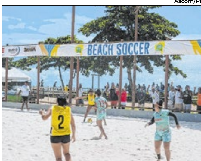
Nos finais de semana, são realizadas as competições

Dados são da 15ª edição do seminário Brasil em Números