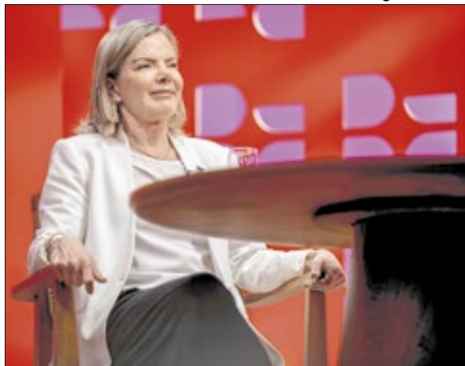
Gleisi ajudaria na articulação com bases petistas