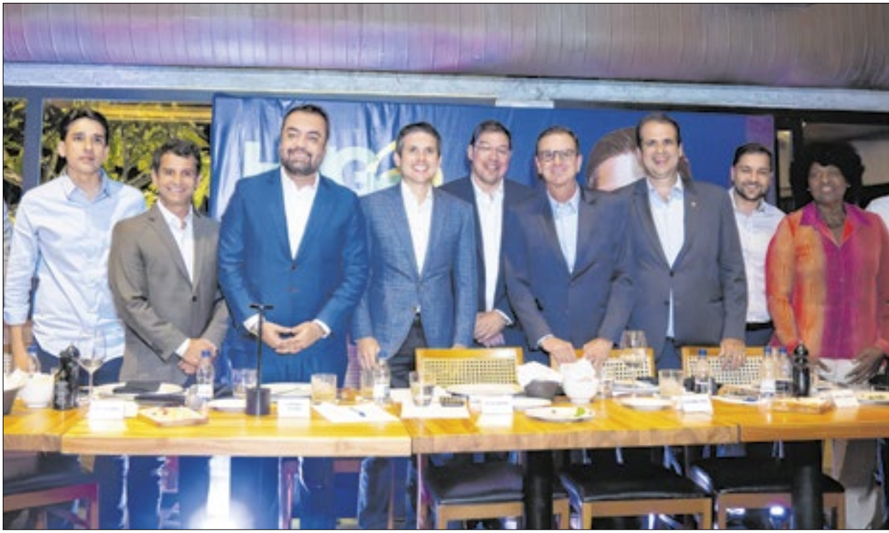
O ministro de Portos e Aeroportos Sílvio Costa Filho ; o deputado Dr. Luizinho ; o governador do Rio, Cláudio Castro ; o deputado Hugo Motta ; o deputado Altineu Côrtes ; o prefeito do Rio, Eduardo Paes ; o deputado Áureo Ribeiro ; o vice-governador do Rio, Thiago Pampolha ; e a deputada Benedita da Silva no evento de apoio dos parlamentares do Rio à candidatura de Hugo Motta para a presidência da Câmara dos Deputados.