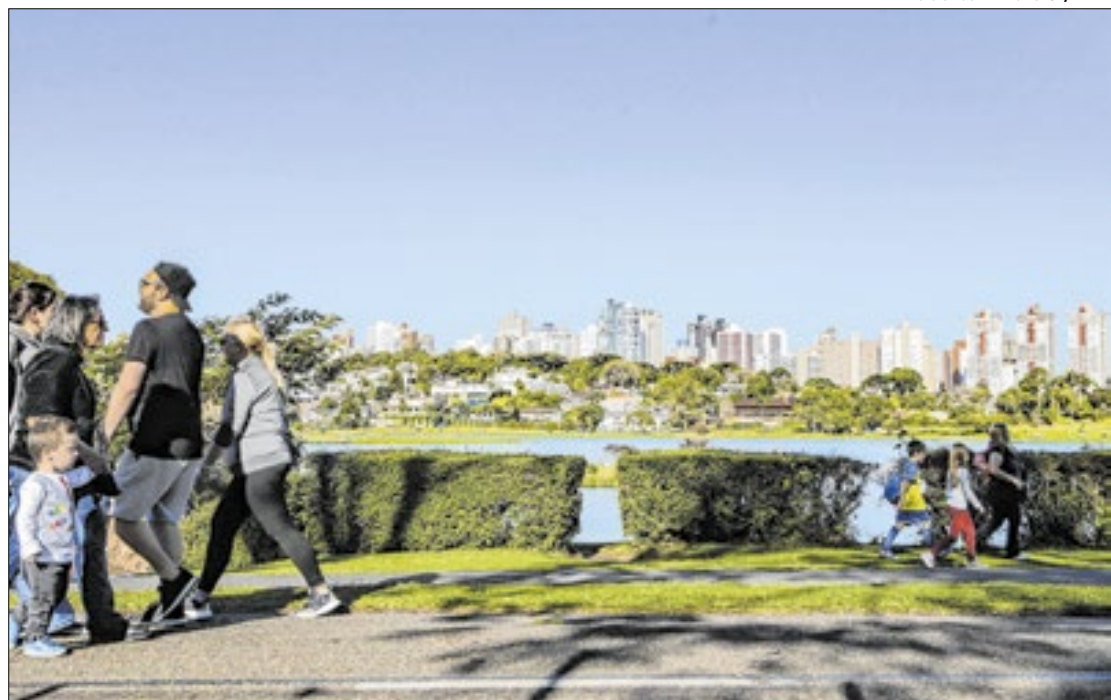
O valor teve um crescimento de 12% quando comparado com 2023

O gasto médio de cada viajante internacional também registrou crescimento por conta da variação cambial. A estimativa é que cada turista estrangeiro gastou um ticket médio de US$ 1,1 mil em 2024. O valor teve um crescimento de 12% quando comparado com 2023, quando o ticket médio por turista estrangeiro foi de US$ 1 mil. O cálculo envolve gasto total de turistas internacionais no Brasil, total de turistas estrangeiros que visitaram o País, total de turistas estrangeiros que visitaram o Paraná e cotação do dólar no dia 28 de janeiro de