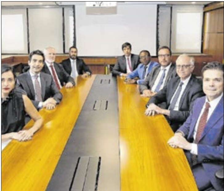
Alta de um ponto percentual da Selic se repetirá