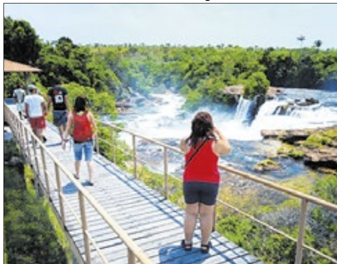
Os destaques são o ecoturismo e o turismo de aventura