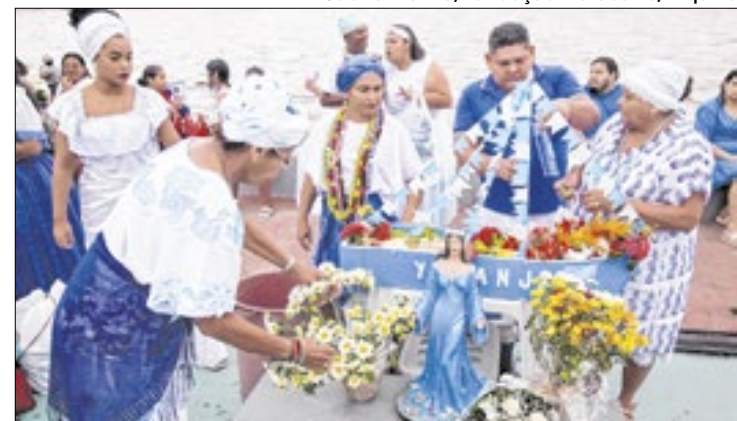
Evento reúne 87 casas de religiões afro-amapaenses