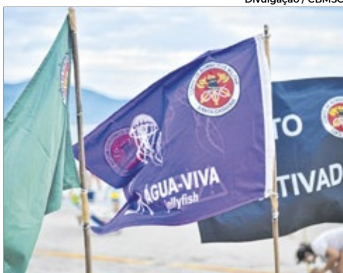
Corpo de Bombeiros instrui banhistas