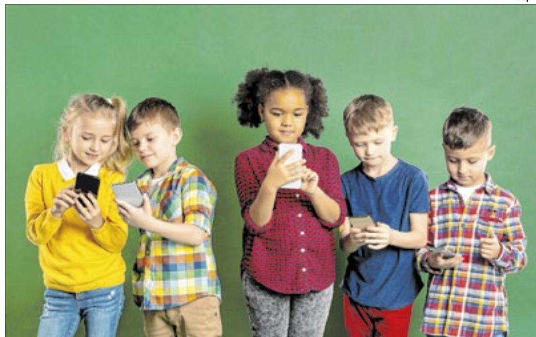
Estudo foi atribuído a crianças e adolescentes de 7 a 17 anos

A pesquisa divulgada pelas entidades foi realizada com a participação de 2.006 respon-