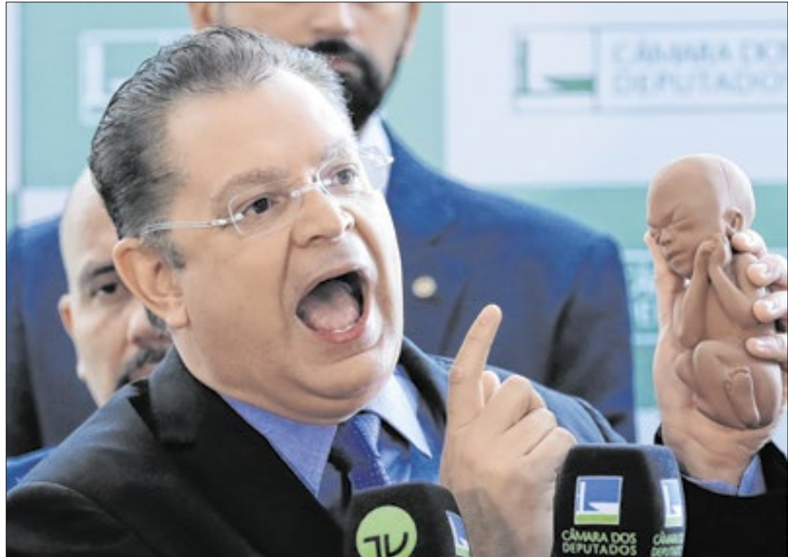
Sóstenes Cavalcante será o novo líder do PL na Câmara

Portanto, como o líder representa a bancada, ele que é o responsável por negociar sobre o interesse do grupo para as demais lideranças. E dependendo de quem é o representante, as negociações podem seguir, ou não. Especialmente aquelas que envolvem a relação entre o governo e o Congresso.