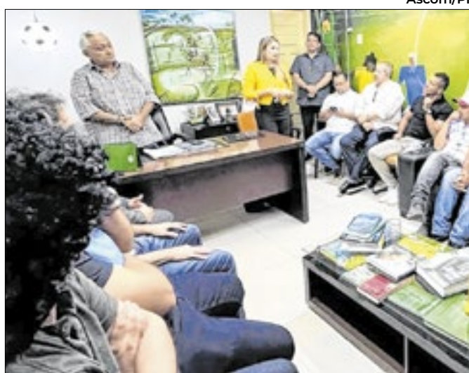
O recurso representa um aumento significativo

21 mil aprovados, com destaque para escolas da rede pública