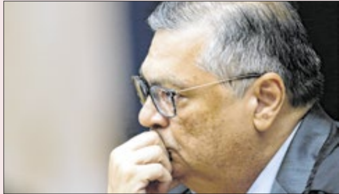
Nenhuma decisão de Dino evitará briga orçamentária