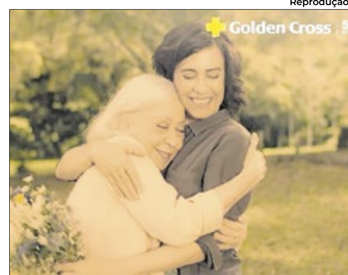
Fernandas: a Golden Cross não estará mais por aqui