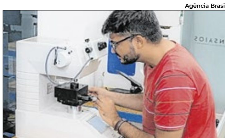
MA é referência entre estados que mais apoiam a ciência

Para muitos dos aprovados, a conquista representa não ape-