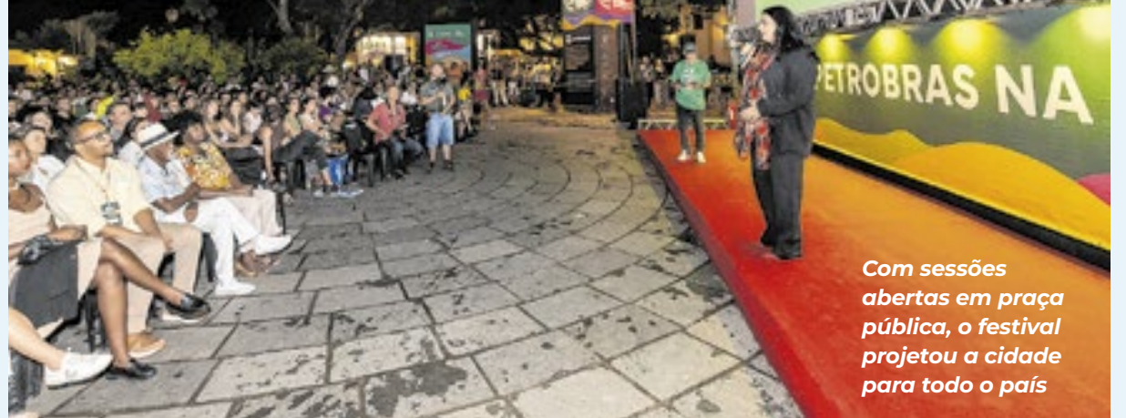
Com sessões abertas em praça pública, o festival projetou a cidade para todo o país

Na reta final de sua programação, a Mostra de Tiradentes consolida a produção audiovisual de Minas Gerais como uma das mais plurais do Brasil