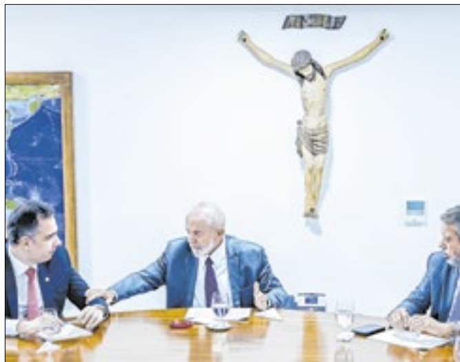
Lula terá tempos mais tranquilos sem Pacheco e Lira?