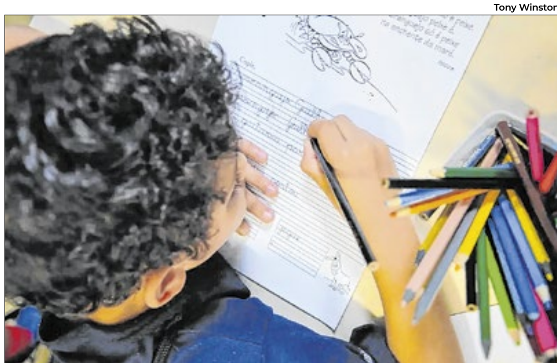
Bahia conquista o terceiro melhor resultado do país em aprovações no Sisu

O programa de formação "Da Horta à Mesa" está de volta à Escola de Gastronomia Social Ivens Dias Branco (EGSIB), trazendo uma experiência única que conecta o cultivo sustentável ao preparo culinário. O equipamento da Secretaria da Cultura do Ceará (Secult).