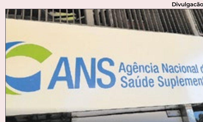
ANS pode vetar candidatas a herdar segurados

Na nota, porém, a ANS afirma que irá examinar a proposta de compra da carteira de clientes da Vision Med, nome oficial da Golden Cross. Caberá à agência avaliar a capacidade da operadora “que eventualmente se propõe” assumir os tais planos de saúde.