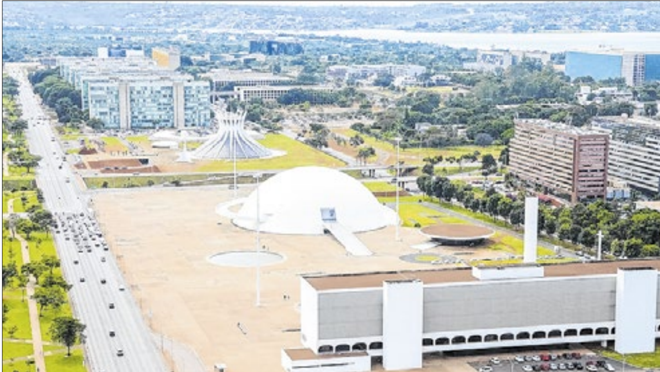
Brasília ganha destaque durante o Carnaval, com um aumento significativo de buscas na plataforma

Segundo pesquisa do Airbnb, cidade está entre as mais procuradas por viajantes, ao lado de Tóquio (Japão), Vancouver (Canadá) e Cartagena (Colômbia)