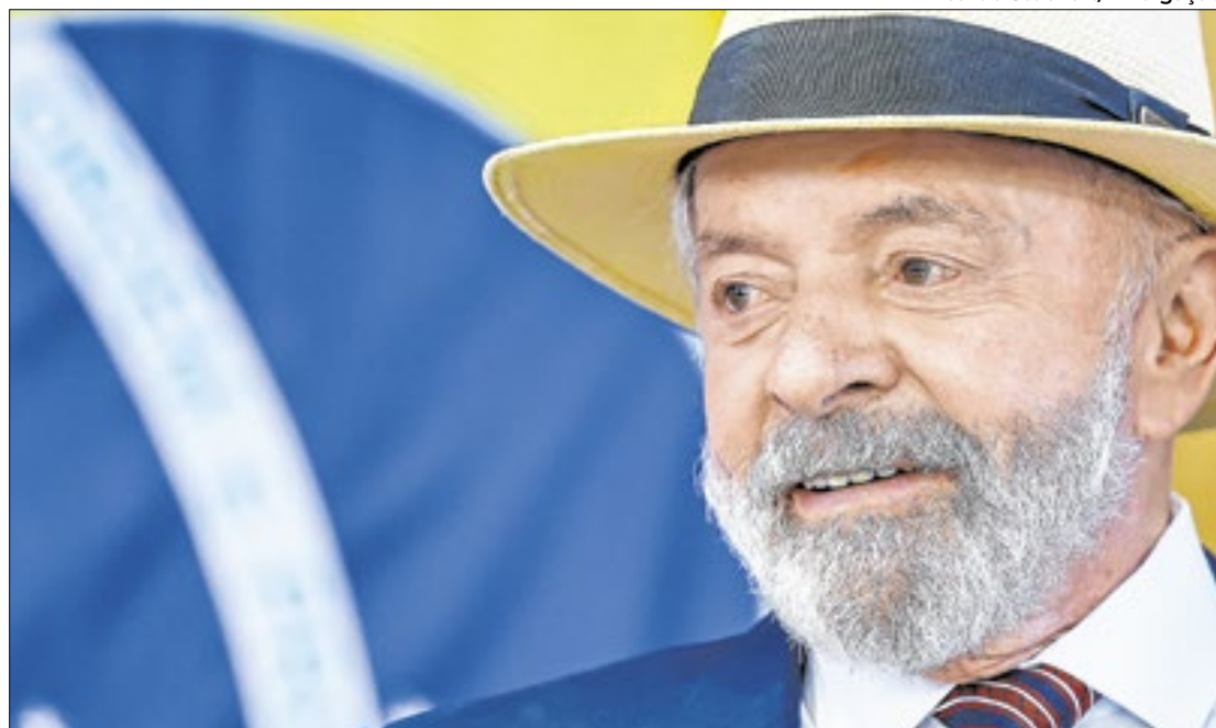
Presidente Lula afirma que quer garantias de tratamento digno aos deportados