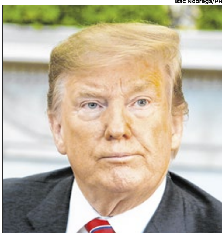
Trump faz novas ameaças no comércio com o Brasil