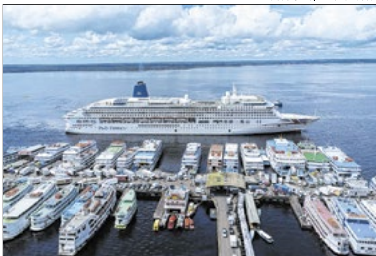
Navio MS Aurora segue para Parintins após atracar em Manaus

O "MS Aurora", maior navio da temporada de cruzeiros deste ano no Amazonas, atracou em Manaus nesta terça-feira (28) com 2.456 pessoas, entre turistas e tripulantes. A recepção contou com apresentações culturais e serviços bilíngues. O navio segue nesta quarta-feira (29) para Parintins, fomentando o turismo local. A programação inclui o estímulo à visitação de pontos turísticos históricos e culturais.