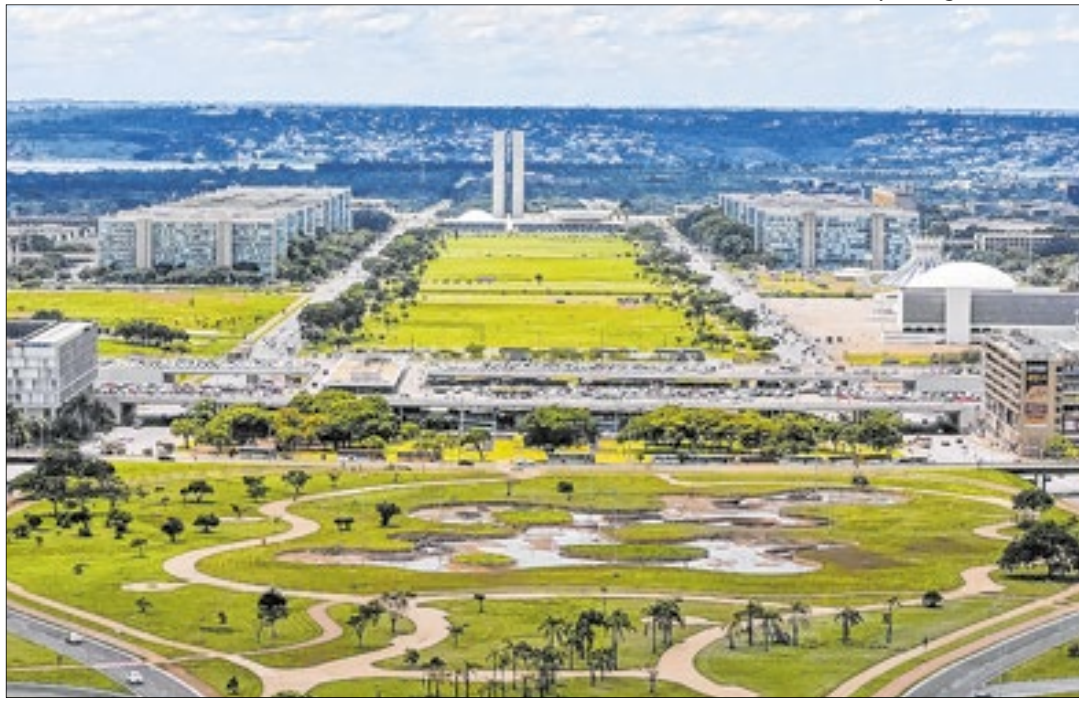
Aspecto geral da capital, com arquitetura diferenciada, é de uma galeria de arte a céu aberto