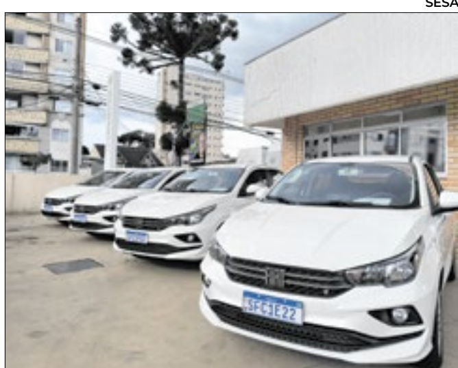
Carros entregues otimizarão serviço