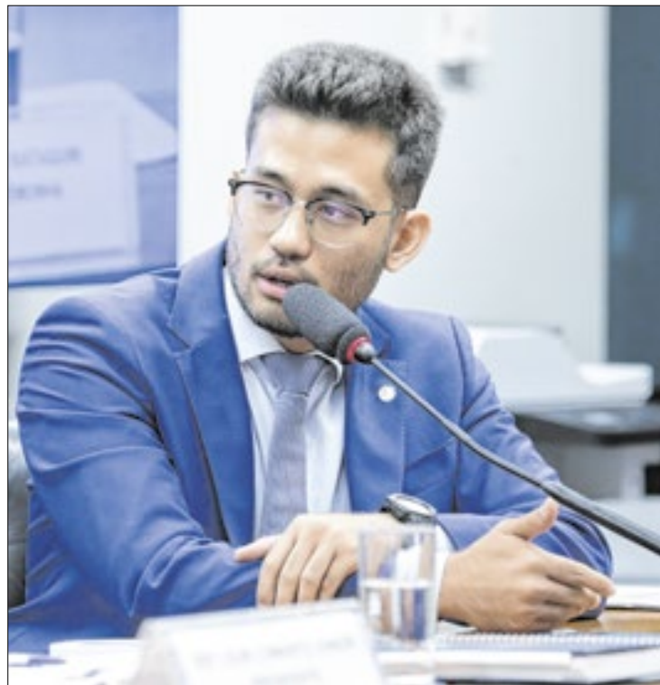
Kim: cuidados no uso do dinheiro público por artistas

O projeto é batizado de Projeto de Lei Anti-Oruam. O nome se refere ao rapper Oruam, que é filho do traficante Marcinho VP, um dos principais líderes da facção Comando Vermelho (CV). O artista é considerado polêmico. Em uma apresentação no festi-