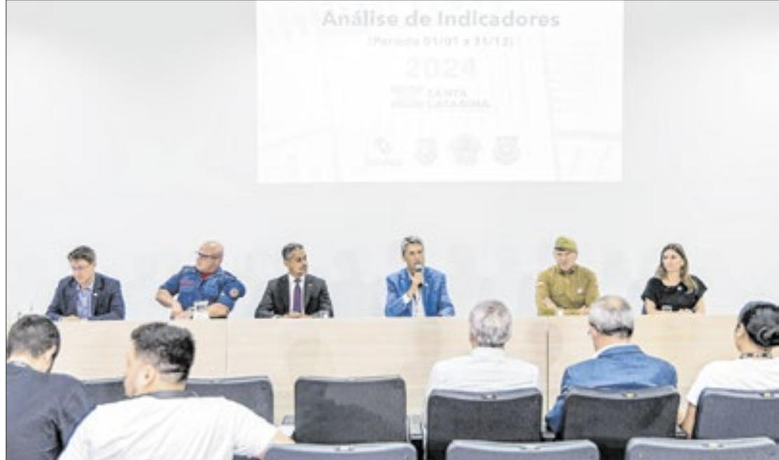
Os roubos caíram 13,8% na comparação com 2023, é a menor taxa da série histórica

Os roubos caíram 13,8% na comparação com 2023, é a menor taxa da série histórica e ainda com um declínio de 33,3% na média dos últimos quatro anos. Destaque ainda para a diminuição de roubos de celulares, residências e comércios, além da queda de 27% nos roubos e 9,8% nos furtos de veículos. Já os furtos em geral registraram uma redução de quase 4 mil casos, representando 4% a menos em relação a 2023, com