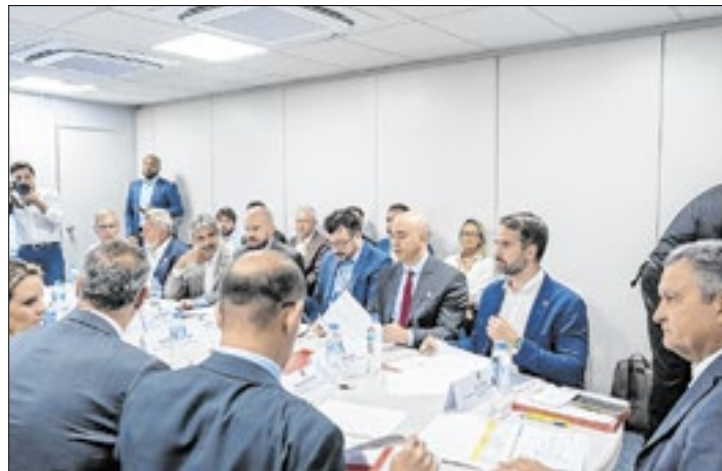
Leite e secretários se reuniram com o governo federal

O governador Eduardo Leite esteve reunido na manhã desta terça-feira (28/1) com o ministro da Casa Civil, Rui Costa, e uma comitiva do governo federal para a primeira reunião do Conselho de Monitoramento das Ações e Obras para Reconstrução do Rio Grande do Sul, que trata especialmente dos projetos para sistemas de contenção de cheias. Acompanhado de secretários, Leite também apresentou uma atualização das ações de resiliência climática desenvolvidas pelo Plano Rio Grande, que já contabiliza mais de R$ 6,7 bilhões em investimentos em todas as áreas.