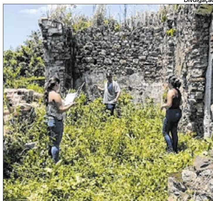
Visita técnica nas ruínas da Igreja da NS da Estrela dos Mares

"Essa etapa foi muito importante, pois é a partir dela que conseguiremos identificar os problemas e propor as soluções necessárias para a conservação da construção. Esse levantamento de hoje é prova