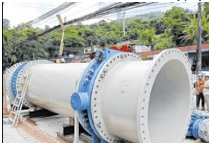
Projeto 'estratégico' compromete abastecimento da região