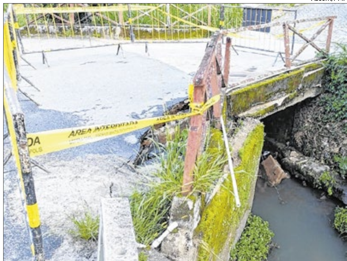
A estrutura foi danificada pela chuva e cedeu na última sexta-feira, 24 de janeiro