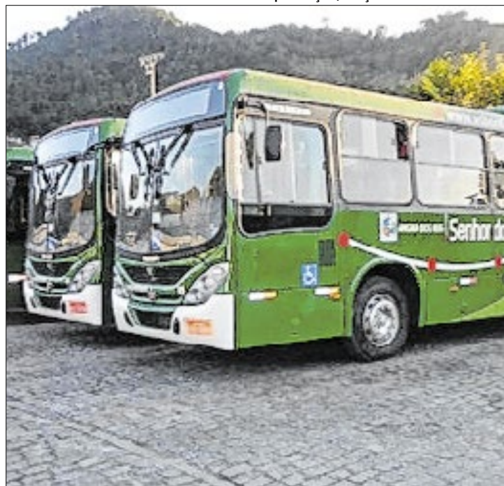
A iniciativa visa proporcionar mais segurança e conforto para as usuárias do transporte público