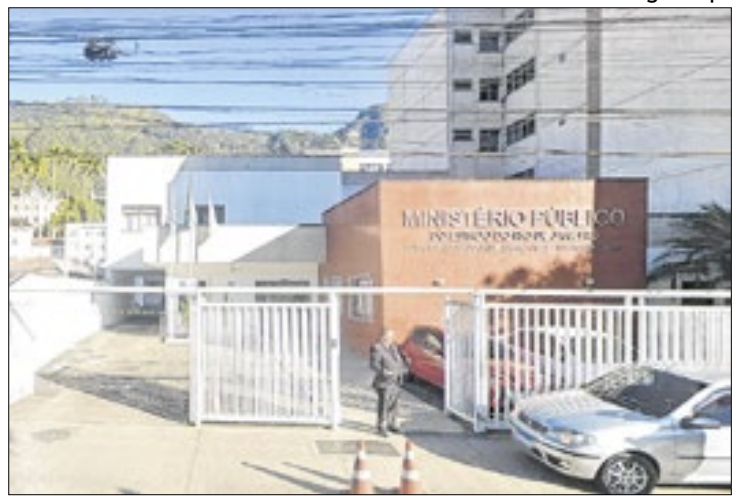
Município terá prazo de 30 dias úteis para se manifestar

O Ministério Público do Estado do Rio de Janeiro (MPRJ), por meio da 2ª Promotoria de Justiça de Tutela Coletiva do Núcleo Nova Friburgo, expediu uma "Recomendação", nesta segunda-feira (27), para que a Prefeitura de Nova Friburgo, a Secretaria Municipal de Bem-estar e Proteção Animal (Sebea) e a Procuradoria Geral do Município implementem ações mais efetivas para o controle populacional e proteção de cães e gatos, notadamente daqueles que vivem nas ruas.