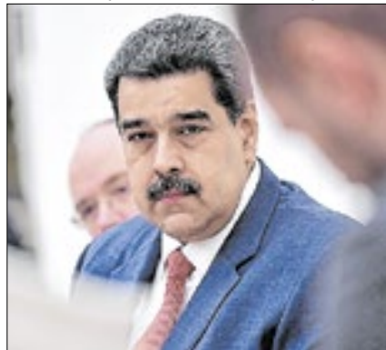
Maduro agora é paz e amor?

O ditador venezuelano Nicolás Maduro disse nesta segunda-feira (27) que os desentendimentos com o Brasil são “águas passadas”. A fala foi aplicada durante uma entrevista concedida ao jornalista