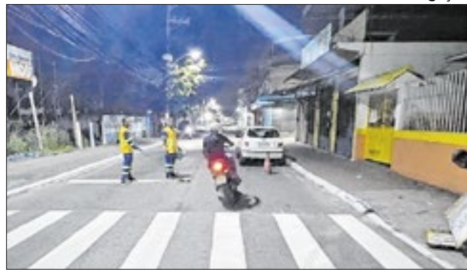
Sinalização visa garantir segurança e fluidez