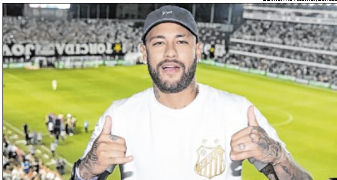
Jogador fica na Vila Belmiro até o fim do primeiro semestre, a princípio

O brasileiro atuou muito pouco desde a queda do Brasil na última Copa do Mundo, em dezembro de 2022. Fora dos planos do Paris Saint-Germain,