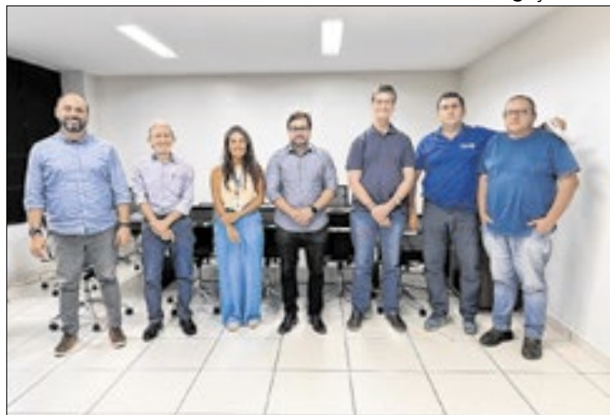
Representantes da Firjan visitaram a prefeitura