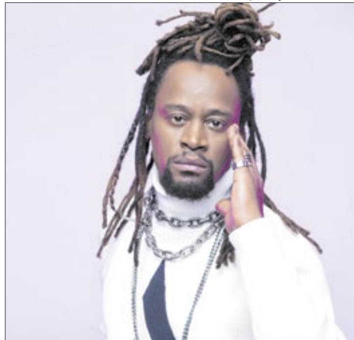
Cantor se apresenta na próxima semana, no sábado (08)

Toni Garrido será a grande atração do Sesc Verão em Angra dos Reis, com um show que promete agitar o público na Praia do Anil no dia 8 de fevereiro, à meia-noite. A programação musical continua no dia seguinte, 9 de fevereiro, às 15h30, com a apresentação do grupo regional Angra Axé Petriz.