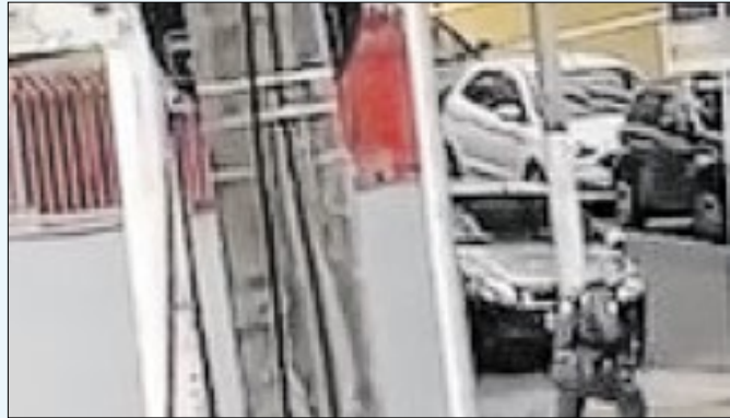
Confronto obrigou o desvio de quatro linhas de ônibus