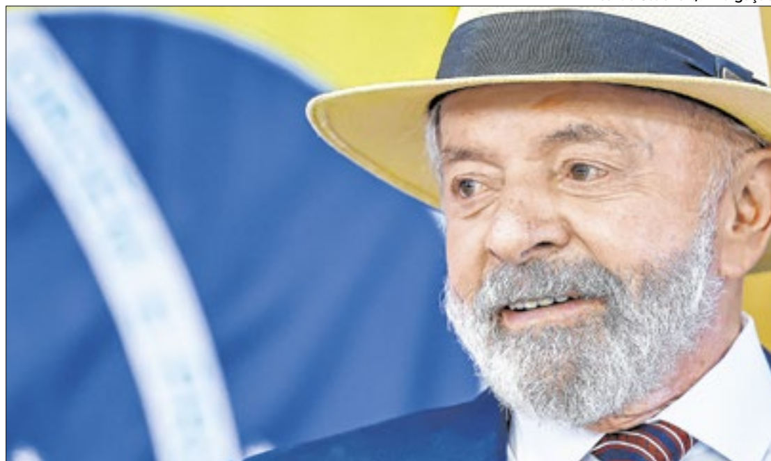
Presidente Lula afirma que quer garantias de tratamento digno aos deportados