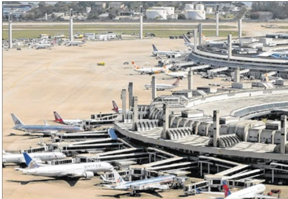
Após sequência de crescimento histórica, Galeão quer manter 'decolagem' em 2025

rápida, mediante a operação de 27 destinos domésticos e 25 internacionais, patamar que serviu para que este recuperasse sua malha aérea. Entre os destinos nacionais, se destacam: Campo Grande (MS) e São José dos Campos (SP) foram incluídos na malha, enquanto rotas regulares para Belo Horizonte (MG), Goiânia (GO) e Vitória (ES) foram retomadas.