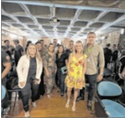
Ação fortalece a rede de saúde

A Prefeitura de Cordeiro, por meio da Secretaria de Saúde, participou da reunião do 'Grupo de Trabalho Ampliado da Rede de Urgência e Emergência/SAMU', realizada em Petrópolis. O encontro foi promovido em parceria com o