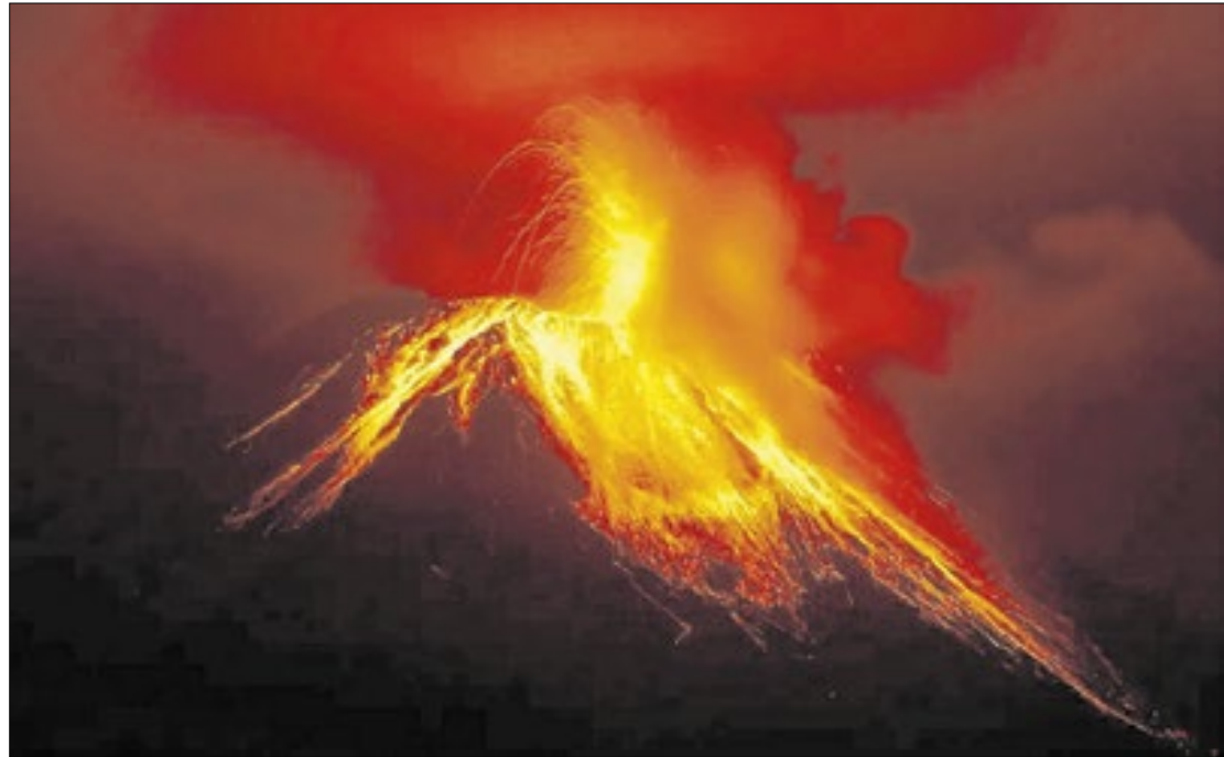
Reprodução site Infomoney

Ao comentar que as 'notícias ruins' têm dia e hora para chegar, o executivo previu que, de 2024 a 2026, o país arcará com déficits nominais da ordem de 10% do Produto Inter-