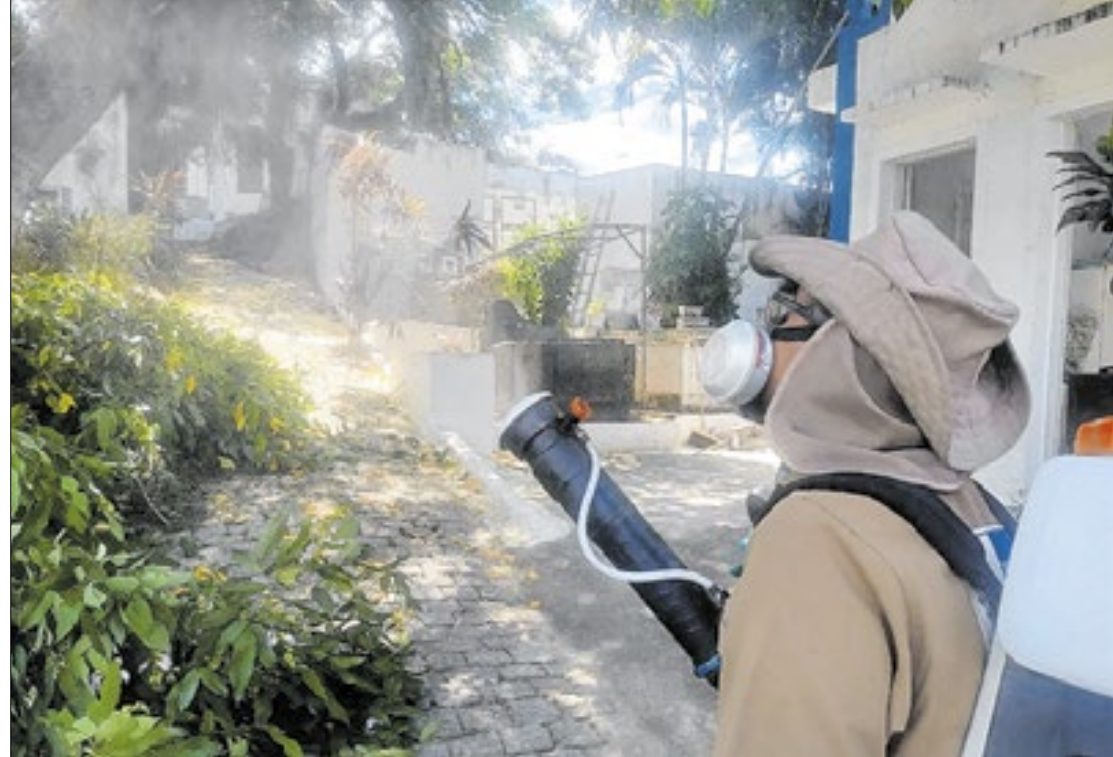
Tratamento é peri focal e consiste na aplicação de adulticida em pontos estratégicos