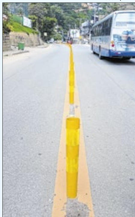
Foram instalados no trecho do número 11.390 da estrada União e Indústria

A Prefeitura de Petrópolis, por meio da Companhia Petropolitana de Trânsito e Transportes - CPTrans, conseguiu junto ao Departamento Nacional de Infraestrutura de Transportes - DNIT a instalação de balizadores para evitar que motoristas e condutores de motos façam ultrapassagens ou manobras proibidas no trecho do número 11.390 da estrada