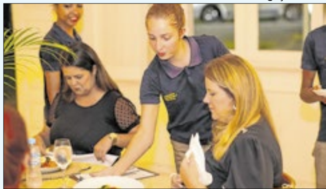
Podem participar da iniciativa, jovens de 16 a 29 anos.