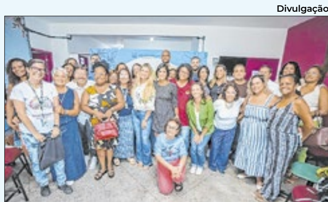
Encontro foi realizado no CEAM de Meriti

A concessionária Águas do Rio, responsável pela distribuição de água no município, foi comunicada.