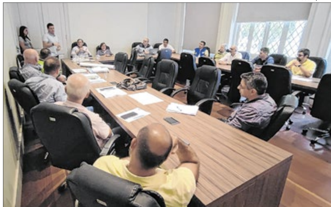
Estímulo para que as pessoas troquem o veículo individual pelo coletivo foi pauta do encontro