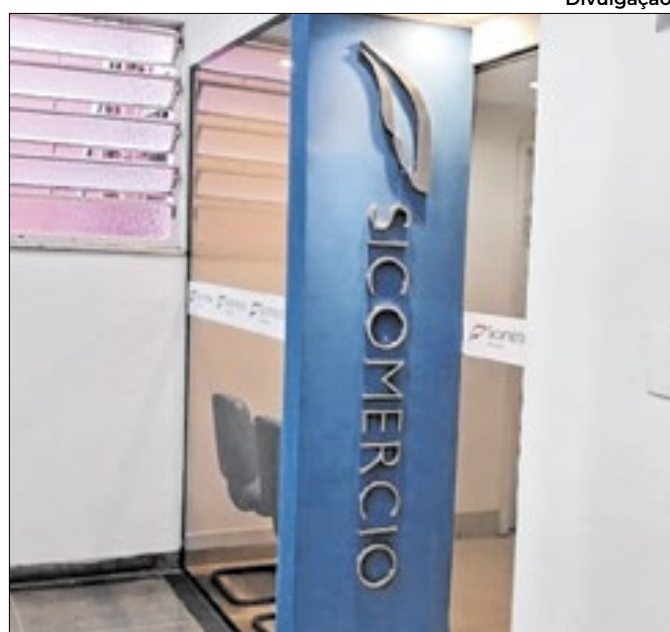
Evento é direcionado aos empresários petropolitanos