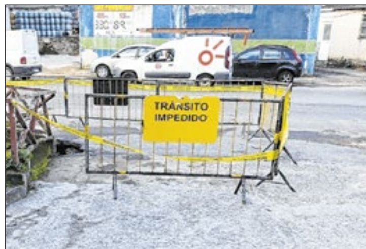
Intervenção deve ser finalizada em um prazo de 30 a 45 dias.

acaba gerando problemas na passagem do rio no trecho. “Ela gera um estreitamento, que dificulta a passagem da água. Com a nova ponte, essa estrutura será modificada para recuperar o curso natural do rio”.