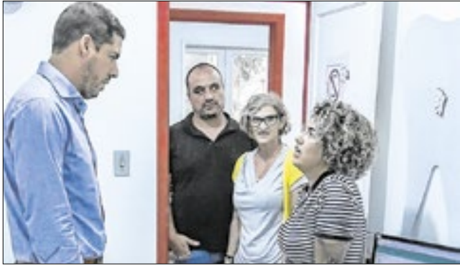
Secretaria busca traçar demandas das unidades