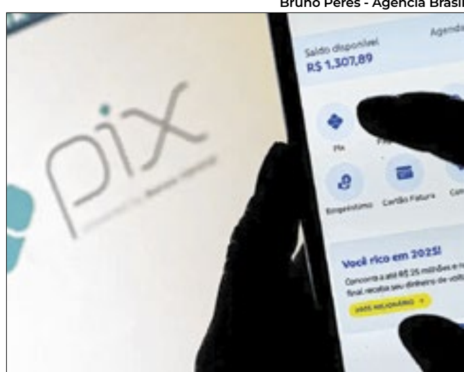
Bruno Peres - Agência Brasil