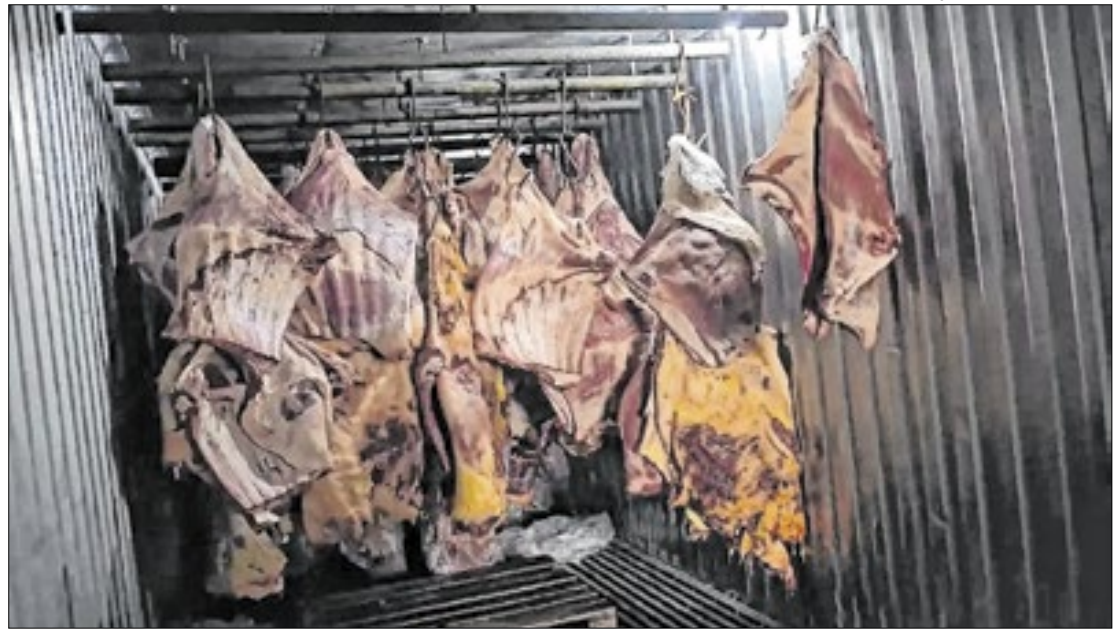
O produto ficou submerso nas enchentes registradas no Rio Grande do Sul em 2024