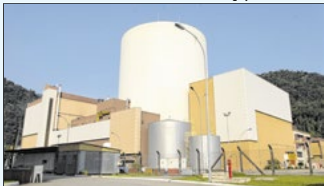
Inteligência artificial contribuiu para licença de Angra 1