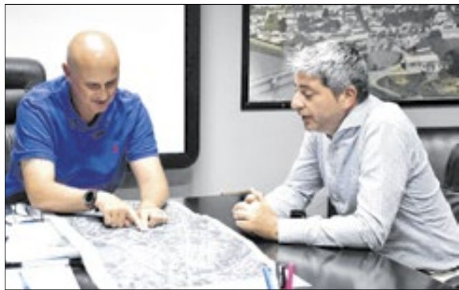
Tande Vieira debate projetos com o senador Portinho