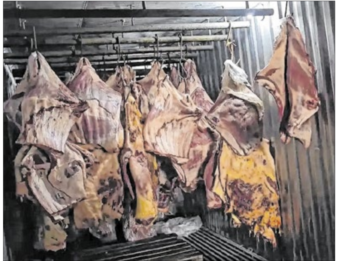
De acordo com as investigações, o grupo vendeu a carne para outras empresas