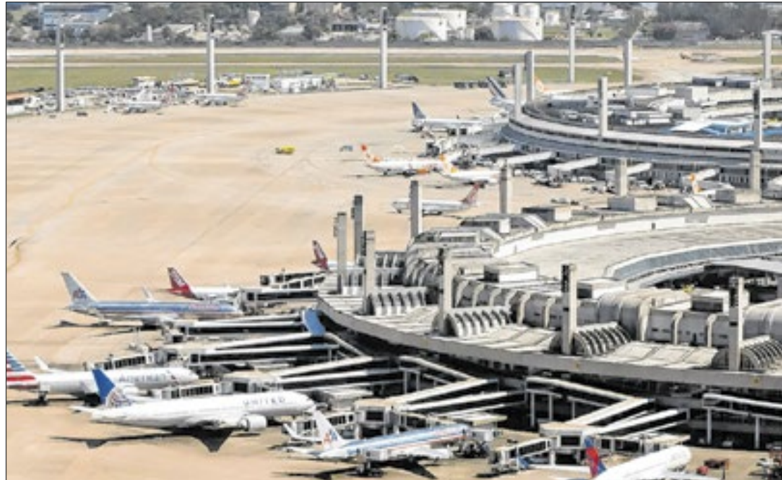
Daniel Basil-Gov Brasil-Wikipedia

Atualmente, o Galeão é controlado pela concessionária RIOGaleão, que conta com 49% de participação da Infraero, e pela Changi, de Cingapura, que detém os 51% restantes.