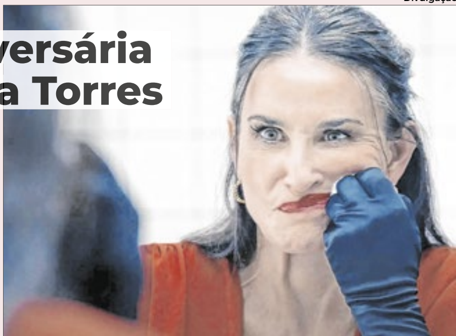
Demi Moore volta ao estelato no papel de uma apresentadora de TV decadente que recorre a uma fórmula para se renovar

Apesar da torcida nacional, a brasileira tem uma adversária de peso. A Substância' cresce no boca a boca para as indicações ao Oscar, que serão anunciadas hoje e que podem dar a estatueta para Demi Moore