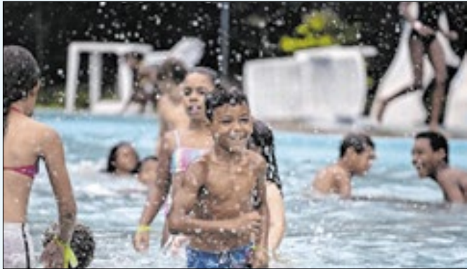
Interessados devem se inscrever até esta sexta (24)