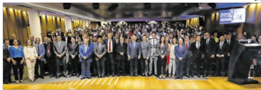
O presidente do TCE-RJ, Márcio Pacheco, com os servidores durante a entrega dos distintivos no tribunal