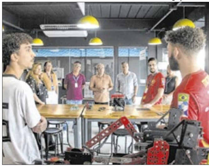
Oportunidades serão abertas no mês de março