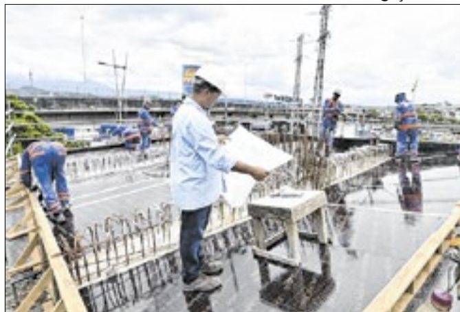
Ampliação do Viaduto Dom Adriano Hipólito