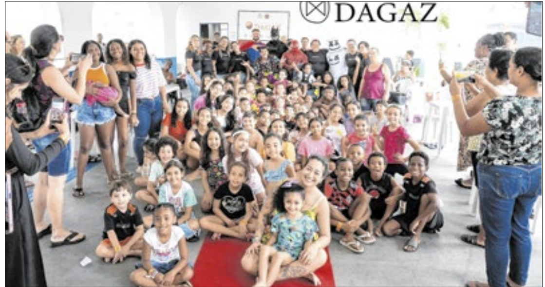
Crianças a partir de 3 anos já podem ser matriculados e aulas são gratuitas

O Instituto Dagaz está com inscrições abertas até o dia 03 de fevereiro para as modalidades culturais, esportivas e artísticas do Condomínio Cultural 2025. A novidade deste ano é que, além das modalidades que o Dagaz já oferece como: balé, teatro, aula de violão, capoeira, circo, futsal, hip hop e expressão corporal, haverá três novas modalidades oferecidas, são elas: Rugby, basquete 3x3 e futevôlei.