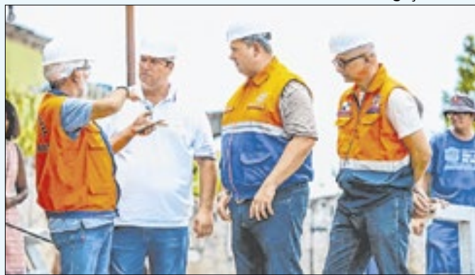
Lonas de contenção e guarda-corpos foram instaladas