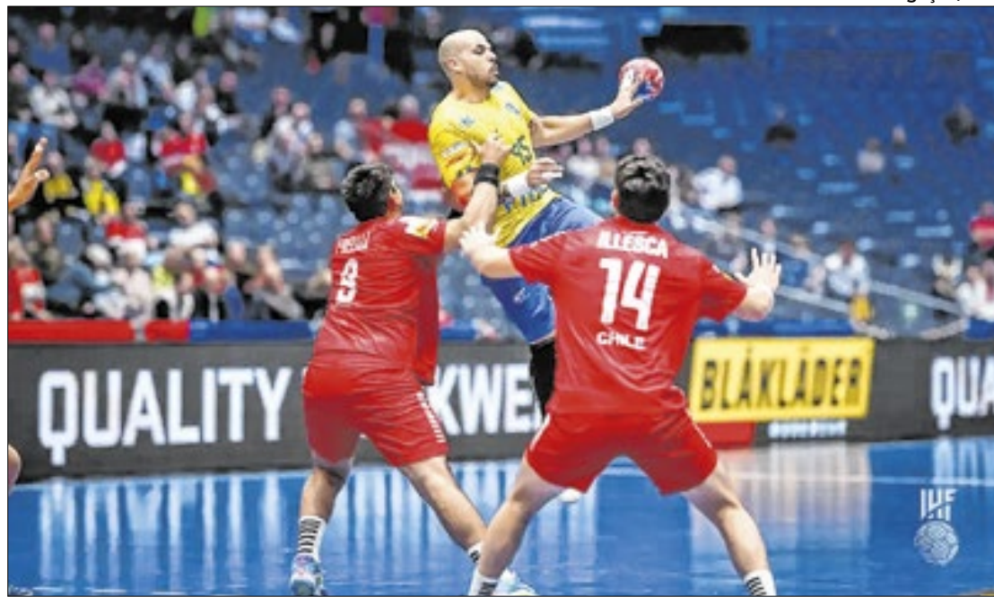
Equipe oscila ao longo do jogo, mas supera os rivais sul-americanos

Agora o Brasil terá de superar duas seleções favoritas ao título para carimbar a classificação às quartas de final. O próximo adversário na sexta (24), às 14h (horário de Brasília), será a Suécia, tetracampeã mundial e com três pratas olímpicas no currículo. Fechando a segunda fase, no mesmo horário, no domingo (26), o Brasil encara a Espanha,