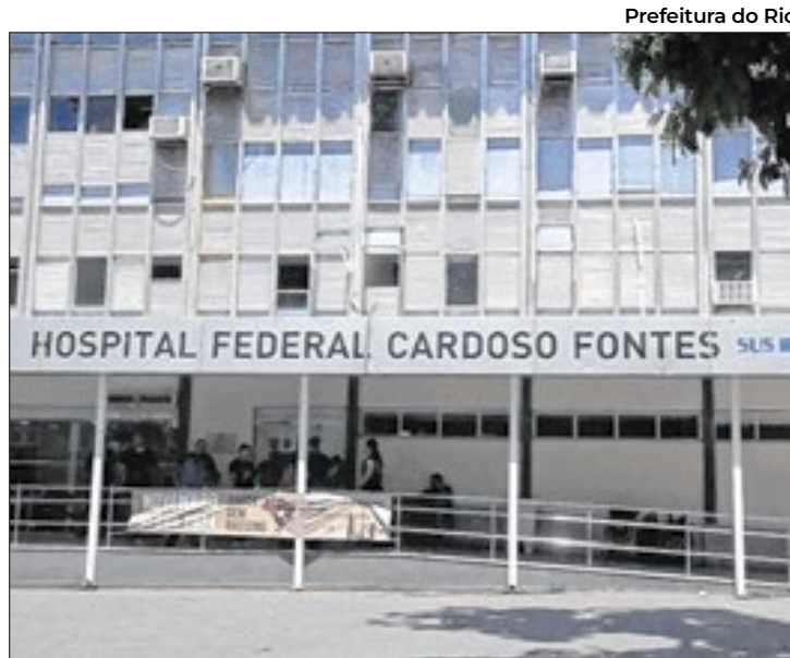
Prefeitura do Rio

“Começaremos as obras no dia 1º de fevereiro no Hospital Cardoso Fontes. Dentro do nosso planejamento, queremos reabrir a emergência no dia 1º de março, para que ela volte a funcionar plenamente, ainda que sem as condições ideais,