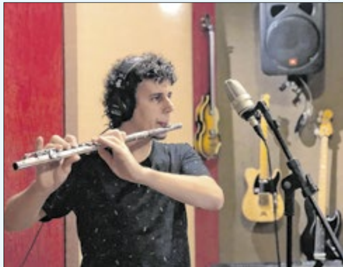
Projeto promove intervenções artísticas no município