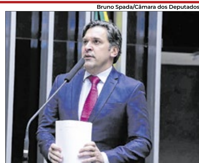
Bruno Spada/Câmara dos Deputados

Líder do MDB romperia o domínio do PT no Planalto