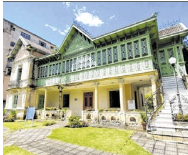
O recurso da PNAB foi sequestrado da conta da prefeitura

De acordo com levantamento da atual gestão da Cultura, o dinheiro da PNAB, cerca de R$ 1,2 milhão, foi sequestrado