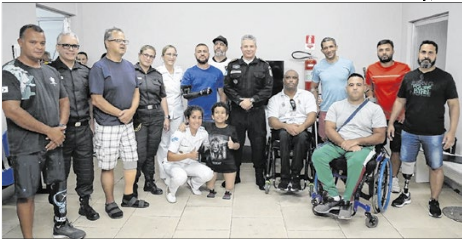
Prótese ultramoderna foi adquirida com verbas do Fundo de Saúde da Polícia Militar

como uma das maiores feiras do setor no mundo, a Fitur reúne 156 países, mais de 9,5 mil empresas e cerca de 250 mil participantes entre profissionais e visitantes. Nesta edição, o Brasil é o país homenageado, e Maricá ocupa lugar de destaque no estande nacional.