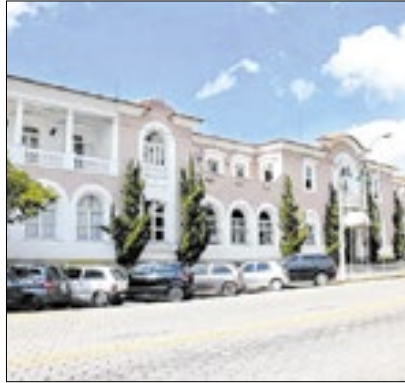
Recomendação é denunciar

A Prefeitura de Nova Friburgo alerta a população para mais uma tentativa de golpe. Algumas empresas têm recebido e-mails, informando sobre suposta "irregularidade detectada pela Prefeitura de Nova Friburgo". O órgão reforça que o e-mail fraudulento é finalizado no seguinte molde: "Atenciosamente, José Carlos, Gestor de Licenciamento e Fiscalização, Departamento de Licenciamento Urbano". O Executivo reforça que o departamento mencionado sequer existe.