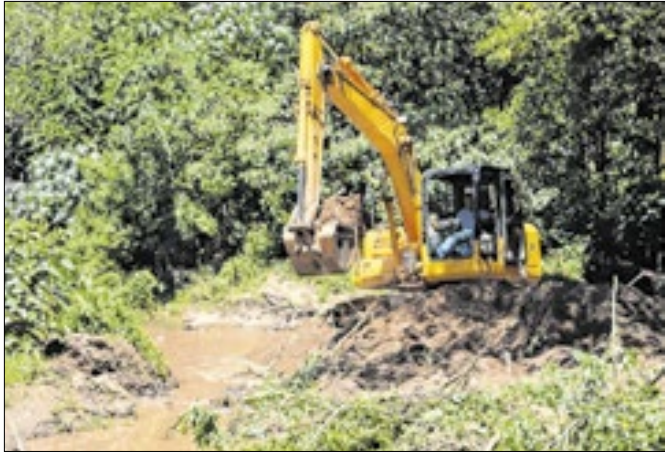
Rede de captação de água abastece a ETA Paraíso