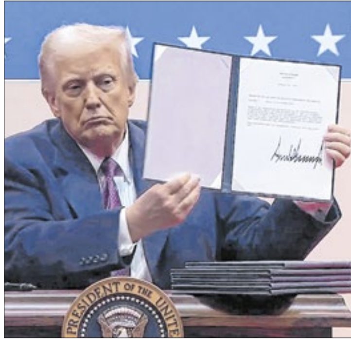
Trump assinou cerca de 100 decretos nestes primeiros dias

Segundo o governo, a medida também vale para quem entra nos EUA pedindo asilo, o que contraria a legislação americana. Assim, é quase certo que o decreto será questionado na Justiça, como já acontece com a ordem anun-