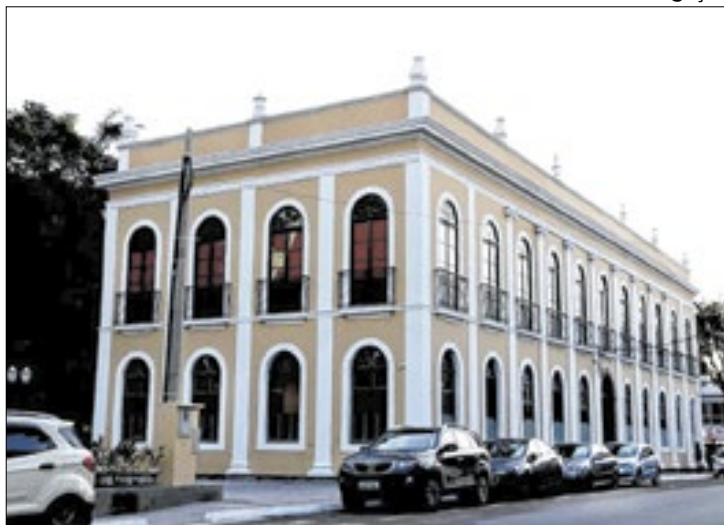
Câmara Municipal de Barra Mansa