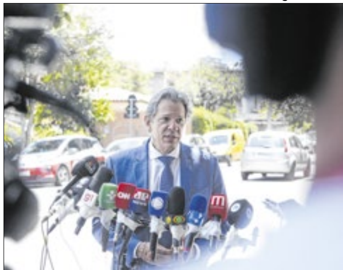
Dólar: a mais de R$ 6 desde anúncio do corte de gastos