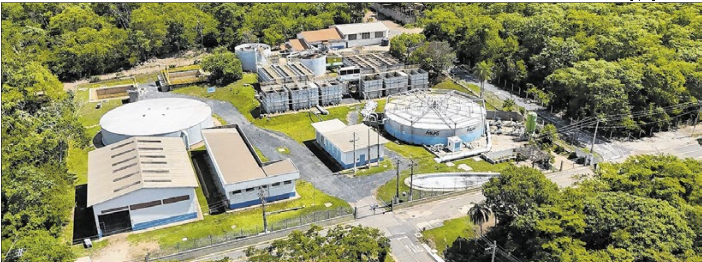
Iguá Saneamento foi uma das vencedoras do leilão da Cedae, no Rio de Janeiro, considerado um dos maiores de todo o país