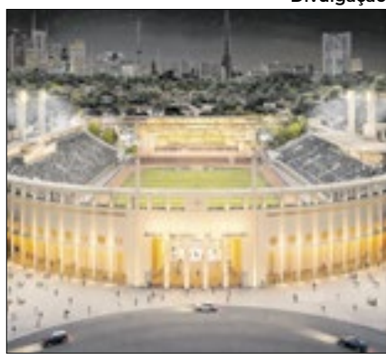
Pacaembu recebeu autorização temporária para sediar a final da Copinha deste ano

Com a vitória por 2 a 1 contra o Criciúma, o São Paulo não apenas garantiu a vaga para a decisão da Copa São Paulo de Futebol Júnior, como também a presença apenas de seu torcedor em caso de final