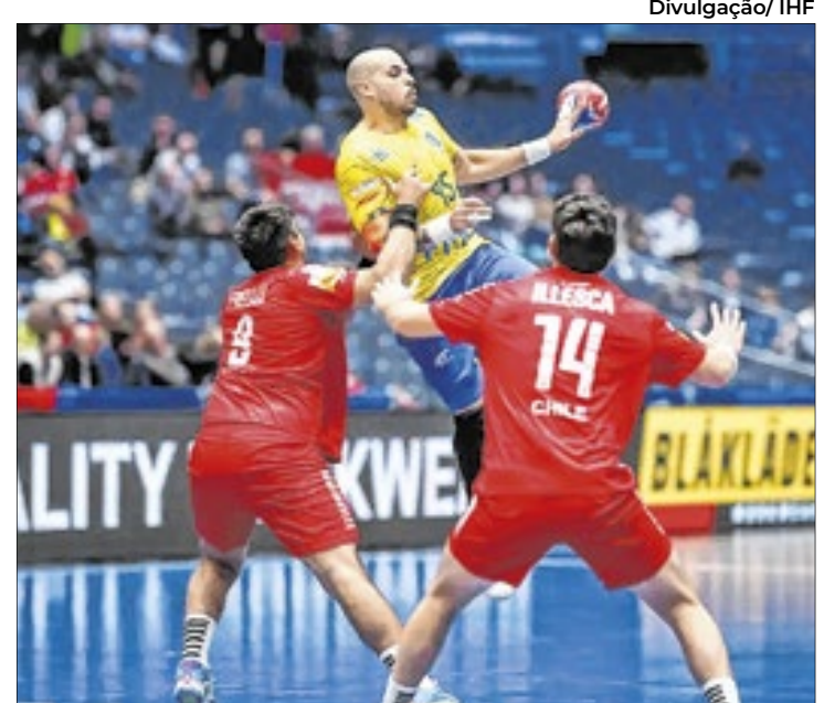
Equipe oscila ao longo do jogo, mas supera os rivais