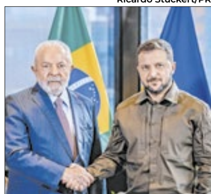
Lula e Volodymyr Zelenski

O presidente da Ucrânia, Volodymyr Zelenski, afirmou nesta quarta-feira (22) que o Brasil "perdeu o trem" para mediar acordos que acabem com a guerra de Kiev contra a Rússia e