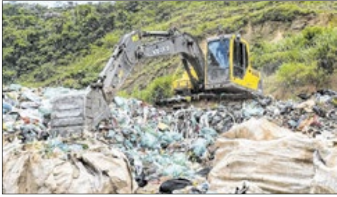
O local está sendo reformulado com recursos do Estado