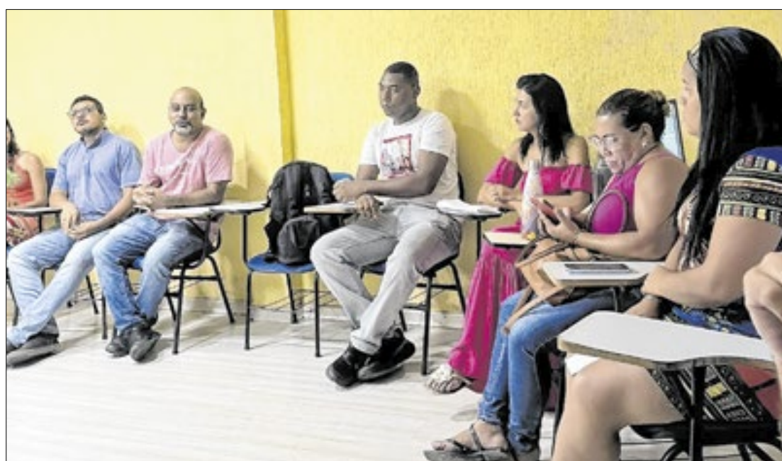
Japeri promoveu uma roda de conversa com o tema “Respeito à diversidade religiosa

“Assumimos o desafio de liderar a secretaria e decidimos promover esta roda de conversa por