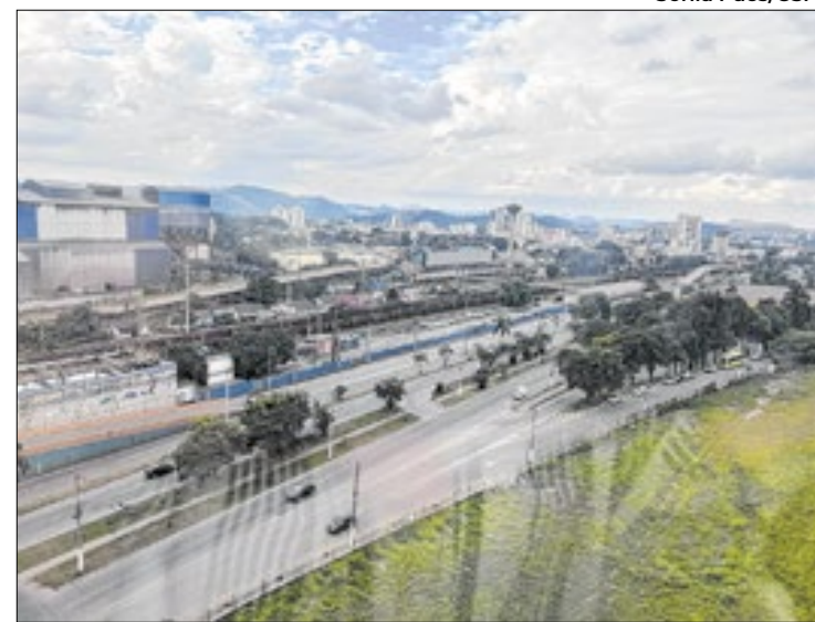
CSN abre vagas para cargos de soldador e de mecânico