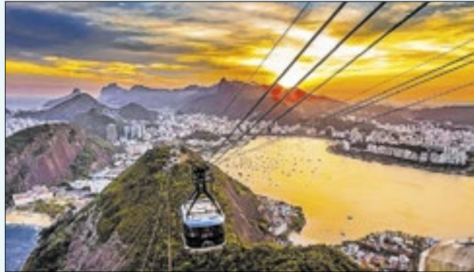
Calarão carioca só deve dar trégua no final da semana