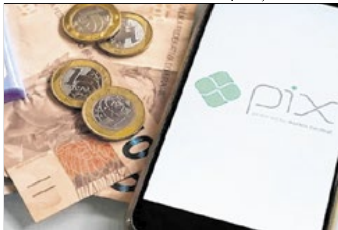
Investigações contra crimes com Pix ganham reforço