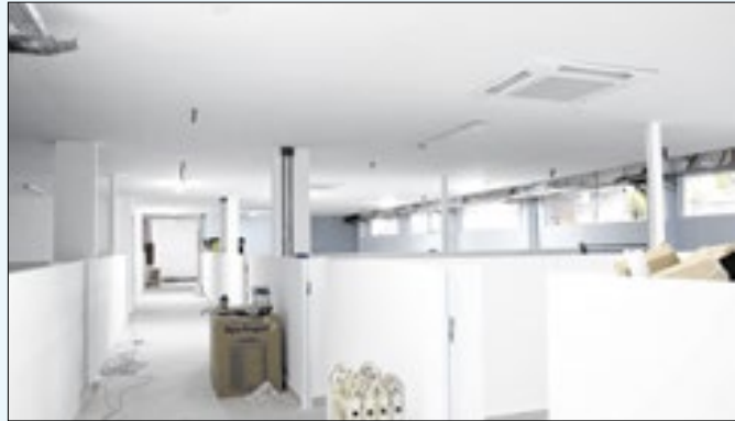
Obras em duas etapas garantem atendimento normal