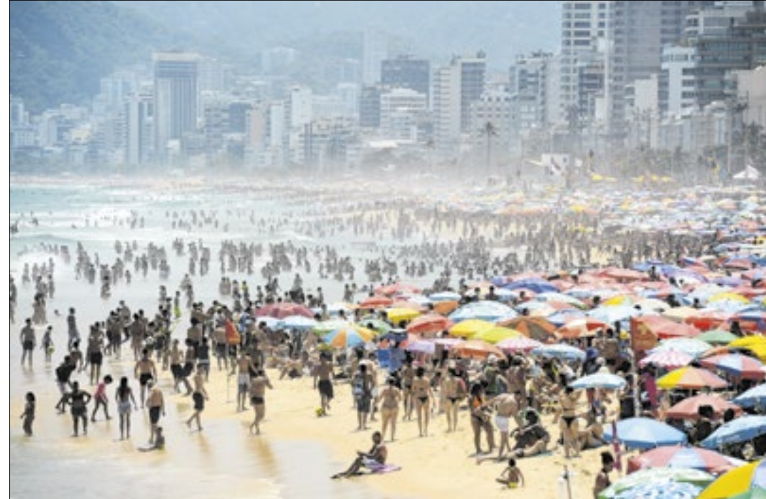
Praias viram refúgio mais procurado pela população em dias de altíssimas temperaturas

Segundo o Centro de Operações Rio, o painel de medi-