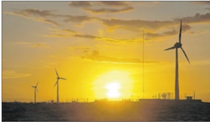
Usinas para geração de energia eólica gera 13.571 empregos