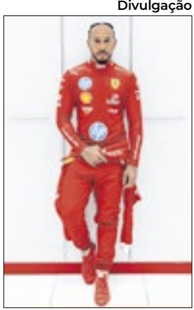
Hamilton vestiu uniforme da Ferrari

Os fãs de Lewis Hamilton estão vivendo dias de sonho nesta semana. Após a foto na icônica sede da Ferrari com a lendária F40, nesta terça-feira (21), o piloto britânico revelou sua primeira foto vestindo o macacão oficial da temporada. Com a legenda 'FIRST TIME IN RED', algo como 'Vestindo vermelho pela primeira vez', Hamilton levou os fãs à loucura e viralizou nas redes sociais do mundo inteiro.