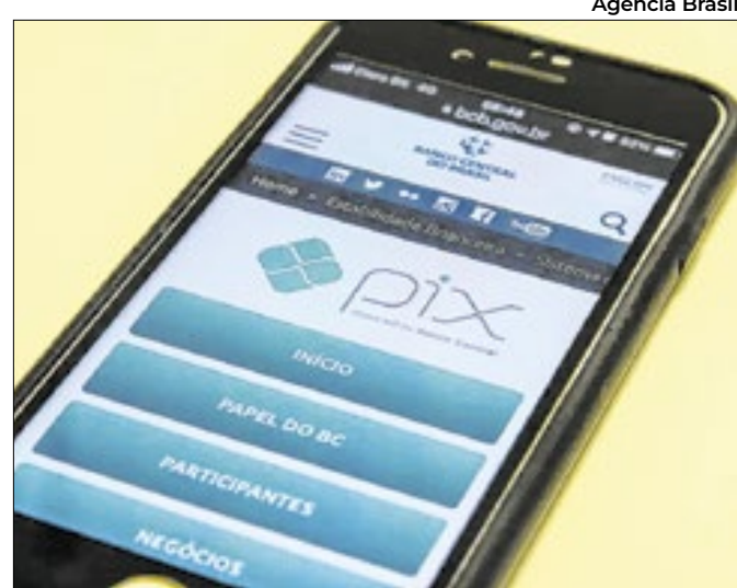
Falhas de segurança permitem expansão de golpes