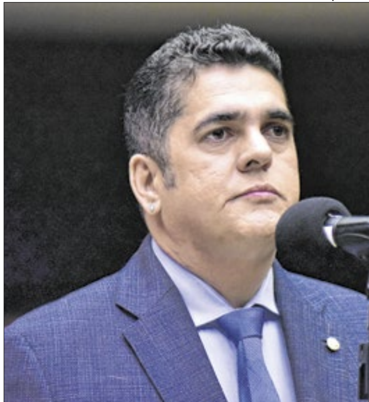
Antônio Doido demitiu assessor que foi preso

A investigação da Polícia Federal que resultou na prisão de um assessor parlamentar com R$ 1,1 milhão no Pará apura o suposto pagamento de propinas em licitações no estado tendo como alvo uma empresa que firmou contratos com prefeituras que haviam recebido recursos federais.