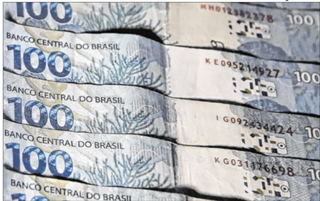
Camargo: governo terá de optar pela inflação ou deterioração do mercado de trabalho

deral recairá fatalmente pela inflação mais alta, colocando o IPCA acima de 7% em 2026, a reboque da valorização do dólar, cuja cotação poderá chegar, inclusive, a R$ 7,20, assim como pelo previsível aumento dos gastos públicos, em ano de eleição.