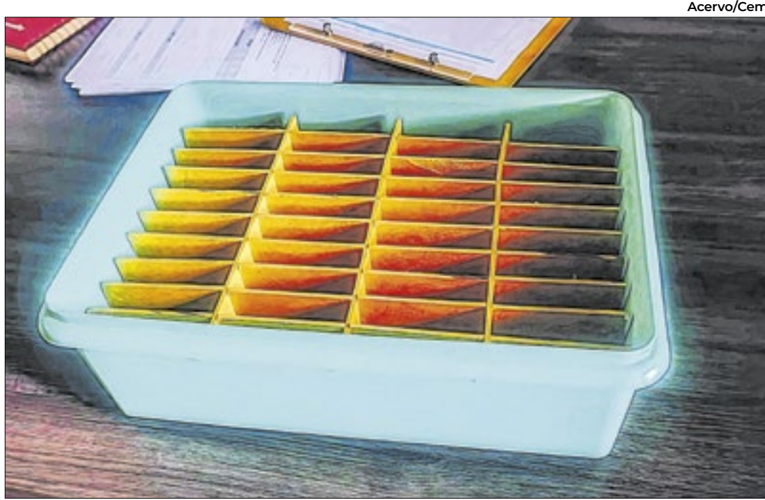
Escolas controlam uso de celulares à espera de diretrizes do MEC; Cemi utiliza caixas