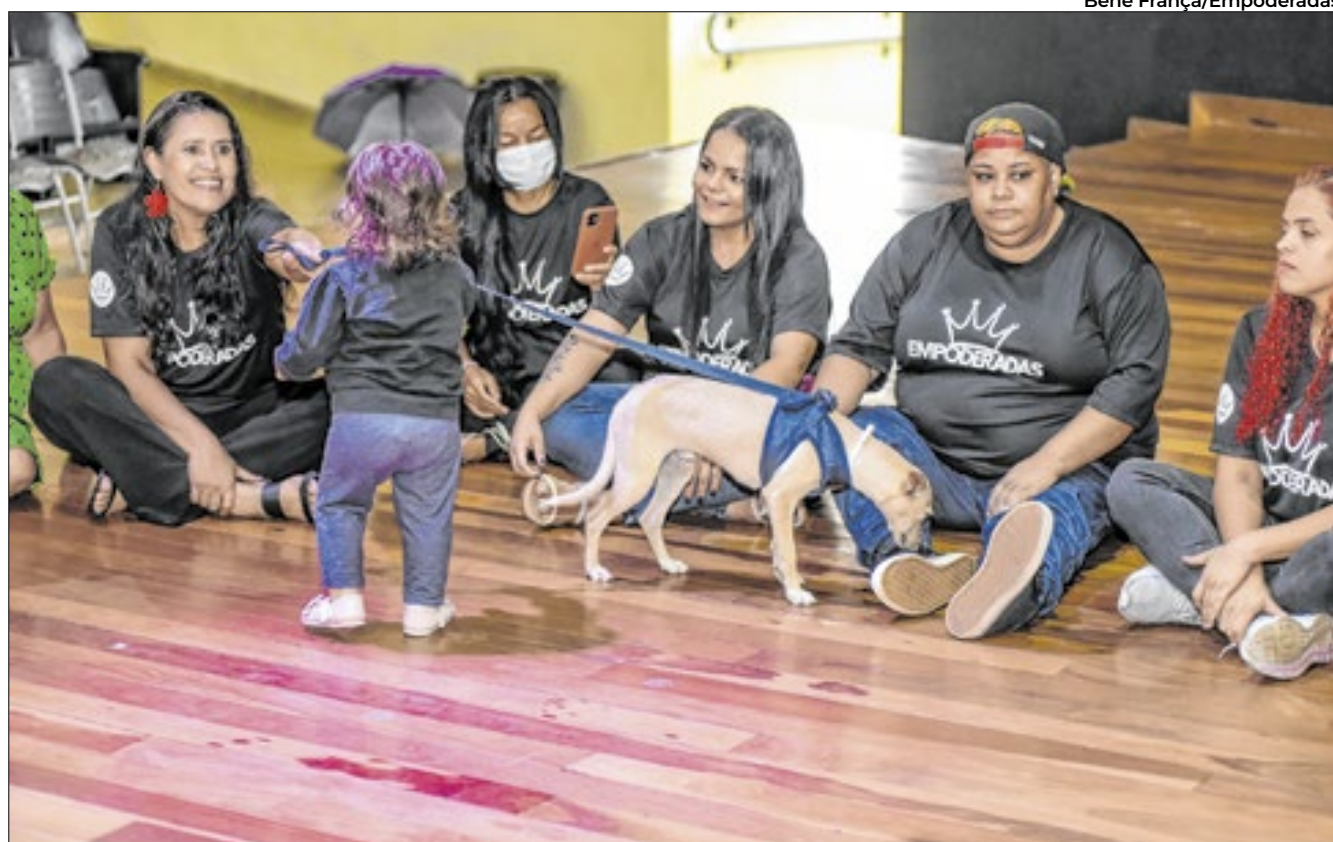
Aulas irão até o dia 7 de fevereiro e têm estrutura para mães com crianças também participarem