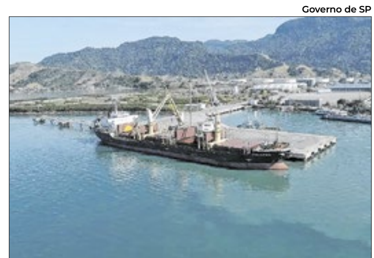
Porto transportou mais de 1 milhão de cargas em 2024

"É gratificante comemorar essa data com mais um marco histórico. Ao longo desses 70 anos, o Porto de São Sebastião vem desempenhando um papel essencial no desenvolvimento econômico e socioambiental da região. Esperamos continuar com esse legado",