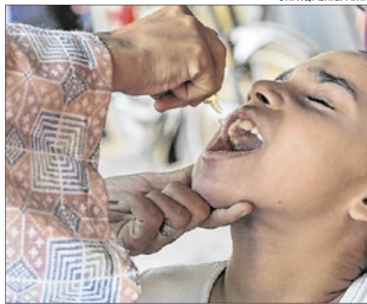
Entre 2022 e 2023, EUA repassou US$ 1,2 bi a OMS

A organização de saúde é financiada por países ligados à ONU (Organização das Nações Unidas). Os membros fazem contribuições obrigatórias, mas os doadores se tornaram a principal fonte de renda, com poder para sugerir o destino