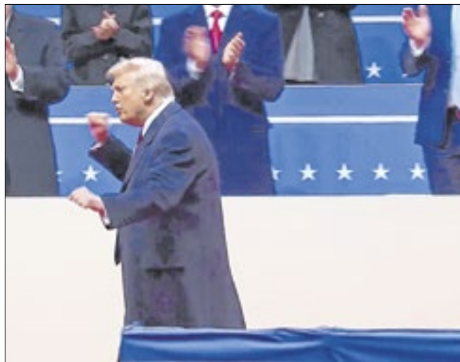
Trump: decretos são chave da reação supremacista