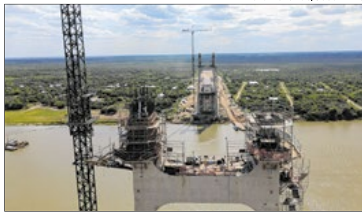
Debate internacional sobre os desafios e soluções da Rota