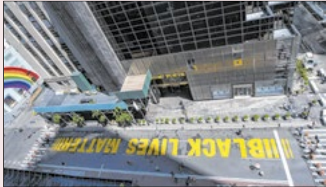
Sociedade americana se torna multirracial