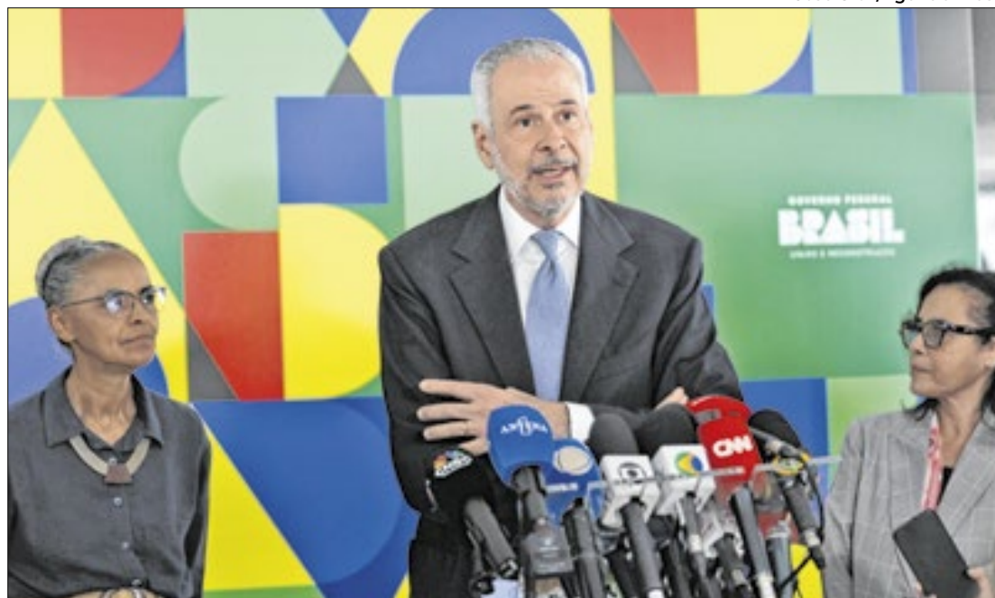
Lago não descarta negociar com empresas e estados dos EUA

“Pela decisão do presidente Lula em realizar a COP na Amazônia, em Belém, é essen-