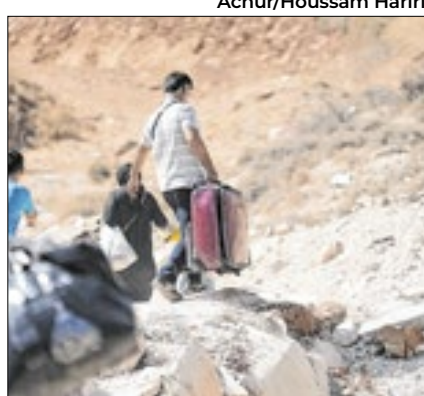
51 mil sírios retornaram da Turquia

Autoridades da Turquia informaram à ONU que cerca de 25 mil sírios retornaram à casa desde a queda do regime do ex-presidente da Síria, Bashar al-Assad, em 8