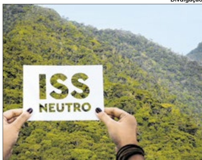
Empresas têm até dia 31 de janeiro para se inscreverem