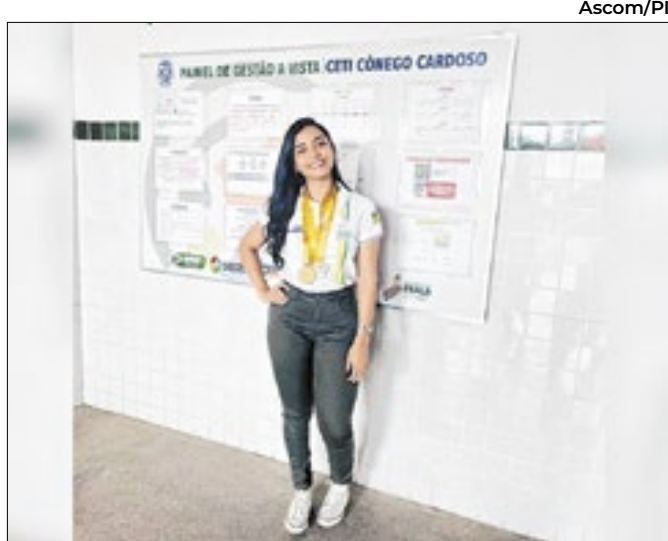
Os candidatos realizarão campanha eleitoral