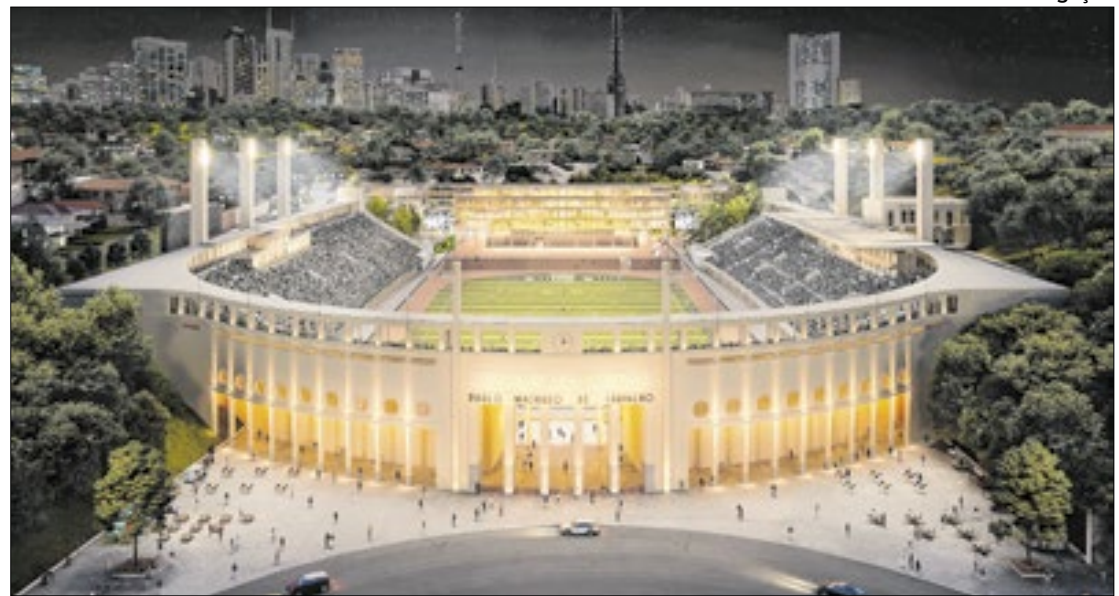
Pacaembu recebeu autorização temporária para sediar a final da Copinha deste ano

Se reconhecesse que o jogo envolve torcidas organizadas, que o público é formado majoritariamente por jovens adultos e que parte dos torcedores fica de pé, a partida seria classifica-