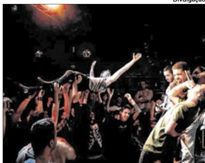
Produção mostra trajetória e atores do gênero no estado

Gestores discutem impacto da legislação e medidas para adaptação