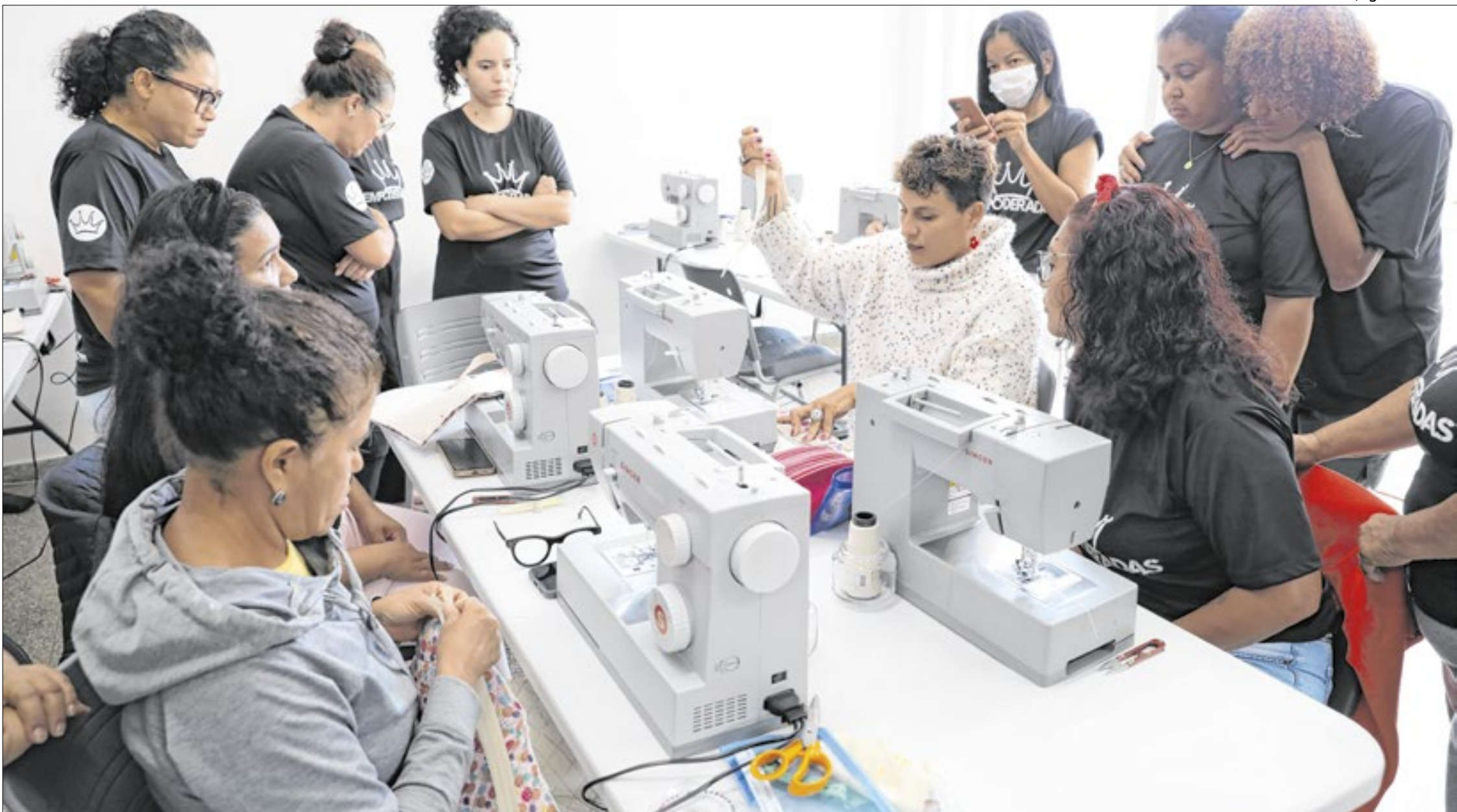
Projeto garante às mulheres vulneráveis o aprendizado que dá início a uma nova profissão