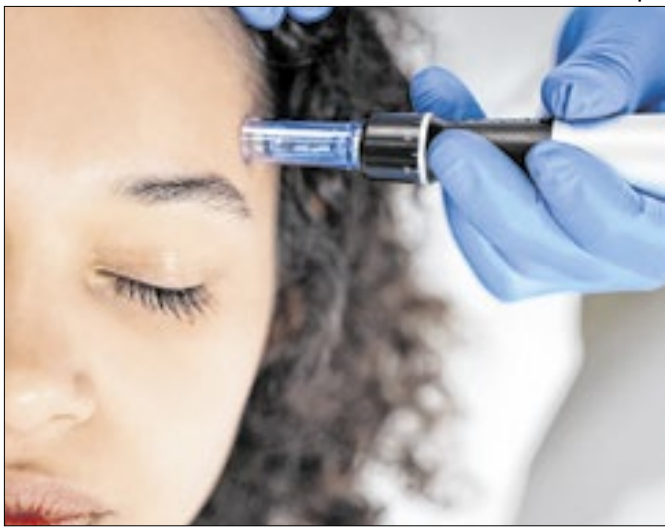
Pedido foi feito à Anvisa na terça-feira