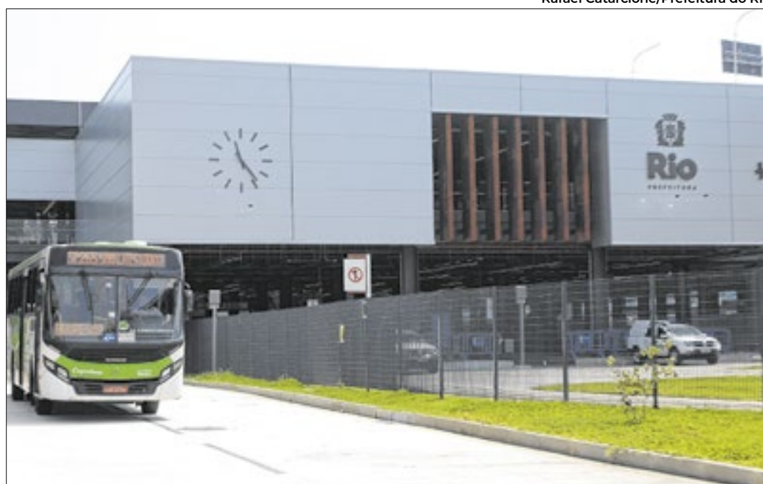
Terminal Gentileza é um dos dez pontos onde a Prefeitura incentiva a participação na enquete

Cariocas poderão contribuir com a formulação do planejamento