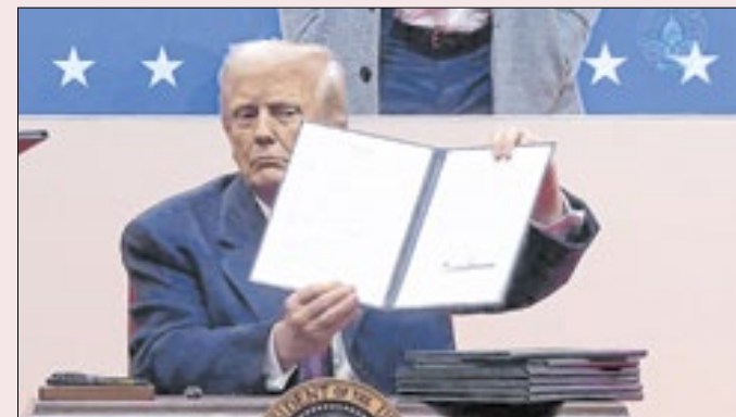
Donald Trump quer proteger empresas americanas