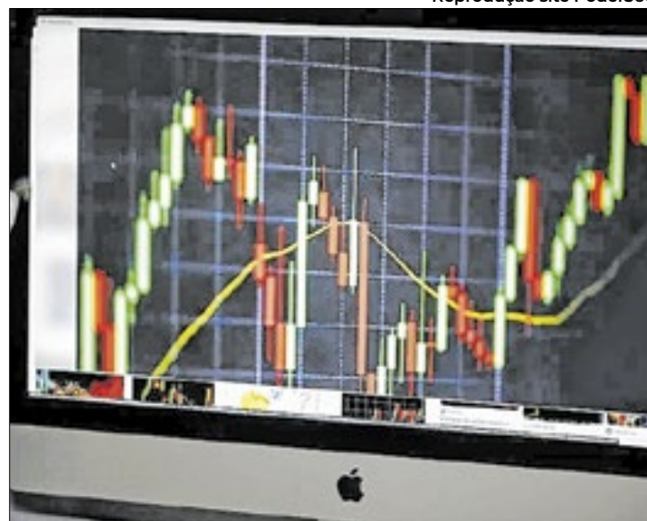
Bolsa brasileira consegue ‘engatar’ terceira alta consecutiva

No dia seguinte aos primeiros decretos do presidente Donald Trump nos Estados Unidos, a sessão foi de avanço para os índices de ações em Nova York e de recuo nos rendimentos dos Treasuries após os mercados americanos terem ficado fechados nesta segunda (20), em observação ao feriado por Luther King. Aqui, o Ibovespa flutuou entre mínima de 122.289,95 e máxima de 123.461,68 na sessão, em que saiu de abertura aos 122.850,41 pontos. Ao fim, com ímpeto que o levou a 0,5% no melhor momento da tarde, o índice mostrava alta um pouco mais suave, de 0,39%, aos 123.338,34 pontos, com giro ainda fraco, a R$ 16,6 bilhões. Foi o terceiro ganho consecutivo para o Ibovespa, que avança 0,81% na semana e 2,54% no mês.