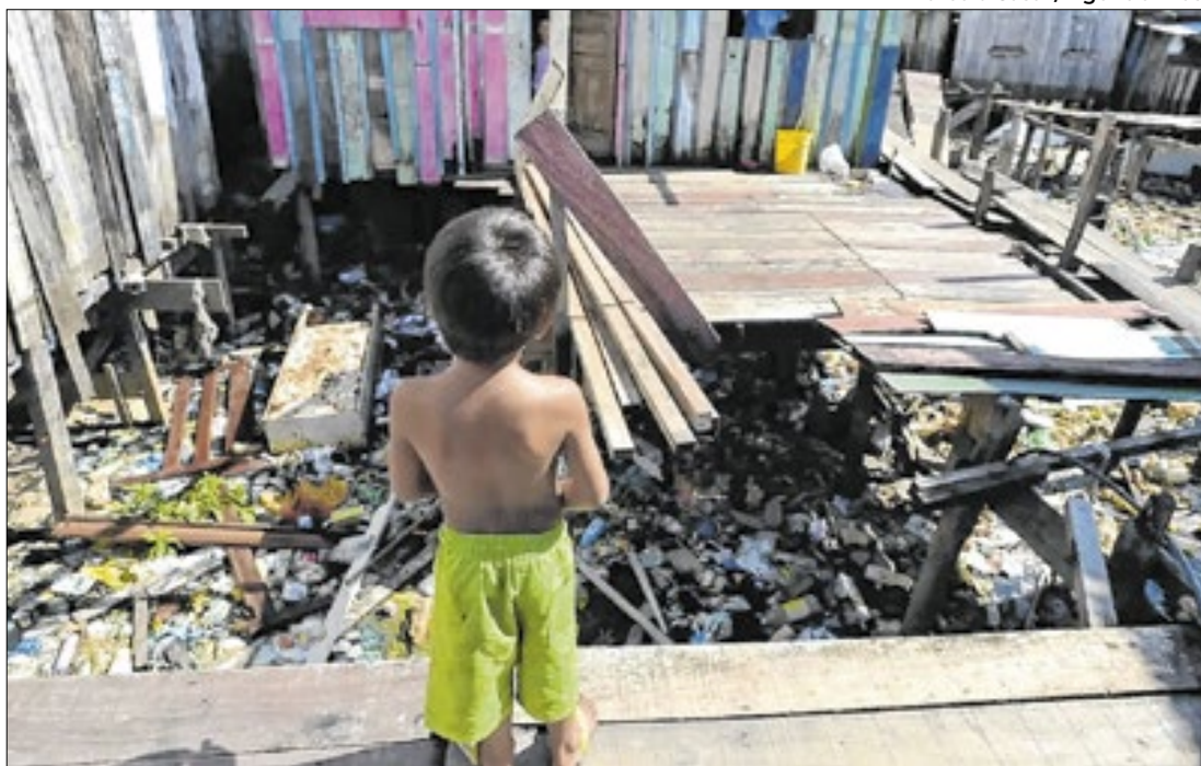
Programas sociais com o Minha Renda fizeram a diferença na economia familiar

Melhora da renda das famílias produziu queda em todo o Brasil