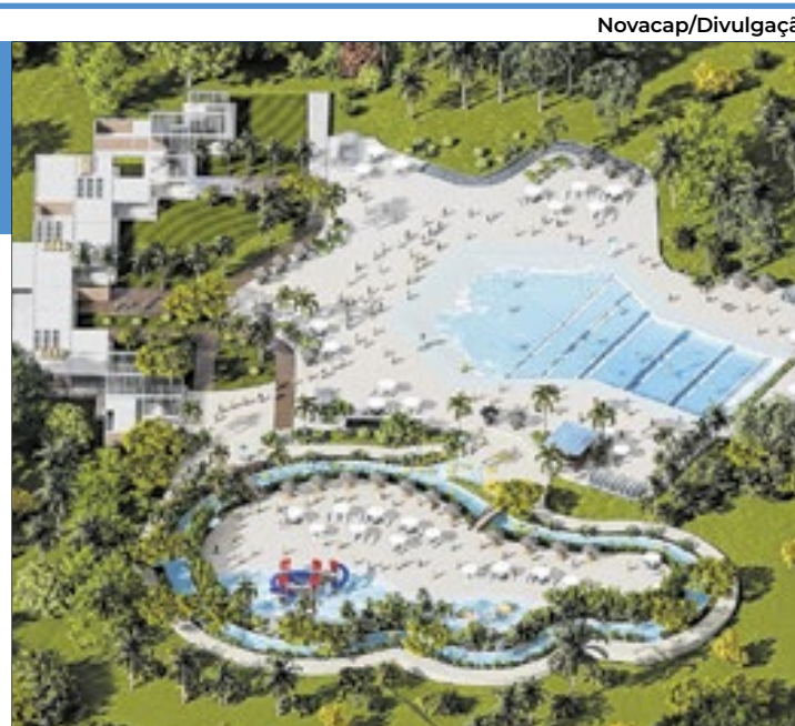
Croquis do novo parque aquático, que está sendo planejado para o Parque da Cidade