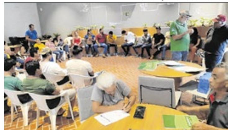
Pequenos e médios agricultores e indígenas beneficiados