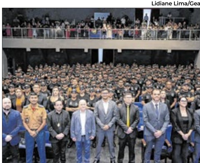
A aula aconteceu no Teatro Sívio Romero, em Santana