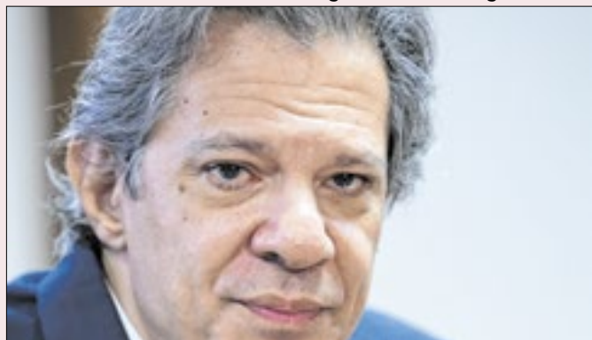
Crise do Pix desgastou Fernando Haddad