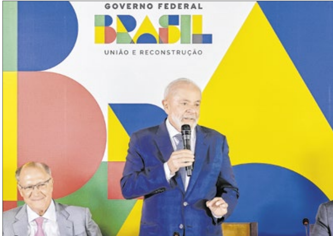
Lula aos ministros: "Não temos o direito de falhar"

Apesar de não ter que citado nomes, o recado foi claramente direcionado ao ministro da Fazenda, Fernando Haddad, já que a polêmica da portaria do Pix foi no seu ministério, mais especificamente na Receita Federal. Na última