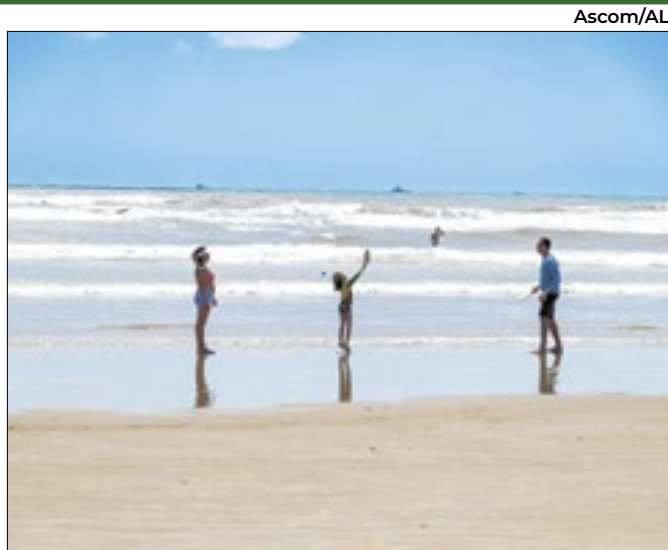
Saúde da dicas para proteger crianças do calor intenso