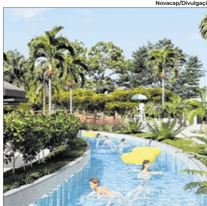
Além da piscina com ondas, um rio lento também está sendo previsto no novo complexo