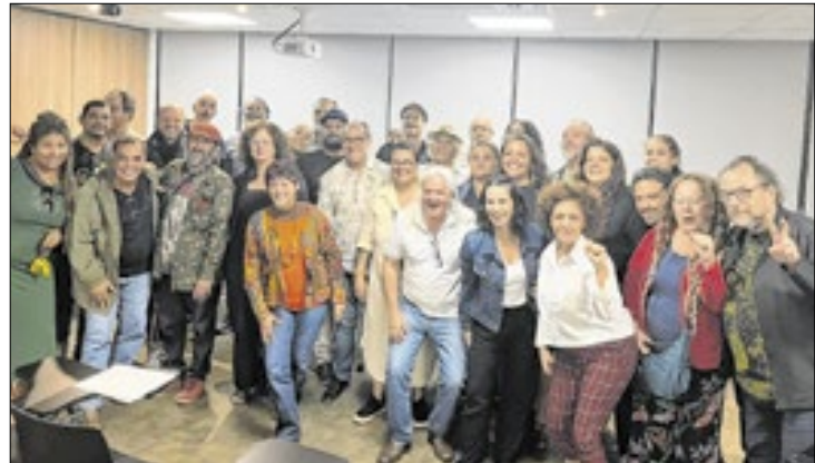
Ato questiona gestão distrital por cortes no setor cultural