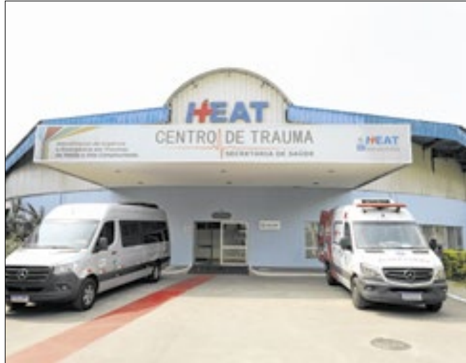
Hospital Estadual Alberto Torres é referência no Rio