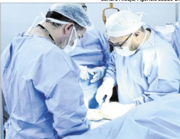
Com o novo turno, 15 pacientes já foram atendidos à noite