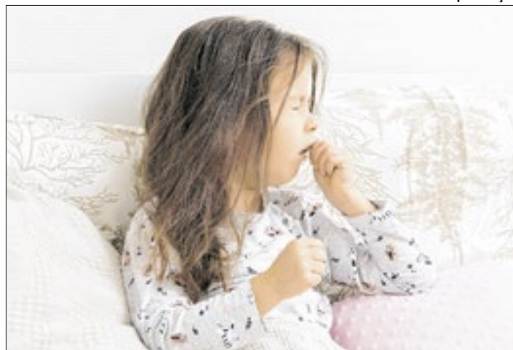
Biomédico explica quais são os principais sintomas

Segundo dados do Ministério da Saúde a Coqueluche, doença que não aparecia desde 2021, registrou aumento superior a 1.000% em 2024. A queda na cobertura vacinal é apontada como a principal causa do crescimento da doença, que é altamente contagiosa e pode levar a complicações graves, especialmente em crianças menores de um ano.