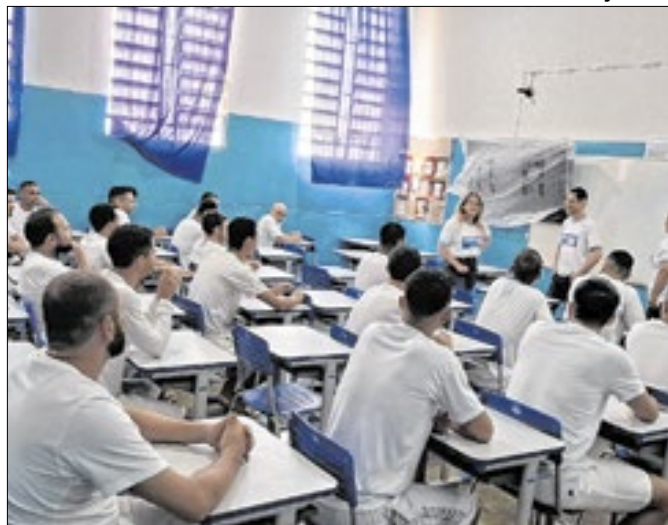
Participantes tiveram notas acima de 920 na redação

600 famílias receberam apoio para produção de alimentos frescos