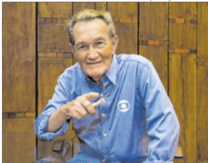
Jornalista faleceu no último domingo