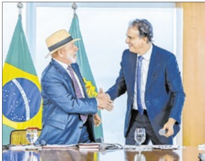
Camilo: opção discreta a Lula em 2026?