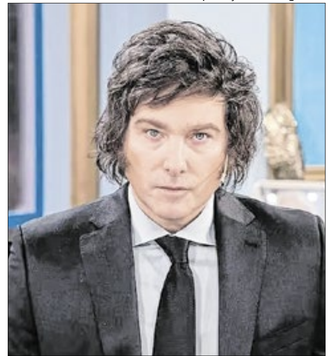
Milei volta a fazer ataques a Lula