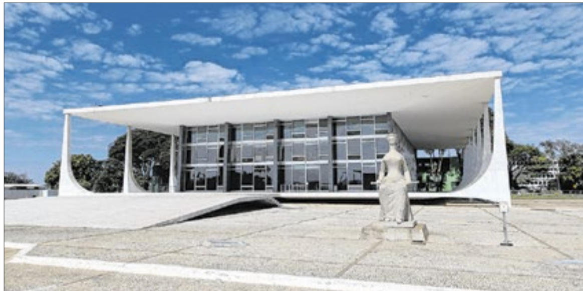
Governo e Eletrobras informaram que negociações estão em fase conclusiva

É neste ponto que os argumentos dos quatro escritórios colocam em dúvida o sistema judiciário brasileiro. Escrevem na petição: "A Corte estaria essencialmente pré-julgando a questão sobre se a Convenção de Arbitragem do SPA se tornou inexecutável para esta arbitragem e se deve ser modificada, um ponto central em disputa que cabe ao próprio Tribunal decidir. Os resultados seriam desastrosos para a CA. Isso permitiria que a J&F novamente se valesse de uma variedade de táticas de má-fé no Brasil para minar a arbitragem e