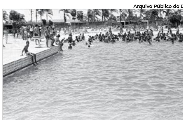
Imagem clássica da década de 1980: frequentadores esperando soar a sirene que antecedia a onda mecânica