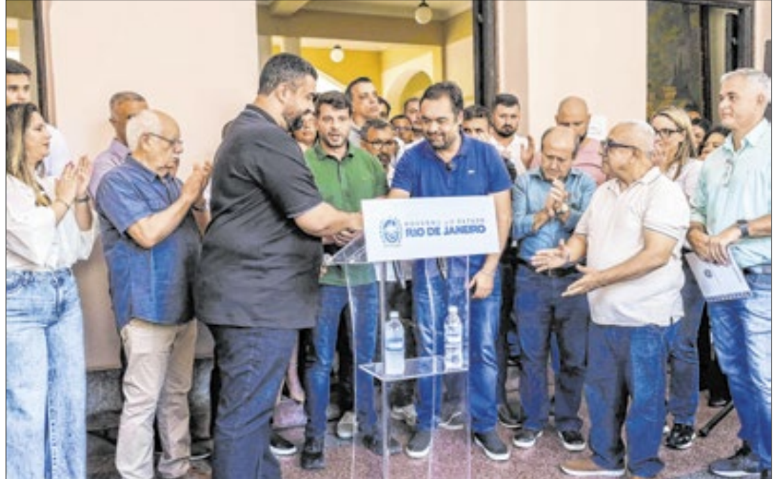
Os recursos do aterro serão utilizados pela prefeitura na elaboração de projeto e obras

Em visita à Teresópolis, no sábado (18), além de oficializar o repasse de R$ 5 milhões para remediação do aterro do Fischer, o Governador Cláudio Castro anunciou a liberação de R$ 18 milhões para investimentos para saúde do município, além do asfaltamento de 10 ruas da cidade e de uma estrada, no interior.