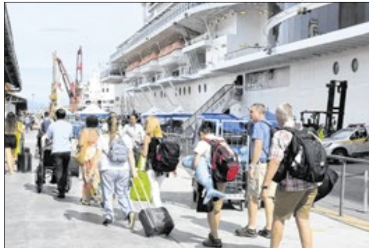
Porto do Rio deve receber até nove navios este mês

Os quatro navios com atracções simultâneas no dia 21 são o MSC Poesia, MSC Magnífica, MV Pacific World e Bolette, que chega no dia 20. Os dados do Pier Mauá indicam que neste dia serão mais de 8.500 turistas.