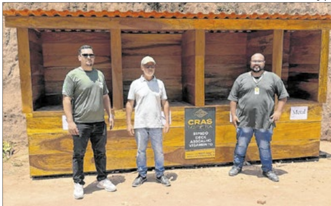
A iniciativa é conduzida de forma totalmente independente e sem fins lucrativos