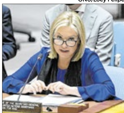
Jeanine Hennis-Plasschaert na ONU

A coordenadora especial das Nações Unidas no Líbano chegou a Israel para discutir o progresso no acordo de cessar-fogo entre os dois países, que entrou em vigor em 27 de novembro.