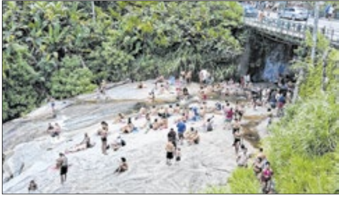
O município recebeu um grande número de visitantes