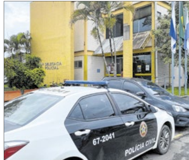
Caso está sendo investigado pela 62ª DP, em Duque de Caxias

Por Bruno de Freitas Moura (Agência Brasil)