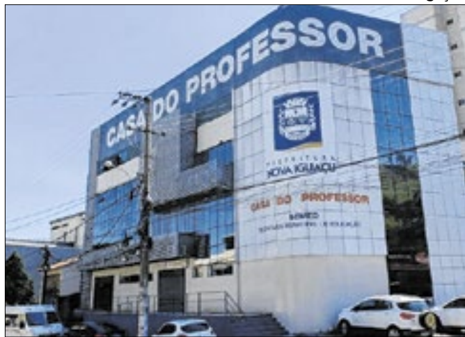
Município é reconhecido por ações de ensino