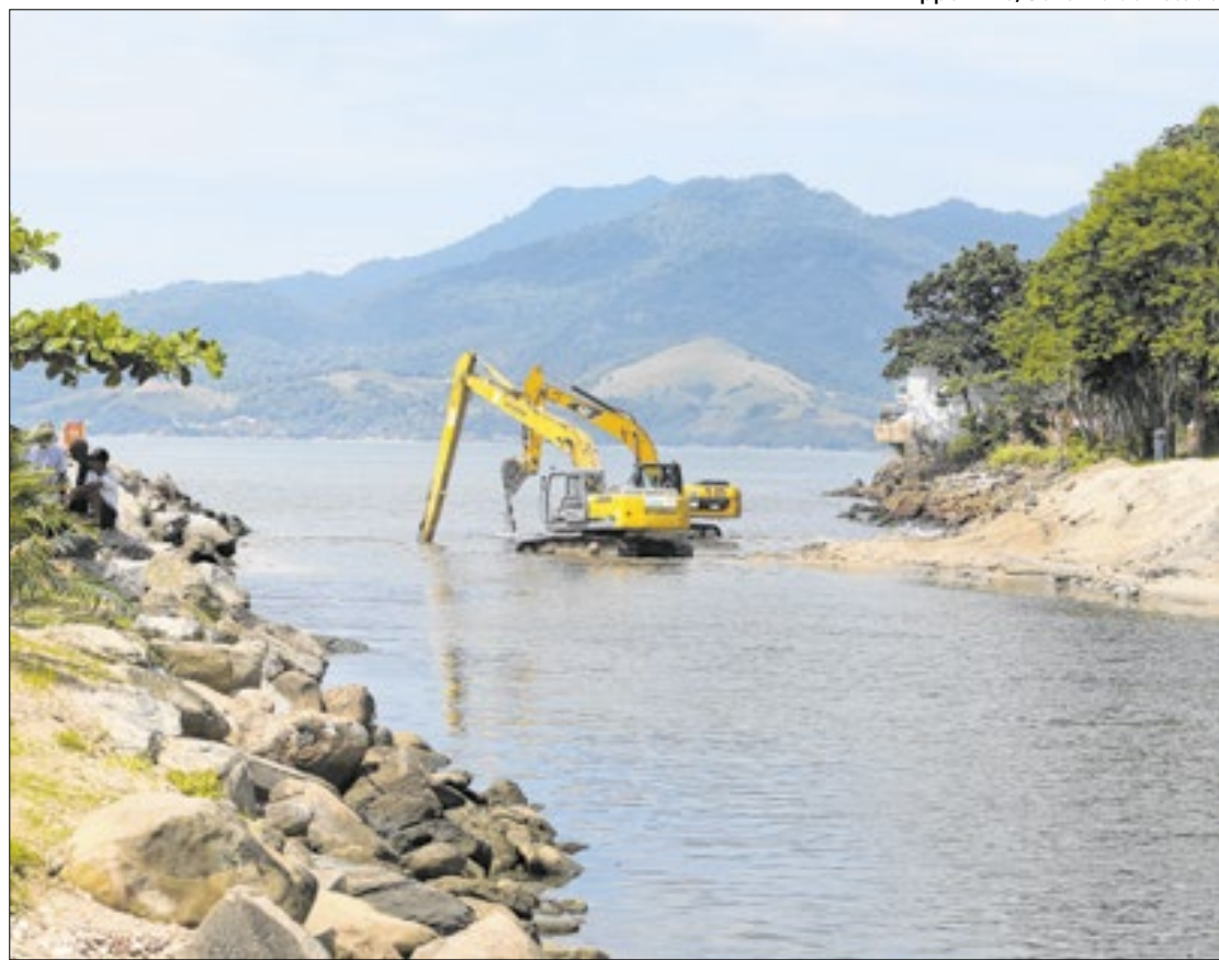
Obra do ‘Limpa Rio’ são feitas pelo Inea no Canal do Leitão, na Praia do Saco

Inicialmente, a agenda do governador previa visitação em Paraty, cidade reconhecida