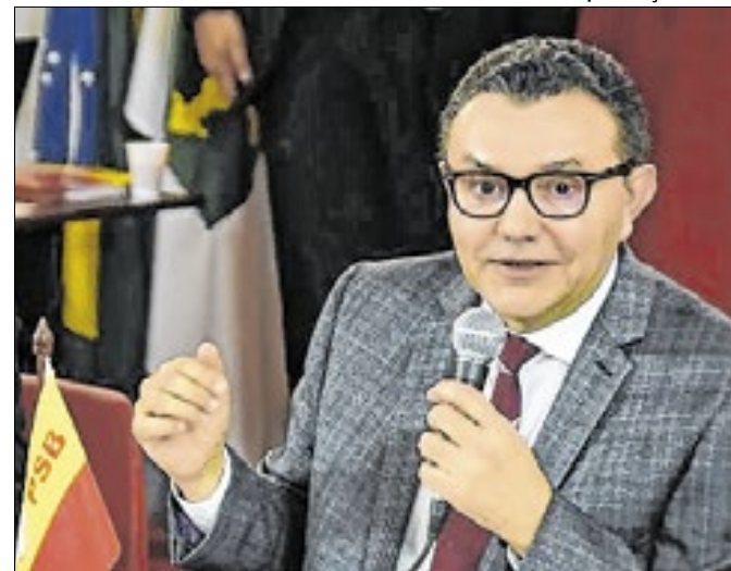
Siqueira diz ser preciso gerar expectativa positiva