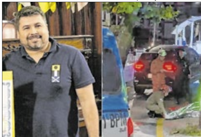
Policial executou assessor por discussão em garagem