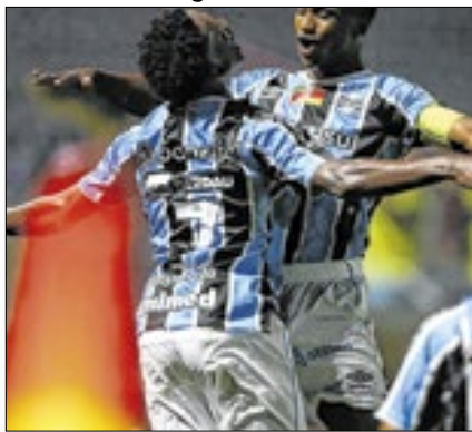
Grêmio busca título inédito

Grêmio e Corinthians avançaram às quartas de final da Copa São Paulo de Futebol Júnior na noite de domingo (19) e se juntaram aos já classificados São Paulo e Criciúma. O Tricolor gaúcho, que tenta o título inédito da Copinha, garantiu a vaga após vencer de virada o Palmeiras por 3 a 2. Já o Timão, atual campeão, levou a melhor sobre o Vasco por 1 a 0. O primeiro jogo da semi será Criciúma x São Paulo, às 19h30 (horário de Brasília) de terça-feira (21). O outro, Grêmio x Corinthians, será às 17h de quarta (22). A 55ª edição da Copinha reuniu 128 clubes na primeira fase (grupos). A decisão do título está programada para o dia 25 de janeiro, feriado da capital paulista. A final ocorrerá no Pacaembu.