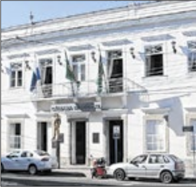
Município possui muitas dívidas