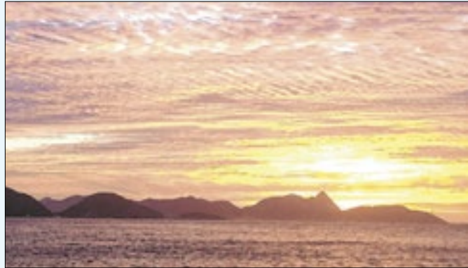
Temperaturas não devem 'dar trégua' aos cariocas