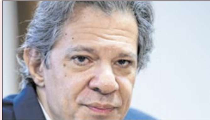
Crise do Pix desgastou Fernando Haddad