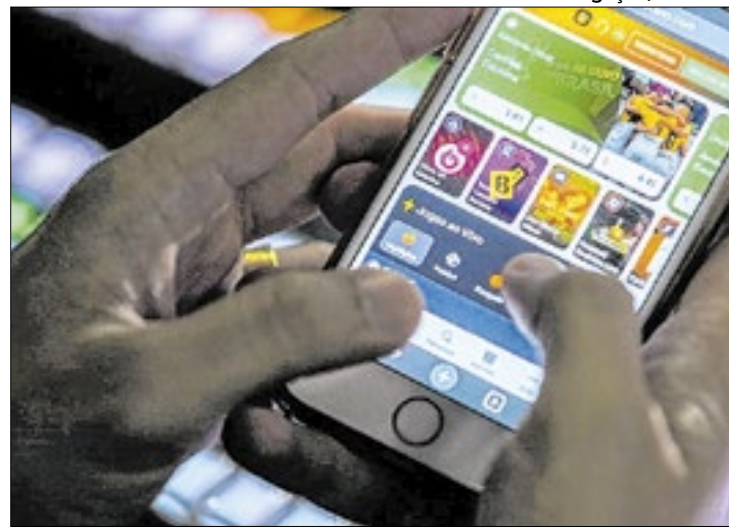
Lei nº 13.756/18 já previa o repasse dessas verbas até o prazo

“A Lei nº 14.790/23 reafirmou a obrigação do repasse. E o que a portaria veio estabelecer