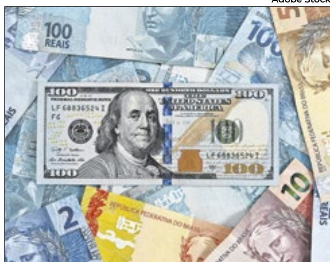
Dólar dá 'trégua', enquanto 'tarifaço' dos EUA não vem