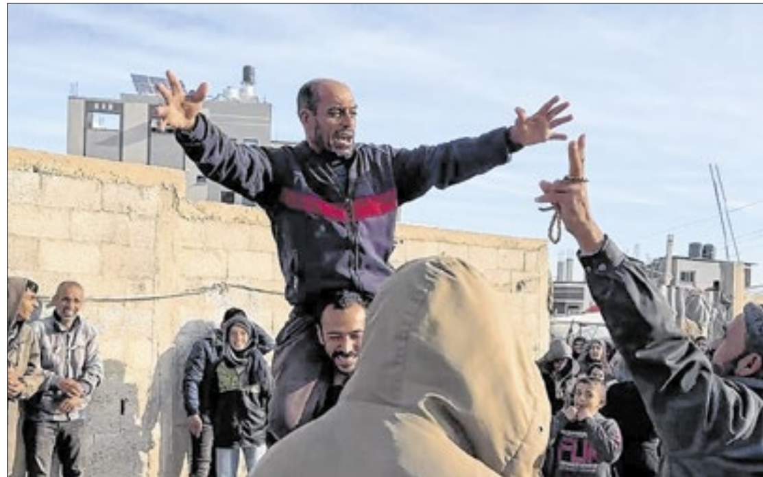
Muitos encontraram a Faixa de Gaza devastada e destruída pela guerra antes do cessar-fogo

A primeira trégua no conflito entre Israel e o Hamas começou neste domingo (19), três horas depois do previsto. O governo de Benjamin Netanyahu afirmou que só começaria o cessar-fogo após o grupo extremista entregasse uma lista com os nomes dos reféns que seriam libertados. Durante esse período, Israel fez um novo bombardeio, que deixou ao menos 17 mortos.