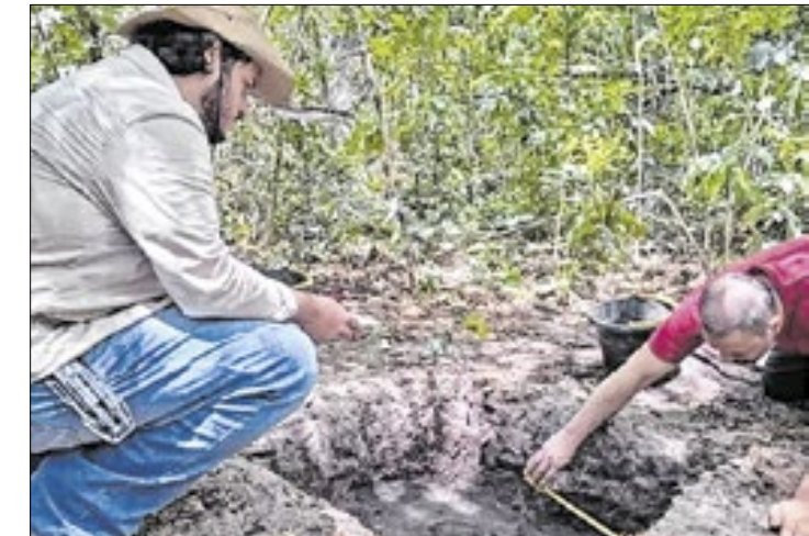
Vestígios de existência humana de até oito mil anos

O local explorado pode abrigar um enorme sítio arqueológico, tendo a Lagoa de Itaipu como centro da vida social. Essa é uma das hipóteses levantada pelos pesquisadores.