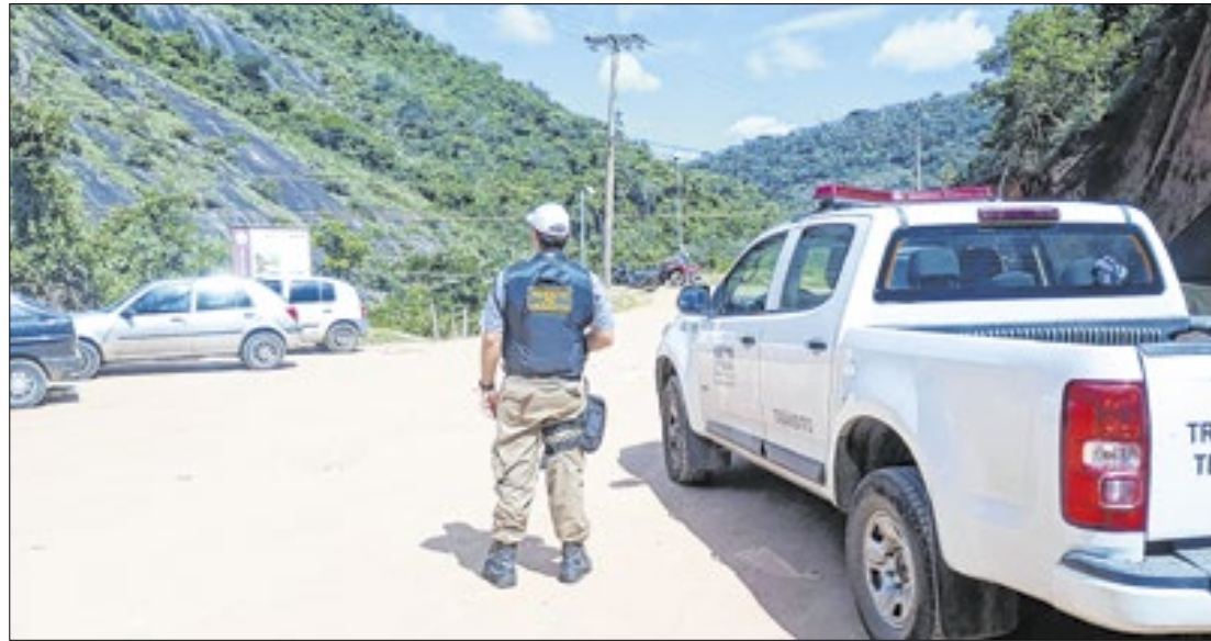
Objetivo é dar mais segurança e garantir o livre acesso de frequentadores e moradores

"O que a gente quer é que todos os moradores e visitantes tenham uma ótima experiência. A gente sabe que, com esse calor, que fez nesse fim de semana e que deve seguir até o fim do verão, a procura é grande por um local para se refrescar. E Petrópolis tem cachoeiras lindíssimas, que atraem inclusive turistas, não só de outras cidades de estados do Brasil, mas também de outros países. Mas é importante que haja ordenamento destes espaços, para que os visitantes