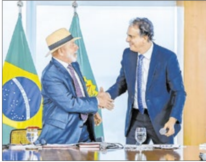
Camilo: opção discreta a Lula em 2026?