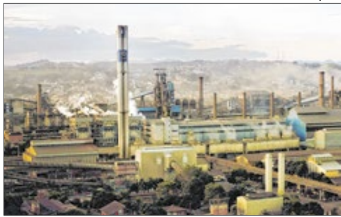
CSN informa ao mercado parada de Alto-Forno 2