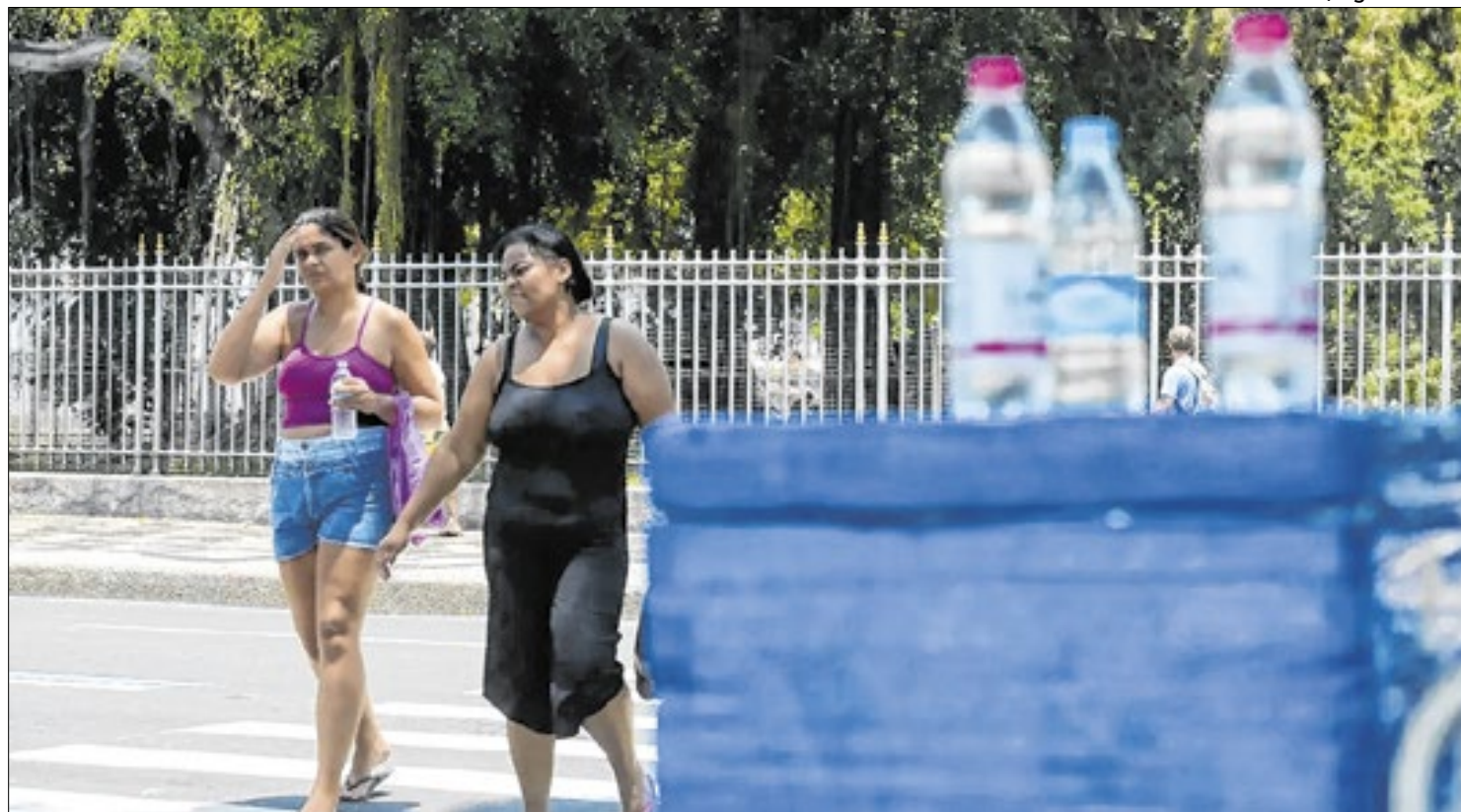
Tomaz Silva/ Agência Brasil

Desde a sexta-feira (17) a cidade se encontra no nível 3 de calor (NC3), em uma escala que vai até 5. O NC3 é caracterizado quando há registro de índices de calor alto (36°C a 40°C) com previsão de permanência ou aumento por, ao me-