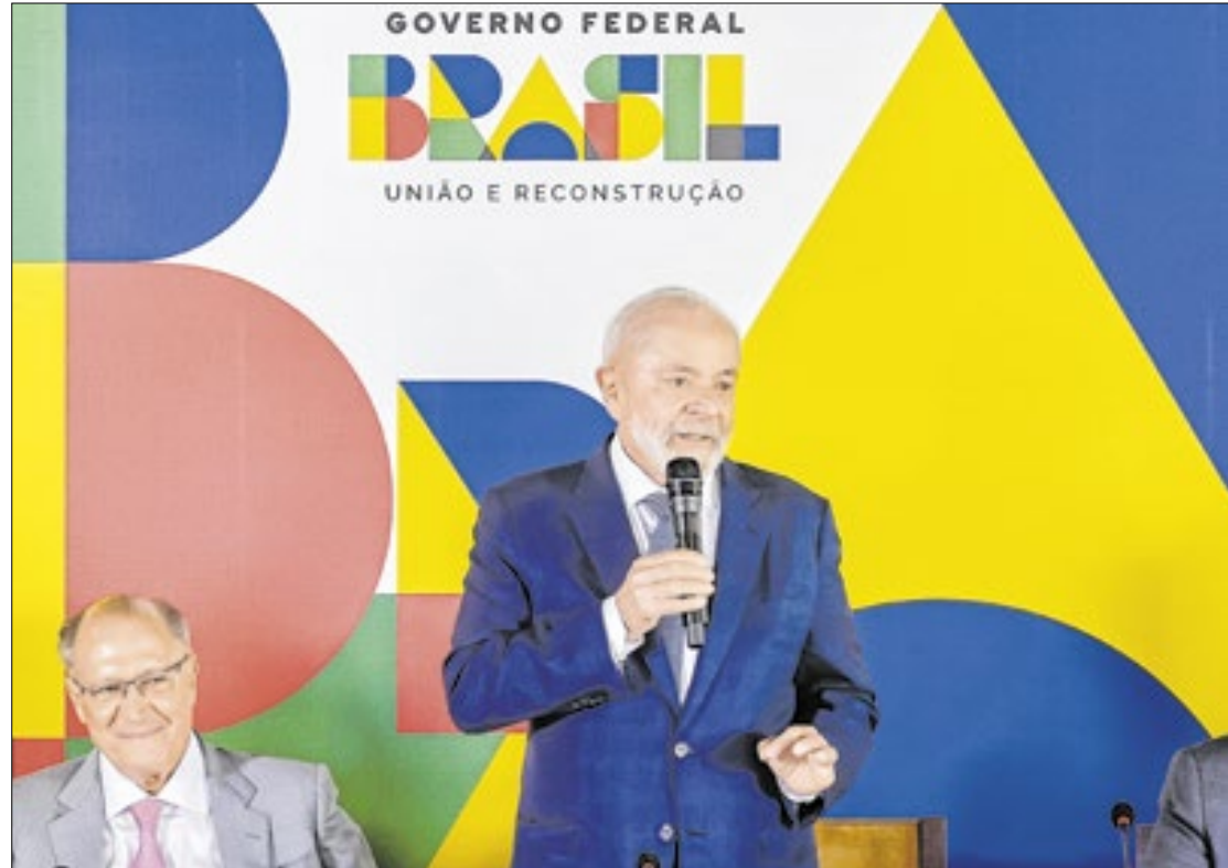
Lula aos ministros: "Não temos o direito de falhar"

Apesar de não ter que citado nomes, o recado foi claramente direcionado ao ministro da Fazenda, Fernando Haddad, já que a polêmica da portaria do Pix foi no seu ministério, mais especificamente na Receita Federal. Na última