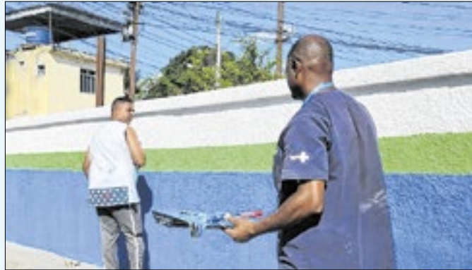
Ao todo, serão 15 dias para a entrega dos serviços