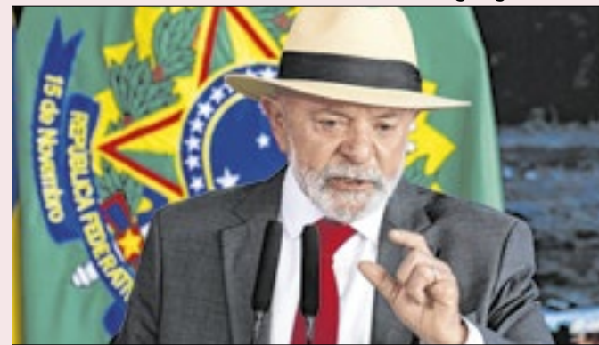
Pressionado, Lula voltou atrás em medida