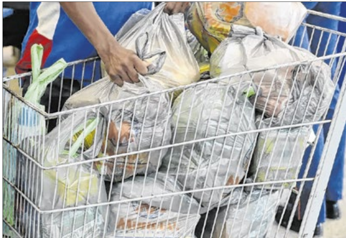
Rio ostenta o título, nada invejável, de campeão da carestia de produtos essenciais