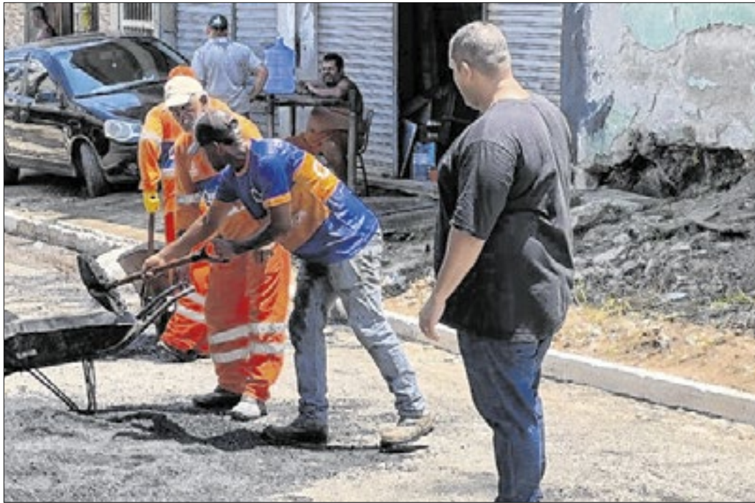
Mutirão foi realizado no bairro da Pedreira