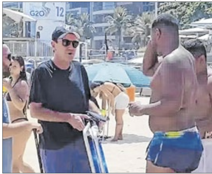
Prefeito com os banhistas: em defesa da civilidade nas praias

Em vídeo postado pelo prefeito, também chamado de "Civilidade com Dudu", ele conversa com banhistas, de forma didática e bem-humorada, acentuando que o uso local das caixas de som acaba incomo-