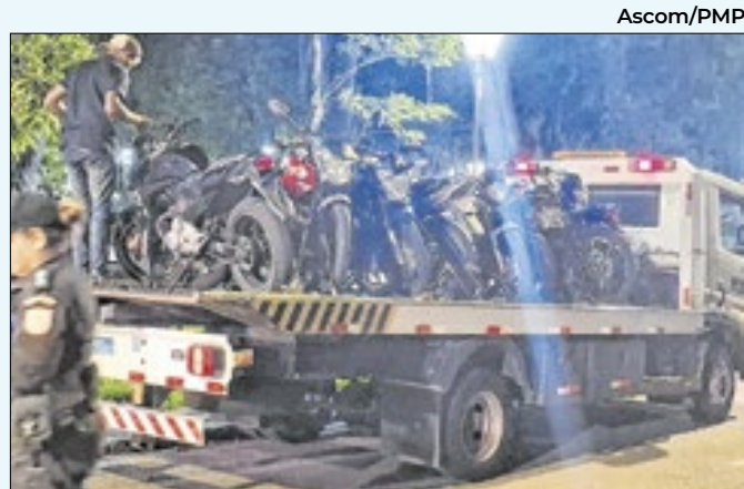
Ações foram realizadas durante o final de semana