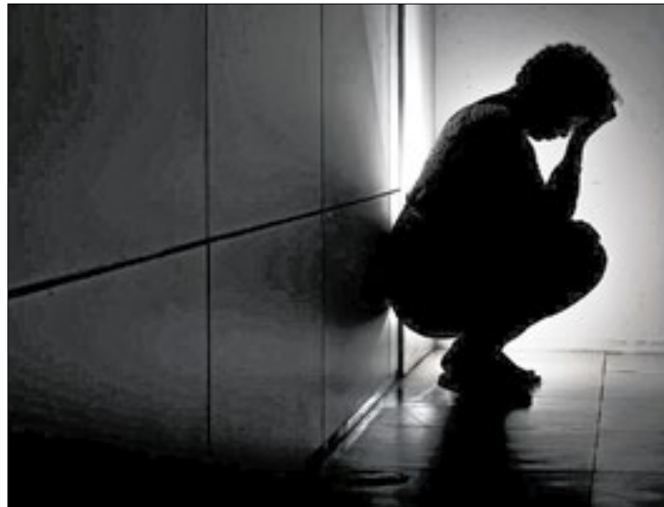
Ações fazem parte da campanha que visa a saúde mental

Em caso de crises e emergência, o atendimento de um psicólogo é fundamental. "Somos a todo momento ensinados a cuidar do nosso corpo, mas não do que está dentro de nós e que muitas vezes não sabemos como colocar em palavras. Gosto de