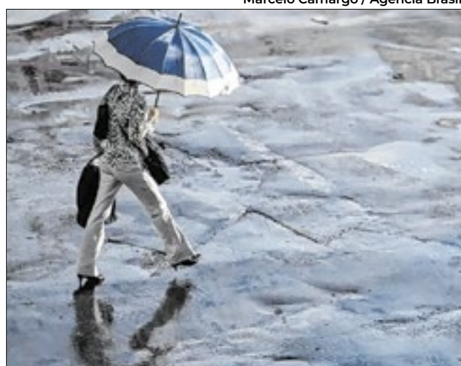
Marcelo Camargo / Agência Brasil

Os destaques vão para os Estados da Bahia e Ceará