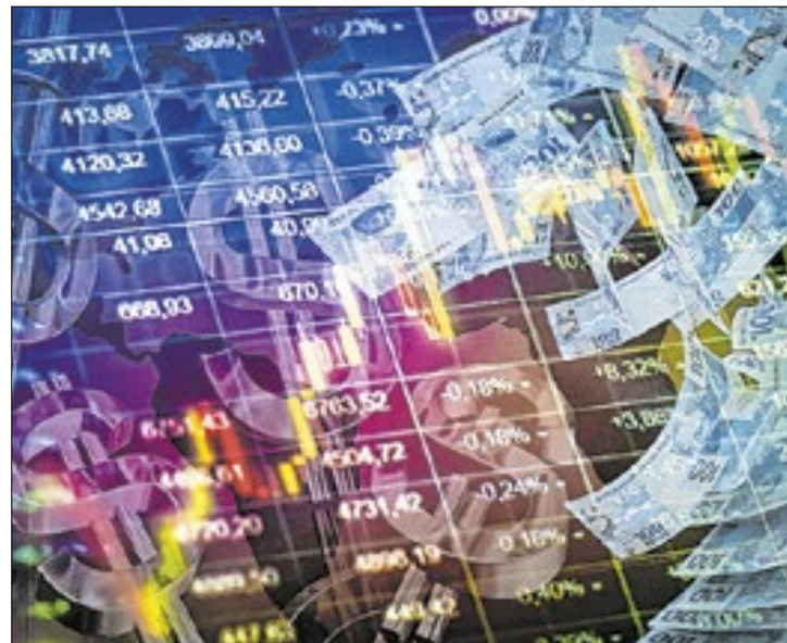
Revogação de portaria do Pix e exterior favoreceram alta

Do meio para o fim da tarde, o Ibovespa sustentou renovações de máximas, que o colocaram no intradia no maior nível dede 18 de dezembro,