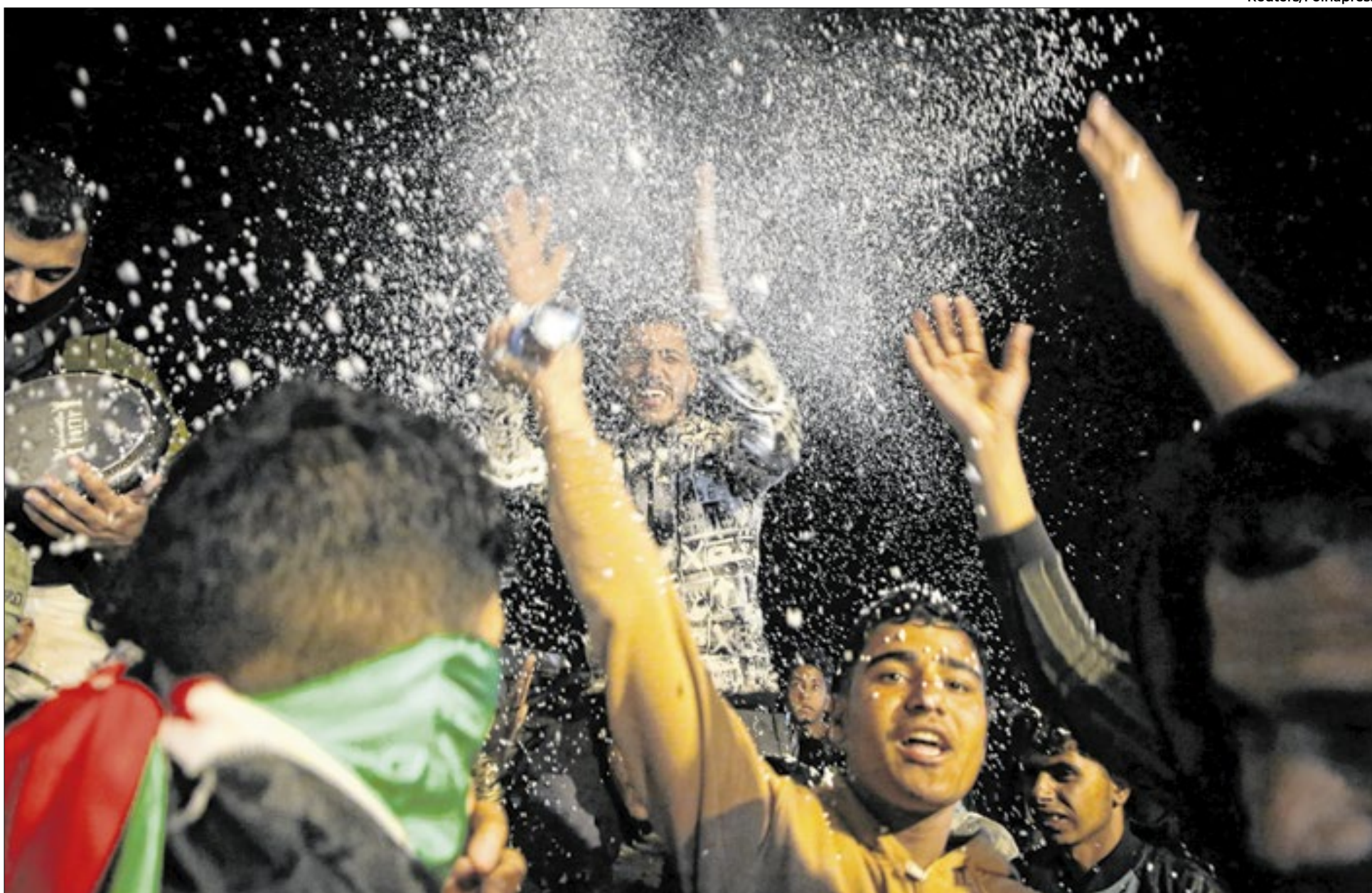
Palestinos reagem às notícias sobre um acordo de cessar-fogo com Israel