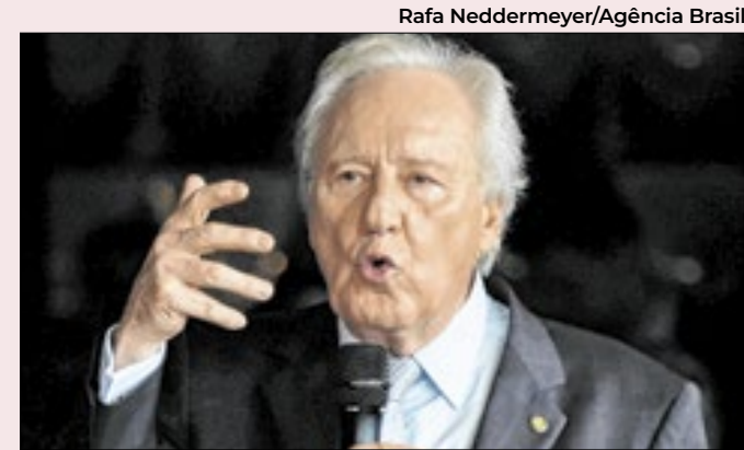
Ministro apresentou alterações nesta quarta-feira

A empresa respondeu a instituição brasileira no limite do prazo determinado. Em resposta, a Meta informou as todas as alterações já estão valendo nos Estados Unidos, mas no Brasil o que está valendo são as mudanças na Política de Conduta de Ódio – portanto, à priori, as agências de checagem seguem atuando no Brasil e nos demais países.