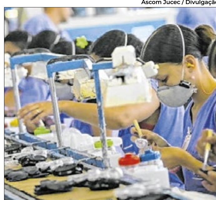
O ano de 2024 foi promissor para o empreendedorismo