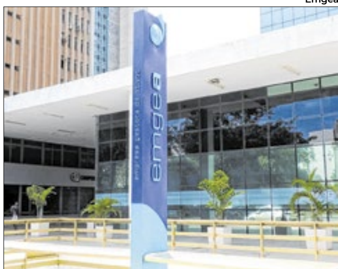
Emgea reconhece falhas de comunicação