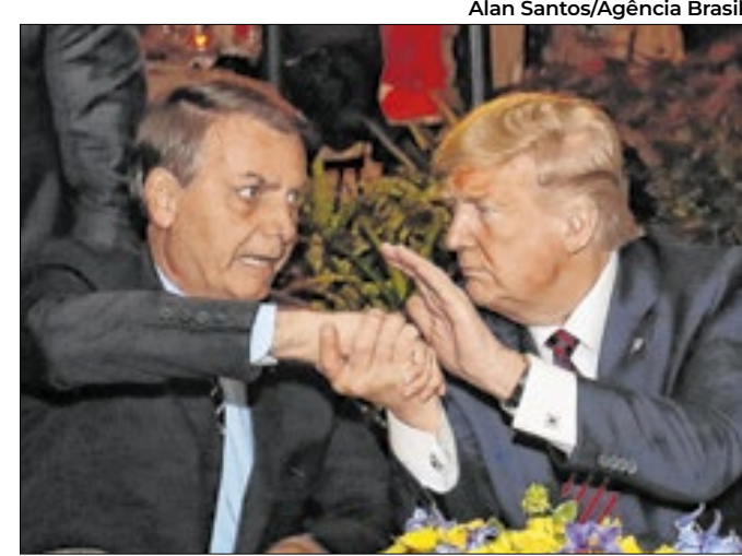
Ex-presidente solicitou liberação para estar presente