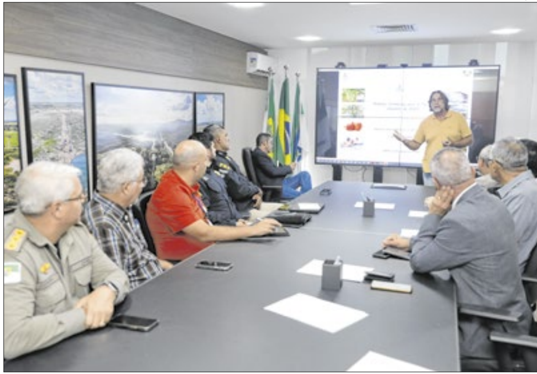
Reunião do Comitê Monitoramento das chuvas

Em relação aos impactos das chuvas em Natal, as autoridades informaram que não houve ocorrências graves. Os problemas registrados foram