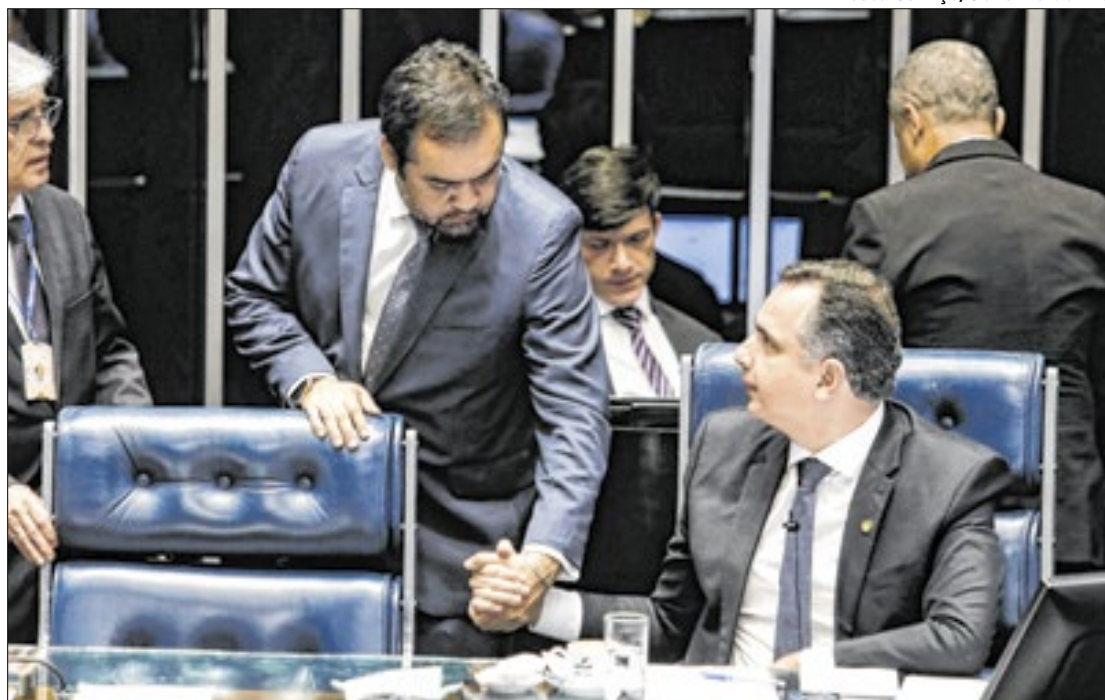
Castro negociou com Pacheco a tramitação do Propag

O chefe do Executivo mineiro afirmou que está articulando a ação conjunta com os demais governadores. “Estamos nos mobilizando com os governadores. Vamos a Brasília para conversar sobre os vetos”, afirmou.