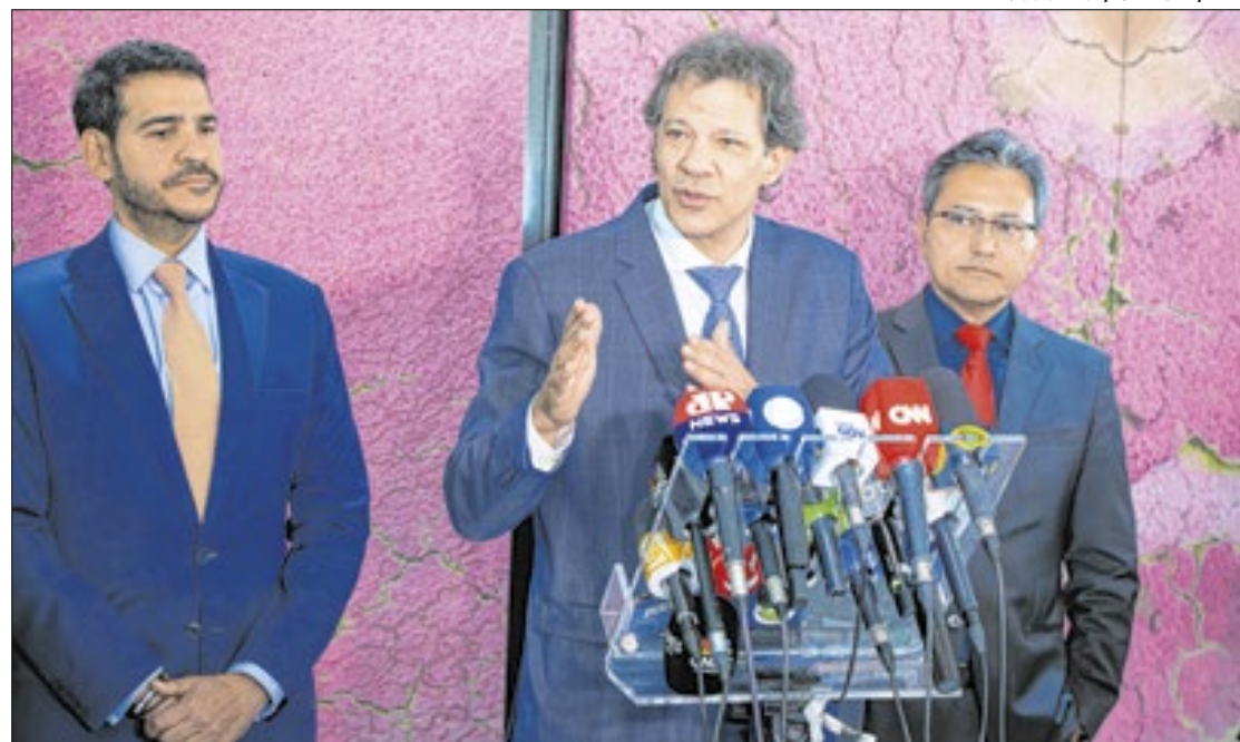
João Risi / SEAUD / PR

Todo esse embate gerou-se após a Receita Federal divulgar um ato normativo que ampliava a