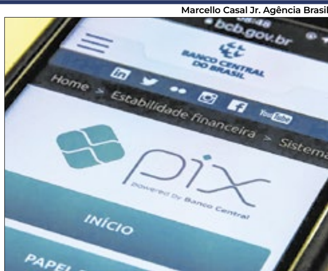
Proliferação de ‘fake news’ induziu revogação de ato

O núcleo da inflação ao consumidor americano ficou pouco menor ao esperado e a queda do índice de atividade industrial Empire State, que mede as condições da manufatura no Estado de Nova York, foi bem pior do que a esperada, ampliando as apostas de corte de juros pelo Federal Reserve em 2025.