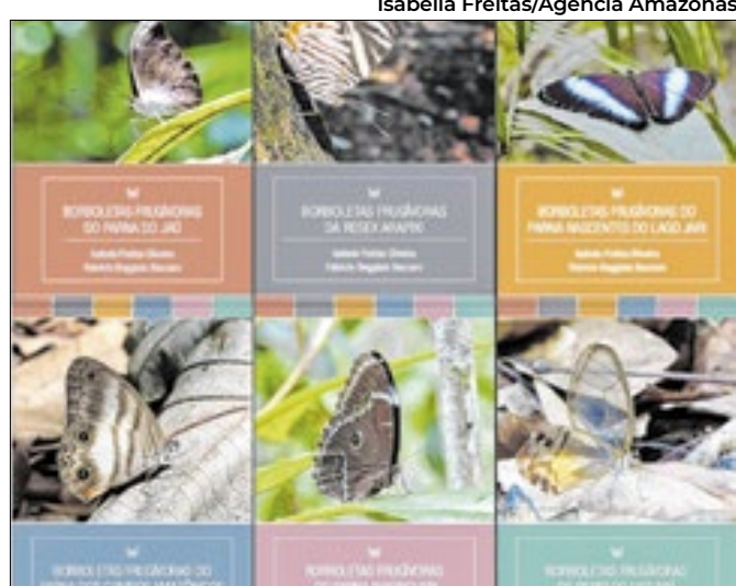
Projeto reúne espécies que consomem frutos no bioma