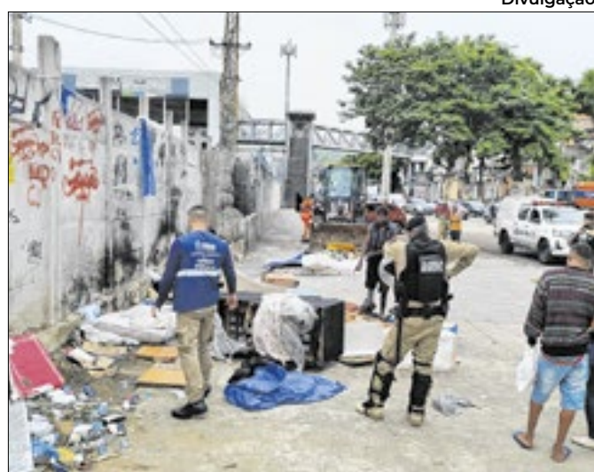
Seop desmontou casebres em situação de insalubridade