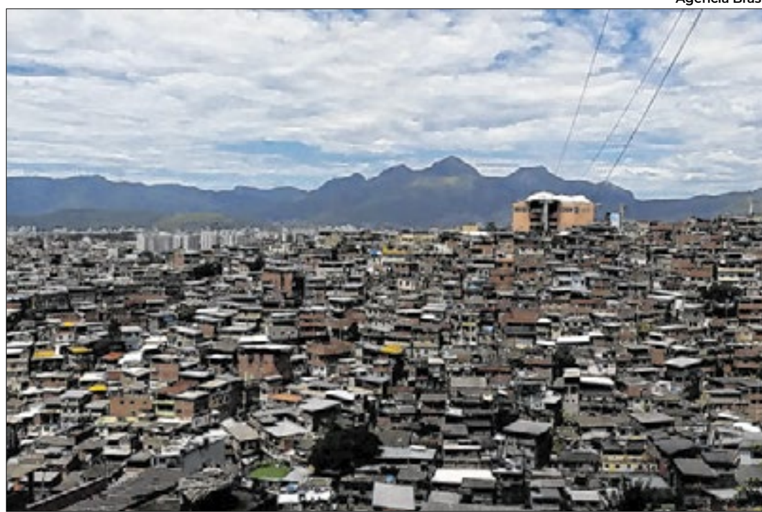
Polícia do Rio combateu caixinha da facção criminosa conhecida como Comando Vermelho

Objetivo era prender 14 suspeitos de lavagem de dinheiro do tráfico