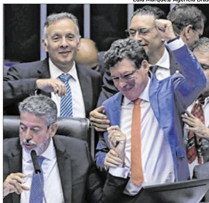
Projeto foi aprovado no Congresso no final do ano passado

Na quarta-feira (15), integrantes do governo se reuniram para ajustar os últimos detalhes do texto. O ministro da Fazenda, Fernando Haddad, explicou que o encontro, que teve como foco a apresentação dos vetos ao presidente, se estendeu devido a "questões técnicas e pontuais". O vice-presidente e ministro do Desenvolvimento, Indústria, Comércio e Serviços, Geraldo Alck-