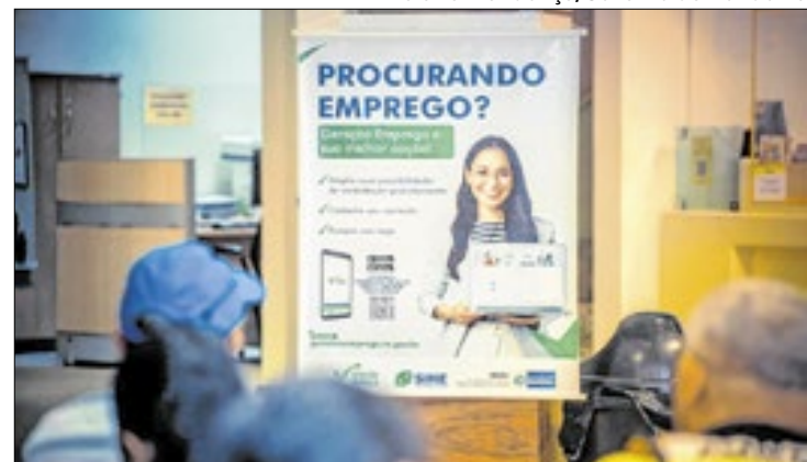
Empregos formais e cursos são destaques no plano estadual