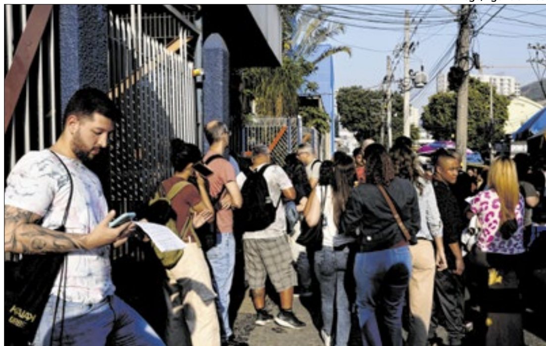
Os cursos de formação estão previstos para aprovados nos blocos 1 a 7

A convocação para os cursos são para os candidatos aprovados nos cargos de Especialista em Políticas Públicas e Gestão Governamental (EPPGG); Analista de Comércio Exterior (ACE); Analista em Tecnologia da Informação (ATI); Analista Técnico de Políticas Sociais (ATPS); Analista de Infraestrutura (AIE); Especialista em Regulação de Serviços Públicos de Energia (Anel); Especialista em Regulação de Serviços de Transportes Aqua-