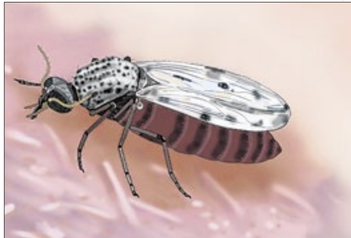
Ilustração mostra o maruim ou mosquito-pólvora

Também havia o problema de algumas das imagens, mesmo que usadas corretamente, não serem efetivamente representativas, pois haviam sido obtidas com fotos de baixa resolução, dado tamanho minúsculo do inseto. A título de comparação, o Culicoides paraensis mede até 3 milímetros, sendo cerca de 12 vezes menor do que o mosquito transmissor da dengue e 20 vezes menor do que o Culex quinquefasciatus , que é o per-