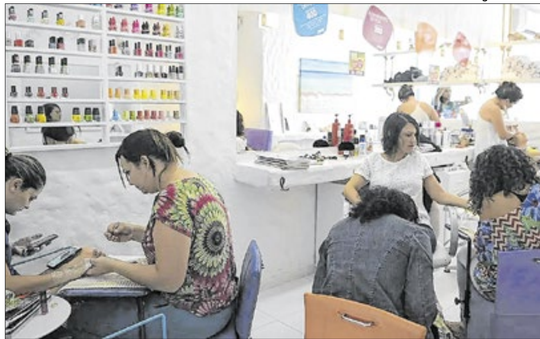
Queda de serviços pode refletir 'tração' da economia por avanço da Selic