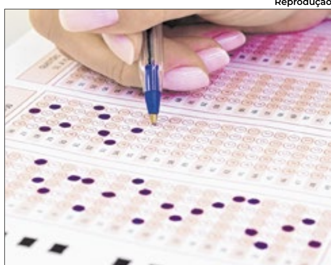
Prazo de contestação é esta quinta