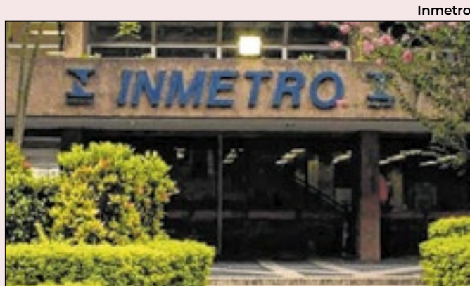
Inmetro tentou desqualificar coluna

Dois dias depois da publicação, surgiu uma assessoria de comunicação na Emgea. Que reconheceu ser um erro não haver no site nenhum número de contato. Disse que ele está sendo reformulado. Mas que já trabalharia nesta quarta-feira (15) para incluir os contatos.