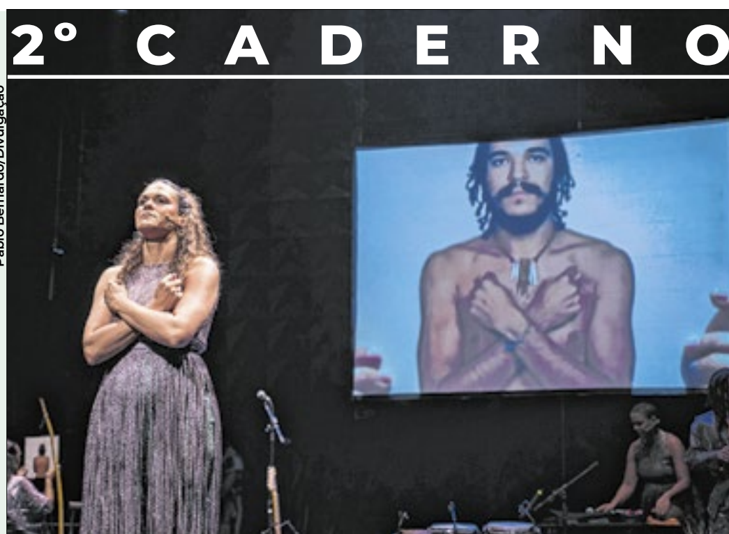
O multifacetado Marku Ribas tem sua trajetória revista em musical