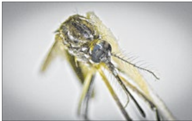
Casos de dengue explodiram em Volta Redonda