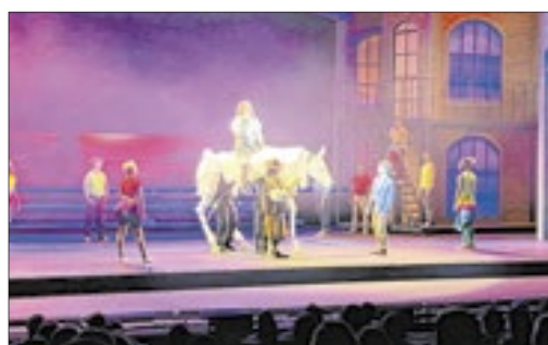
Musical é um encanto para o público