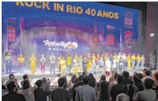
O elenco super talentoso arrancou aplausos

ao gênese do musical, o espetáculo é uma homenagem ao Rio e o amor de Medina pela cidade. Programação imperdível e em curta temporada. Vale muito assistir e se emocionar.