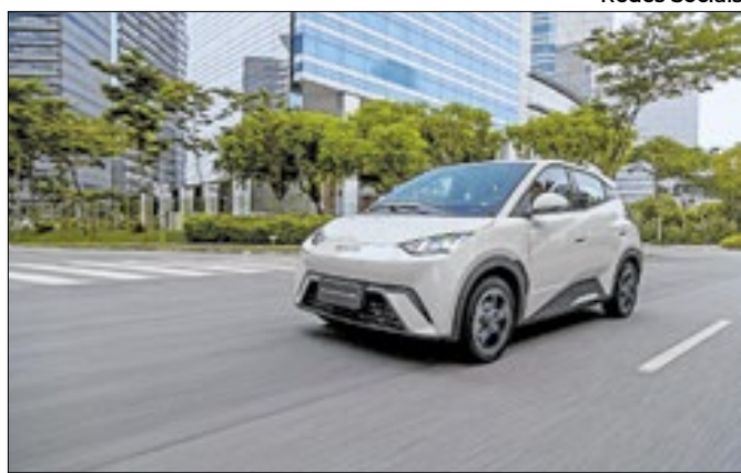
Concessionária vai se instalar em Barra Mansa