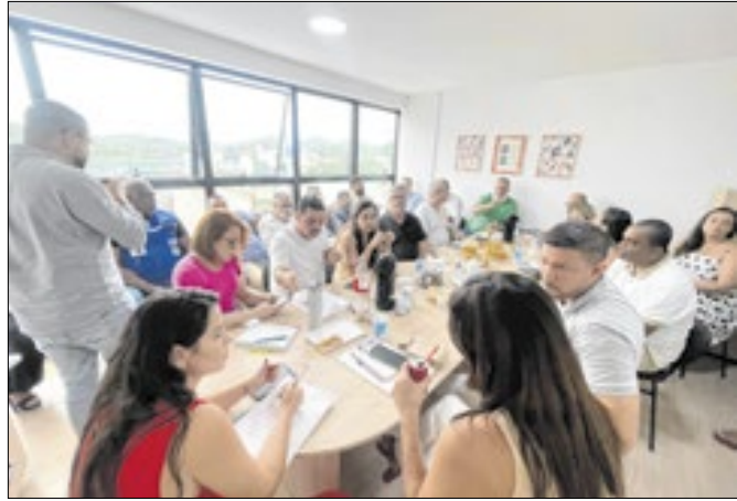
Reunião de secretários municipais em Magé