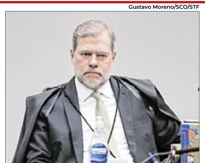
Dias Toffoli quer ampliar a responsabilidade das redes