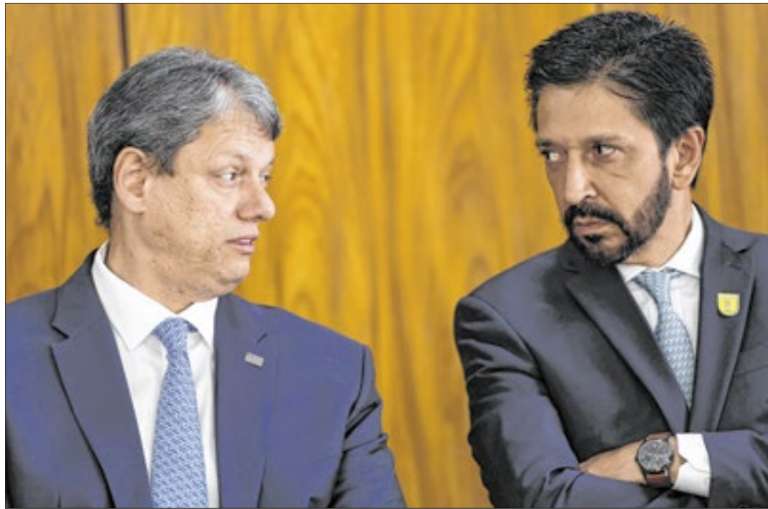
Se Tarcísio for para presidente, Nunes mira governo