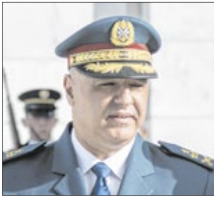
Joseph Aoun assume o Líbano