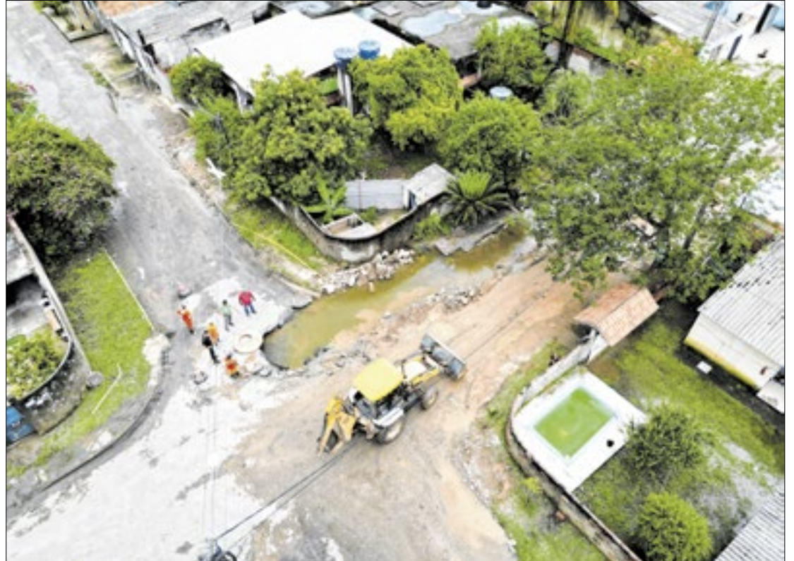
Intenso volume de água causou danos significativos na região

Na manhã desta quinta-feira, dia 9 de janeiro, a Secretaria de Obras e Infraestrutura de Guapimirim deu continuidade às obras de recuperação no bairro Jardim Guapimirim, em decorrência da forte chuva que atingiu a cidade na tarde do dia anterior, 8 de janeiro. O intenso volume de água causou danos significativos na região, especialmente na rede de drenagem, o que motivou a rápida mobilização da prefeitura para minimizar os impactos e restaurar as condições de segurança e conforto para os moradores. É a primeira vez que o bairro sofre alagamentos.