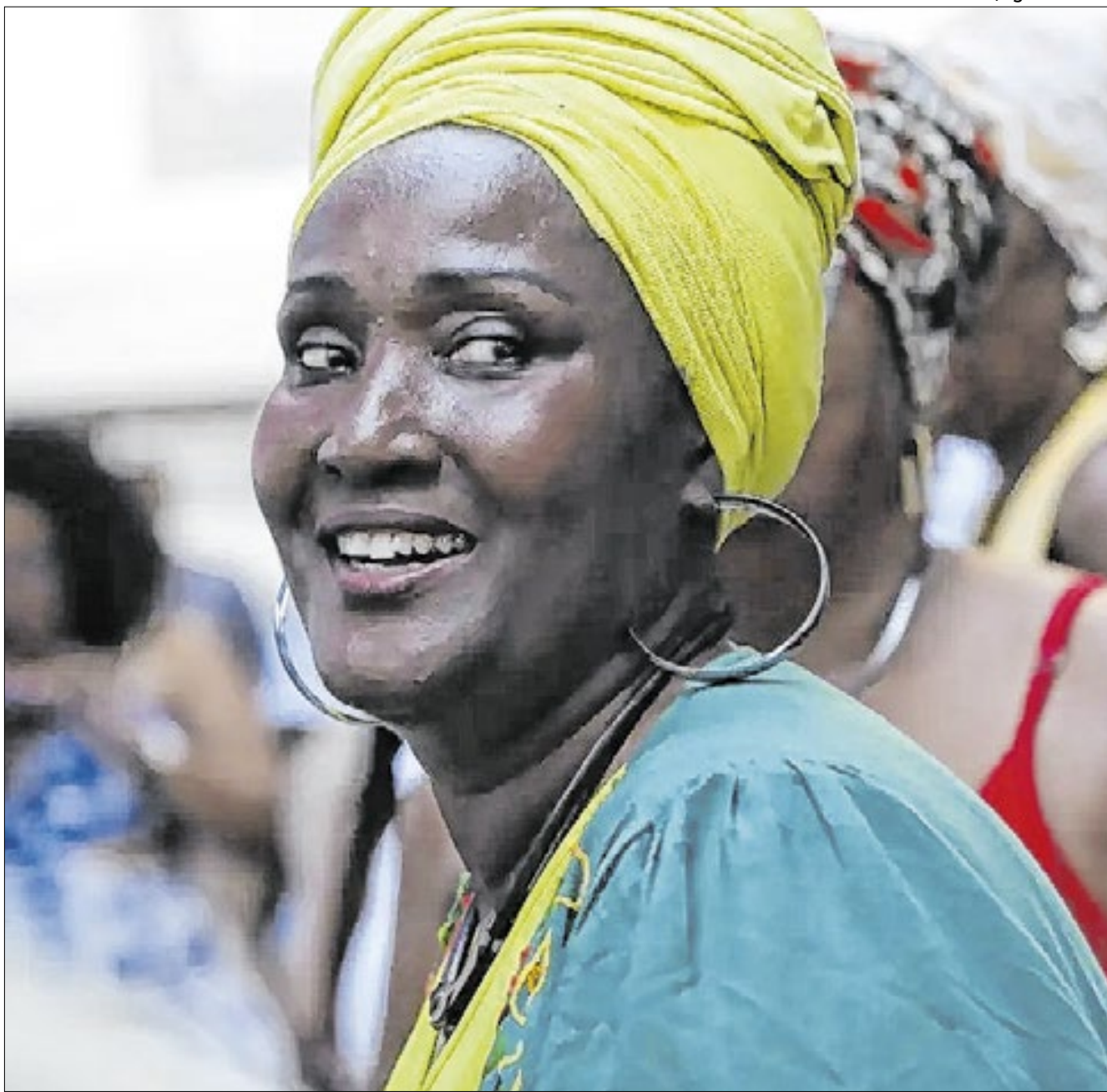
Pesquisadoras defendem que a legislação e a aplicação precisam ser aperfeiçoadas