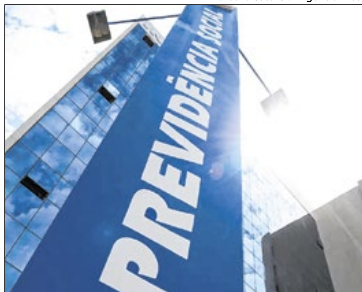
Aumento do teto do consignado acompanha alta da Selic

O Conselho Nacional de Previdência Social (CNPS) decidiu aumentar o teto das taxas de juros dos empréstimos consignados para beneficiários do INSS nesta quinta-feira (9). Agora, o limite para empréstimo com desconto em folha passa a ser de 1,80% ao mês. Antes estava em 1,66%. Já para as operações na modalidade de cartão de crédito e cartão consignado de benefício, não houve mudança e o índice máximo se manteve em 2,46% ao mês.