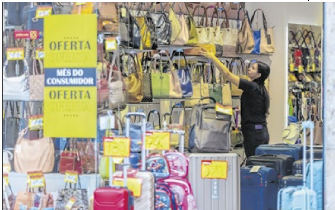
Retração de móveis e eletrodomésticos determinou recuo das vendas do varejo