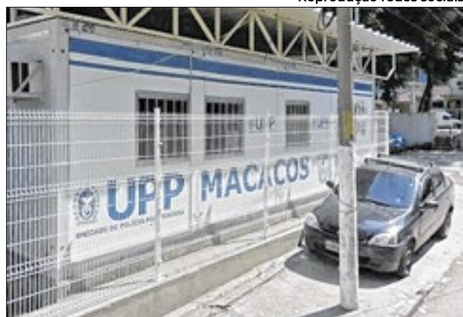
Troca de comando da unidade da PM pode ser estratégica