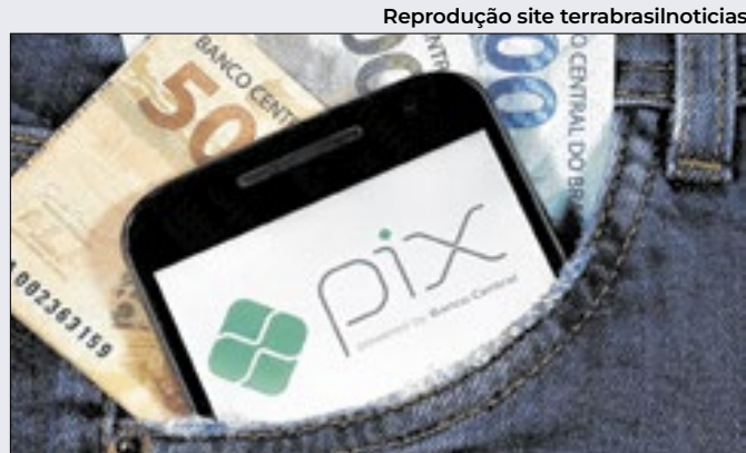
Fisco se apressa a desfazer boato de tributação do Pix