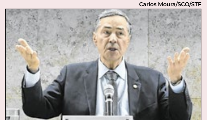
Presidente do STF mantém casos de ordem judicial

Dias Toffoli listou 11 casos — entre eles, estímulo ao terrorismo, violência contra mulheres, mentiras relacionadas ao processo eleitoral — em que as plataformas seriam obrigadas a retirar conteúdos ao receberem notificações extra-judiciais, ou seja, feitas por cidadãos.