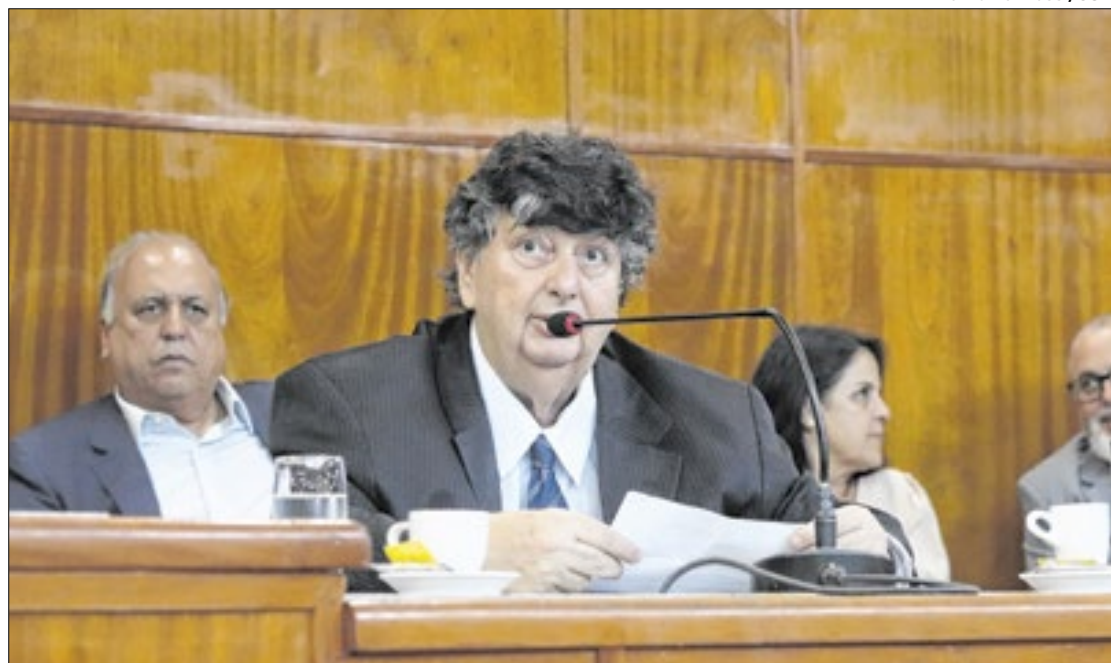
Prefeito Neto afirma que nenhum servidor receberá salário inferior a R$ 2 mil

Sobre o aumento salarial, o município irá seguir o índice da inflação. Na rasteira das novidades, Neto também disse que todo funcionário público será obrigado a registrar o ponto e cumprir horário: "Aqueles que não registrarem o ponto terão o desconto no pagamento no fim do mês", disse o prefeito.