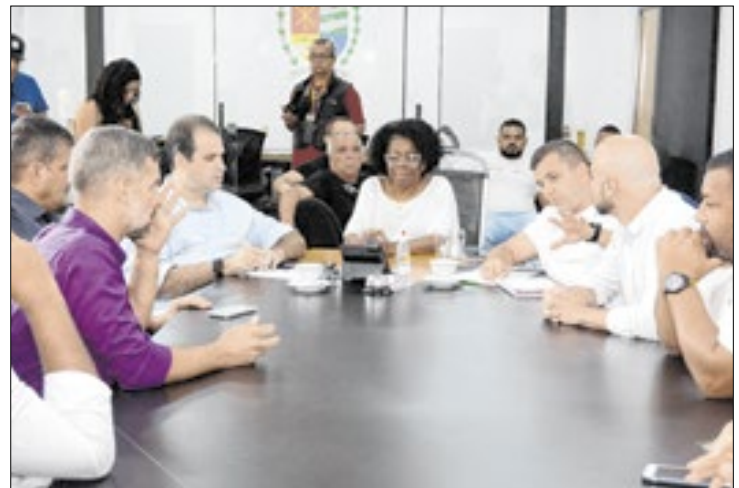
Investimentos vão para Pátio de Manobras, ETA e outros