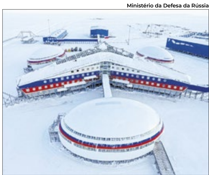
Rússia quer preservar a atmosfera de paz na zona ártica

De quebra, o Ártico há muito é prioridade nacional russa, não menos por ser o caminho mais curto para um