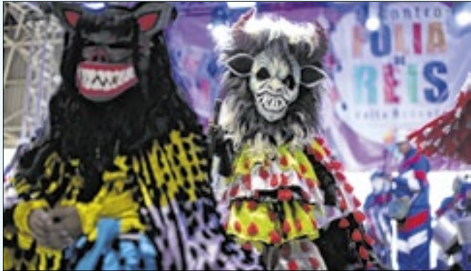
Em V. Redonda, 20 grupos se apresentam no sábado