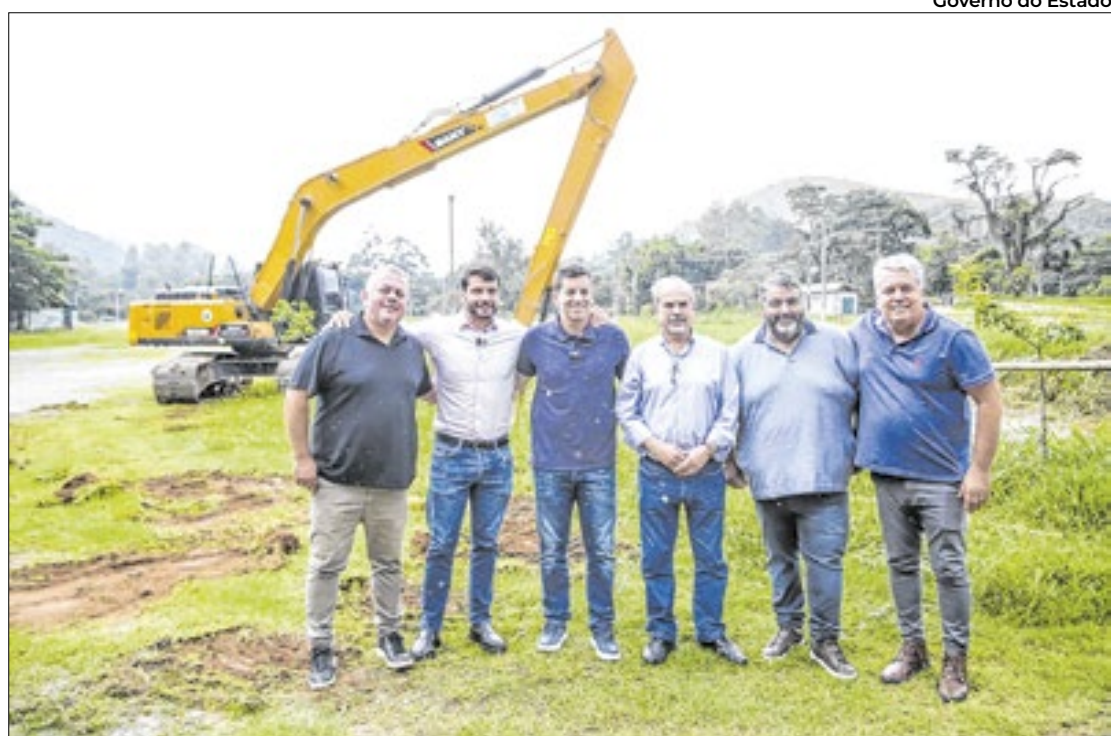
Desassoreamento de rios e lagos está em andamento em quatro localidades da cidade

“É uma boa notícia para os petropolitanos. Esse apoio