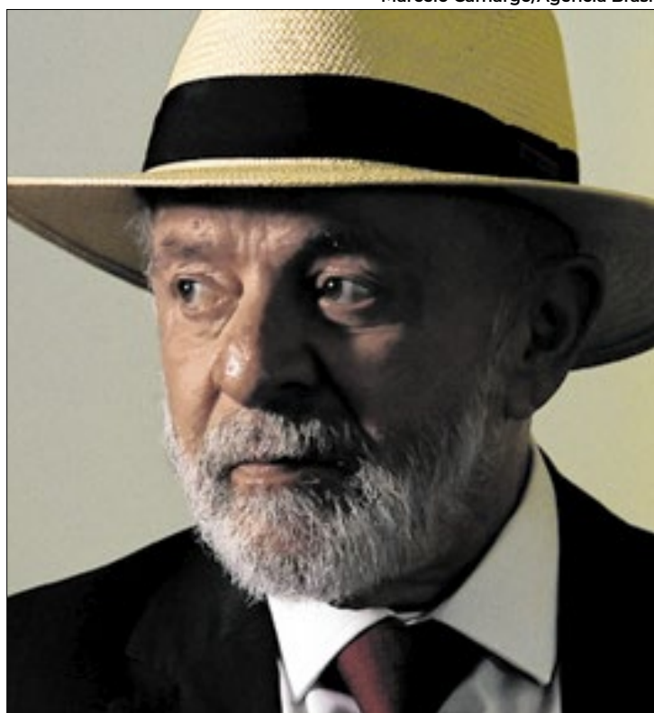
Associações criticaram o veto feito por Lula

Outro ponto do projeto que foi vetado aumentava em 60 dias o direito à licença-maternidade e ao salário-mater-