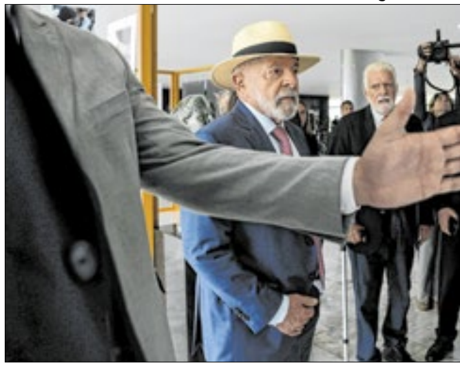
Falta de clareza na estratégia é maior problema