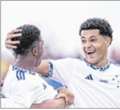
Raposa está na segunda fase