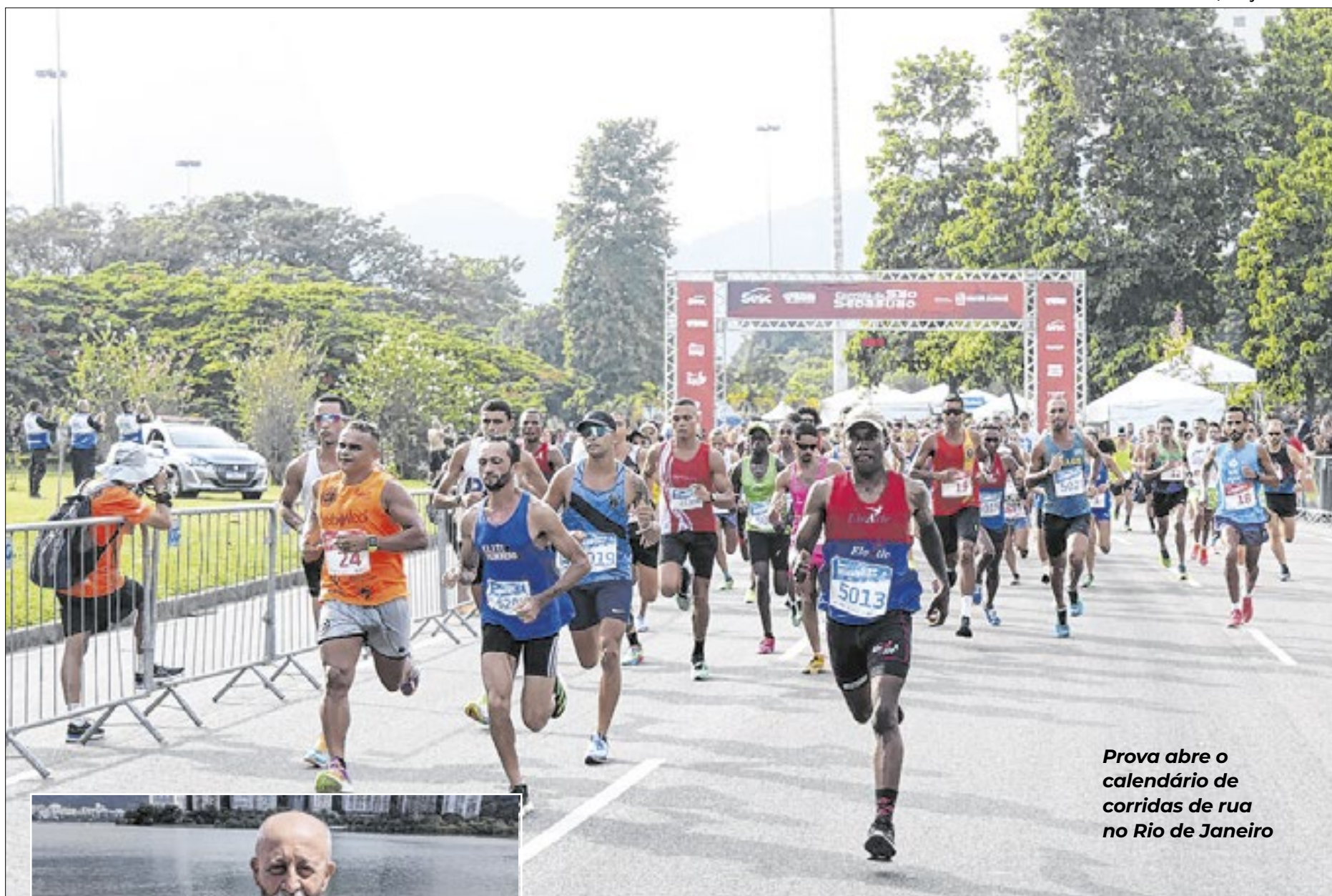
Prova abre o calendário de corridas de rua no Rio de Janeiro

“O evento possui vários elementos que o tornam especial e muito querido pelos corredores, celebra a história e a cultura da Corrida de Rua no Rio de Janeiro, reunindo atletas, moradores e turistas em um evento de grande importância para a cidade. A prova abre o calendário esportivo de eventos na cidade, e