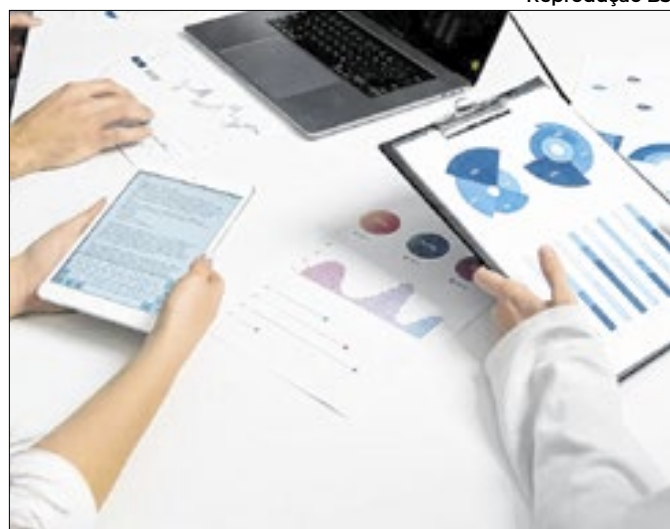
Alta dos juros contribuiu para elevar demanda de títulos

Apesar da retração, setor avançou 5% no ano e 4,6% em 12 meses