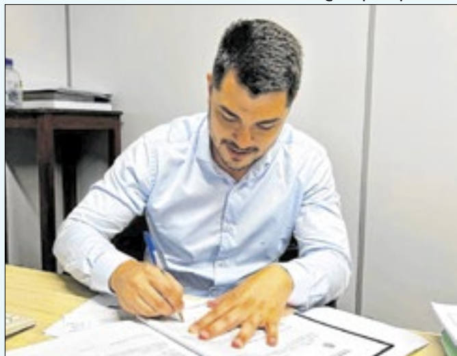
Assinatura dos documentos foi realizada nesta quinta (09)