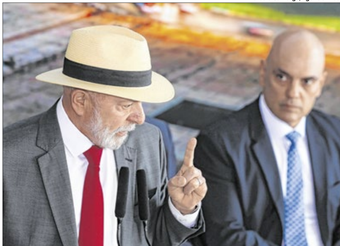
Executivo e Judiciário demonstraram preocupação

Porém, em uma nota conjunta dos checadores de fatos pelo mundo a Mark Zuckerberg, divulgada nesta quinta-feira, eles esclarecem que a própria Meta nunca concedeu aos checadores “a capacidade ou a autoridade para remover conteúdos ou contas” de usuários. “A realidade é que a equipe da Meta decidia como e se os conteúdos apontados como falsos pelos verificadores deveriam ser removidos, freados ou rotulados. Vários checadores, ao longo dos anos, sugeriram à Meta melhorias nes-