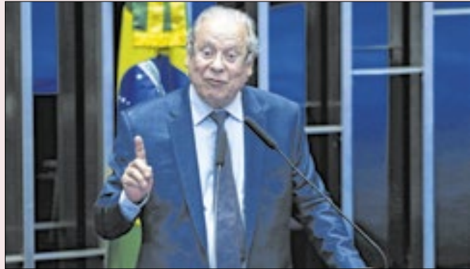
Nomes como Dirceu conseguiam confrontar Lula