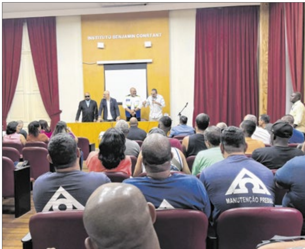
A novidade será realizada por meio do projeto “Florescer pelo Esporte”, iniciativa da Suderj

“Essa ação reafirma o compromisso do Governo do Estado com a inclusão e o incentivo à prática esportiva, reforçando a importância do