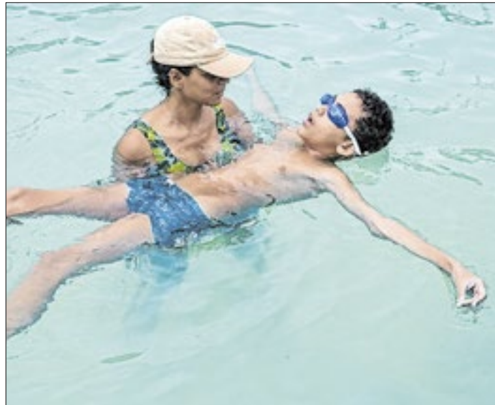
Aulas para pessoas atípicas em Magé

Visando oferecer um maior contato com o esporte e de forma acessível, a Prefeitura de Magé através da Secretaria de Esporte, Lazer e Terceira Idade disponibiliza aulas gratuitas de modalidades esportivas para crianças e adolescentes atípicos. Dentre as modalidades estão: natação, futebol, karatê, capoeira e vôlei.