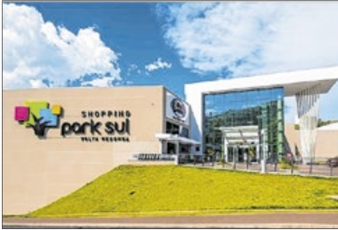
Cinema do Park Sul estreia dois filmes nesta quinta (14)