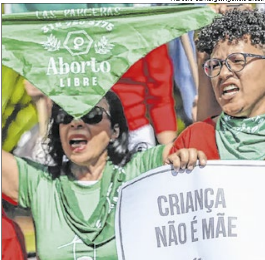
Norma do conselho prevê acesso rápido para interrupção de gestação

A norma também define diretrizes para a prevenção da violência sexual na infância, inclusive com o direito à educação sexual, e indica os