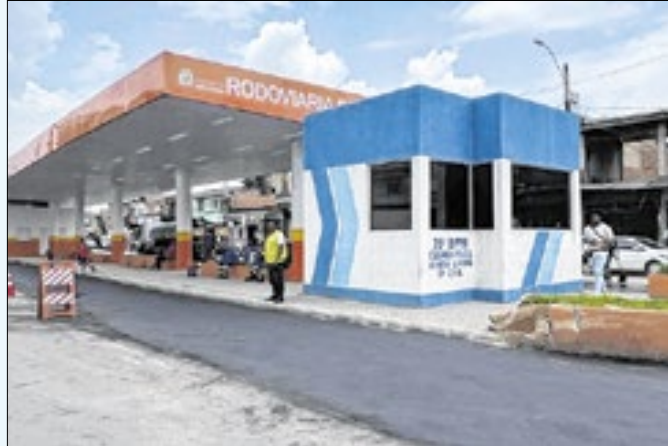
Rodoviária de Nova Aurora, em Belford Roxo