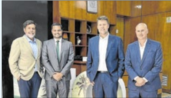
Encontro aconteceu nesta quarta-feira (08) no Rio