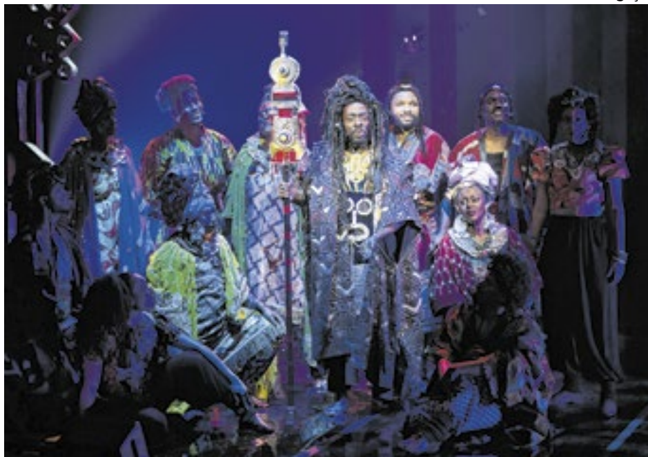
Martinho, Coração de Rei - O Musical