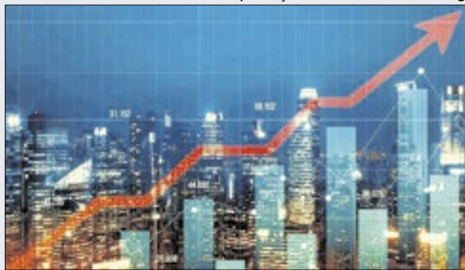
Índice superou em quase 50% IPCA do ano passado