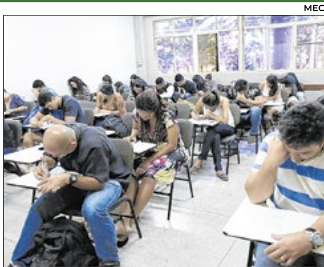
No exterior, exames foram aplicados em 17 cidades