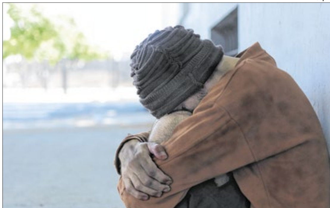
Cada denúncia pode resultar em mais de tipo de violação.

A maioria das vítimas das denúncias é do gênero feminino (372,3 mil), pessoas brancas (261,6 mil), e com idade entre 70 e 74 anos (32,5 mil). Na maioria dos casos, as violações ocorreram na casa da própria vítima e/ou do suspeito (301,4 mil). Entre os grupos mais vulneráveis estão crianças e adolescentes (289,4 mil), pessoas idosas (179,6 mil) e mulheres (111,6 mil).