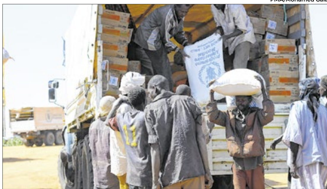
Ocha considera catastrófica a situação em El Fasher