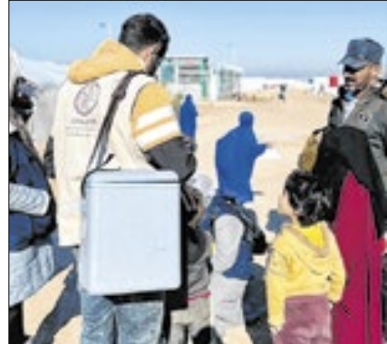
Vacinação contra cólera

Nesta segunda (6), a Organização Mundial da Saúde, OMS, entregou o primeiro carregamento de emergência do ano para a Síria. O voo chegou ao Aeroporto Internacional de Damasco a partir do